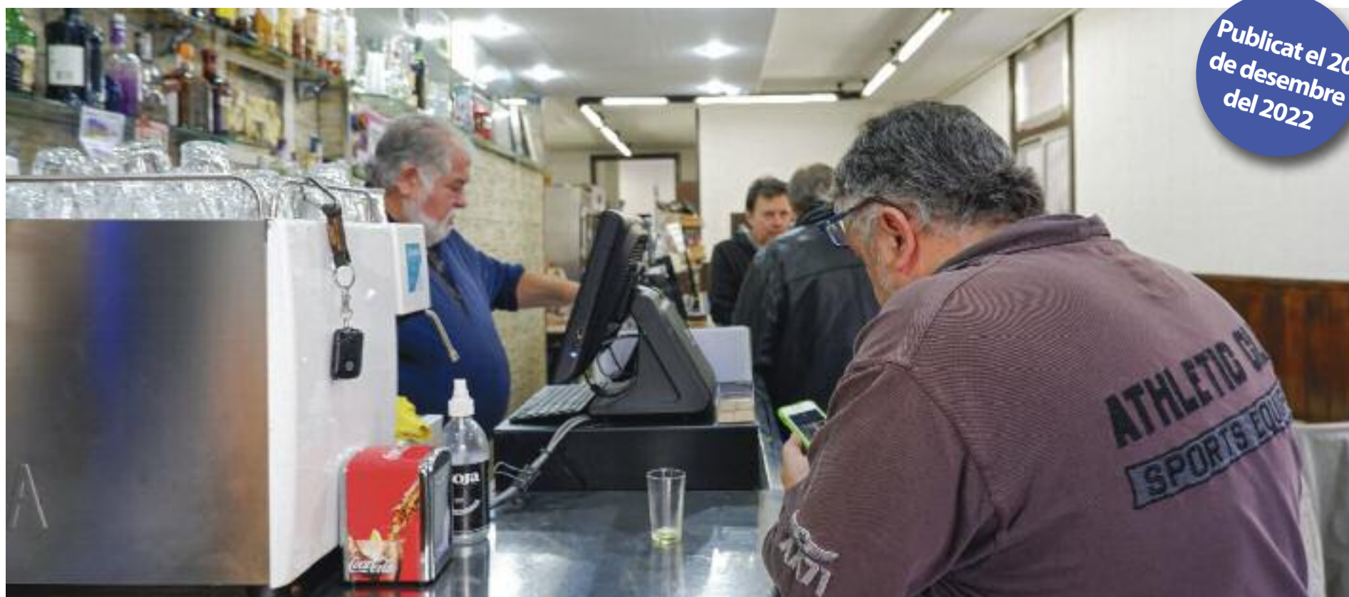
L'interior del bar La cuina del papi, al Camp de l'Arpa.