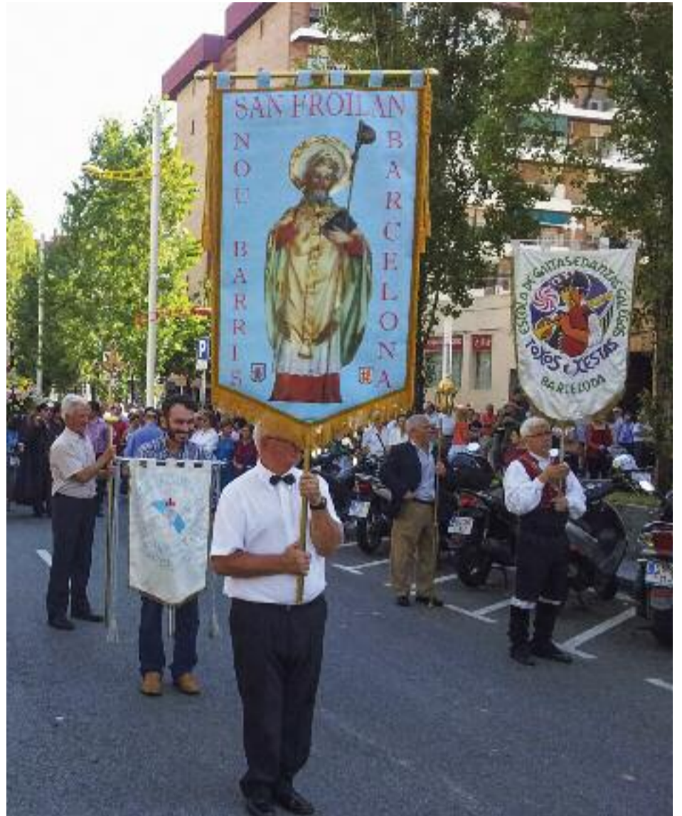
La celebració de San Froilán és una de les més esperades d'arreu del districte.