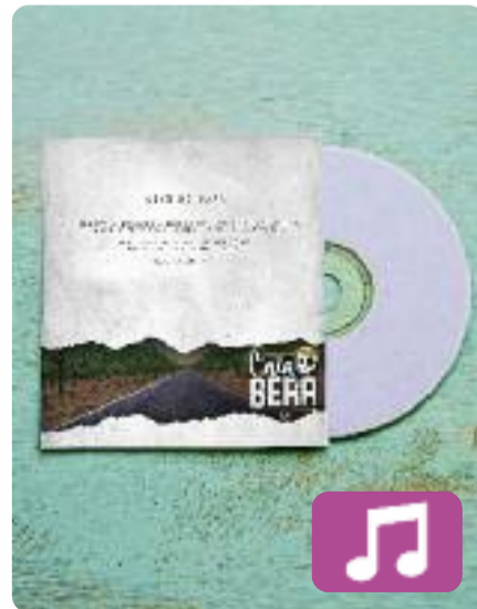
Això no para Cala Bera

El grup de "rap combatiu" (així es defineixen) Cala Bera ha publicat aquest mes de juliol el seu segon àlbum de llarga durada. Dos anys després de Volum 1 (Flufi Records, 2020), els del Penedès tornen amb Això no para (Flufi Records, 2022), un disc que recull set cançons en català. Entre aquests nous temes destaca una col·laboració amb el DJ Plan B: Lliçons .