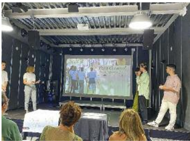
Un moment del procés de treball.