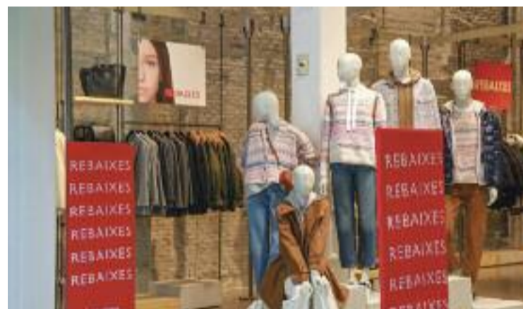
Les rebaixes van començar el passat 1 de juliol.