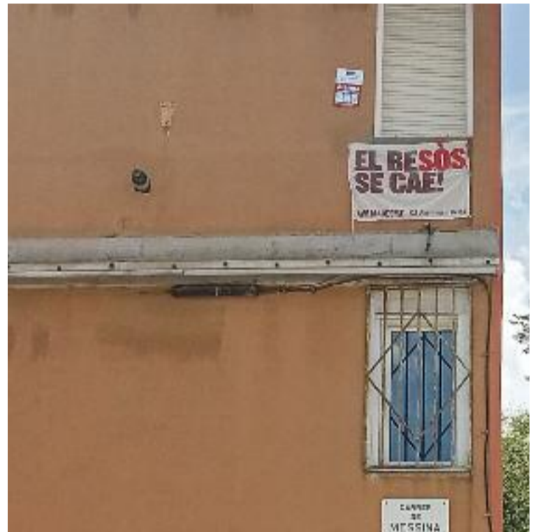
El barri del Besòs i el Maresme és un dels llocs de la ciutat on hi ha pisos amb més mal estat.

edificis; hem de tenir la política de refer-los”, va assenyalar.