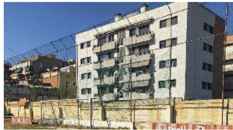
Els joves van ser desallotjats fa un mes.

D'altra banda, dos dies després, el passat 14 de juliol, la sala de Plens va ser escenari d'una altra escena cridanera. Tots els grups de l'oposició van abandonar-la per denunciar, segons van dir, la "manca de transparència del govern del Districte".