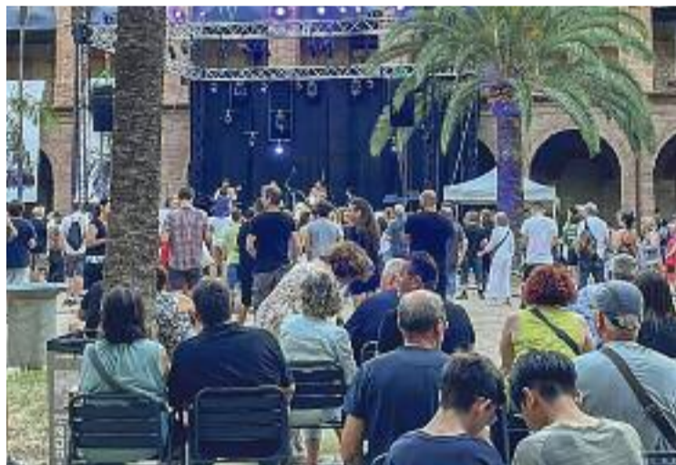
Un dels concerts de l'any passat.