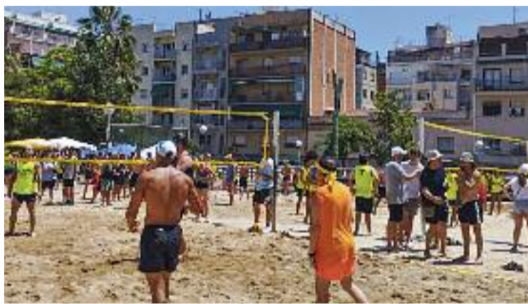
Hi ha 40 tones de sorra a la plaça.

La celebració d'aquest any és una de les més importants de la història de l'esdeveniment perquè és la primera que es fa sense restriccions des que va esclatar la pandèmia. L'any passat, per exemple, el campionat de vòlei es va haver de fer al poliesportiu de Valldaura i sense la presència del que és l'essència de la Prospe Beach: la sorra.