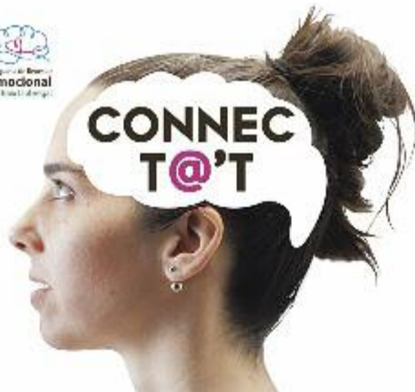
Cartell promocional de 'Connecta't'.

bades en cas que els propòsits pactats entre terapeuta i pacient hagin estat assolits.