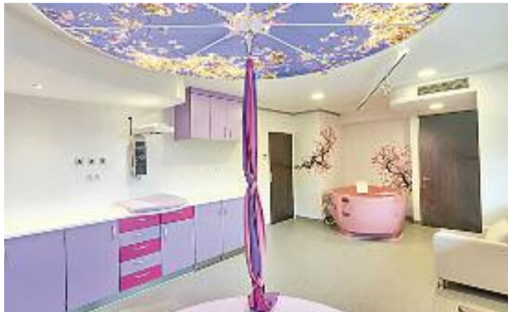
Centre de naixements tancat provisionalment.

També expliquen que s'han vist obligats al tancament provisional perquè, davant de la manca de llevadores, han hagut de prioritzar la sala de parts, que no es pot clausurar mai. Al centre de naixements, de fet, sempre hi havia d'haver dues llevadores i amb la situació actual de falta de personal no es podia assegurar el