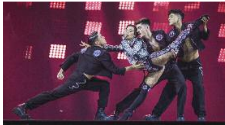
Chanel a la seva actuació a Eurovisió.