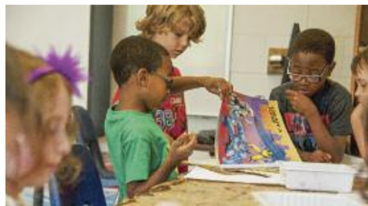
Infants en un taller de lectura i manualitats.

seu compromís perquè tots els veïns puguin gaudir del nou servei de telefonia mòbil sense problemes en el senyal de TDT. A més, s'han posat a disposició per qualsevol ciutadà que pateixi una incidència en qualsevol indret del municipi.