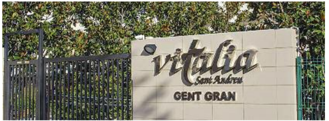
L'exterior de la residència Vitalia Sant Andreu.

De totes maneres, segons CCOO, la falta de personal també afecta la neteja i la infermeria, la qual cosa "fa que les gericultores hagin d'assumir tasques que no els corresponen i per a les quals no disposen de la titulació necessària", com pot ser l'administració de