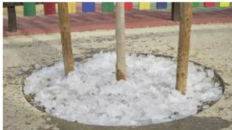
Gel reutilitzat en espais verds.

terès de la zona. L'horari de visites els dissabtes de portes obertes serà de les 11 h a les 18 h des del gener fins al maig i des de l'octubre fins al desembre. Des del juny fins al setembre, en canvi, s'ampliarà i serà de les 11 h a les 20 h.