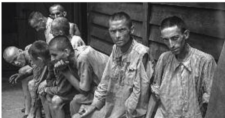
Presos alliberats del camp de Gusen.

La primera de les activitats és l'exposició Més enllà de Mauthausen del fotògraf català Francesc Boix, que durant la seva joventut va ser testimoni de la Guerra Civil, l'exili i la deportació al camp de concentració nazi de Mauthausen, d'on finalment es va alliberar. A la mostra es pot veure el seu arxiu fotogràfic com a reporter gràfic des de 1945 i fins al 1951, quan va morir als 30 anys. La seva fotografia estava compromesa amb la memòria col·lectiva i la dignitat dels re-