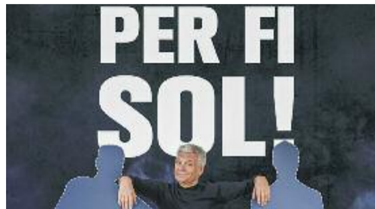
Cartell promocional de 'Per fi sol!'.

Els nous autobusos de la línia M3 entre l'estació d'Olesa i Esparreguera disposen de 37 seients, són accessibles i de càrrega nocturna, que es durà a terme a les cotxeres de l'empresa operadora, TGO DX. El trajecte entre les dues poblacions té una demanda de 44.000 viatges l'any.