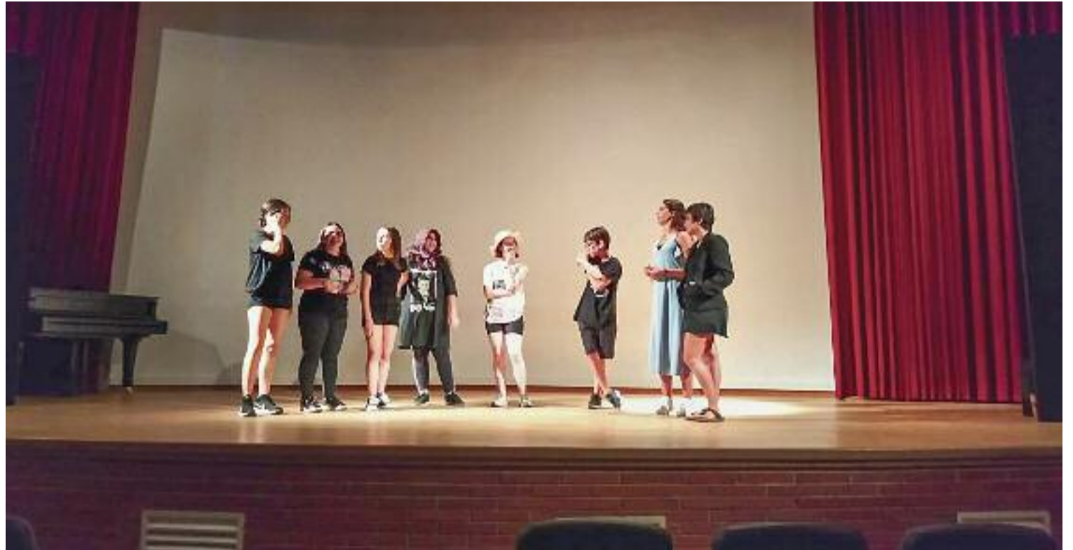
Membres de l'Aula de Teatre de Martorell, durant una representació.

Tot i que en el cas dels tallers a dins de les escoles el propòsit inicial és millorar una mancança concreta de la classe, el que és cert és que les arts escèniques