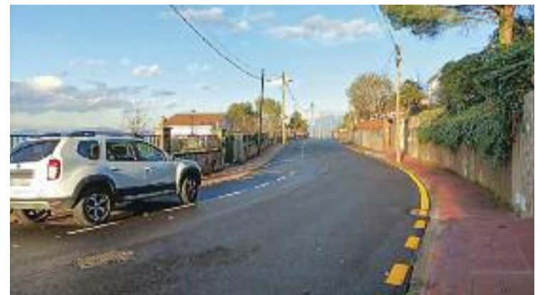
Carrer del Castell de Sant Jaume renovat.

A més, des dels Serveis Socials municipals també es poden fer derivacions de casos en cas que considerin adient i necessari que siguin atesos pel servei.