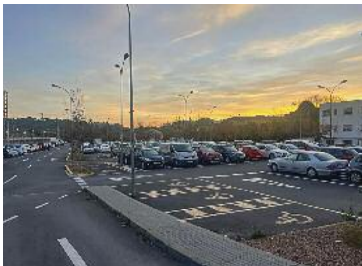
Pàrquing actual de l'estació de Renfe de Martorell.

els Park&Ride i els estacionaments comuns són els avantatges que ofereixen. Més enllà de ser útils com a aparcaments segurs, també s'hi poden trobar diversos serveis com ara flotes de cotxes i motos per compartir, lloguer d'automòbils i bicicletes, punts de recàrrega elèctrica, així com caixes de seguretat per guardar-hi vehicles de mobilitat personal o centres de petites reparacions.