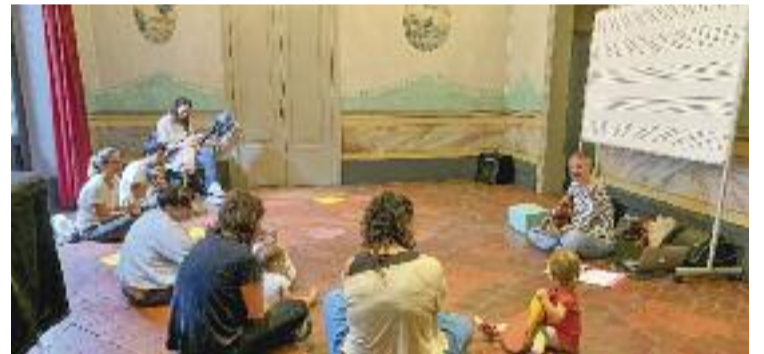
Taller de 'Música per nadons'.

CULTURA ▶ Fins al 3 de febrer es pot dur a terme la preinscripció per al taller 'Música per a nadons'. L'activitat va adreçada a infants des dels 9 mesos i fins als 3 anys acompanyats d'un adult de referència. Les sessions tindran lloc del 13 de febrer al 14 de juny, els dilluns, dimarts o dimecres de les 16 h a les 16.45 h.