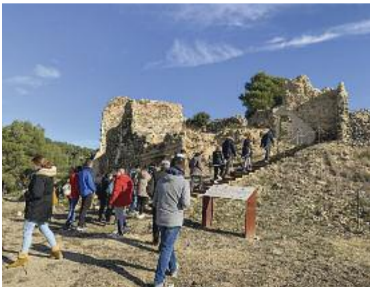
Visitants a les portes obertes al Castell de Voltrera.

L'accés al monument és possible des que es van acabar les obres per a la consolidació de l'estructura del castell i de la capella de Sant Pere.