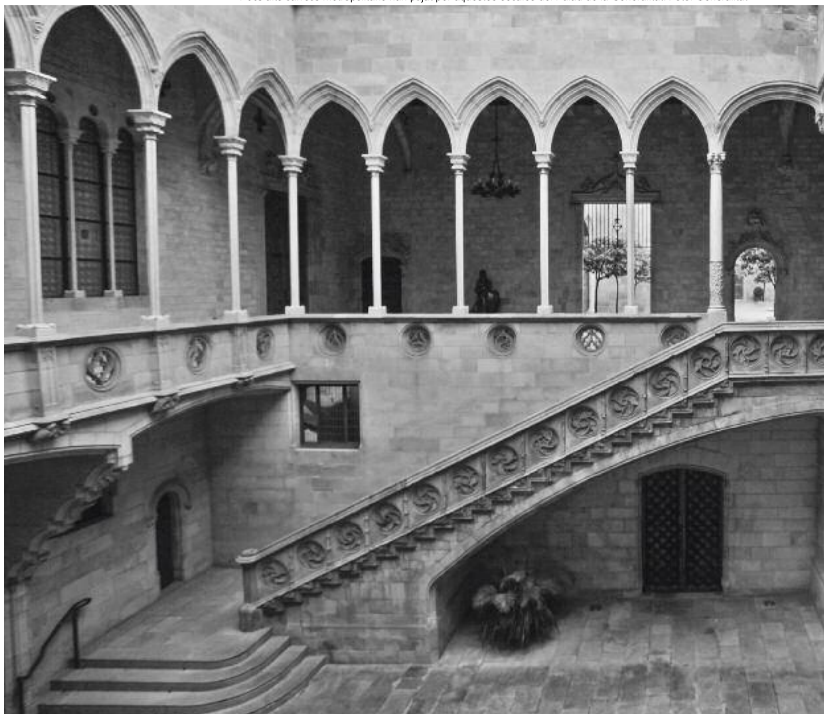
Pocs alts càrrecs metropolitanos han pujat per aquestes escales del Palau de la Generalitat.

La resta d'alts càrrecs estan vinculats o diuen que han nas-