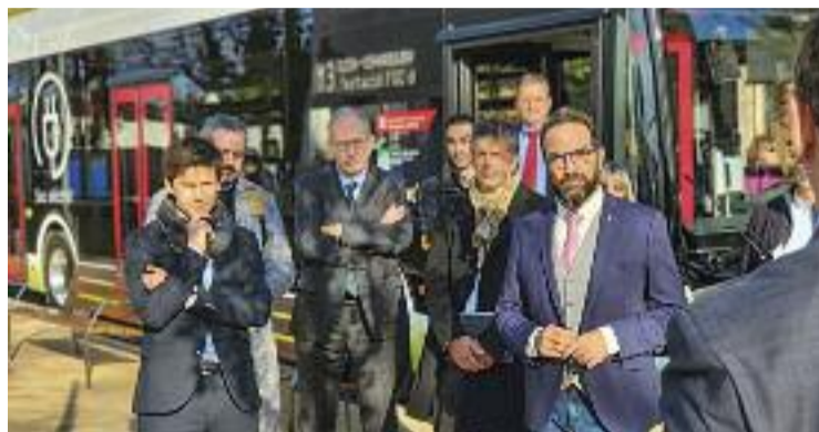
Inauguració dels busos elèctrics.