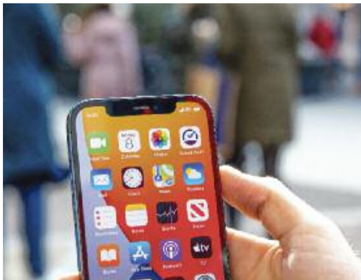
Telèfon mòbil amb connexió 5G.

Arran de les possibles afectacions, s'ha habilitat un número d'atenció gratuït (900 833 999). Hi podran recórrer tots els ciutadans que necessitin sol·licitar l'actuació en les seves instal·lacions per tal de solucionar els problemes que puguin sorgir i restablir el servei TDT amb total normalitat.