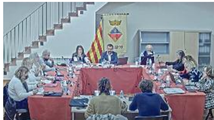
Ple municipal de Collbató.

El pessebre es podrà visitar el dissabte de les 18 h a les 20 h i l'endemà diumenge de les 12 h a les 15.30 h.