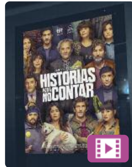
Historias para no contar Cesc Gay

Un repartiment de luxe per narrar situacions en què ens podem reconèixer, però que preferiríem no explicar. De fet, fins i tot preferiríem oblidar-les. Historias para no contar recull trobades inesperades, moments ridículs i decisions absurdes. En total, cinc històries amb una mirada àcida i compassiva a la incapacitat per governar les nostres emocions.