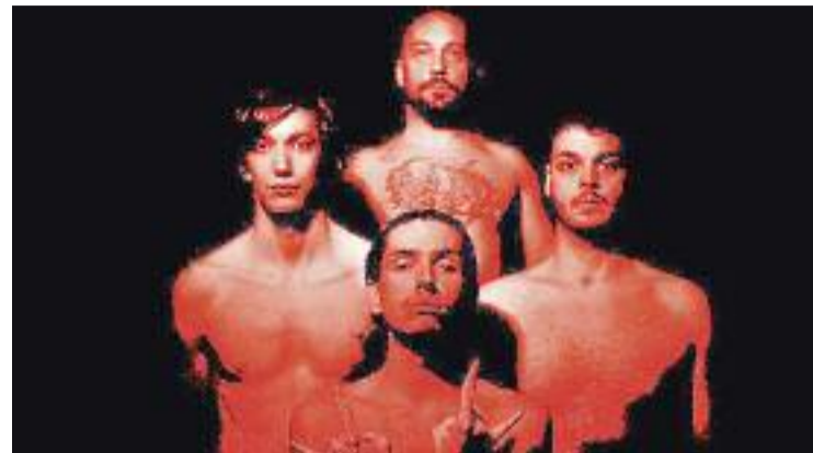
Cartell promocional dels Pastorets 2.0.

blics i les polítiques socials". Rivas també ha volgut destacar que l'associació que elabora l'estudi és un òrgan independent de l'administració i que "es valora la inversió en els serveis socials bàsics municipals, però també en altres serveis orientats al benestar de les persones, com la residència Can Comelles, les escoles bressols municipals o l'Escola de Les Arts".