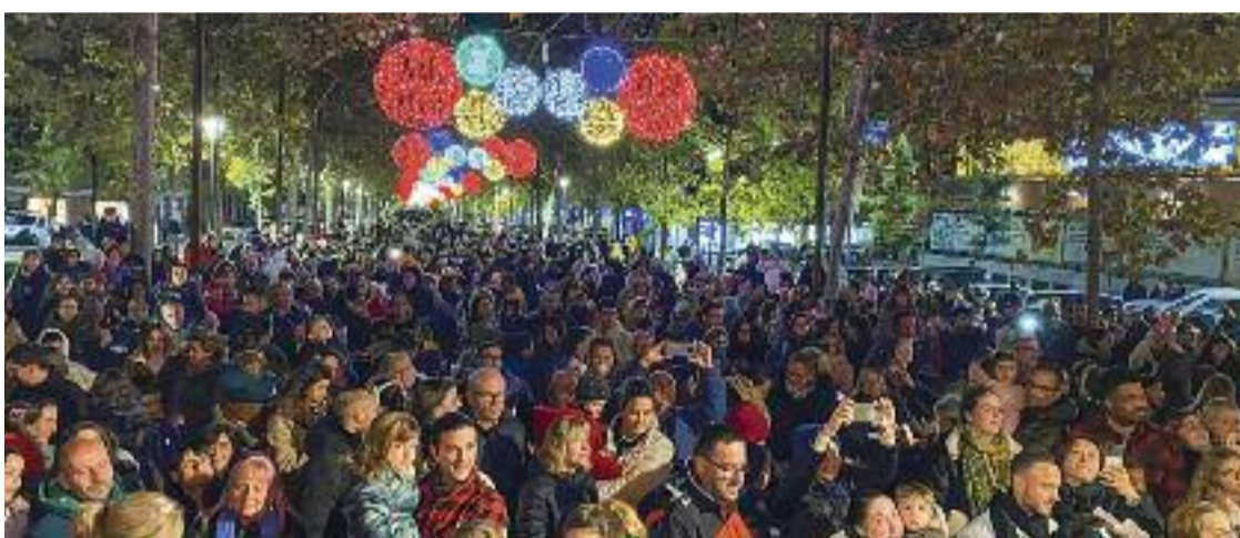
Martorell ja viu amb intensitat les festes nadalenques.