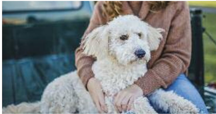
Una dona abraçant la seva mascota.

Tanmateix, Marcos apunta que el compromís també té en compte "la formació dels tècnics