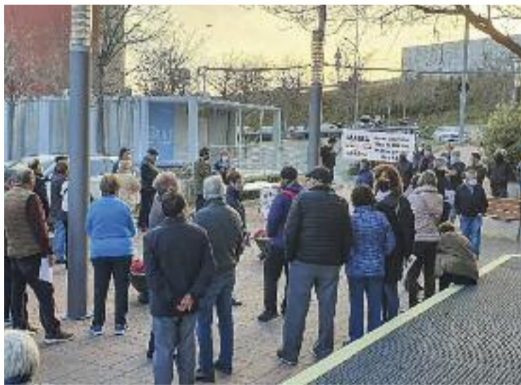
Concentració de Marea Blanca Abrera.

Amb tot, la construcció del CAP no seria imminent. Pel que fa a la modificació urbanística, han de passar nou mesos des de l'aprovació inicial fins a la defi-