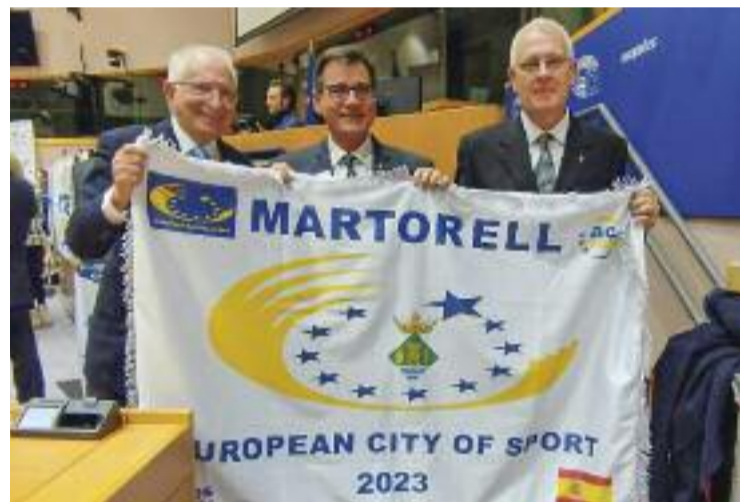
L'alcalde i el regidor d'Esports de Martorell a Brussel·les.

Tanmateix, l'alcalde ha volgut agrair "a totes les entitats esportives, clubs i esportistes de Martorell per la gran labor que fan des de l'esport de base fins al de primer nivell". El mèrit també és d'elles, remarca el batlle.