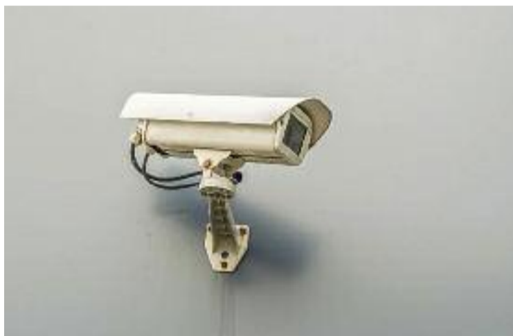
Martorell es planteja posar càmeres en alguns punts del municipi.

guretat Ciutadana, matisava que l'objectiu no és "posar càmeres per posar", sinó que "cal buscar on, per a què serviran i quins resultats se'n trauran".