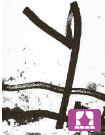
Yerma Federico García Lorca