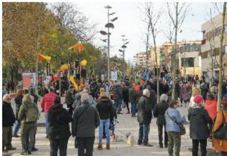
Inauguració del nou passeig de Catalunya.