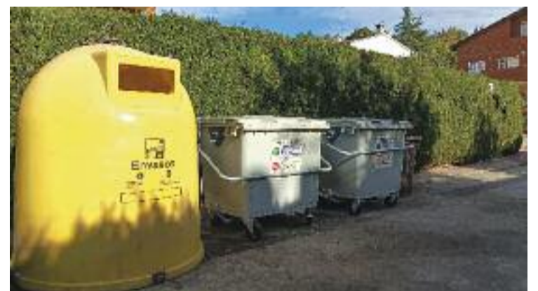
Suports instal·lats a Can Sunyer.

Del Valle experimenta amb la música per gaudir-la, deixar-se anar i transmetre màgia, que és el que voldria. El seu àlbum mira cap a ella i a poc a poc s'obre cap enfora.