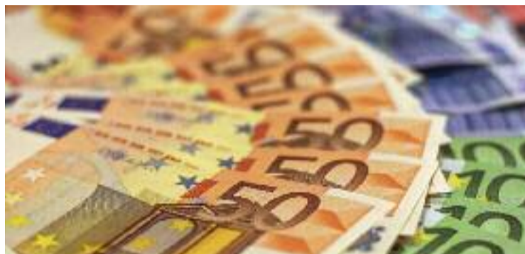
Imatge de bitllets d'euro.

A banda de la partida per al gas i l'electricitat, també aug-