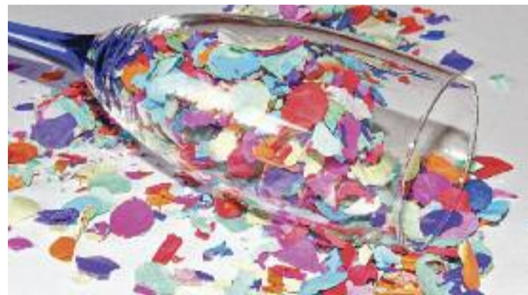
Celebració de Cap d'Any.

fabricat perquè no hi havia lloc al CAP per un recorregut alternatiu dels pacients". A més, ara per ara la unitat de pediatria està situada al Casal de Joves per manca d'espai. "No podem oblidar que no s'estan donant respostes a les necessitats de la ciutadania", exposa Serrano.