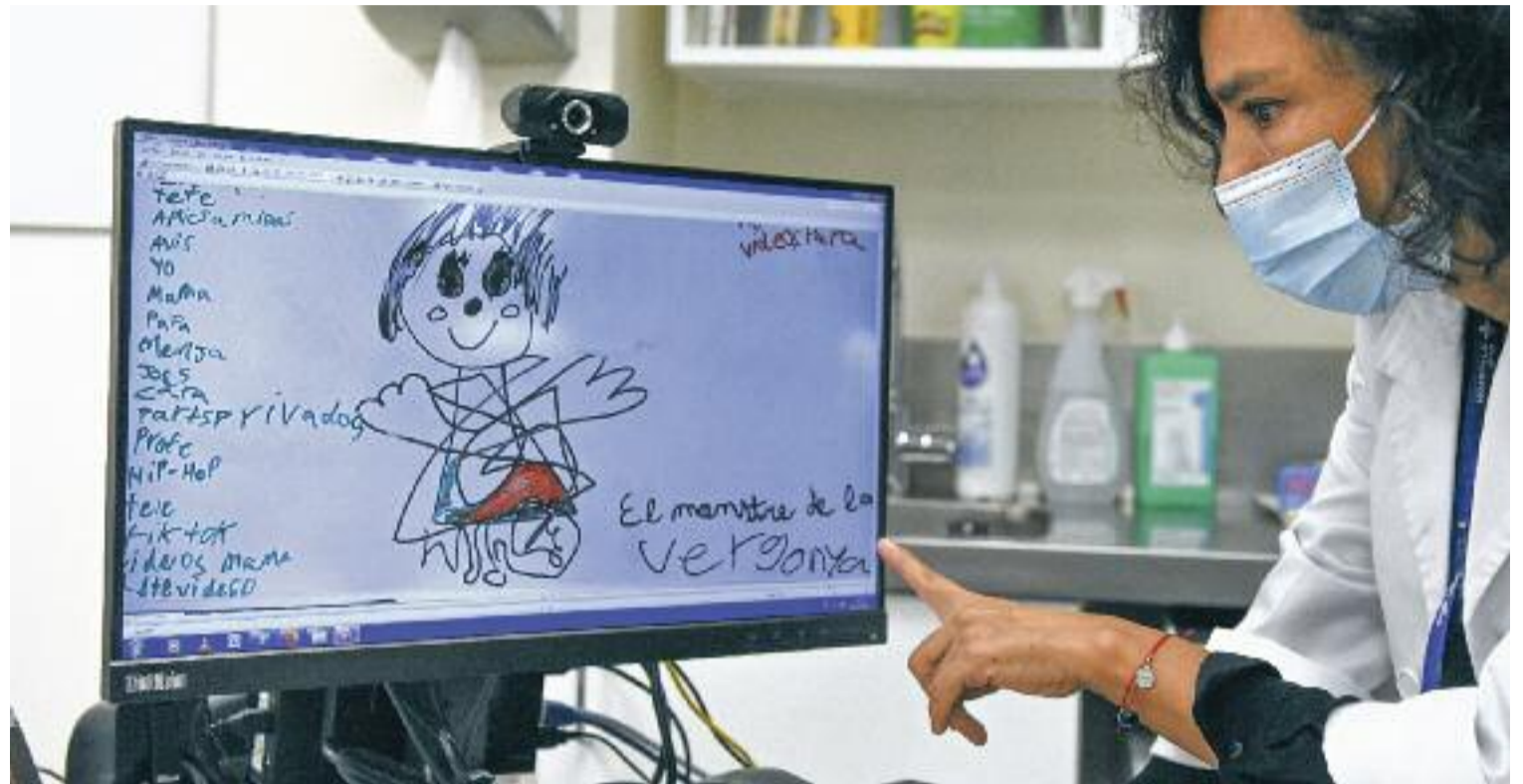
Una treballadora social de l'Equip EMMA de l'Hospital Vall d'Hebron amb el dibuix d'una víctima de violència sexual infantil.

Aquests agressors, per cert, tenen un perfil molt clar: en el 96% dels casos són homes i la meitat de les vegades són del nucli familiar de la víctima. És l'esfereïdora radiografia que deixa el segon any de funcionament de l'Equip EMMA. Pel que fa a les víctimes, la majoria de pacients que atén aquesta unitat de la Vall d'Hebron, un 87%, són nenes o