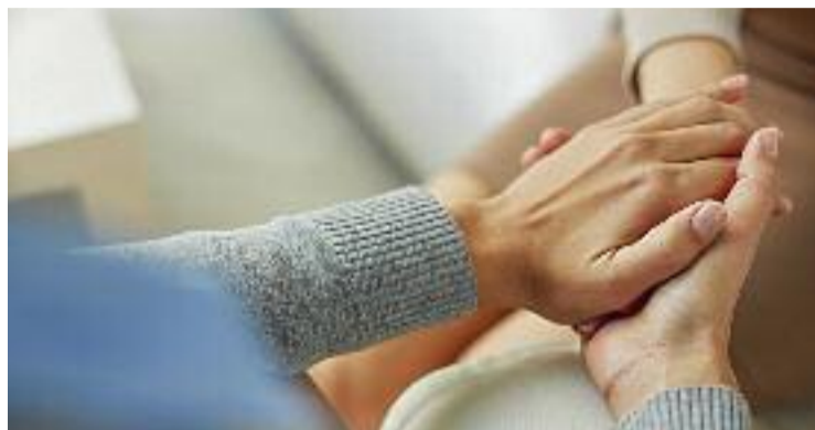
La inversió social és una de les prioritats d'Esparreguera.

Per dur a terme l'informe, s'ha tingut en compte el pressupost executat en l'àmbit dels serveis i la promoció social durant l'exercici de 2021, que en el cas d'Esparreguera va ser de 4,95 milions d'euros, el que va suposar un increment del 12% en comparació el 2020. Tenint en