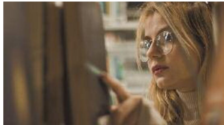
La biblioteca aposta pels llibres feministes.

Per altra banda, el PSC ha tornat a posar el focus en la inversió a les obres del Cemenitori Vell i plaça Doctor Flèming, que creu que s'estan sobredimensionant i que no són la prioritat més necessària.