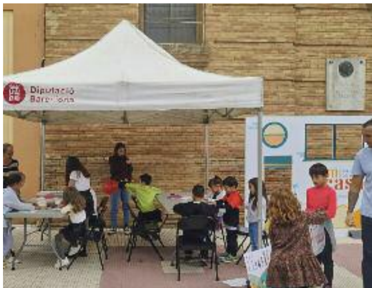
Acció de la campanya 'Com a casa'.

A més, també hi ha la finalitat que els seus habitants tinguin cura de Sant Esteve: "Tot el que