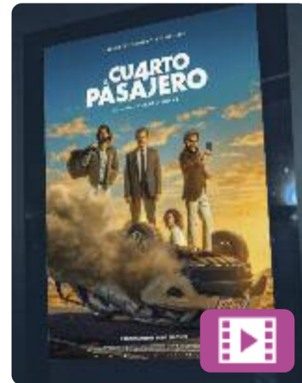
El cuarto pasajero Álex de la Iglesia

El Julián, un divorciat de 50 anys amb problemes econòmics, recorre a una aplicació per compartir el seu cotxe amb desconeguts i, especialment, amb algú que ja no ho és tant: la Lorena, una jove que viatja sovint a Madrid. El conductor vol aprofitar el trajecte per confessar-li els seus sentiments, però un inquietant passatger provocarà un gir inesperat.