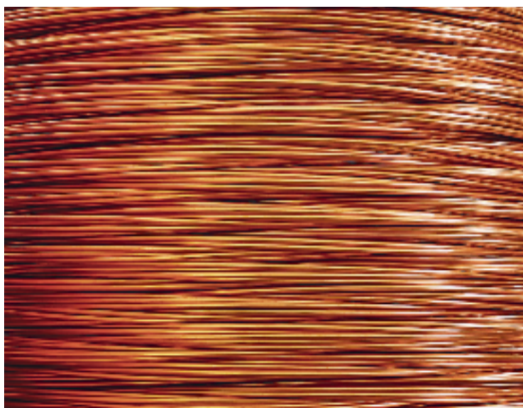
Cablejat elèctric de coure.

Des dels diferents canals institucionals, el govern municipal demanava als veïns la col·la-