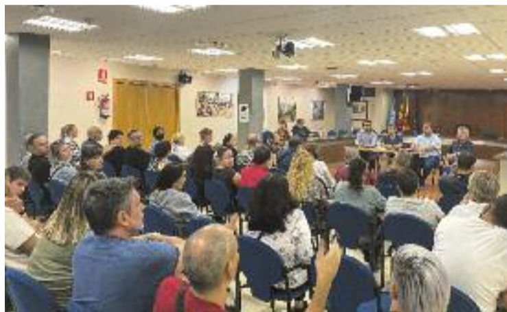
Reunió dels veïns afectats amb l'Ajuntament.

Per aquest motiu, l'Ajuntament va oferir als afectats, després de l'incendi, les instal·lacions municipals en el marc d'un protocol d'emergència que es va dissenyar. Després d'una trobada amb l'alcalde Ana Alba, es va acordar que els ciutadans podien fer servir les dutxes del complex poliesportiu de l'Onze durant el seu horari habitual, de les 7 a les 23.30. Pel que fa al poliesportiu Josep Pla, podien acudir-hi fora de l'activitat lectiva de l'equipament, de les 18 a les 22.30. A més, es van habilitar cabines sanitàries, amb urinaris i rentamans, al carrer Doctor Vila.