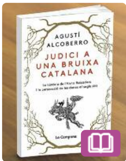
Judici a una bruixa catalana Agustí Alcoberro

Un format híbrid en què ficció i no ficció se sumen per il·lustrar un episodi singular de la història: la cacera de les bruixes. La frontera entre realitat i mite es desdibuixa; tanmateix, les raons històriques i objectives del postfaci d'Agustí Alcoberro, expert en el tema, ens acosten als motius pels quals les bruixes van aparèixer en l'imaginari col·lectiu.