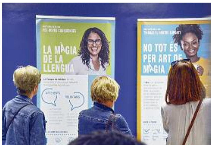
La mostra 'Quan parles fas màgia' per promoure el català.