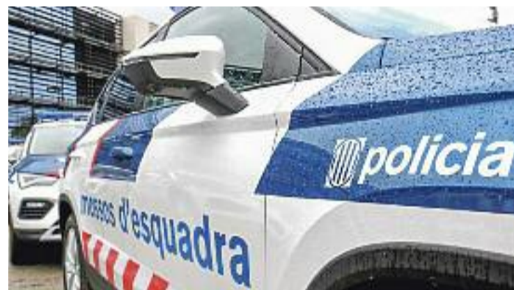
La detenció va tenir lloc a principis d'octubre.

A més, l'arrestat també acumulava altres antecedents, entre els quals delictes contra el patrimoni i de maltractament en l'àmbit de la llar. El Grup de Recerca Activa de Fugitius dels Mossos d'Esquadra va prioritzar la investigació sobre l'home fins que va detenir-lo.