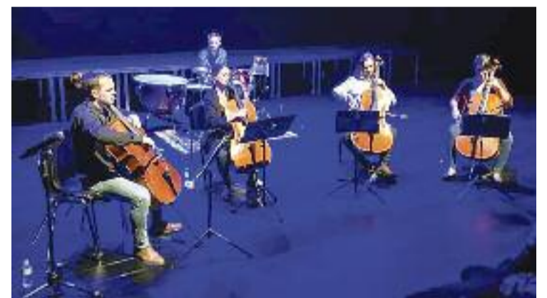
El quartet de violoncelles Northern Cellos.

seguretat al municipi de Collbató. Diverses persones es preguntaven on era la Policia Local durant el robatori i es lamentaven de la manca de vigilància als carrers per aturar els furts, també aquells comesos a domicilis particulars.