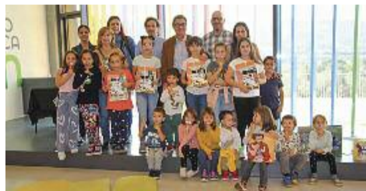
Guanyadors del concurs 'Llegir té premi' de Martorell.

La Biblioteca Martorell s'ha rebatejat amb el nom de Francesc Pujols, tal com s'anomenava l'anterior. L'acte de recuperació es va fer coincidir amb el 60è aniversari de la mort del filòsof martorellenc. Tal com expliquen des del Consistori, la Fundació Francesc Pujols demanava tornar l'homenatge a l'escriptor amb el seu nom encapçalant la biblioteca.