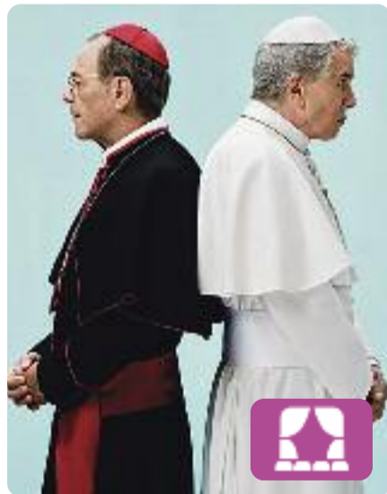
El papa Anthony McCarten