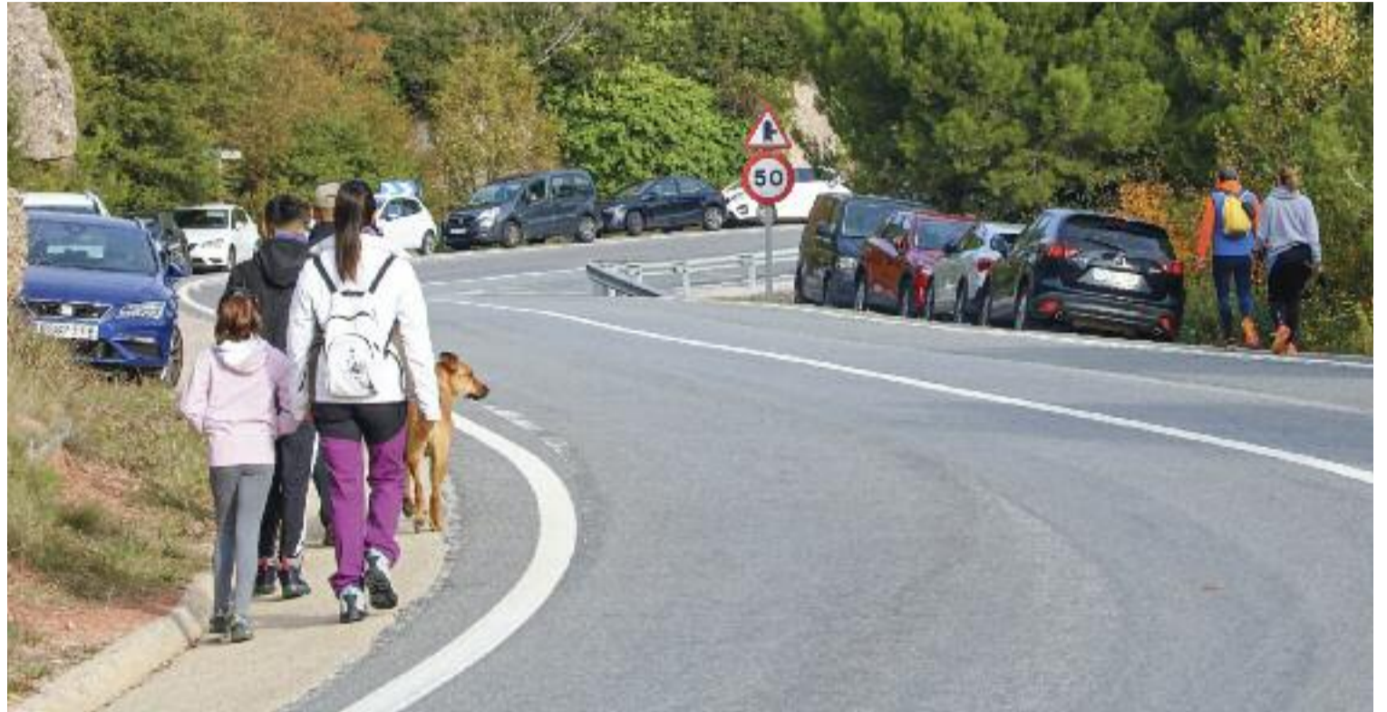
Cotxes aparcats, alguns als vorals de la carretera, símptoma de la massificació de Montserrat.

Jaume Torralba, cap dels Agents Rurals de la Catalunya Central, exposa que el Parc Natural no està pensat per acollir un volum tan alt de visitants i que una de les conseqüències també és la pèrdua de la quietud, la