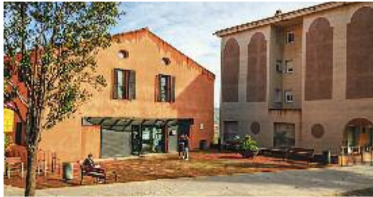
El Punt Mòbil s'ubicarà a l'exterior de Cal Trempat.

Les sessions ja han començat amb presentacions a les diferents classes perquè l'alumnat conegui l'existència del programa i sàpiga que podrà acudir-hi durant l'hora d'esbarjo.