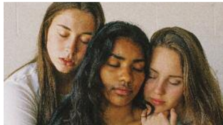
Dones en una abraçada col·lectiva.

Amb tot, en els últims mesos Sant Esteve ha rebut un nombre elevat de veïns nous i Com a casa vol ser l'excusa per fer-los sentir part del poble. A la vegada, servirà per fer conèixer algunes de les millores que s'han dut a terme per part del consistori.