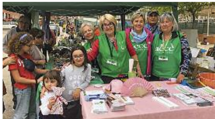
Campanya de recaptació per investigar el càncer de mama.

que no volen arribar a solucions punitives, però no descarta "fer-ho si calgués". La campanya, però, està donant els seus fruits i gran part dels veïns d'Abrera ja tenen un dels cubells de l'orgànica. L'acció continuarà amb les activitats pedagògiques a les escoles i instituts.