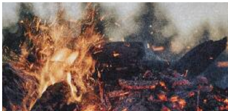
Crema de restes vegetals.

L'única excepció per la crema de restes és quan hi ha una malaltia o una plaga de la vegetació, que ha de ser confirmada per tècnics de la Generalitat o dels Agents Rurals. També es permeten focs d'esbarjo, per exemple barbacoes, sempre que no impliquin cremar restes vegetals. En aquests casos, els sol·licitants hauran de signar una declaració responsable indicant que estan complint la normativa pertinent.