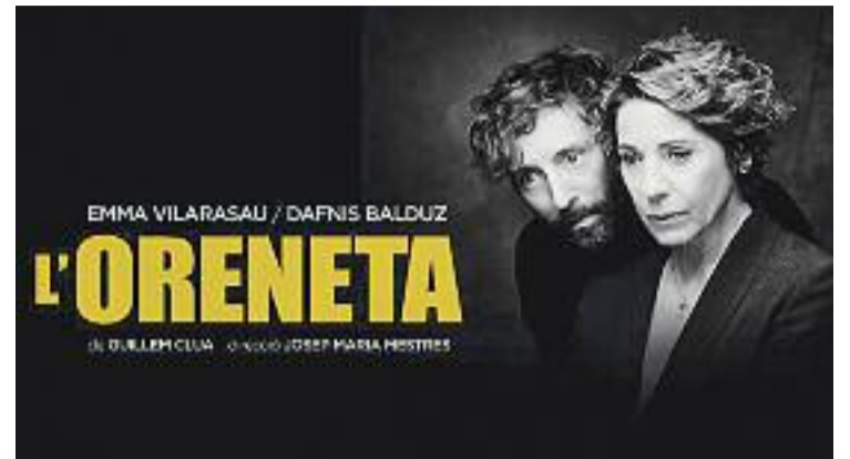
Cartell promocional de "L'Oreneta".

L'activitat constarà de tres taules independents: el racó del toca-toca, per conèixer el propi cos; l'espai d'anticoncepció i prevenció de malalties de transmissió sexual; i la taula sobre productes d'higiene menstrual, on també s'abordarà la higiene durant les relacions sexuals.