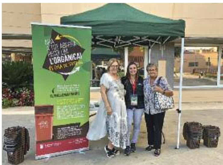
Campanya per fomentar la recollida selectiva.