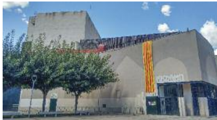
Vista exterior del Teatre de La Passió.

restes de poda, jardineria, hort, agricultura i feines forestals. Les persones que tinguin pensat fer focs en els supòsits legals mencionats, hauran de comunicar-ho prèviament de forma telemàtica (en un enllaç proporcionat per l'Ajuntament d'Olesa), amb cita prèvia presencial a l'Oficina d'Atenció Ciutadana o a les oficines de les Delegacions territorials del Departament d'Acció Climàtica, Alimentació i Agenda Rural.