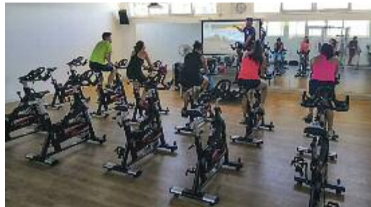
L'equipament es troba a la nova planta de la piscina coberta.

La cultura popular, com no podia ser d'una altra manera, també va estar molt present durant la festa, amb actes com la diada castellera i la 43a trobada de gegants organitzada per la colla local, que va comptar amb onze colles convidades.