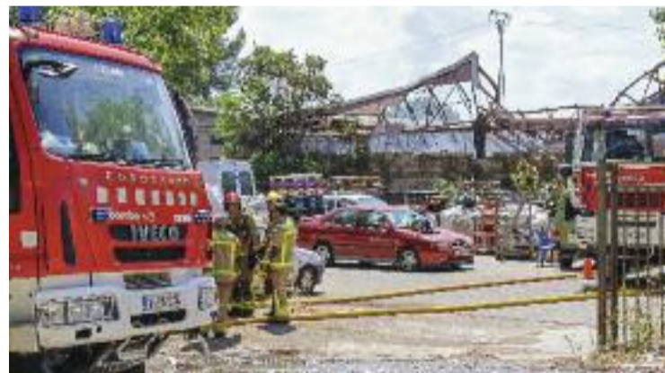
La nau del polígon industrial Can Sucarrats, després de l'incendi.

lles de cultura popular, amb la cercavila, el correfoc (a càrrec de Bram de Foc, que enguany celebra el 40è aniversari) i una mostra que va animar el matí de diumenge. D'altra banda, la Festa Major també va ser una oportunitat per als abrerencs de redescobrir el patrimoni local, amb visites tant al castell de Voltrera com a les trinxeres de la Guerra Civil, a Sant Miquel.