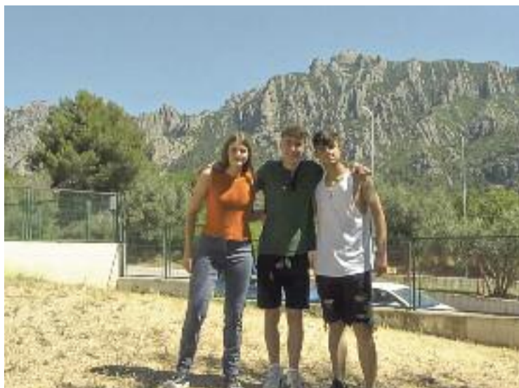
Alguns dels alumnes que han participat en el projecte 'Reacciona'.

El resultat del desplegament d'aquest projecte al poble ha estat satisfactori: els alumnes de l'últim any de secundària han creat tres curts que serviran com a "eines de sensibilització", segons l'Ajuntament, per a algunes entitats sense afany de lucre. Concretament, les ONG que han escollit els participants han