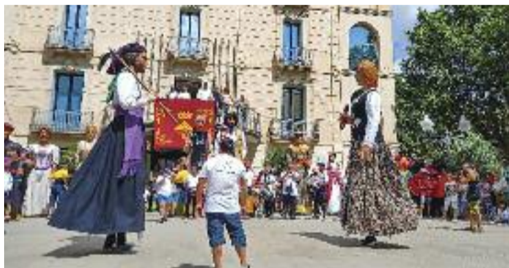
La 43a trobada de gegants, durant la festa.

L'arribada de la Flama del Canigó, coincidint amb la revetlla de Sant Joan, va marcar l'inici de cinc dies plens d'activitats. El mateix dijous 23 hi va haver el piromusical Odissea , així com tres opcions d'oci diferents, repartides en tres escenaris (la plaça Catalunya, la plaça de l'Oli i el parc municipal), per satisfer tots els públics. Entre les propostes nocturnes, destaquen