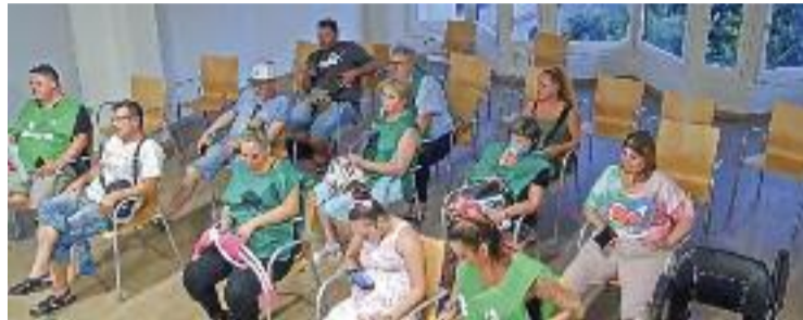
Els membres de la PAH presents a la sessió plenària.

L'origen de la disputa va ser la moció contra les ocupacions il·legals d'habitatges impulsada per l'Associació de Municipis de l'Arc Metropolità (de la qual Esparreguera, per ara, no en forma part) que el PSC, Junts i el regidor no adscrit van portar al Ple. En altres municipis on també s'ha presentat aquesta moció, com Abrera o Olesa, la PAH hi ha intervingut amb una "contramoció", mostrant el seu rebuig al discurs que alerta de les ocupacions. A Esparreguera, però, no van aconseguir permís per intervenir al Ple, així que hi van assistir de públic i