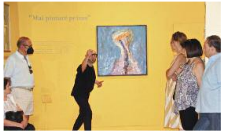
Visita a l'exposició de Muxart pel centenari del seu naixement.

Per acabar, aquest dijous, el Molí Fariner obrirà les portes als veïns per recordar que fa deu anys que aquest edifici es va convertir en la seu del Centre de Promoció Econòmica.