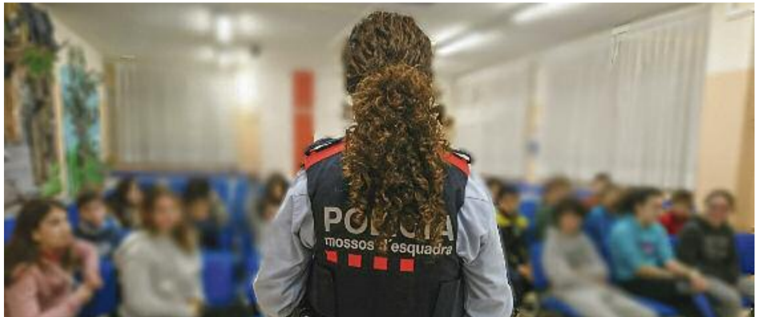
Als Mossos d'Esquadra, només dos de cada 10 policies són dones.

La policia sempre s'ha vist com una professió d'homes. Tal com diu la psicòloga Alba Alfageme, la feina de policia “està molt vincu-