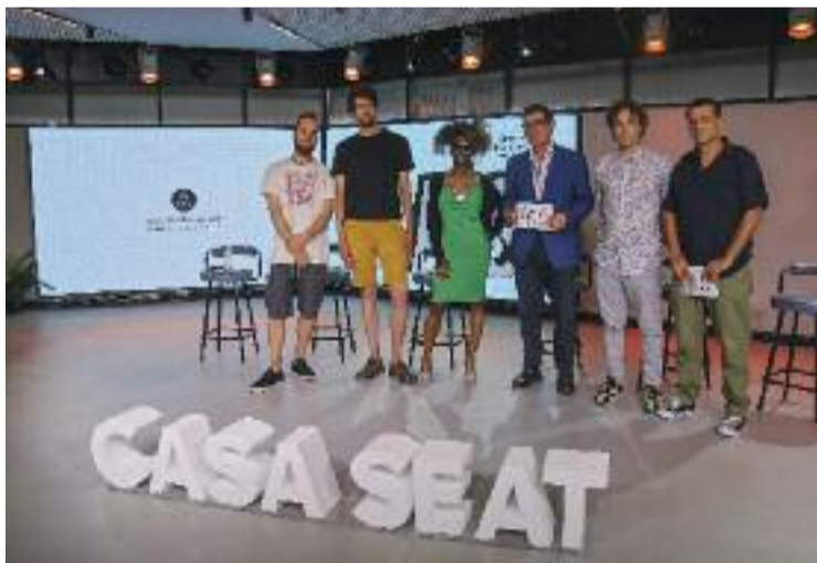
Alguns dels artistes que actuaran al festival, a la presentació.