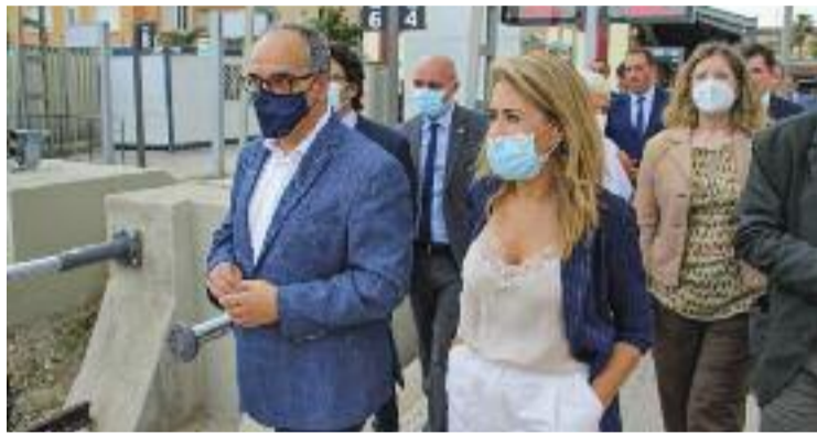
La ministra de Transports, a l'estació de Renfe de Martorell.

L'estada de la ministra a Martorell es va produir amb la polèmica per les inversions de l'Estat