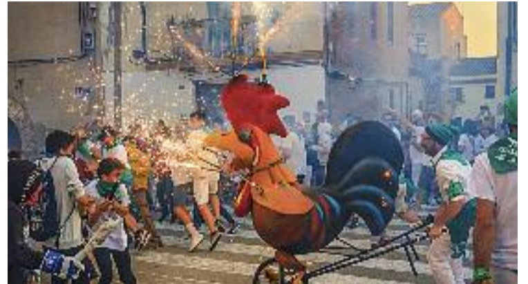
La cultura popular, protagonista.