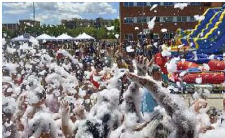
La festa de l'escuma, una de les activitats de més èxit.

Pel que fa a les propostes per als més petits, divendres al matí hi va haver una de les activitats preferides de la canalla, la gran festa de l'escuma. Durant la resta de dies, els menús van comptar amb concerts familiars i ac-