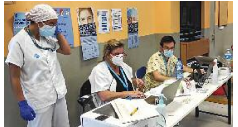
Fa temps que el consistori demana el nou centre.

D'altra banda, com sempre, el Núria Espert ha pensat en els nens i nenes i ha programat quatre propostes infantils i familiars. L'espectacle de titelles La llàntia meravellosa ; l'obra per a la primera infància K'aa, la teva cançó ; l'obra de teatre musical La motxilla de l'Ada , i la festa dels petits grans espectadors.