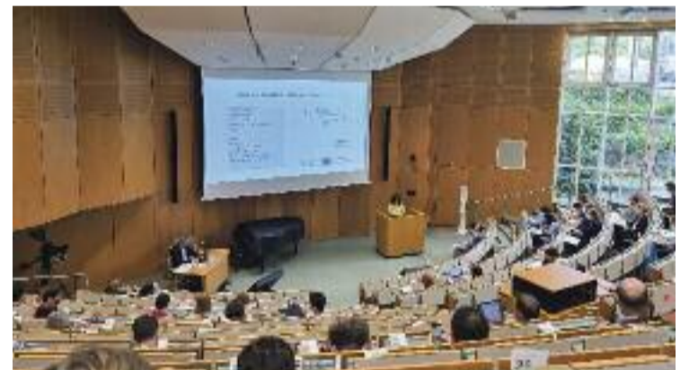
La cofundadora d'HipoFam en un acte a Alemanya.

La inauguració de l'exposició va ser un acte emotiu en què la cultura catalana i la nepalesa van ser protagonistes: el grup SES Dansa i Amics del Nepal van oferir mostres dels balls de tots dos països. També s'hi van poder adquirir lots formats per ampolles de tres cellers locals (Roger Goulart, Can Casals i Ca n'Estella) i les reproduccions de dues obres exposades. La major part de la recaptació es va destinar a Amics del Nepal.