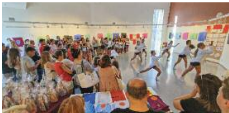
L'actuació de SES Dansa a la inauguració de la mostra.

Quan va començar a pensar en l'exposició de final de curs d'aquest any, la professora i artista va decidir que volia fer "una cosa diferent". Com que té un fill nascut al Nepal, va pensar que seria bona idea posar-se en contacte amb l'ONG Amics del Nepal per crear una mostra conjunta amb empremta sesroviirenca i nepalesa. Des de l'associació de seguida es van mostrar disposats a col·laborar i van buscar un professor de di-