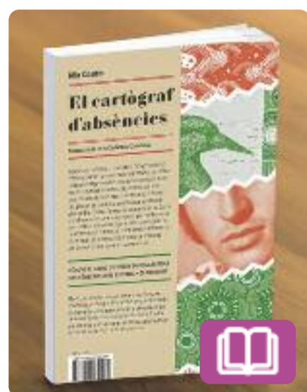
El cartògraf d'absències Mia Couto

El poeta i professor universitari Diogo Santiago retorna a Beira, la seva ciutat d'infància, per rebre un homenatge mentre s'anuncia l'arribada d'un cicló tropical demolidor. Allà coneix la Liana, una dona misteriosa que resulta ser la neta de l'inspector de la policia secreta que va detenir el pare d'en Diogo fa més de quaranta anys.