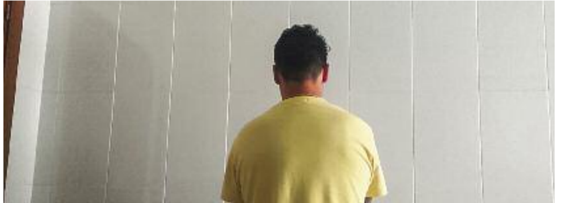
Un dels veïns que denuncia haver estat víctima del presumpte estafador.