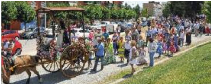
Una imatge que es tornarà a veure aquest any a Sant Andreu.

s'han programat actes previs, entre els quals hi ha una masterclass de ball solidària o una projecció d'imatges de la Romeria d'anys anteriors. Divendres es presentarà la Romeria 2022 amb un festival de ball, el pregó i el brindis d'inici. Dissabte hi haurà la tradicional ofrena floral i un festival de cors rocieros , així com una missa i dos concerts: el de Gisela Quirós i el de la santandreuenca Ana Guerrero. Finalment, diumenge serà el gran dia, amb l'anunciació, la Romeria com a tal i l'oració de l'Àngelus.