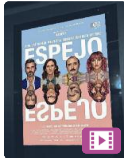
Espejo, espejo Marc Crehuet

Quatre treballadors d'una oficina es preparen per celebrar el 50è aniversari de l'empresa mentre miren de resoldre alguns problemes. Es tracta d'una empresa de cosmètica i els treballadors, com tothom, s'han d'enfrontar als seus propis reflexos al mirall. Ambició, por, amor i traïció són els elements principals d'aquesta història sobre la identitat.