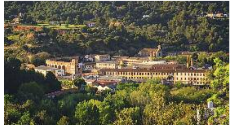
El procediment per declarar-la BCIL va començar fa dos anys.