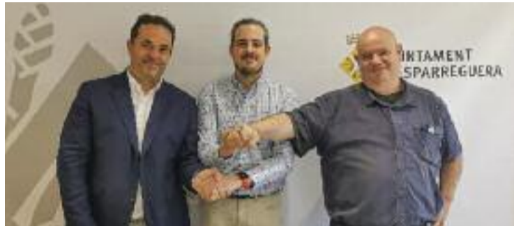
És un acord a tres bandes entre Fecalon, Ajuntament i LTN.

L'acord reflecteix el compromís conjunt del govern municipal i la discoteca per millorar la seguretat i el civisme del local i el seu entorn. D'una banda, l'Ajuntament es compromet, entre altres coses, a fer "controls preventius es-