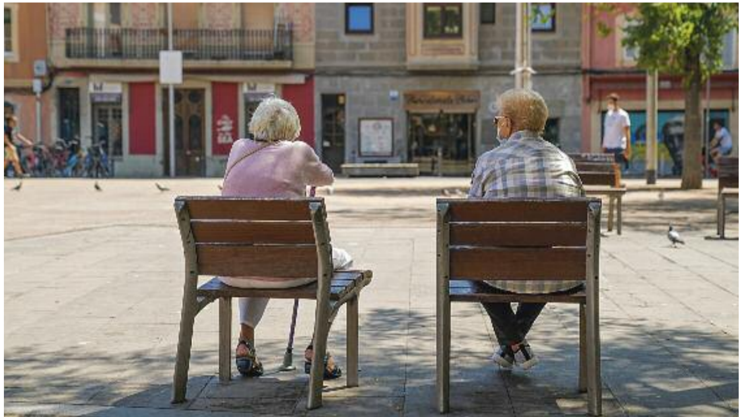
La soledat no desitjada és un dels motius que poden portar al suïcidi en la gent gran.

El mateix Quiles afirma que a la seva associació hi ha moltes persones grans que comenten les seves ideacions suïcides, i fins i tot casos de persones que acaben