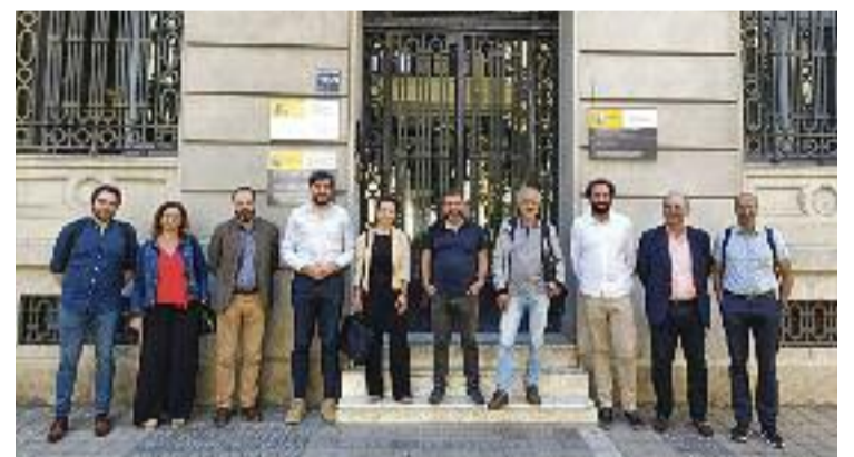
Segona reunió entre Ministeri i municipis afectats pel projecte.

Després de l'èxit de l'estrena del nou format, al novembre hi haurà una nova dosi de Collbató Vives Fest, aquest cop en el format tradicional en interior (el que ja oferia el Festival Amadeu Vives), més adequat per a la tardor.