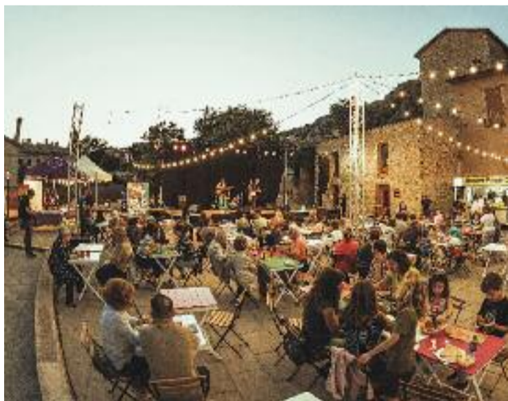
La plaça de l'Era, escenari del festival.

Les actuacions del Collbató Vives Fest també van servir perquè els alumnes del taller de fotografia d'arts escèniques del Casal de Cultura possessin en