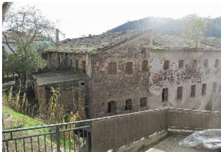
La Diputació ha alertat del mal estat del molí d'en Gomis.