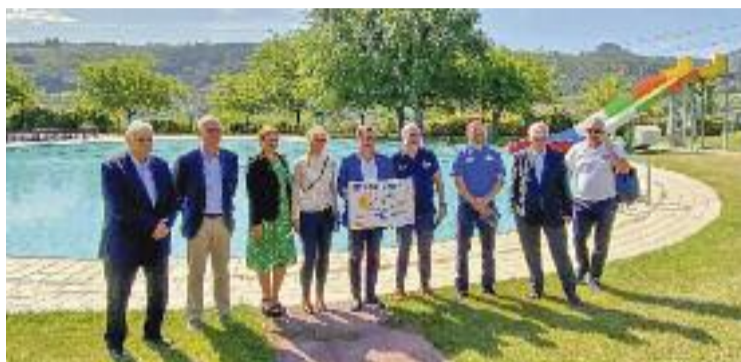
La visita del comitè avaluador a Martorell.