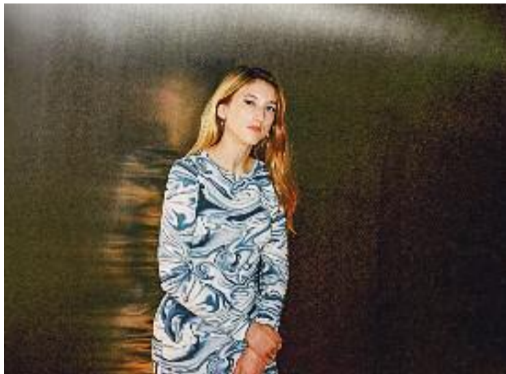
La jove cantautora, nascuda l'any 1998 a Martorell.

Després d'actuar al cicle 'El so de les cases' de Vic el cap de setmana passat, Knight oferirà un concert ni més ni menys que al Primavera Sound aquest divendres, 10 de juny. En una entrevista recent a Ràdio Mar-