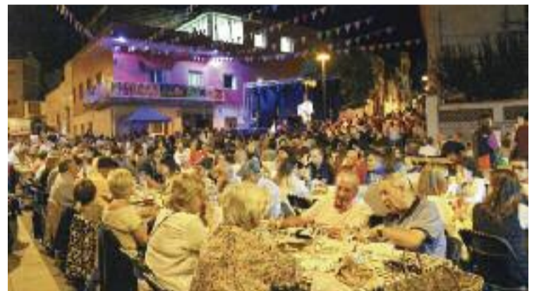
El sopar de germanor va aplegar unes 700 persones.

litzar la situació urbanística de tot el polígon”. Des del 2018 i fins al maig de 2020 es van fer unes obres d'urbanització que van costar prop de set milions d'euros. En aquest temps, “es van poder atorgar les llicències corresponents de forma legal”, celebra ara l'Ajuntament, de manera que “es va restablir l'ordre jurídic vulnerat”. Això és el que ha permès que el TSJC hagi declarat ara la inexecució de la sentència i, per tant, que les naus afectades s'hagin salvat de l'enderroc.