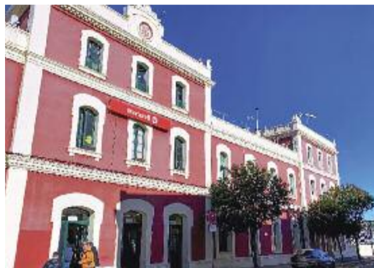
El Ministeri ha licitat l'estudi per fer-ho possible.

D'altra banda, Renfe ha ampliat les freqüències de l'R4 a la nit entre Martorell i Terrassa, tant entre setmana com en disabtes i festius.