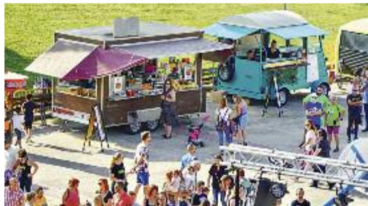
El parc de Can Morral es va omplir del 27 al 29 de maig.

que actualment són l'escola Francesc Platón. El 1977, es va construir l'aulari i l'edifici creat el 1922 va perdre la seva funció com a escola. L'any següent, les Escoles Nacionals passaven a ser les escoles velles. Després de funcionar durant molts anys com a espai "comodí", el 1998 es va acabar la reforma de l'edifici i es va convertir en l'Hotel d'Entitats.