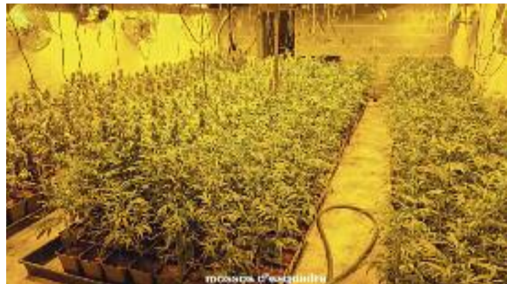
La plantació trobada a la urbanització Oasis.

Com la resta dels participants en l'acte, l'alcalde d'Olesa va destacar la importància "vital" d'aquesta infraestructura i, tot i que va admetre que cap de les protestes anteriors havia donat fruits, es va mostrar esperançat amb la resposta del govern central a la darrera concentració.