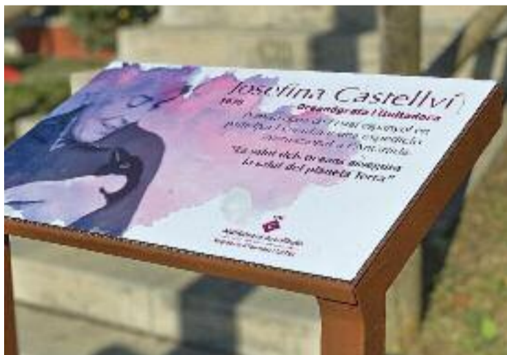
La nova placa que llueix al parc del passeig de les Escoles.

Tot plegat és fruit de la col·laboració de l'Ajuntament de Collbató amb l'entitat Lucíferases, un col·lectiu de científiques feministes que es dediquen a visibilitzar el paper de les dones en la ciència. Elles han treballat amb els alumnes de 6è de les dues escoles del poble, La Salut i Mansuet, fent tallers i activitats educatives, però també han aprofitat aquestes trobades per proposar als alumnes que triïn una