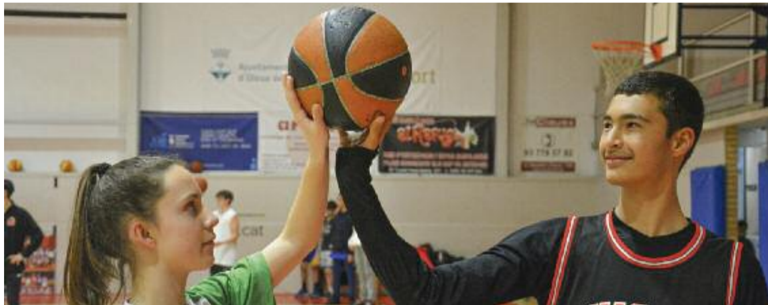
El Nou Bàsquet Olesa és un club que aposta amb determinació per la igualtat.

"És una guia malauradament necessària i que he compartit i continuo compartint amb persones vinculades a l'AE Nou Barris. L'any 2022 semblava que els cotxes ja volarien i estem fent reivindicacions dels anys 90", lamenta. Al club tenen una mirada molt àmplia i practiquen cada dia un pla d'igualtat. "Tots i totes anem a l'una i cap a una mateixa direcció. Tenim moltes il·lusions i projectes. El més difícil és desaprendre i canviar mirades i maneres de fer perquè moltes vegades són re-