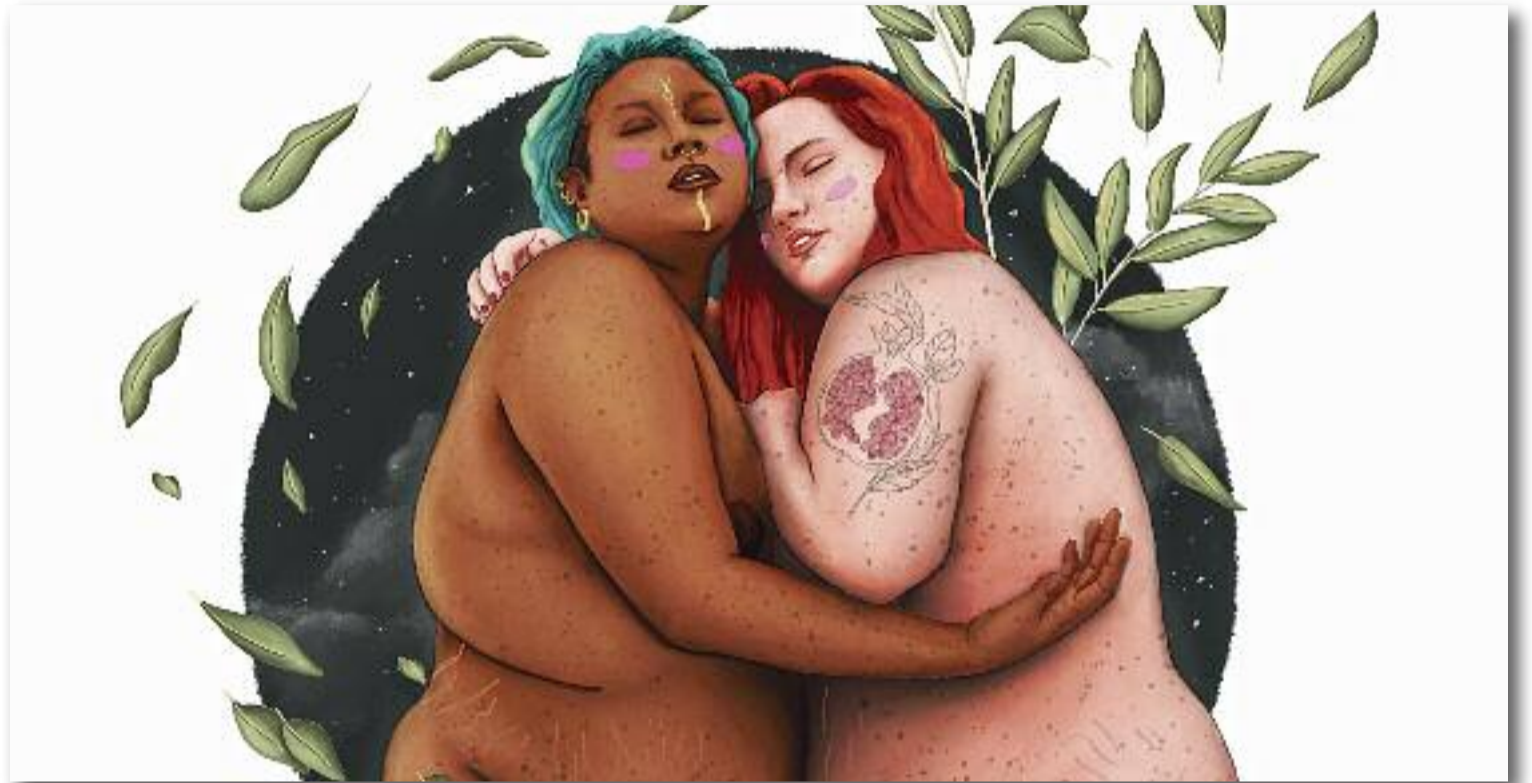
Una il·lustració d'Arte Mapache, artista i activista contra la grassofòbia.

D'altra banda, tal com apunta la Tess, "quan es llegeix l'obesitat com a malaltia, mai es fa