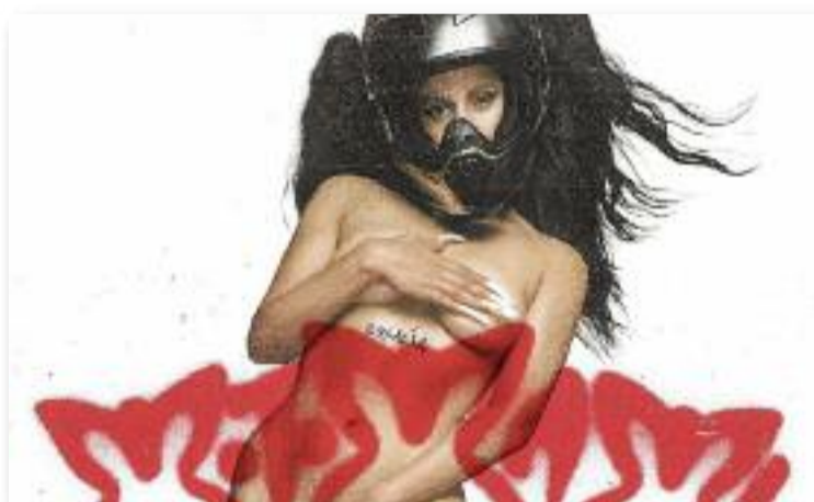
La portada del nou disc de la sesrovirenca.

A més, l'artista ha deixat clar que, malgrat la fama (un concepte al qual dedica una cançó del disc, publicada al novembre), manté els peus a terra i no oblidarà d'on ve. Per això, a la cançó G3 N15 ha inclòs un àudio en català de la seva àvia, en el qual li parla de la importància de Déu i la família i on li mostra el seu suport incondicional. "Portes un camí que és una mica complicat. Quan me'l miro penso «que complicat que és el món en què s'ha ficat la Rosalía». Però bueno , si ets feliç, jo també soc feliç", li diu l'àvia.