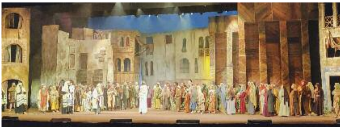
L'escena de l'entrada a Jerusalem, on els actors que fan de poble encara han de dur mascareta.