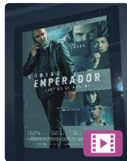
Código Emperador Jorge Coira

El Juan treballa per als serveis secrets. Per tal de tenir accés al xalet d'una parella implicada en el tràfic d'armes, s'acosta a la Wendy, l'assistenta filipina que viu a la casa, i estableix amb ella una relació complexa. En paral·lel, fa altres feines "no oficials" per protegir els interessos de les elits del país, que ara volen que busqui o, si cal, que s'inventi els draps bruts d'un polític.