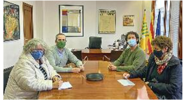
El govern rep la plataforma que demana millorar el CAP.

Guiral diu que tot és fruit de la "deixadesa política" i insisteix que, més enllà de qualsevol tema judicial, "el més greu és que faran passar un menor d'edat per un desnonament".