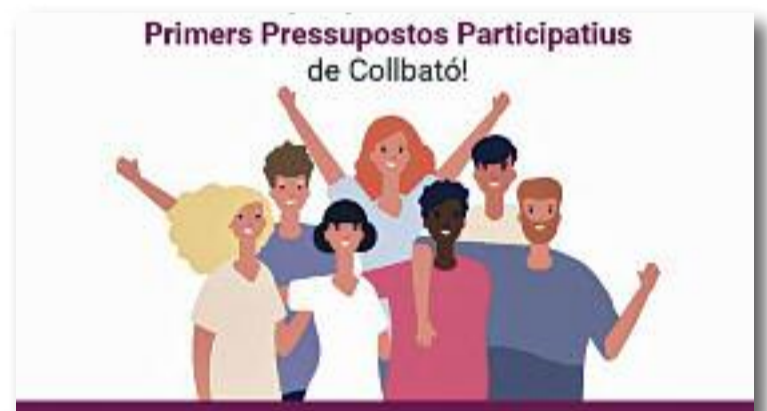
El cartell de la primera edició d'aquest procés participatiu.

També en el marc del Dia Internacional de les Dones, el Casal de Cultura va acollir el dia 10 el 1er Cercle de Dones de Collbató, que pretén ser "un espai de relació i trobada entre dones" perquè les participants puguin "expressar quin Collbató feminista desitgen".