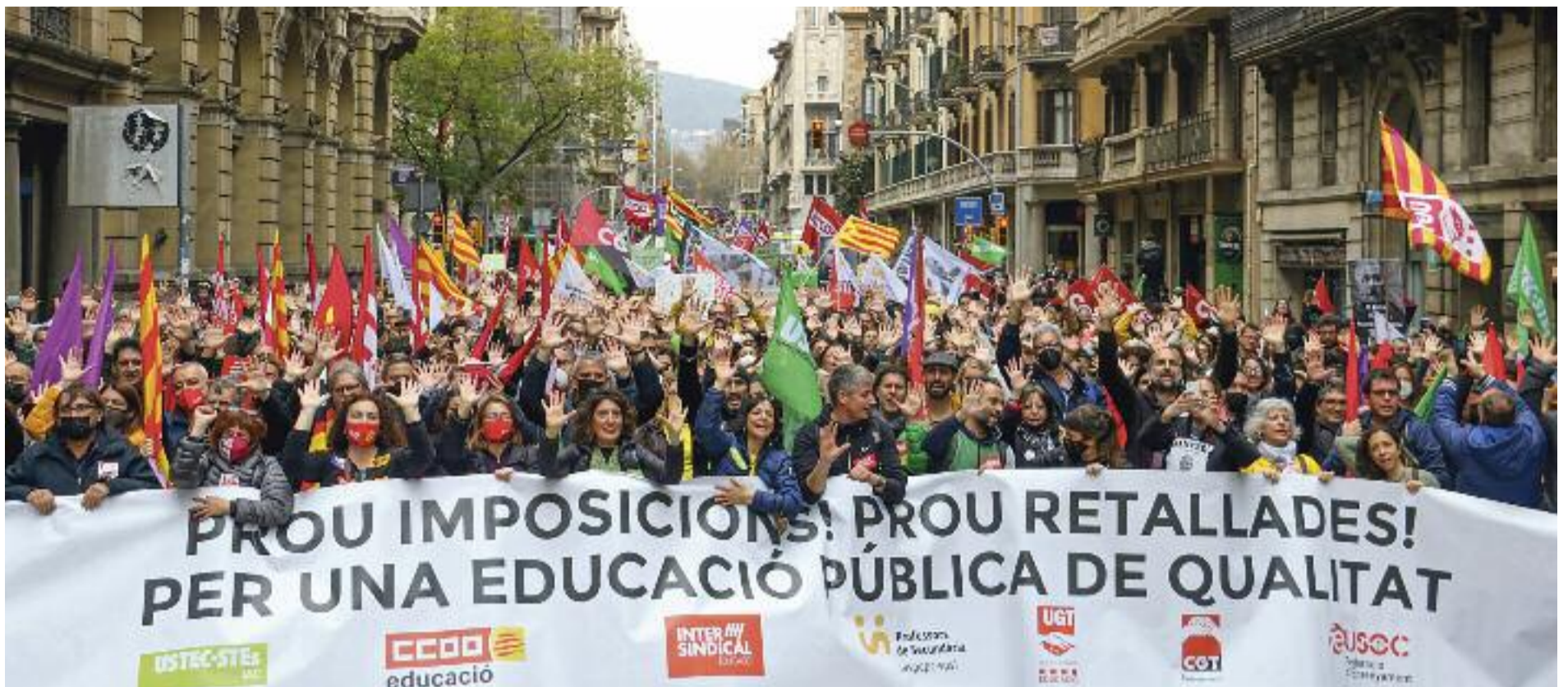
La manifestació de professors que va omplir els carrers de Barcelona la setmana passada.