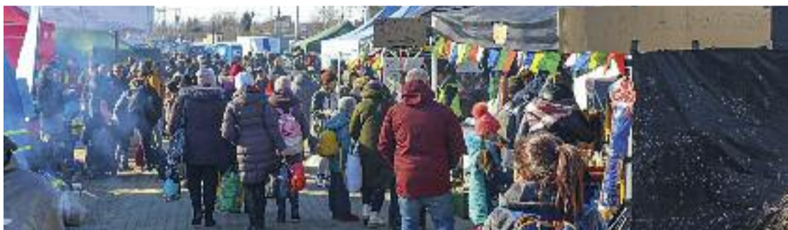
El camp d'acollida de refugiats de la localitat polonesa de Medyka, a la frontera amb Ucraïna.

El primer destí va ser el poliesportiu de la localitat polonesa de Medyka, on van haver de passar l'exhaustiu control dels militars abans de reunir-se amb la noia que viatjava amb la seva filla. Allà no van trobar ningú més que volgués venir a Espanya –la majoria d'ucraïnesos volen quedar-se a prop del seu país, tal com matisa un dels santandreuencs que va fer el viat-