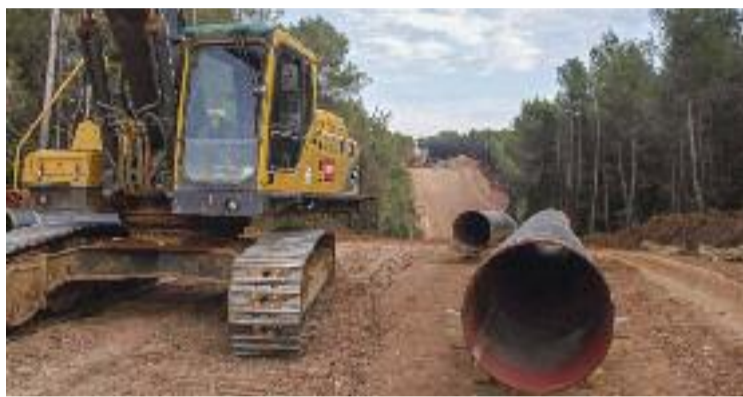
Les obres es van aturar el 2011.

Moltes veus han parlat en les últimes setmanes de recuperar el Midcat. Ho han fet el president del govern espanyol, Pedro Sánchez; el president del Govern, Pere Aragonès (si bé ha matisat que ha de servir per transportar hidrogen verd) o el president de