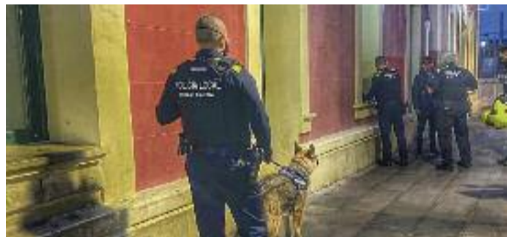
Un gos policia a l'estació de Renfe de Martorell.

SEGURETAT ▶ Rolo, Sira, Lua i Burt: aquests són els noms dels quatre nous agents de la Policia Local de Martorell. Es tracta dels quatre gossos que formen la nova unitat canina del cos policial, que es va crear divendres passat. Segons l'Ajuntament, aquests animals faran, principalment, tasques de detecció d'estupefaents i participaran en funcions divulgatives davant la ciutadania.