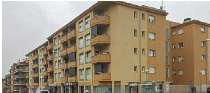
Un bloc de pisos d'Esparreguera, en una imatge d'arxiu.

El mateix detalla que la família que ha ocupat el pis és usuària dels serveis socials municipals perquè es troba "en situació de vulnerabilitat" i que, per tant, podria tenir dret a recórrer a la mesa d'habitatge de la Generalitat i demanar un pis de lloguer social. El regidor lamenta que la família s'hagi "saltat" la via adequada i assegura que ara s'està treballant en dos sentits: defensant la propietat del pis i buscant una solució òptima (i legal) per a la família.