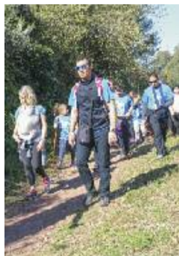
La Marxa de 2019.

Línia Nord ha volgut conèixer el posicionament de l'Ajuntament sobre la possible represa del Midcat, però no ha estat possible obtenir-ne resposta.