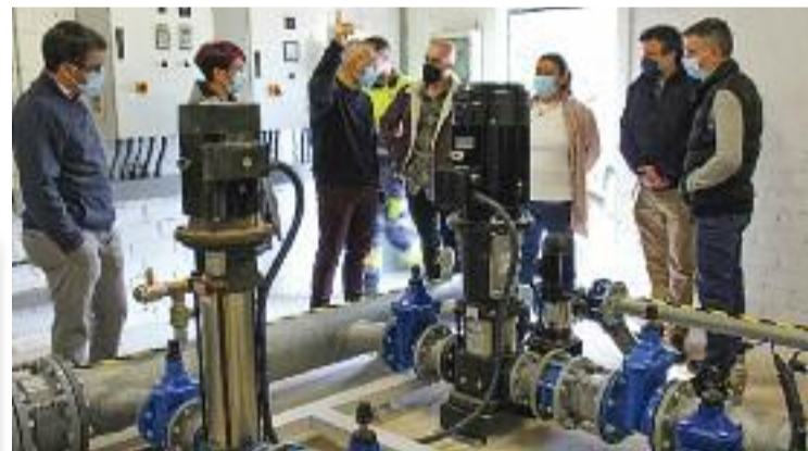
La visita institucional que es va fer a les obres.

Aquest àlbum consolida Rosalía com una estrella global i fa callar els qui sospitaven que podria ser flor d'un dia, que després d' El mal querer no es podria mantenir a dalt de tot del panorama musical. La sesrovirenca té el talent necessari per continuar experimentant i sorprenent durant molts anys.