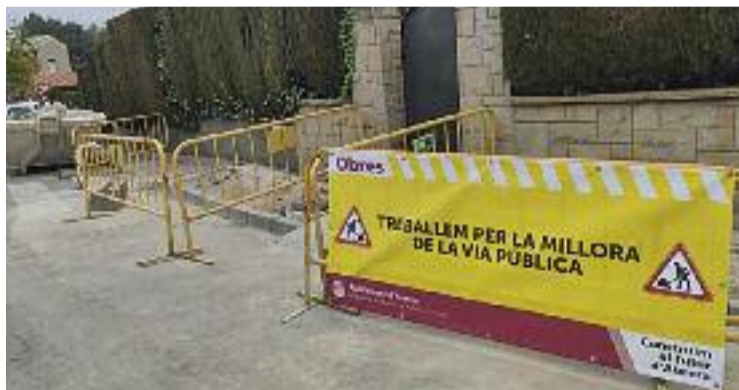
El consistori està fent unes obres per millorar el barri.

Els treballs consisteixen, entre altres, a arreglar el paviment dels set carrers que formen el barri, reparar-ne les voreres, fer-hi nova senyalització tant vertical com horitzontal, millorar-ne l'arbrat i redistribuir els contenidors. Cabido valora especialment l'aposta per reforçar l'accessibilitat dels carrers, rebaixant les voreres perquè hi puguin passar les persones amb mobilitat reduïda. Tot i això, recorda que les voreres són molt estretes i sovint tenen pals d'electricitat i fanals que en reduïen l'espai, de manera que els veïns que van amb cadira de rodes “han de passar pel mig del