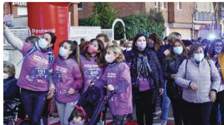
Un moment de la marxa.

va canviar quan, el 2018, diversos veïns van decidir crear l'AV i fer una enquesta per detectar les principals inquietuds del veïnat. Des d'aleshores, assegura, l'Ajuntament els ha escoltat i ha anat per feina per resoldre els problemes del barri, reforçant-ne el manteniment i, sobretot, la comunicació amb els veïns. De fet, els treballs actuals han començat ara perquè la pandèmia els ha anat endarrerint, però ja estaven previstos abans.