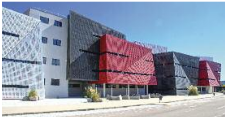
El Centre de Formació Professional d'Automoció de Martorell.