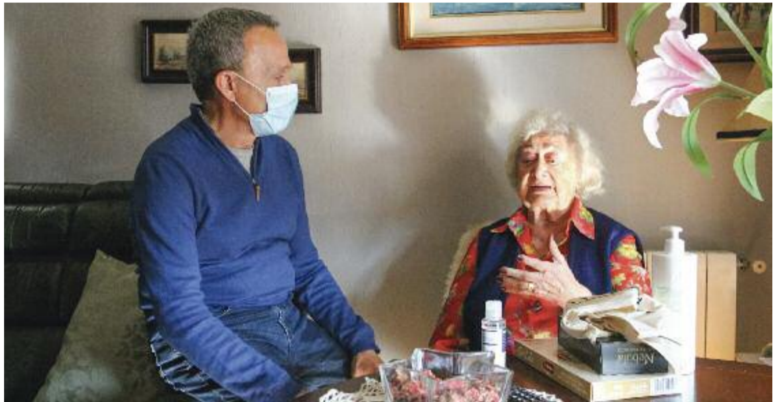
El 52% de la gent gran s'ha sentit discriminada durant la pandèmia.

En gran part, la desaparició de sucursals té a veure amb la digitalització de molts àmbits de