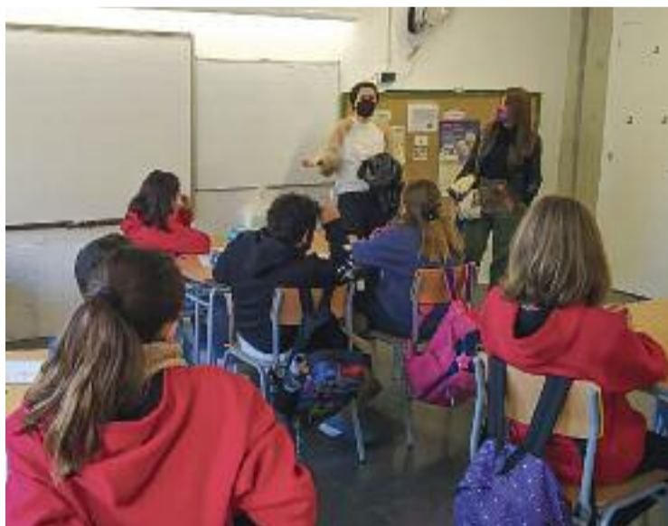
La presentació del projecte 'Els Jardins de les científiques'.

Tot va començar quan l'entitat Luciferases, un col·lectiu de científiques feministes, va oferir a l'Ajuntament fer tallers a les dues escoles del municipi, Mansuet i La Salut, per visibilitzar les dones en la ciència. A més d'acceptar la proposta, des d'Igualtat van decidir aprofitar aquests tallers per fer que els alumnes triïn el nom d'una científica per batejar el parc que tenen davant la seva escola. La idea de seguir-la va comptar amb el vistiplau