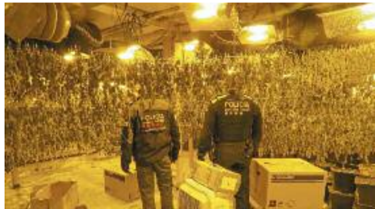
1.800 plantes a una nau del polígon Can Vinyals.

això, el seu triomf va ser inesperat i fins i tot polèmic, i molts eu-rofans van mostrar a través de les xarxes socials el seu desacord amb el sistema de votacions. Davant d'això, l'olesana va decidir deixar el seu compte de Twitter i centrar-se en la preparació de l'actuació que farà a Eurovisió. D'altra banda, ha rebut una allau d'escalf i ànims per part de companys i seguidors, que han volgut destacar el seu talent indiscutible.