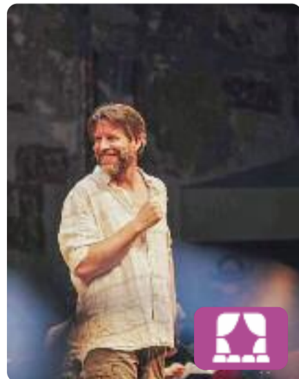
Salvació Total Imminent... Tim Crouch

Salvació Total Imminent Immediata Terrestre i Collectiva és la història d'una família que busca respostes després d'un cataclisme. Un home ha escrit un llibre que ho prediu tot. Ha convocat tots els seguidors en un espai on seuran i manifestaran la seva fe en una cosa que, de fet, ningú sap si existeix. Teniu fe en ell i en el que diu? A la Sala Beckett de Barcelona.