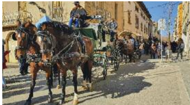
Els Tres Tombs es van celebrar diumenge.

Pel que fa a la sentència del 25% de castellà, s'hi mostra en desacord i considera que "no ajuda en absolut", però subratlla la importància de no interferir en les decisions judicials. "Les sentències, ens agradin o no, s'han de complir", conclou.