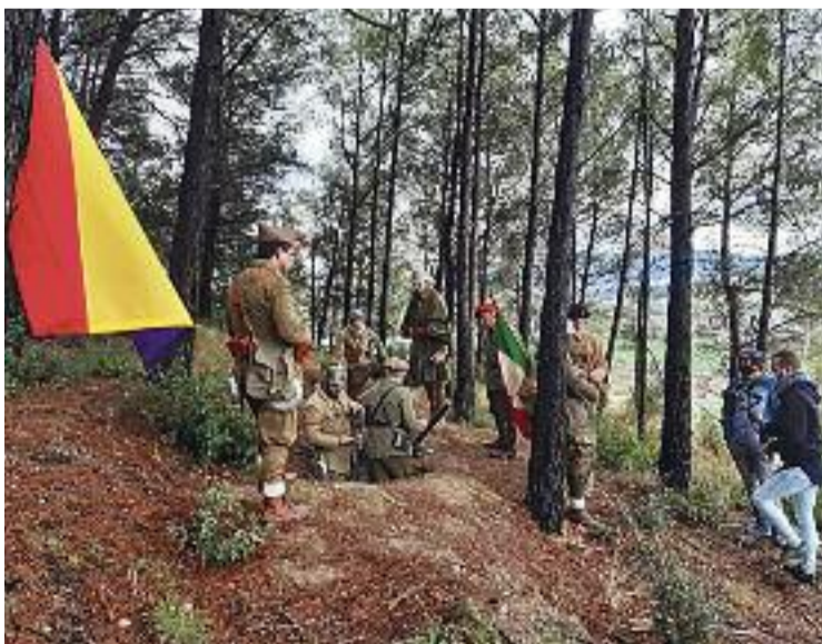
Una recreació de les trinxeres.

L'accés a les trinxeres és lliure i gratuït, precisament, perquè la ciutadania les pugui veure en primera persona i entendre què hi va passar, tot llegint el plafó informatiu instal·lat per la Regidoria de Patrimoni Cultural i Memòria Històrica, que promou la divulgació contra l'oblit.