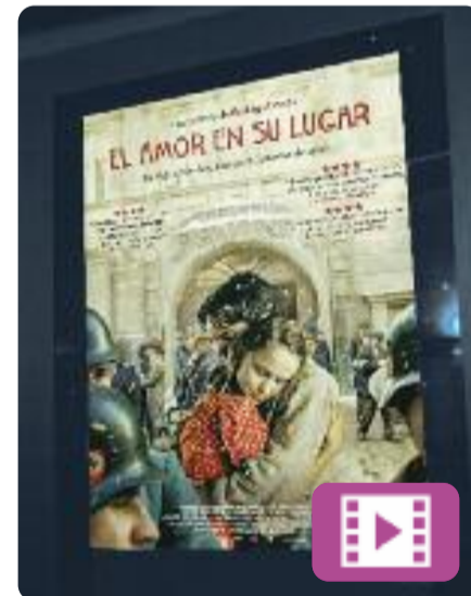
El amor en su lugar Rodrigo Cortés

Gener de 1942. Fa més d'un any que 40.000 jueus de tota Polònia viuen en un gueto. Entre ells, un grup d'actors jueus que una nit interpreta una comèdia musical al teatre Fémina. Els espectadors riuen i s'emocionen, i aconsegueixen oblidar per un moment la seva situació. Mentrestant, els actors s'enfronten a un dilema: podrien fugar-se en acabar la funció?