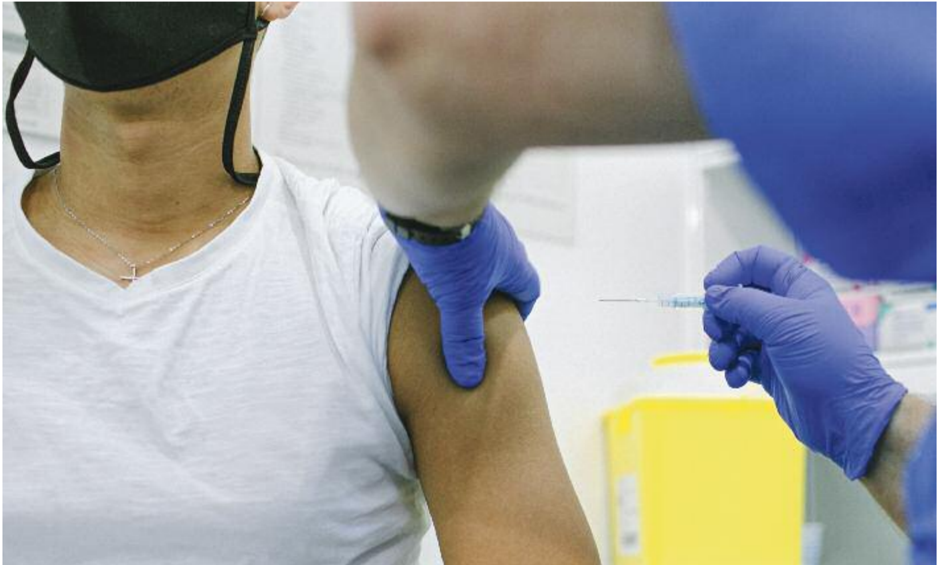
Algunes persones, malgrat tenir la pauta de vacunació completa, veuen disminuïda la protecció, sobretot davant de noves variants com l'òmicron.

► El Departament de Salut ha ampliat a una bona part de la població la vacunació de la dosi de record de la covid. En concret, ja la poden demanar totes les persones de 30 anys o més que van ser vacunades amb Pfizer o Moderna en la pauta completa, sempre que hagin passat 5 mesos des que la van rebre. També se la poden posar tots els joves d'entre 18 i 29 anys que van rebre la pauta completa d'aquestes mateixes vacunes 8 mesos enrere.