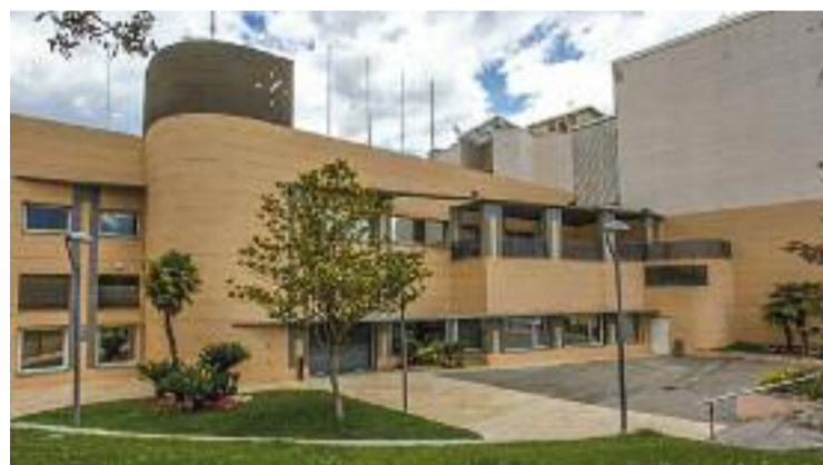
El consistori abrerenc, en una imatge d'arxiu.