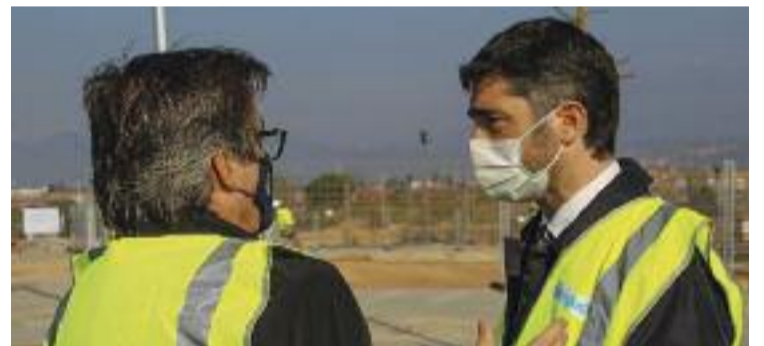
L'alcalde i el vicepresident, en una visita al barri de la Sínia.