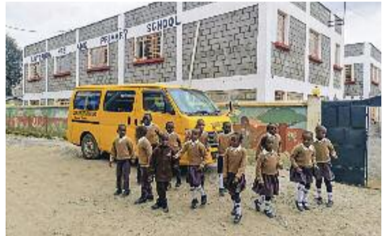
Alumnes de l'escola Lutgarda d'Ongata Rongai, Kènia.

Si finalment obtenen els recursos econòmics que encara els fan falta, els voluntaris de Mans Mercedàries confien a poder assolir el seu propòsit d'inaugurar definitivament l'escola aquest estiu. De moment, el centre funciona només per als cursos d'educació infantil, i la voluntat és que aquest mateix any ja pugui acollir també els alumnes d'educació primària.