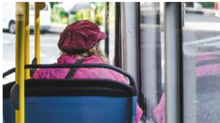
El nou servei facilita la connexió amb Sant Andreu de la Barca.

"ha d'anar acompanyada de la recuperació total dels serveis que es prestaven abans de la pandèmia", com ara les consultes amb la llevadora. En aquest sentit, Salut assegura que el fet de comptar amb més espai "facilitarà" l'ampliació de serveis.