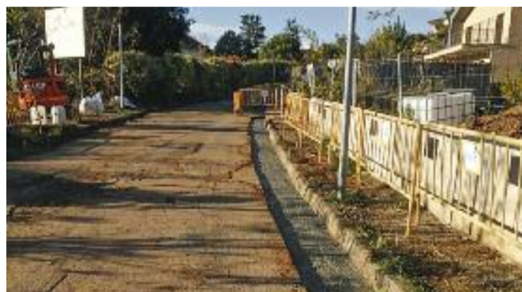
Obres de millora a la xarxa d'aigua.

La responsable d'Igualtat avança que la inauguració del nou nom del parc de davant de l'Escola La Salut es farà cap al 8-M, mentre que en el cas de Mansuet serà pels volts de Sant Jordi.