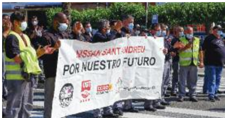
La plantilla de Nissan Sant Andreu, en una imatge d'arxiu.

Segons els plans de reindustrialització, el hub d'electromobilitat –liderat per QEV Technologies i per Btech, empresa amb seu a Martorell– havia d'ocupar la nau de Sant Andreu, a més de la fàbrica de la Zona Franca. Amb les darreres novetats, però, al hub se li ha ofert la