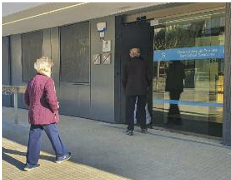
Un moment d'aquest dilluns, primer dia de funcionament.

Entre les novetats, també destaca que, segons el Departament de Salut, es tracta d'un edifici "més ampli, lluminós i confortable" i que permet diferenciar fàcilment els "espais covid i no co-