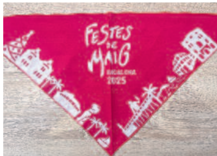
Mocador de les Festes de Maig 2025.

El mar, el foc i les tradicions hi tenen un pes destacat, amb una presència simbòlica molt potent: la figura d’un dimoni d’esquena, situat dalt d’un edifici, que observa com la ciutat s’obre cap al mar i s’omple d’energia festiva.