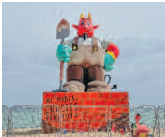
El dimoni plantat a la platja dels Pescadors (esquerra). A la dreta, Piera el construeix.

que solen tenir els dimonis els darrers anys i fa referència a l’esforç dels voluntaris que van ajudar durant les tasques després de la tragèdia de la Dana”, ha ex-