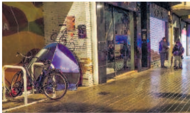
El recompte va tenir lloc la nit de dimarts a dimecres.

El recompte l'han portat a terme 207 voluntaris entre la mitjanit i fins al voltant de les dues de la matinada d'aquest dimecres.