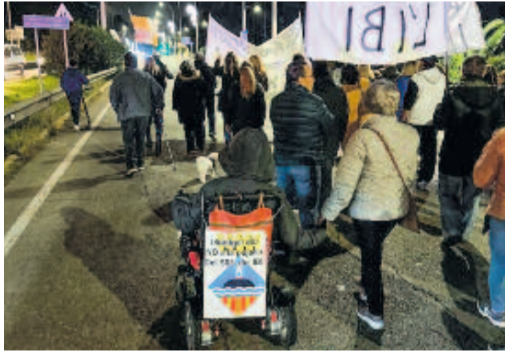
Una de les manifestacions da fa un temps contra la pujada de l'IBI.

El portaveu alerta que, de mitjana, cada llar haurà d'aportar com a mínim 150 euros més