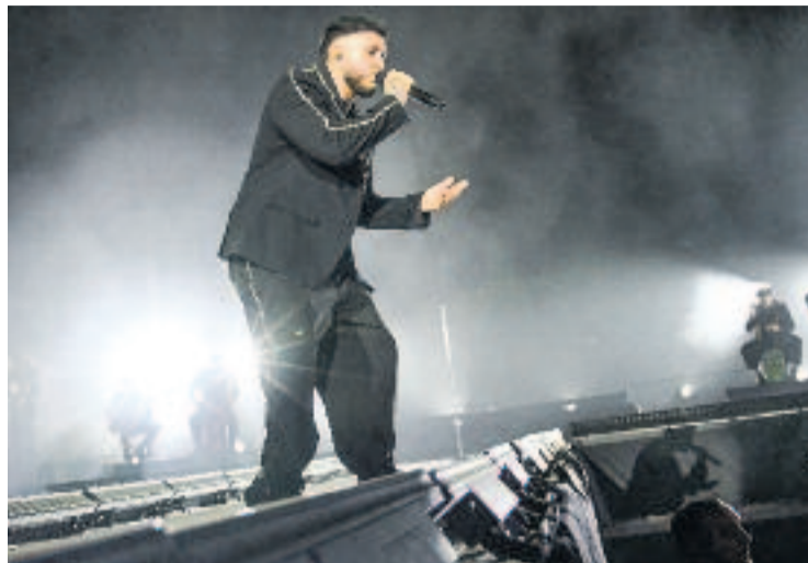
Omar Montes en concert.

Abans d'aquesta edició, els badalonins ja hauran pogut gaudir de concerts de diferents estils a Arts Arnús, al Parc de Ca l'Arnús. El 3 i el 4 de maig van actuar Mama Dousha, Al·lèrgiques al