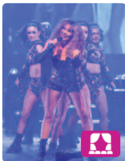
Totally Tina Electric Pulse Productions

Totally Tina és el xou internacional d'homenatge a la reconeguda artista Tina Turner, una de les més potents de la indústria musical. Es tracta d'un espectacle per gaudir d'algunes de les cançons del llegat inesborrable que va deixar, de la mà de la cantant Justine Riddoch, que es posa a la seva pell. El musical es pot veure al Teatre Apolo de Barcelona fins al 25 de maig.