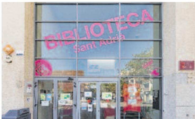
Exterior de la biblioteca de Sant Adrià.

Des del 2008 aquest equipament forma part del Grup de Biblioteques Catalanes Associades a la UNESCO, reconeixement que destaca la seva contribució a la promoció de la lectura i el coneixement. En aquestes cinc dècades, la biblioteca ha experimentat una gran transformació, amb la informatització dels serveis, la incorporació de nous formats com el CD i el DVD, i l'adaptació a les noves tecnologies. Avui dia ofereix una àmplia programació d'activitats, des de clubs de lectura, hores del conte, presentacions de llibres, tallers, exposicions i molt més.