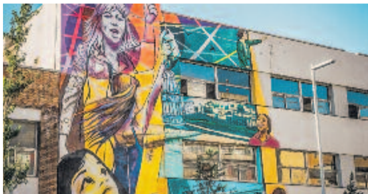
Exterior de la Ciba, una de les seus de les jornades.

El programa es vertebrarà entorn de tres grans eixos: el diàleg davant la polarització, la no-violència com a alternativa a la dissuasió armada, i la memòria com a via per sanar traumes i construir