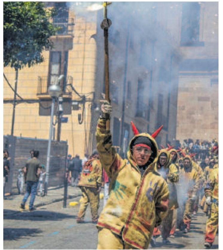
Escenes de les Festes de Maig de l'any passat: el cercavila (esquerra) i els diables (dreta).