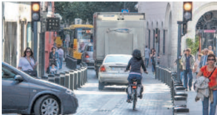
Francesc Layret serà un boulevard.

L'Ajuntament assegura que ha mantingut reunions amb comerciants i entitats veïnals, que han expressat el seu acord amb el projecte. A més, es farà una campanya informativa per detallar les afectacions i millores.