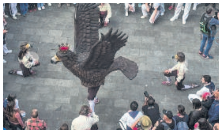
Ball de l'Àliga a la plaça de la Vila.

El final del mes de maig continuarà carregat de cultura popular. El dia 24 se celebrarà el Badabatubèsties al matí i, a la nit, la Festa A Baix a Mar, que aplegarà els veïns a la platja dels Pescadors per fer la tradicional sardinada popular i celebrar el llegat mariner. Amb tots aquests actes, les Festes de Maig es configuren com un espai promotor i perpetuador de la cultura popular badalonina.