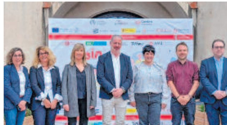
Presentació de la fira GiraFeina.

Amb edicions anteriors en ciutats com Nairobi, Belfast o Zúrich, Build Peace arriba a Santa Coloma com un esdeveniment que reafirma la ciutat com un referent en la promoció de la pau i la transformació social.