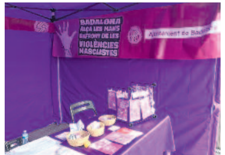
Hi haurà punts liles en esdeveniments multitudinaris.

Pel que fa a la inclusió, el dia 10 de maig, durant els concerts, es facilitaran motxilles vibratòries per a persones amb discapacitat auditiva. Es tracta d'un nou recurs en les Festes de Maig que permet una millor percepció dels baixos i de la percussió. A més, segons cada cas, es poden ajustar les vibracions a la millor experiència per a l'usuari. Aquestes motxilles es poden reservar prèviament contactant al mail cultura@badalona.cat . També hi ha espais reservats a persones amb diversitat funcional a la cremada i als concerts.