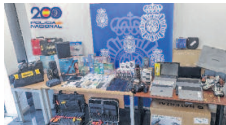
Alguns dels articles intervinguts.