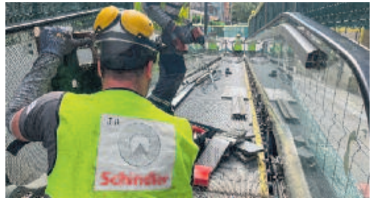
Les rampes acumulen un gran historial d'avaries.

El cost total del projecte és de 716.497 euros i inclou tant l'execució de les obres com el manteniment futur de les instal·lacions. Està previst que les rampes estiguin operatives a finals de juliol o principis d'agost, si les condicions ho permeten.