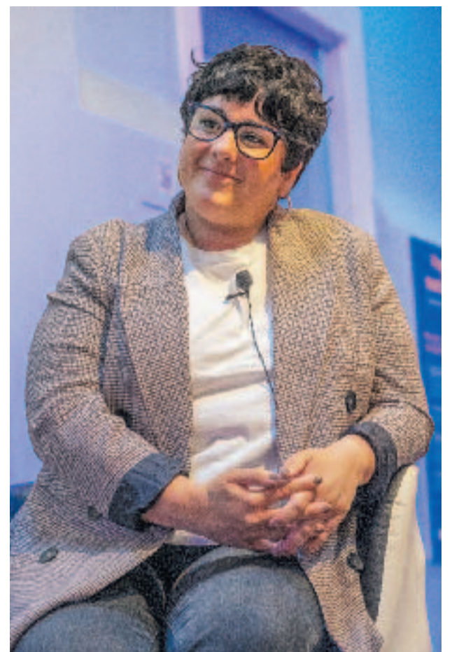
La conversa es va poder seguir en directe a l'Espai Línia.