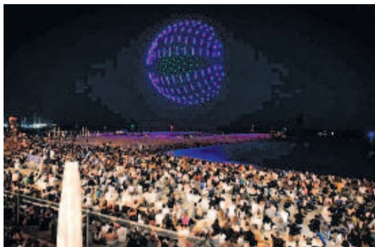
Espectacle de drons de l'any passat.

ESPECTACLE ▶ El govern local aposta per segon any consecutiu per un espectacle amb drons a la programació de les Festes de Maig. En la passada edició aquest espectacle de llums va ser la gran novetat del preludi a la Cremada del Dimoni, en el qual es mostraven figures d'elements característics de la ciutat de Badalona. Enguany, l'Ajuntament no només repeteix l'experiència sinó que reforça la posada en escena amb 500 drons, més del doble que el 2024.