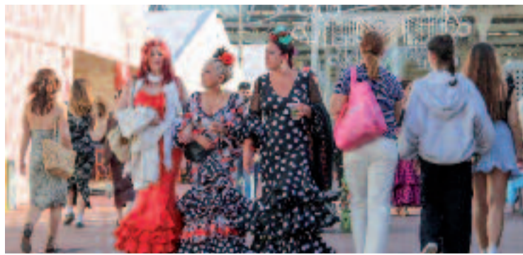
La Feria de Abril arrossega milers de visitants cada any.

Si bé és cert que la primera Feria –la denominació que reben les festes majors dels pobles i de les ciutats andalusos– va tenir lloc el 1972 al local de Via Laietana de la Casa d'Andalusia a Barcelona, l'èxit d'aquesta celebració, impulsada en plena onada migratòria i que servia com a element de reafirmació cultural i, alhora, com a eina per combatre la nostàlgia i el dol migratori, va obligar els impulsors a buscar espais més amplis per fer-la. De fet, el 1973 es va arribar a celebrar a Montjuïc.