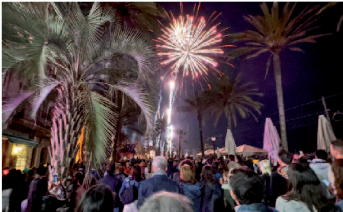
Vista dels focs artificials del 10 de maig de l'any passat des de la rambla.