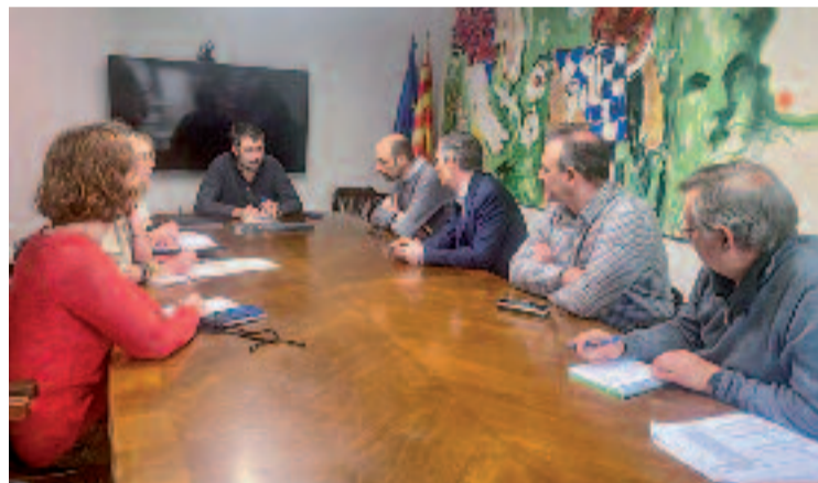
Reunió entre l'Ajuntament i ATL.

El nou dipòsit, que substitueix l'antic, tindrà una aparença cromàtica adaptada al paisatge amb tons sauló, i permetrà millorar el servei d'abastament d'aigua amb un sistema de subministrament alternatiu. Les obres han rebut l'aval ambiental del Parc de la Serralada de Marina i la Generalitat. Paral·lelament, l'Ajuntament ha impulsat un catàleg de protecció d'arbres d'interès local.