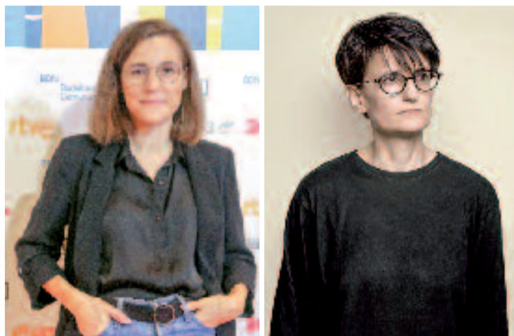
Les badalonines Simón i Cunillé.

La trajectòria de Simón va començar amb èxit, ja que la seva òpera prima, Estiu 1993 , va guanyar el Gran Premi del Jurat a la Berlinale 2017. El 2022 va fer història en convertir-se en la primera cineasta espanyola a guanyar