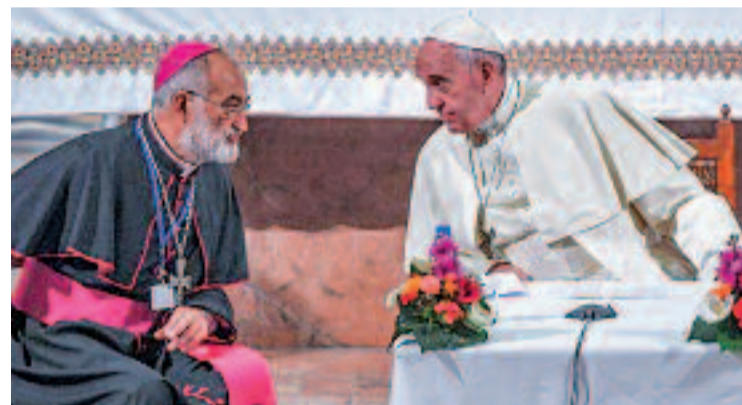
Cristóbal López (esquerra) amb el papa Francesc.

El 2017, el papa Francesc el va nomenar arquebisbe de Rabat, i dos anys després el va nomenar cardenal, destacant el seu coneixement del món islàmic i de les comunitats populars de l'Església a l'Amèrica Llatina.