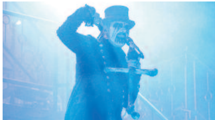
King Diamond al Rock Fest del 2019.

"Una història de superació que emociona, inspira i ens deixa amb ganes de continuar llegint. Aquest és només el començament. Et queda un camí preciós al davant", li va dedicar l'alcaldeessa González.