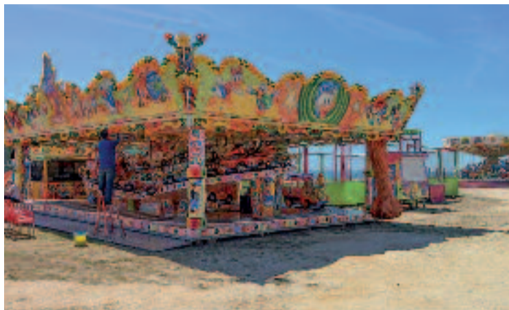
Fira d'atraccions a Montgat d'altres anys.

Els darrers anys, la fira havia requerit una revisió del seu emplaçament per millorar aspectes d'accessibilitat, seguretat i comoditat per a veïns i visitants. Davant d'aquesta necessitat, el consistori, amb el suport del Consell de la Vila, va proposar traslladar-la a un solar situat davant del Poliesportiu municipal. Però, finalment, no hi ha hagut acord amb els firaires. Un fet que no és únic a Montgat, ja que, recentment, a una altra localitat metropolitana, en concret al Prat, un canvi d'ubicació va estar a punt de cancel·lar una fira d'atraccions, atès que la nova