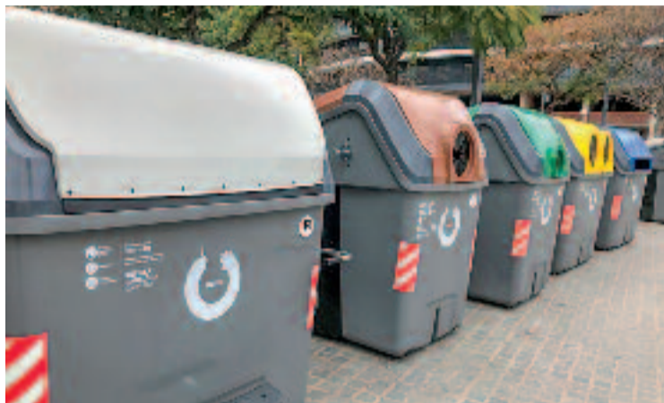
Durant el primer trimestre s'han cremat 28 contenidors.

Aquestes xifres suposen un canvi de dinàmica important després d'anys en què els contenidors cremats són un problema recurrent als carrers de la ciutat. L'alcalde, Xavier García