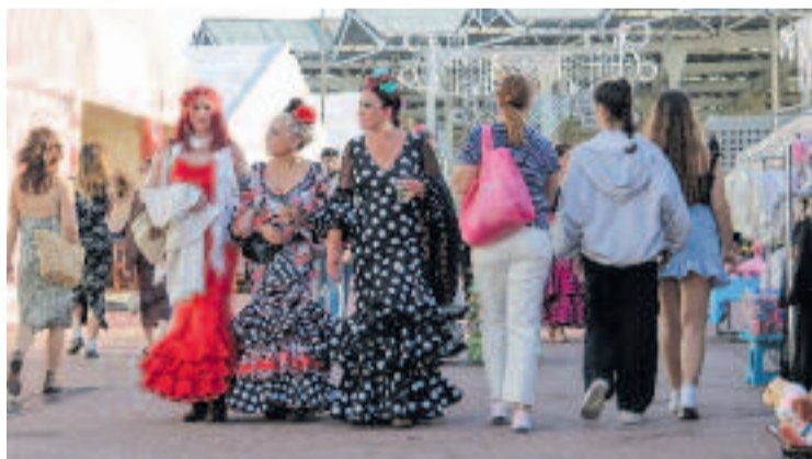
La Feria de Abril és tot un esdeveniment a la metròpoli.

UN CARTELL INSPIRAT EN MIRÓ El cartell de la 52a edició de la