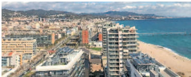
Vista aèria del Front Marítim de Badalona.

En aquesta línia, des de Guanyem reclamen la prohibició "immediata" de noves llicències, la creació d'un cos d'inspectors