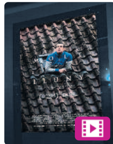
Molt lluny Gerard Oms

El film narra la història d'en Sergi, que viatja a Utrecht amb la família. Però abans d'agafar el vol de tornada a Barcelona, pateix un atac de pànic i decideix quedar-se a Holanda. Incapaç de donar una explicació lògica als seus, talla el contacte amb el passat. A partir d'aquell moment, haurà de sobreviure sense diners, sense casa i sense parlar l'idioma.