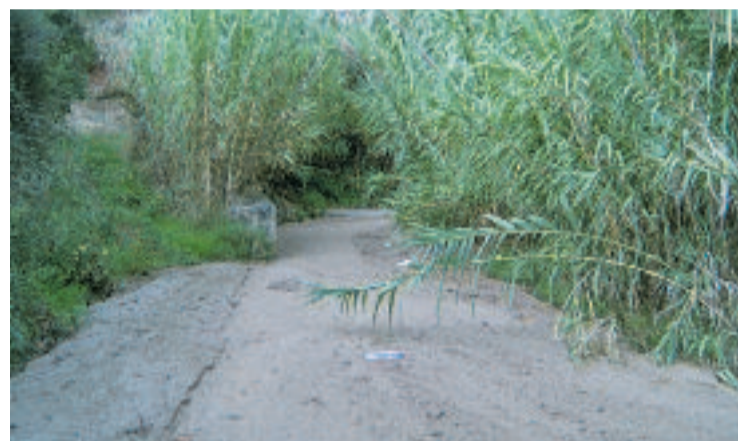
La riera d'en Font.

Fins que no es resolgui definitivament la modificació, queda suspesa la tramitació de nous plans urbanístics derivats, així com projectes de gestió i urbanització. També s'aturen les llicències relacionades amb parcel·lacions, edificació, rehabilitació, enderroc o la implantació d'activitats concretes en l'àmbit afectat. La suspensió tindrà una durada de dos anys a partir de la seva publicació al Butlletí Oficial de la Província de Barcelona.