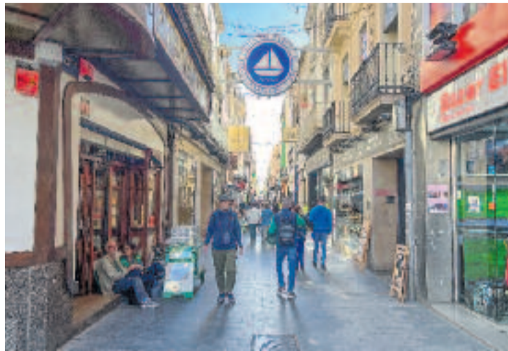
El carrer de Mar, un dels eixos comercials més importants.