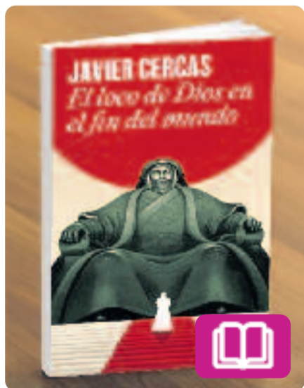
El loco de Dios en el fin del mundo Javier Cercas

Es tracta d'una novel·la que aborda una de les preocupacions fonamentals de la societat actual: el paper de la religió i de l'espiritualitat avui dia i la recerca de la immortalitat. Ho fa partint d'una proposta que li va fer el Vaticà, que, de forma insòlita, li va oferir fer un viatge a Mongòlia juntament amb el papa Francesc.