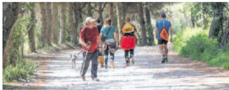
Persones passejant per la Serralada de Marina.

L'origen de la protesta ve del Ple del desembre, quan es van aprovar el catàleg de camins d'ús públic i l'inventari de camins municipals. El plenari va donar llum verda que figuressin la totalitat dels camins de la Conreria i de la Pelleria. L'informe del consistori incidia en el fet "caldria revisar la nomenclatura dels camins". En aquest sentit, destacava "les diferències en el nom" entre el llistat del catàleg i l'inventari municipal.