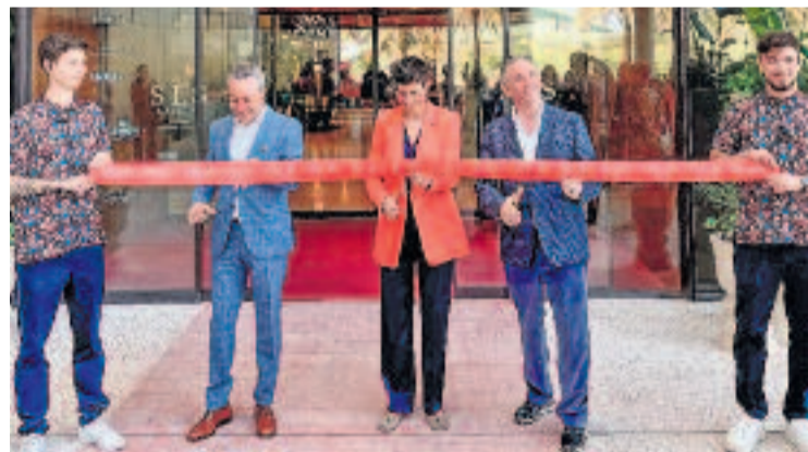
Inauguració de l'hotel.

La 52a Feria de Abril de Catalunya tindrà el diumenge dia 27 d'abril com a 'Dia del Gaspaxxo' que se celebrarà amb el repartiment gratuït de 14.000 racions d'aquest plat, i entre el centenar de casetes d'enguany augmenta el nombre d'entitats associades presents.