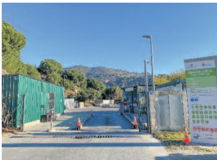
Deixalleria de Tiana i Montgat.

Un altre dels punts reforçats ha estat el contenidor on es gu-