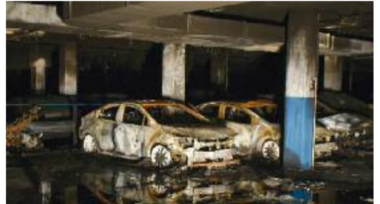
Així van quedar els vehicles afectats al pàrquing.

llora de la vida de les persones”. En clau local, Parlon va mostrar la seva satisfacció amb el programa. “Amb aquestes accions d'impuls a l'ocupació sumem oportunitats a Santa Coloma i això ens fa millors. Felicitem les dones que hi han participat, que s'han empoderat i s'han fet més fortes, i aquesta força és també la nostra perquè la transmetem a la ciutat”, va afegir la batllessa.