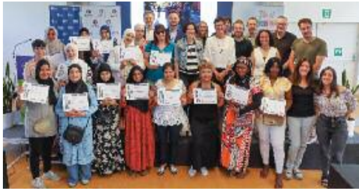
Entrega dels diplomes amb les participants.

Amb aquest programa, que ha tingut lloc des de l'abril del 2023 fins al maig de 2024, s'han ofert accions i formacions laborals a 75 dones, que han aconseguit millorar l'idioma, crear xarxa comunitària i promoure sentiment de pertinença al territori. A més, 19 d'elles han aconseguit una feina. A l'acte de cloenda del projecte, celebrat el passat 21 de juny, van participar Filo Cañete, diputada delegada de Cures i Cicle de vida de l'Àrea de Sostenibilitat Social de la