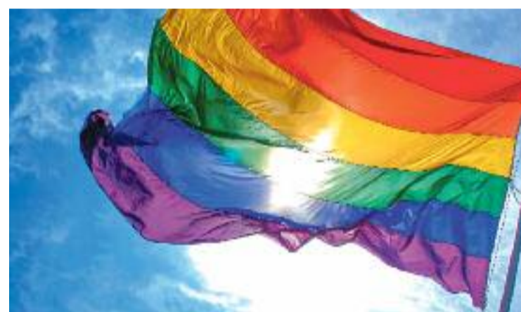
Montgat celebra l'Orgull.

L'Ajuntament també obsequiarà les persones que participin en les activitats amb vanos i polseres.