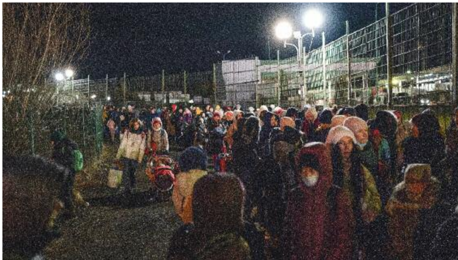
Una munió de persones a la frontera d'Ucraïna el març del 2022, fugint de la guerra.

Pel que fa a les persones refugiades ucraïneses, Catalunya és el segon territori de l'Estat espanyol, per darrere del País Valencià, en nombre de resolucions de protecció temporal, amb 7.398