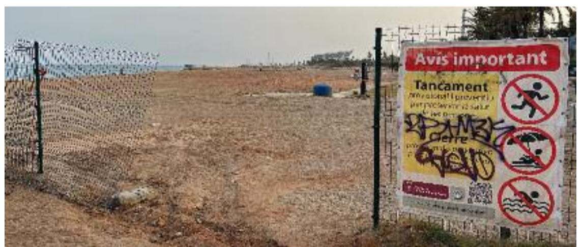
Imatge de la platja del Litoral, tancada.

Entre el 2018 i 2021 es van fer diferents anàlisis que van resoldre que l'ús de la platja no suposava