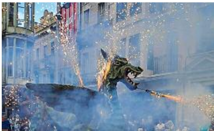
Un moment de la rebuda de la Flama del Canigó.

Pel que fa a l'incident de la revetlla de Sant Joan, les colles que van participar en la rebuda de la Flama del Canigó desconeixen quin va ser el moment i el responsable d'aquest foc. Malgrat això, van ser les primeres a intentar apagar les flames. Des de l'organització, a càrrec d'Òmnium Cultural, reconeixen que darrerament hi ha hagut incidències, però assenyalen que el "problema" no és el foc ni les en-