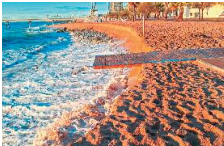
Imatge del litoral badaloní després del temporal.

L'alcalde Xavier García Albiol ha mostrat la seva indignació i ha assegurat que el govern espanyol ha faltat a la seva paraula. "El mes de febrer el secretari d'estat del govern d'Espanya em va assegurar que al juny es traslladaria sorra a la platja de Badalona. Avui diuen la contrària. L'any