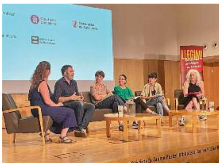
Imatge de l'acte de presentació del projecte.

LECTURA ▶ L'Ajuntament de Tiana va presentar el passat dijous la iniciativa 'Tiana Llegim' en la jornada per al desenvolupament de plans locals i comarcals de foment de la lectura i en la taula rodona sobre bones pràctiques de la Diputació de Barcelona. Aquest pla local de lectura té com a objectiu promoure la lectura en tots els àmbits de la vida. Per fer-ho, s'ha engegat un pòdcast a la biblioteca Can Baratau, es fan presentacions de llibres i s'habiliten racons de lectura pel poble.