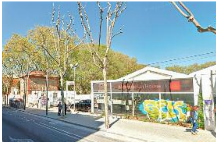
L'espai on s'edificaran pisos al carrer Sant Bru.

Albiol, però, insisteix que la seva tasca és "salvar" només la part esquerra, ja que, segons diu, és la que "és parc de debò". "El meu compromís és que estem