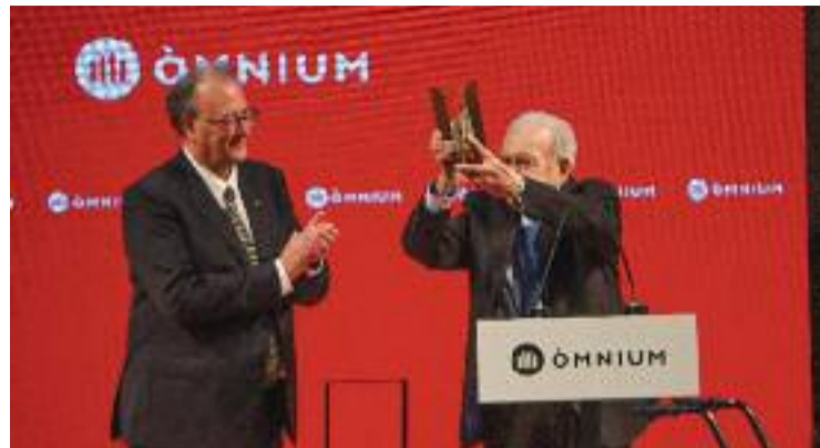
Imatge de l'entrega del premi.

Per la seva banda, la plataforma Ningú Sense Llar Gramenet va insistir en la idea d'un alberg municipal que permeti l'entrada lliure als sensesostre. "S'estan fent coses, sí, però tornem a repetir que hi ha gent en risc al carrer que es pot morir. La qüestió és tenir un recurs al qual puguin accedir quan vulguin. Volem un centre integral", van reclamar des de l'entitat al Ple, a més de proposar Torribera com a espai per a fer-ho.