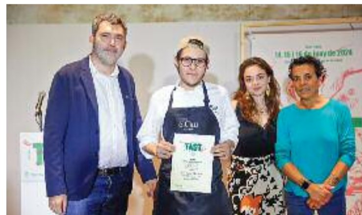
Imatge de l'entrega del Premi Pilar Solà i Puyaltó.