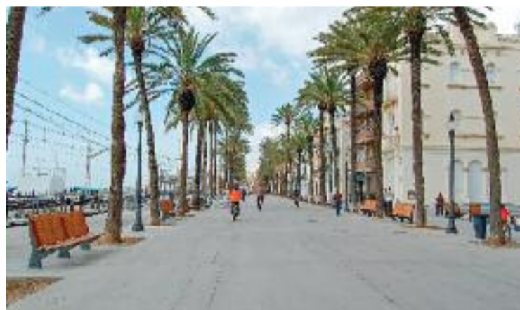
Imatge de la Rambla.

De novembre a febrer els divendres, dissabtes i vigília de festius es podrà tancar a la una de la matinada, mitja hora abans que ara, i els laborables i festius fins a les 12, també mitja hora menys. Tampoc es permet cap classe d'instal·lació o muntatge de la terrassa abans de les vuit del matí.