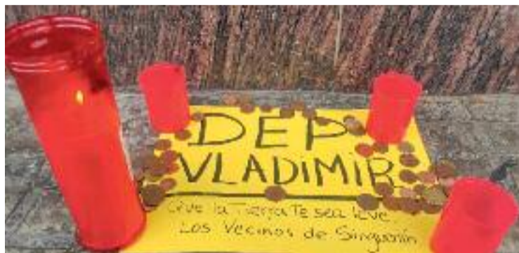
Comiat de l'últim sense sostre mort a la ciutat.