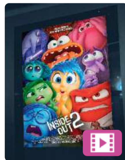
Del revés 2 Kelsey Mann

La pel·lícula protagonitzada per les emocions arriba amb una segona part ambientada en plena adolescència. La Riley, que en el primer film era una nena, es fa gran i les seves emocions passen a ser un còctel explosiu. Al centre de control apareixeran noves emocions com l'ansietat, l'enveja o la vergonya i ho posaran tot de cap per avall.