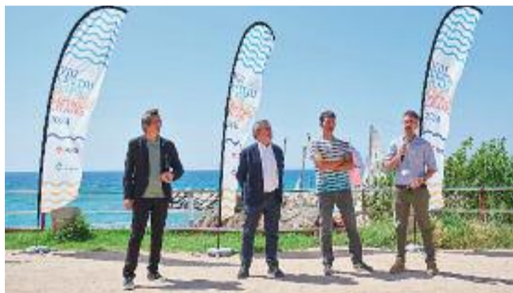
Imatge de la presentació de la temporada de platges al poble.

A més, Absil va lamentar durant la presentació, que va tenir lloc el 18 de juny, que el tancament de les guinguetes té un impacte indirecte en el mercat laboral dels joves montgatins i en la restauració local. I, de retruc, també implica el tancament dels aparcaments i les zones blaves, amb les consegüents pèrdues econòmiques per al consistori. Però aquesta situació no només