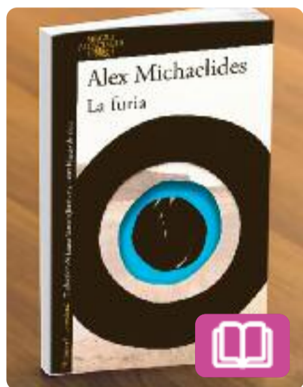
La Fúria Alex Michaelides

El llibre explica una història sobre set persones atrapades en una illa grega. La trama se centra en la resolució d'un assassinat i els seus esdeveniments previs, que fan aflorar tota mena de sentiments entre els protagonistes. Una de les particularitats de la novel·la de Michaelides són els girs de guió i el fet que estigui dividida en actes.