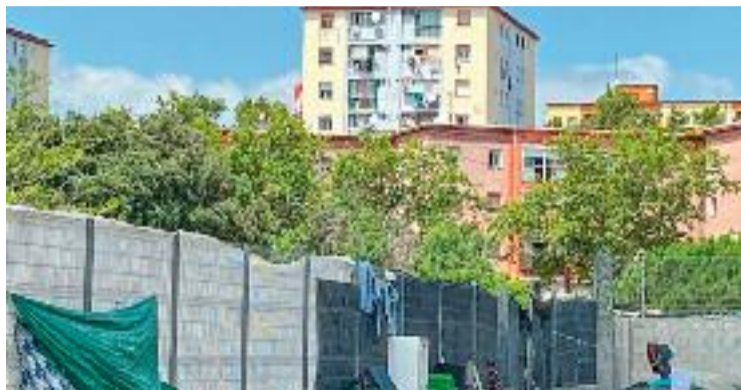
Imatge de l'antic institut B9.

El govern de Xavier García Albiol fa mesos que intenta desallotjar l'antic B9, ja que assegura que és un focus d'inseguretat i incivisme. En una publicació a la xarxa social X, Albiol s'ha congratulat del pronunciament del jutge: "Jo, a Badalona, al costat dels veïns i enfront dels ocupes conflictius". El govern municipal va obrir la via judicial per desallotjar aquest antic institut del barri del Remei de