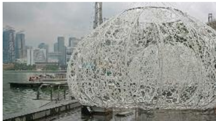
Imatge del projecte Urchins a Singapur.

Malgrat l'esforç, l'adrianenca té clar que li agradaria dedicar-se professionalment a l'actuació durant molts anys. Fins i tot, diu, li agradaria treballar, com a repete, en anglès. De moment, aquest estiu farà un curs d'actuació per continuar millorant i estar preparada per a quan arribi un nou projecte.