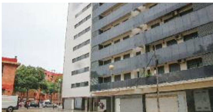
Últim bloc de pisos del procés de reallotjament.

Capella va afirmar que finalitzar el reallotjament suposa resoldre un "deute històric" que les administracions tenien amb els veïns. "És un acte de justícia", va afegir, tot destacant la "qualitat altíssima" dels pisos.