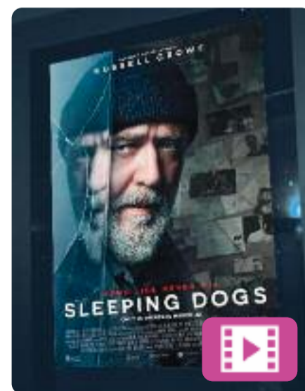
Ombres del passat Adam Cooper

Com a part d'un tractament contra l'Alzheimer, un exdetectiu d'homicidis intenta tornar a investigar pel seu compte l'espantós assassinat d'un professor universitari. Lluitant per recuperar la memòria, descobreix tota una xarxa de contradiccions i secrets que faran que la seva vida canviï per sempre. El protagonista és Russell Crowe.