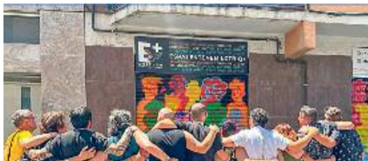
Imatge del comiat a l'Espai Entenem.

Consultades per Línia Nord , fonts municipals asseguren que el retard en l'aprovació del conveni és