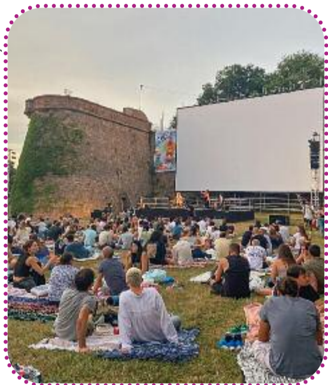
Foto: Sala Montjuïc