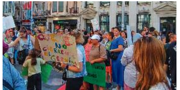
Manifestació dels afectats a la plaça de la Vila.