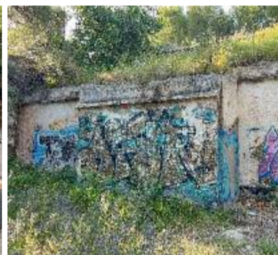
Imatges d'una metralladora i de la part posterior de les instal·lacions on es guardava la munició.

dos búnquers, un a la Riera d'En Font i un altre a la platja de Montsolís, i dos nius de metralladores davant del Turó de Montgat.