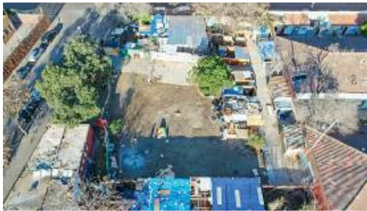
Imatge aèria de l’antic institut B9, on viuen 150 persones.

La defensa d’una part de les persones que hi viuen explica a Línia Nord que l’Ajuntament vol evitar que hi visquin persones vulnerables, quan, recorden, “hi ha gent a l’interior amb discapacitats i en situació econòmica vulnerable”. Destaquen, a més, que el consistori “no ha fet