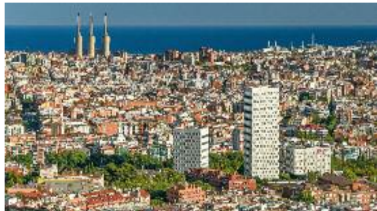
Vista aèria de Santa Coloma.