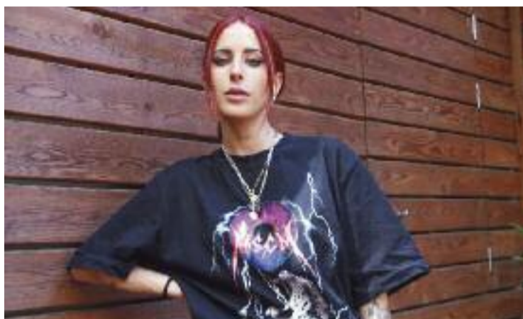
La tianenca va fer el salt a la fama amb 'Nochentera'.

Vicco recorda que tot va començar amb el sotrac vital que va patir fa uns anys en diversos aspectes. En aquell moment passava per una crisi en l'àmbit professional, personal i també sentimental, ja que en aquest darrer cas va haver d'afrontar la ruptura d'una relació molt important.