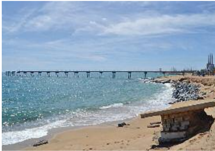
L'efecte dels temporals a les platges de Badalona.

"És imprescindible i urgent que el ministeri faci els passos necessaris per retornar les plat-