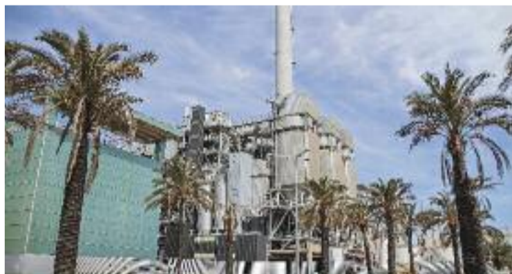
Imatge de la incineradora Tersa.

En la seva resolució, el jutjat considera que "no s'ha constatat que hagi incorregut en cap conducta penalment il·lícita". Sobre si la incineradora va cremar residus per sota de la temperatura legal, explica que en les inspeccions ambientals no s'ha ob-