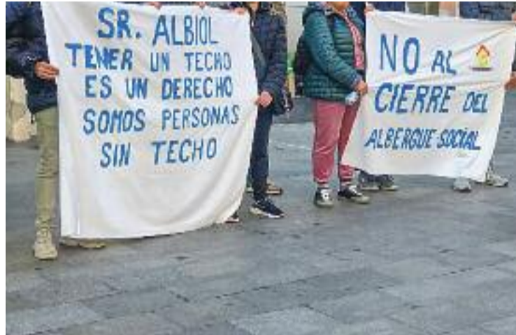
Afectats manifestant-se a la plaça de la Vila.