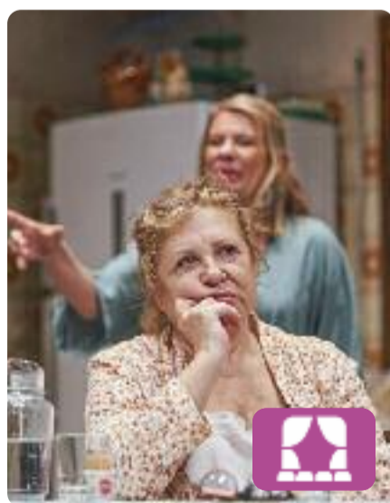
Amnèsia Nelson Valente

Es tracta d'una comèdia sobre les dificultats d'entendre's entre els diferents membres d'una família a l'hora d'enfrontar-se al fet que la mare, puntal de la família, necessita ajuda a partir d'ara perquè ja no pot viure sola. Amb un humor irònic, es planteja aquest tema tan delicat i, a la vegada, tan comú. Es pot veure al TNC (Barcelona) fins al 2 de juny.