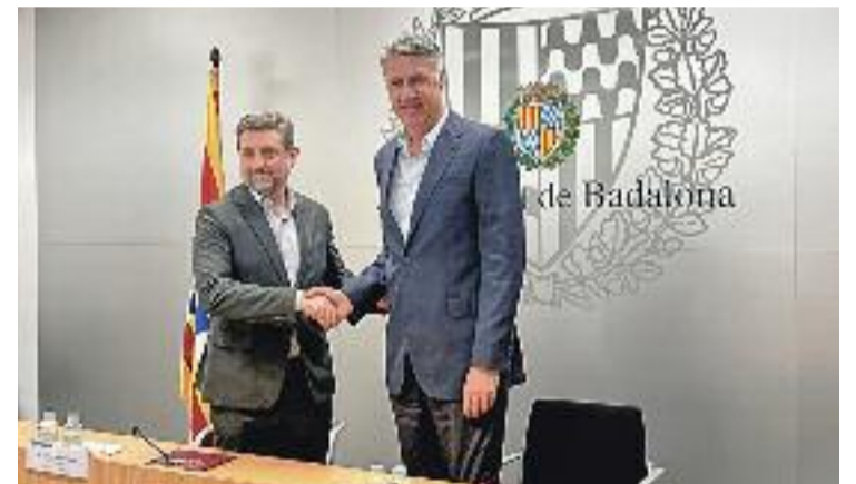
Imatge de l'acte de signatura de l'acord.

del Servei d'impuls Municipal de l'Ocupació (IMPO), farà difusió de les ofertes de treball, gestionarà el procés de preselecció i proposarà els candidats per treballar en el nou centre. "La signatura d'aquest document és una mostra més de la implicació d'aquest govern municipal pel foment de la col·laboració amb les empreses, amb l'objectiu de potenciar la contractació dels ciutadans de Badalona i la dinamització de l'activitat econòmica", va expressar l'alcaldede, Xavier García Albiol.