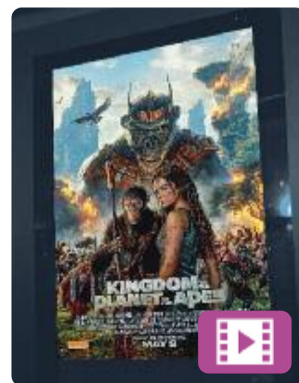
El regne del planeta dels simis Wes Ball

Ambientada en el futur, els simis són l'espècie dominant i els humans s'han vist reduïts a viure a l'ombra. En aquest escenari, un nou líder simi convertit en tirà construeix el seu imperi, però un simi jove el posarà contra les cordes en qüestionar-se tot el que sap sobre el passat. Defensarà els simis i els humans per igual i es crearà un gran conflicte.