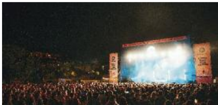
Imatge d'un dels concerts a Can Zam.

El president d'Òmnium Cultural, Xavier Antich, afirma que s'han complert les expectatives plantejades pels impulsors d'aquesta tercera edició, cosa que demostra de nou que el talent i la cultura en català "están més vius