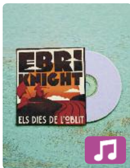
Els dies de l'oblit Ebri Knight