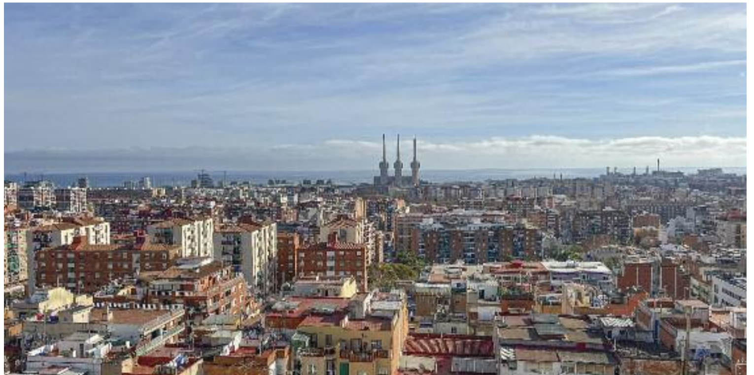
El Barcelonès Nord encara la recta final per a les eleccions de diumenge.

El Partit Popular afronta el repte de traspasar fronteres i replicar el 'Badalonisme' d'Albiol en l'àmbit català. "El funcionament de l'administració, la gestió de la seguretat o la lluita contra l'ocupació és un model de gestió que hem d'estendre. També pot funcionar a Catalunya", afirma Juan Fer-