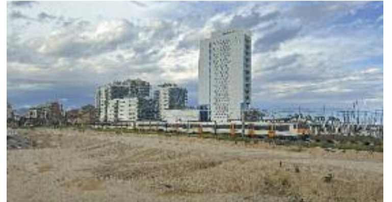
Imatge actual de la zona on s'han de fer les obres.

D'aquesta manera, s'acabarien més de dues dècades d'espera per veure finalitzat un dels projectes més ambiciosos de la ciutat. Un període que ha causat desgast als veïns del barri, tal com van explicar des de l'Associació de Veïns Gorg Mar a Línia Nord . "Ha arribat un moment que ens és una mica igual si ens agrada el resultat final o no. Només volem que s'acabi", expressen.