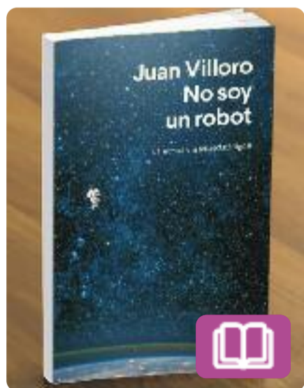
No soc un robot Juan Villoro

Aquesta obra reflexiona sobre com el món digital transforma les nostres vides i la nostra relació amb la lectura. En forma d'assaig, intenta respondre diverses preguntes que tenen a veure amb com influeix la tecnologia en la percepció de la realitat o quin és el lloc en el qual deixa un format d'entreteniment tan important com la literatura.