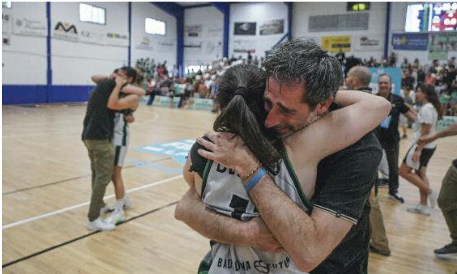
Moments d'emoció entre les jugadores i el cos tècnic de la Penya, instants després d'aconseguir l'ascens.

Teixidó és una figura clau en el grup, en els aspectes esporti-