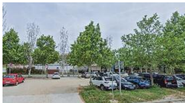
La zona de l'aparcament del cementiri on s'han fet les obres.

Per altra banda, el consistori també informa que ha construït dos graons revestits amb granit a la porta d'accés, per evitar molèsties per acumulació de l'aigua.