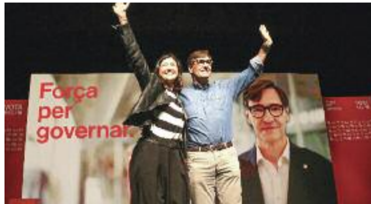
Parlon i Illa en un acte de campanya.