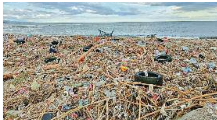
Residus acumulats a la platja el dia 1 de maig.

Des d'Airenet acusen Tersa, no obstant això, d'haver mentit als ciutadans.