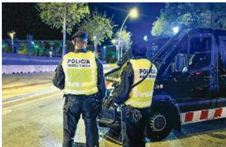
Imatge del dispositiu policial.

Des de fa una setmana, els controls policials compten amb agents de la Brigada Mòbil, ARRO i Seguretat Ciutadana. El dispositiu de Mossos té la col·laboració sobre el terreny de la Guàrdia Urbana de Barcelona i la Policia Local de Sant Adrià de Besòs. Els efectius d'ordre públic treballen per identificar persones en cerca, armes o substàncies estupefaents a través de controls d'en-