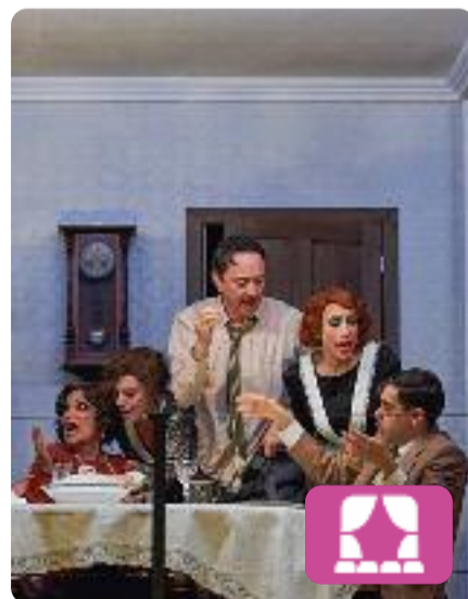
Els criminals Ferdinand Bruckner

El Teatre Nacional de Catalunya presenta aquesta obra sota la direcció de Jordi Prat, que planteja una història que gira al voltant de diversos personatges que comparteixen edifici i que han comès un seguit de delictes que posaran al descobert els errors de la justícia i els límits de les administracions amb l'ús i l'abús de poder. Es podrà veure fins al 22 de maig.