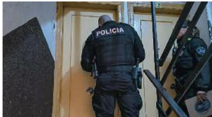
Agents a la porta d'un dels pisos ocupats.

Amb aquesta classe d'iniciatives, els organitzadors volen contribuir a la lluita per trencar la bretxa de gènere a través de la formació de dones en un sector masculinitzat com és el tecnològic, on només el 28% de les persones que s'hi dediquen a Catalunya són dones.