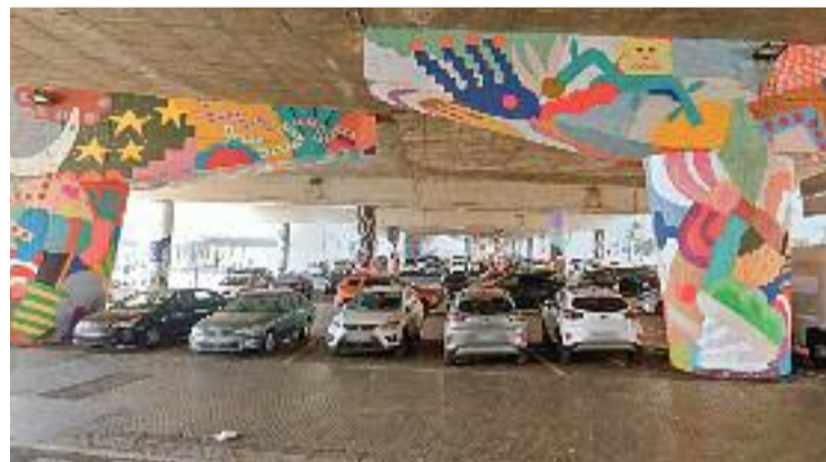
Viaducte de la C-31.