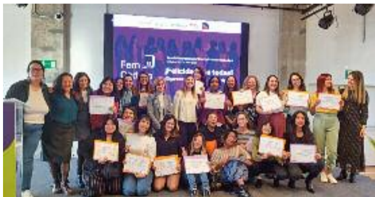
Imatge de l'entrega de diplomes a la Ciba.

El 2020, la Fundació Formació i Treball, Factoria F5, Endesa i