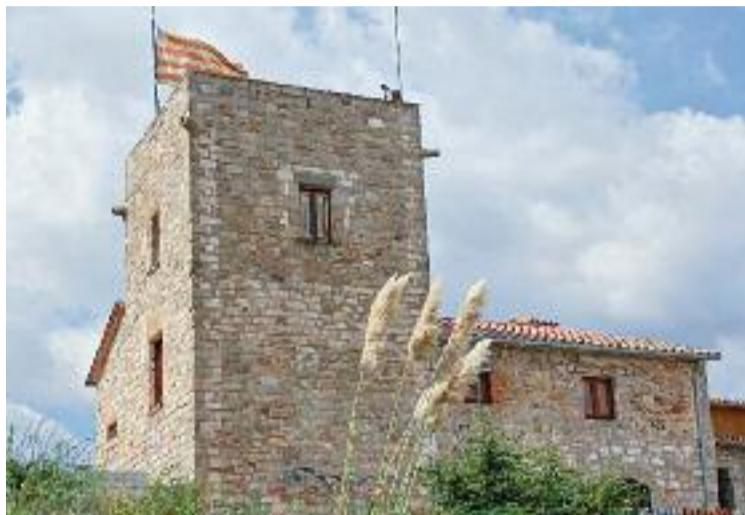
Exterior de Can Bofí Vell.

EQUIPAMENTS ▶ El Centre d'acollida Can Bofí Vell, l'únic públic de la ciutat, deixarà de prestar servei a finals del mes d'abril per impagament per part de l'Ajuntament. Segons va avançar El Punt Avui aquest dimarts, la cooperativa que gestiona l'equipament, Suara, ja no continuarà amb l'activitat perquè el consistori no paga des de l'any 2021, fet que ha generat un deute d'1,7 milions d'euros. Per la seva part, l'Ajuntament de Badalona assegura que està treballant amb els serveis jurídics per trobar una solució per a les persones que pernocten a l'alberg i per pagar el deute a la cooperativa.