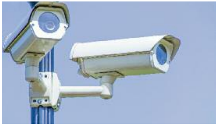
Albiol assegura que les càmeres es licitaran durant aquest any.

Els grups de l'oposició coincideixen que les paraules d'Albiol, per ara, no són més que un anunci. El socialista Fernando Carreira, a més, va celebrar al seu compte d'X la proposta d'actualitzar els sistemes de vigilància de la ciutat. “La modernització de la