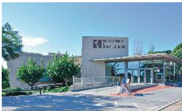
Exterior de la biblioteca, on es fan les sessions: Foto: Biblioteca de Montgat

Per abordar aquestes situacions, el projecte té com a objectiu visibilitzar les dones a través de diferents punts claus: generant espais de crítica i reflexió, afavorint l'autoconeixement, obtenint recursos i preparant-se per a la recerca de feina creant xarxa i espais de suport. 'Dones [in]visibles' està estructurat en tres blocs, i, tot i que no és obligatori passar pels tres,