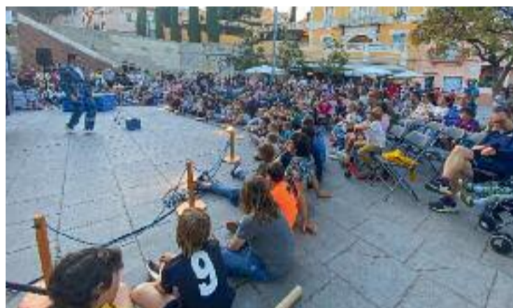
Imatge del Dia Mundial del Circ a Tiana.

Alguns dels actes que es faran al llarg de l'any són la Festa Major petita de Sant Antoni amb Dr. Mascaró, circ en família per Nadal o casalet de circ. Aquest projecte es farà de manera coordinada amb les entitats i acabarà el 2025 amb el JAM de primavera, que tindrà lloc del 15 al 23 de març.