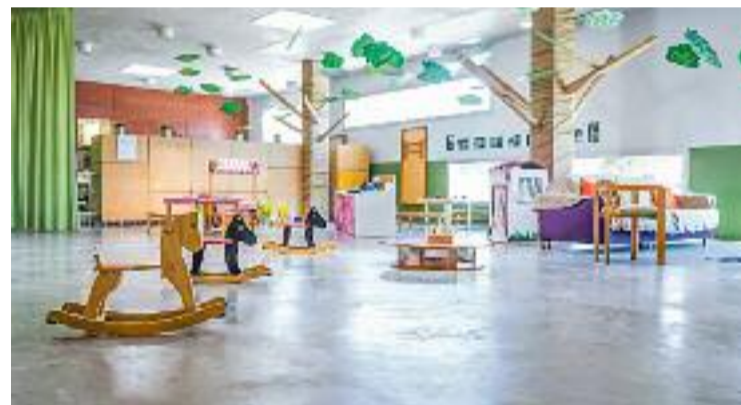
Escola Bressol Uni Dori.