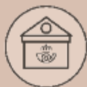
Vot per correu

Per votar per correu, ho has de sol·licitar en una oficina de Correus o entrant a correos.es amb un certificat electrònic reconegut.