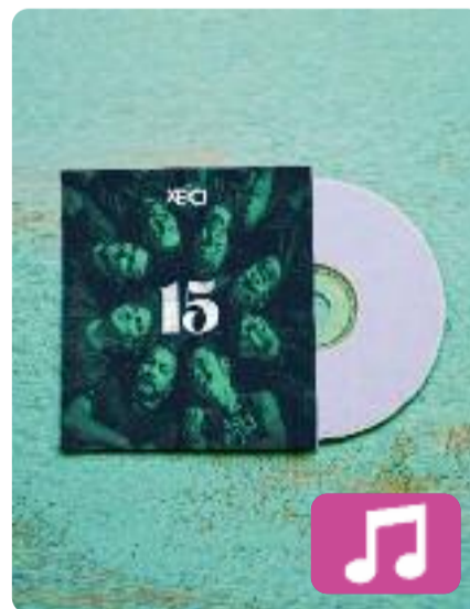
15 anys Xeic!

La banda ebreca Xeic! presenta un treball de cinc cançons inèdites per celebrar els seus 15 anys de trajectòria. Amb aquest disc, el grup posa fi a la seva carrera musical. Les cançons combinen ritmes antics i més moderns com els de la música electrònica, però, a la vegada, mantenen l'estil propi de tons festius que tant caracteritza la banda.