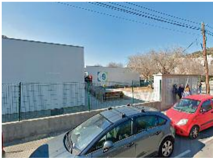
Els alumnes estan en barracons provisionals.

Tot i que el 2023 es va decidir canviar la ubicació perquè la construcció es fes a Can Zam, l'Ajuntament va rebre una subvenció del govern central per construir un centre esportiu. Amb aquest nou equipament, el consistori va assegurar que era molt complicat encabir els dos edificis, l'educatiu i l'esportiu, i es va tornar a replantejar la ubicació del nou institut. Finalment, les obres es faran al barri del Raval.