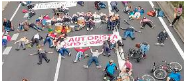
Imatge de la reivindicació a la C-31.

Els assistents van fer un recorregut des del parc de Can Bada, per on van accedir a l'autopista, fins a la sortida dels barris de Sant Roc i la Salut. A mig camí, els presents van fer una performance que consistia a estirar-se terra per representar les 250 morts prematures a l'any que, recorden, es provoquen per la contaminació que es genera a l'autopista. "Es produeixen moltes morts a entorns metropolitans per la contaminació i també sorgeixen malalties com problemes