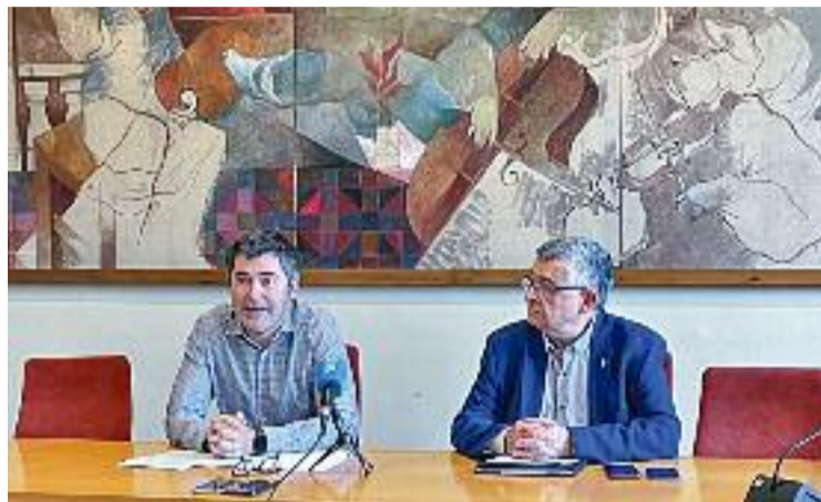
Imatge de la roda de premsa.

En aquest s'especifica que fins a l'abril del 2025 no es permetrà cap actuació a les 26 cases actualment catalogades al centre històric ni als espais inclosos en l'àmbit on es treballa el nou pla de protecció patrimonial. I és que el govern ha aprovat