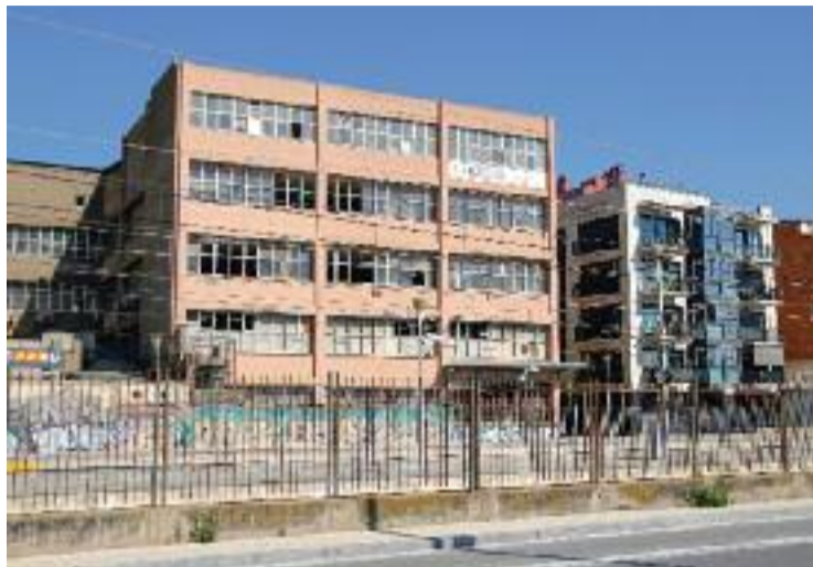
Façana de l'antiga fàbrica Mobba.

Consideren, a més, que per la seva part ja han complert la missió de situar el focus "en un lloc emblemàtic de la ciutat", i que ara és temps perquè govern local i els regidors "moguin fitxa".