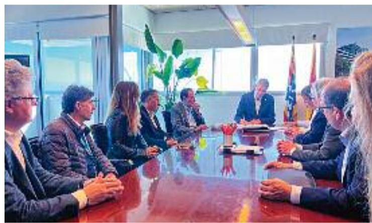
Imatge de la signatura del contracte.

dalona. Unes obres que, recordem, començaran amb retard. El setembre de 2023 el batlle es va reunir amb la presidenta d'Adif i va assegurar que ja estarien en marxa a finals de 2023. Per a Albiol, aquesta obra marcarà un abans i un després a la ciutat. "El canal esdevindrà un espai singular sense comparació en el nostre entorn, permetrà transformar tota la ciutat, crear una nova centralitat urbana i connectar directament els barris més propers a la muntanya amb el port i la façana marítima", diu.