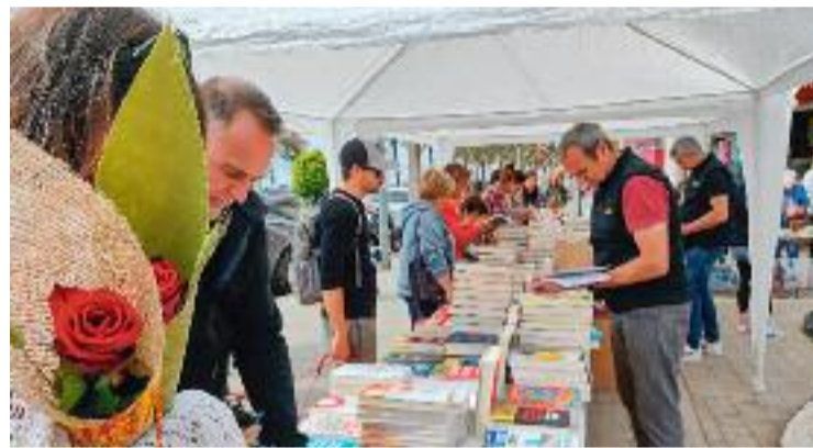
Diada de Sant Jordi de l'any passat a Montgat.

El matí del 21 d'abril serà amenitzat amb les Matinades pels barris, seguides d'un esmorzar i jocs infantils a la plaça Pere de José i Hermens. Com no pot ser d'una altra manera, l'epicentre de la celebració serà el 23 d'abril, amb la clàssica venda de roses i llibres a la plaça de les Mallorquines. Ja el cap de setmana del 27 i 28, entraran en escena els gegants, el castell de focs i la Jornada Castellera.