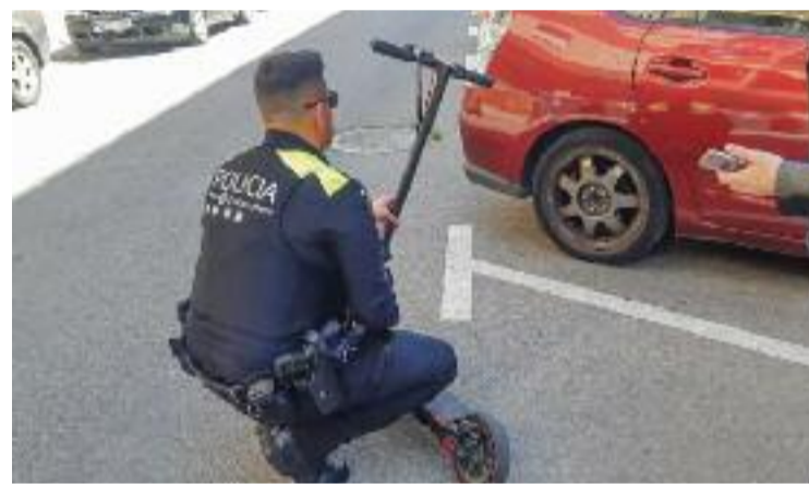
Un agent de policia revisant un patinet.

amb la normativa. Aquest cas se suma a diverses interceptacions a Santa Coloma relacionades amb els patinets elèctrics. A finals del gener, la policia va enxampar un altre conductor d'un patinet elèctric manipulat en un control de vehicles. Els agents van veure que el sistema de limitació de velocitat estava manipulat i permetia aconseguir una velocitat punta màxima de 98 km/h. Les velocitats d'aquests casos superen quatre vegades la velocitat màxima permesa per patinets, que com hem dit és de 25 km/h.