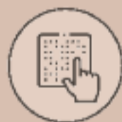
Kit de vot braille

Si tens una discapacitat visual, pots demanar el kit de vot braille trucant al telèfon gratuït 900 500 912 .