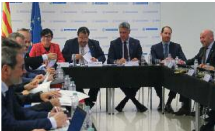
Imatge de la Junta Local de Seguretat.

Albiol va expressar que més enllà de "no poder estar satisfet mentre hi hagi veïns de la ciutat amb problemes de seguretat, des del punt