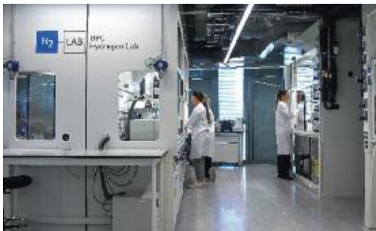
Imatge del nou Laboratori de l'Hidrogen.

Aquest Laboratori de l'Hidrogen també estarà obert a indústries que necessitin fer proves relacionades amb hidrogen per a “superar la travessia del desert” que hi ha entre desenvolupar una idea i la seva sortida al mercat. De fet, el laboratori ja té encàrrecs de sis empreses energètiques i automobilístiques. Aquesta infraestructura científica “capdavantera” farà servir hidrogen i electricitat generada al mateix edifici, on s'ha instal·lat una planta pilot de producció. El laboratori té 12 estacions de prova i la cambra ambiental per provar sistemes a condicions extremes, d'entre 70 graus i 20 sota zero, amb una potència màxima de fins a 100 kW.