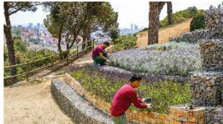
Imatge d'un dels projectes d'ocupació.

El mateix 25N es farà un acte unitari a la plaça de la Vila a les 10:30 i a les 12 tindrà lloc la concentració i lectura del manifest.