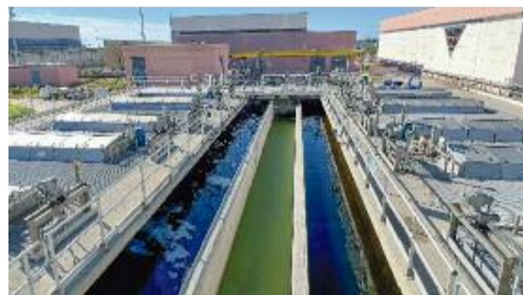
Estació de regeneració d'aigua del Prat de Llobregat.