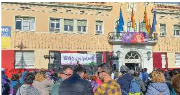
La plaça de la Vila, el 25N de 2022.

La batllessa posa d'exemples la segona fase de la Ciba, l'ampliació dels serveis d'atenció integral a les dones, la posada en marxa del nou espai residencial