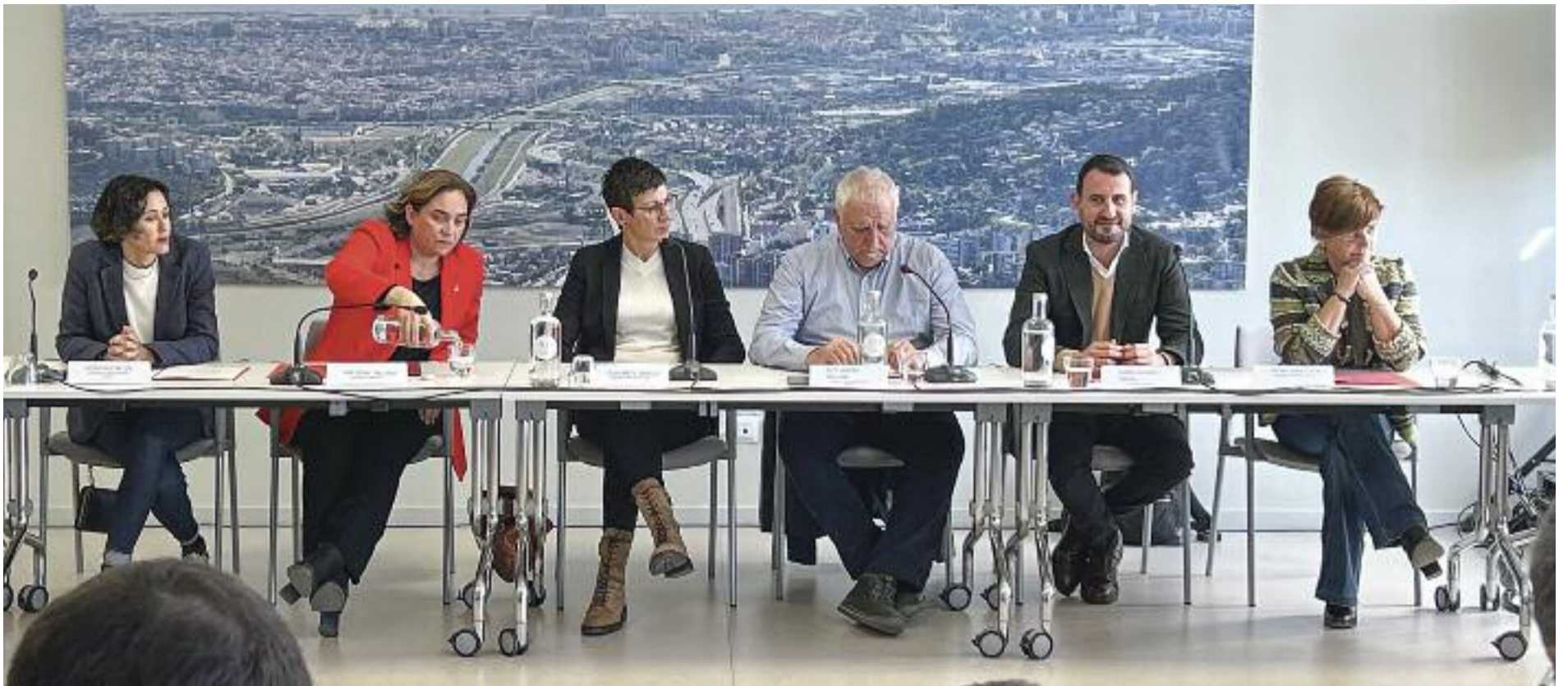
Imatge de la trobada del desembre de 2022 entre les cinc alcaldies i la coordinadora per signar el full de ruta.