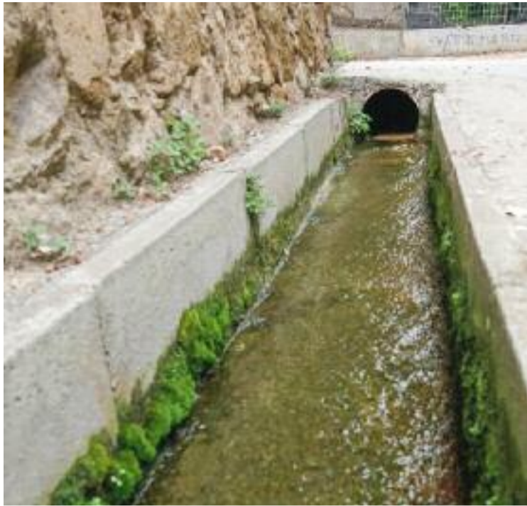
Imatge del punt de sortida de l'aigua, a Canyet.