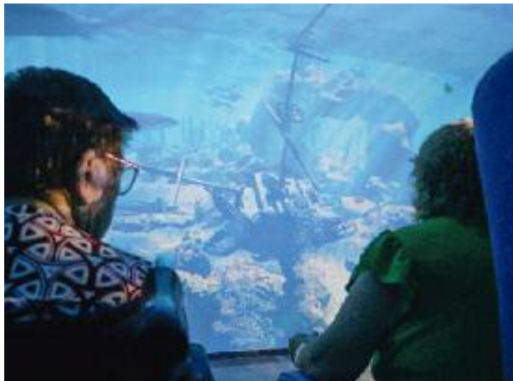
Sala immersiva del Centre Sociosanitari el Carme.

Ferré també va subratllar que es tracta d'una iniciativa "innovadora" en l'àmbit socio-sanitari. A la vegada, en el mateix centre, i també amb l'ús de la realitat virtual, es duu a terme un programa per atendre menors amb trastorn de l'espectre autista (TEA). Ferré va destacar que "entren en joc les emocions, i el pacient es deixa anar gràcies a un ambient motivador". Les projeccions poden ser de tot tipus, com per exemple imatges del poble dels usuaris o un passeig per un entorn familiar. Gràcies a la tauleta, "es pot resseguir el moviment amb les imatges" com si el pacient anés en bicicleta, pugés una muntanya o anés amb caiac, entre d'altres.