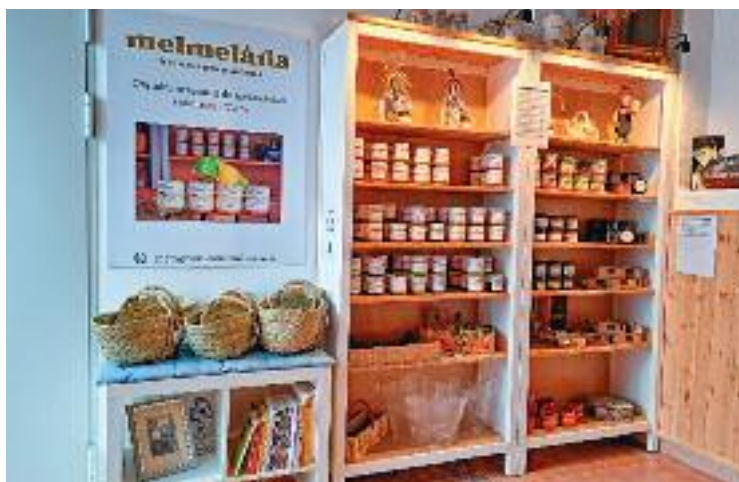
El nou espai de venda de Mermelària.

MERMELÀRIA, UNA CASUALITAT L'origen de Mermelària no neix d'una idea de negoci. La seva creació va ser una casualitat. Martorell va plantar maduixes del Maresme a un hort a casa seva i va decidir fer mermelada per aprofitar la