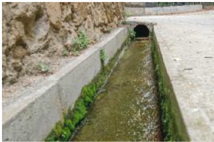
Inici de la sortida de l'aigua, al barri de Canyet.

Es tracta d'una fuga en el recorregut que connecta la planta potabilitzadora del Ter amb el centre de distribució de Trinitat, i Albiol va assenyalar que s'ha trobat l'origen a l'àrea de la masia de Can Coll. L'obra s'allargarà unes dues setmanes i, segons l'alcalde, el seu cost "no serà molt elevat". El popular va explicar que l'aigua es destinarà al reg "d'una part important" de la ciutat i va recalcar que s'actuarà al terme municipal de Badalona.