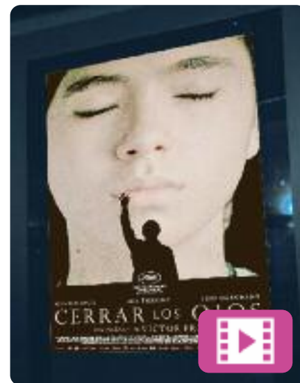
Cerrar los ojos Víctor Erice

Un famós actor espanyol, Julio Arenas, desapareix durant el rodatge d'una pel·lícula. Tot i que mai se'n troba el cadàver, la policia conclou que ha patit un accident a la vora del mar. Molts anys després, el misteri torna a l'actualitat arran d'un programa de televisió que pretén evocar la figura de l'actor, oferint en primícia imatges de les últimes escenes que va rodar.