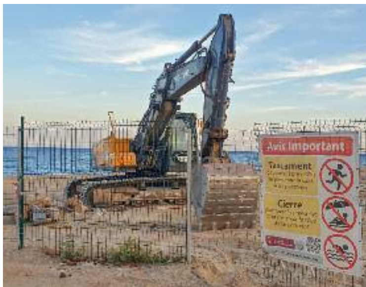
Tornen els treballs a la Platja del Litoral.

Ara, amb els treballs ja en marxa, el consistori adrianenc espera escurçar aquests terminis, ja que per Cañete aquesta previsió desconeguda perquè, assegura, en cap moment se li va traslladar des del ministeri. La batllessa, però, explica al mateix diari que confia que en uns 10 dies des de l'inici de l'actuació Emgrisa, l'empresa encarregada de la descontaminació, informi l'Agència Catalana de Residus perquè comprovi la zona on s'havia detectat l'alteració. Unes restes "superficials", tal com va comunicar la socialista, i que estarien en la