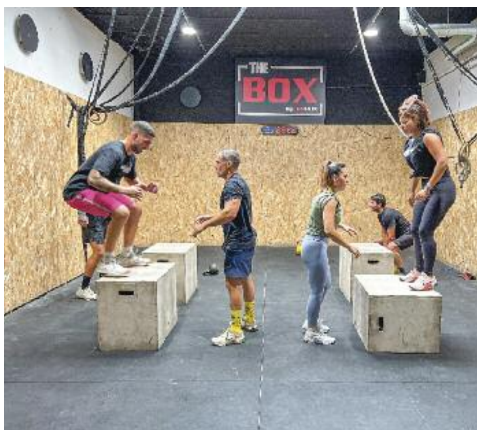
La pràctica esportiva i una dieta saludable són qüestions que sovint varien en funció de l'època de l'any. Fotos cedides