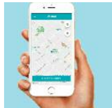
Imatge de l'aplicació.

D'aquesta manera, els ciutadans podran abonar el pagament de les zones blaves de Sant Adrià a través dels seus dispositius mòbils. De fet, l'objectiu d'aquesta eina, segons l'AMB, és unificar el model d'aparcament regulat de la metròpoli de Barcelona.