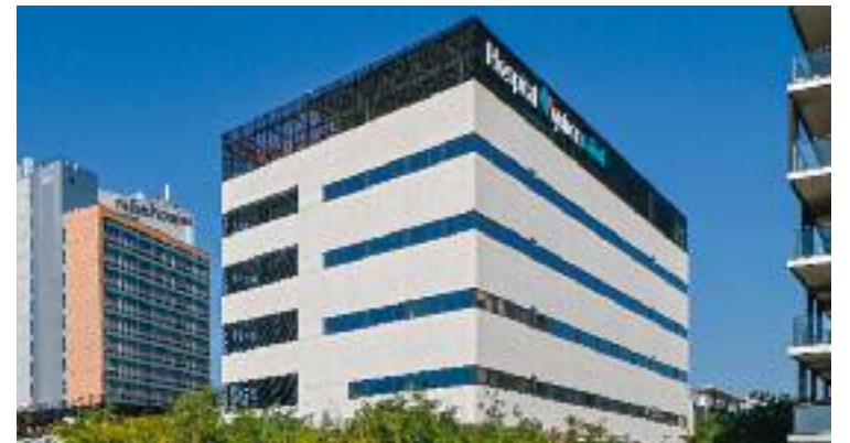
Exterior del nou hospital.

El nou hospital disposa d'una cartera assistencial amb 35 especialitats mèdiques i quirúrgiques i consultes externes, quiròfans i hospitalització. Té 72 habitacions individuals, 6 quiròfans, 6 boxs UCI, 12 boxs REA, 10 habitacions d'hospital de dia quirúrgic, 36 consultes, 2 sales d'endoscòpia i una completa àrea de diagnòstic per la imatge.