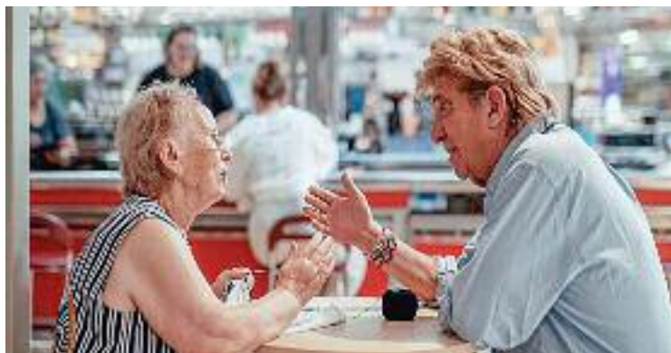
Trobada del programa 'Sempre Acompanyats'.

Aquesta col·laboració entre Creu Roja i el consistori colomenc ha permès que 20 voluntàries atenguin aquestes persones que viuen en els barris de Can Mariner, Centre, Cementiri Vell, Llatí, Riera Alta, Riu Nord i Riu Sud. "L'objectiu és empoderar les persones grans en situació de soledat posant-les al centre, com a subjectes actius del seu procés d'envelliment, i acompanyant-les en la