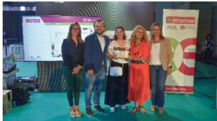
Representants del punt local Reempresa de Santa Coloma.

El programa està present a 13 territoris d'Espanya i també ha aterrat a Lisboa i Porto. El desenvolupament del programa a Catalunya aquest 2023 ha estat possible gràcies a la implicació de 140 entitats socials, 218 professionals i 172 persones voluntàries.