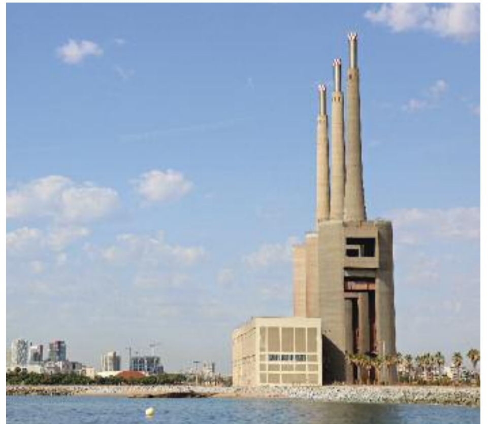
A l'esquerra, la presentació de la campanya de micromecenatge per a la via judicial contra el pla de les Tres Xemeneies.