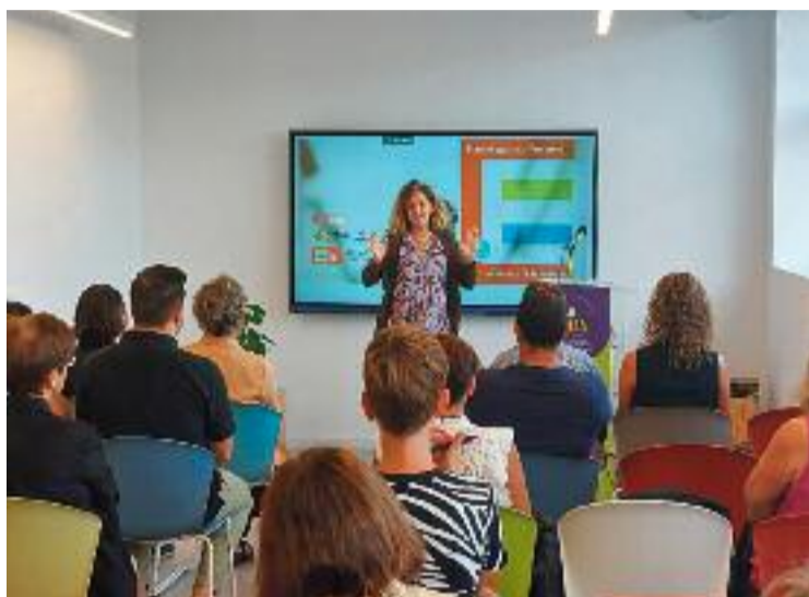
Acte inaugural del curs Plans d'Igualtat.

“Davant d'aquesta demanda creixent de les empreses per incorporar la igualtat com a eix de la seva governança i amb el convenciment que els plans d'igualtat són un instrument molt valuós per transformar la cultura empresarial, volem formar persones professionals que siguin capaces d'acompanyar i guiar les empreses en l'aplicació transversal de la igualtat com a eix vertebrador de totes les decisions”, expliquen des de l'organització. Les persones que participin en el curs treballaran en la diagnosi i en el disseny d'un pla d'igualtat de la