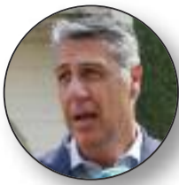
Xavier G. Albiol

L'alcalde de Badalona, Xavier García Albiol, ha creat una polèmica després de dir que "amb nacionals d'alguns països tenim un problema seriós" després de denunciar un delictes. L'oposició ha parlat de "discurs d'odi" i "xenofòbia". pàgina 8