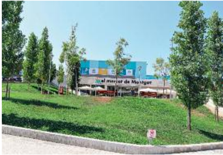
Mercat de Montgat, on hi ha diferents comerços de l'ACISM.