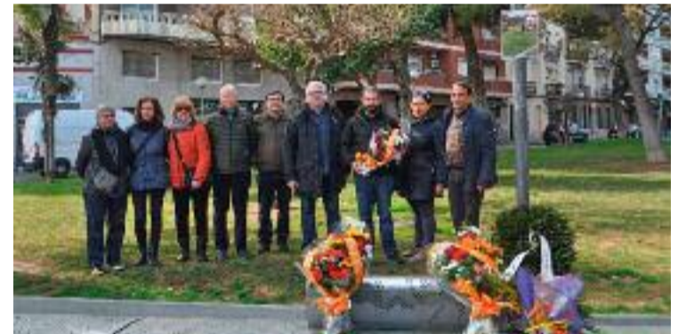
Commemoració de l'afusellament de Xifrè.

Línia Nord ha intentat obtenir una valoració de l'Ajuntament sobre aquesta qüestió, però no ha obtingut resposta.