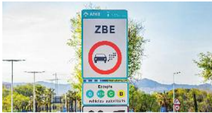
Cartell de ZBE a l'àrea metropolitana.

En una entrevista a TV3, la ministra per a la Transició Ecològica, Teresa Ribera, anunciava que el