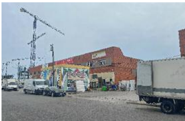
Exterior de la nau ocupada al carrer Antoni Bori.