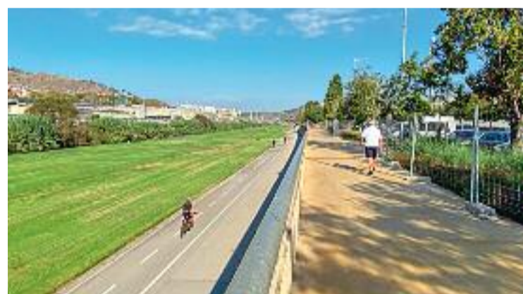
Panoràmica de la llera del Riu Besòs a Santa Coloma.

Finalment, a finals de juliol va acabar la fase 2 de Can Zam entre el nou vial d'Anselm de Riu, el carrer Víctor Hugo i el parc actual. Des del consistori asseguren que s'ha millorat “la qualitat ambiental i l'espai públic” amb l'eliminació de la tanca i amb la creació de zones verdes.