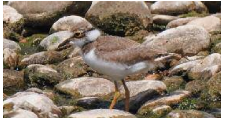
Exemplar de Coriol petit al parc fluvial del Besòs.

Tot i l'èxit d'aquestes espècies, la Xarxa de Parcs ha lamentat la mort d'una serp blanca possiblement provocada per una pedrada. Recorden que no són verinoses i que, a més, són beneficioses perquè s'alimenten de rosegadors.