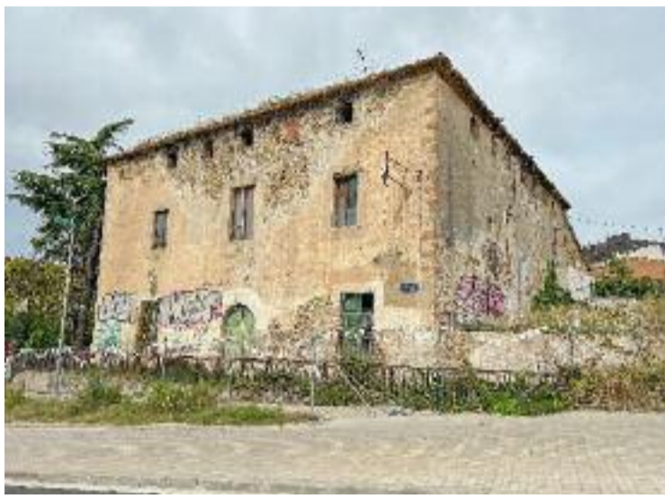
Una de les peticions és que sigui un centre sociocultural.

Un incident que no va anar a més, però que ha provocat la reacció de la plataforma Salvem Ca l'Andal i d'altres associacions veïnals que fa anys que reclamen la rehabilitació d'aquest equipament. "L'incendi d'avui és un fet greu. Com a ciutat no ens podem permetre que torni a passar i arriscar-nos a perdre més patrimoni. Cal que la masia de Ca l'Andal es rehabiliti amb urgència i evitar, així, que el seu estat d'abandament la continuï posant en perill", expressaven des de la plataforma Salvem Ca l'Andal a través de la xarxa social X. D'altra banda, l'Associació de veïns de Bufalà va expressar