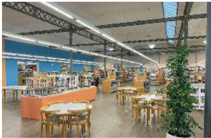
La biblioteca tanca sis mesos després de la reobertura.