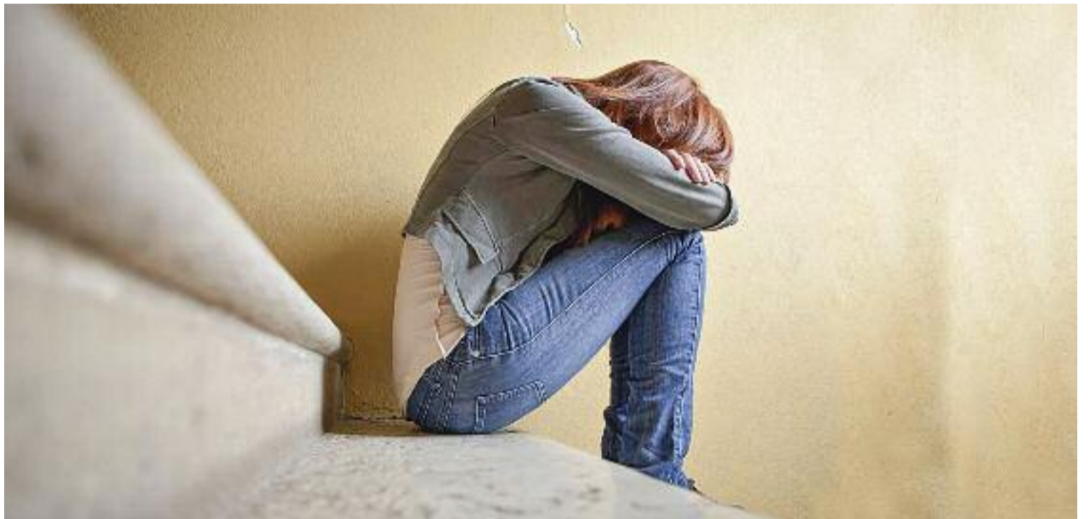
Els suïcidis van augmentar durant la pandèmia.

Es tracta, doncs, d'un problema que es va visibilitzar amb la pandèmia, però que, com afirmaven en declaracions al diari Línia des del Consell Nacional de la Joventut de Catalunya (CNJC), fa temps que preocupa. “La pandèmia ha servit per visibilitzar un problema que ja tenim des de fa anys”, explicaven des de l'organisme nacional per afegir que aquest problema “té a veure amb una joventut que viu uns alts nivells d'estrès, que té por del futur i que en moltes ocasions se sent estigmatitzada”. “Des que som petits ens manca molta educació emocional que ens porti a afrontar els problemes, i ahora vivim en una societat on s'individualitza el dolor”, sentenciaven des del CNJC.