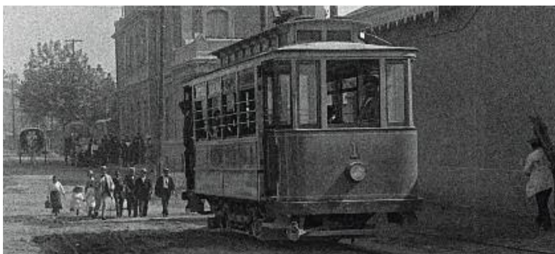
Imatge del tramvia a la pel·lícula “Tiana 1920”.