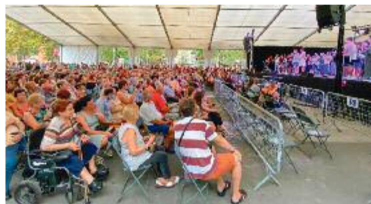
Imatge de la Festa Major de 2022.

Diumenge al matí està programada la Festa del Mar, amb activitats, esports i neteja del fons marí al Parc i la platja del Litoral. Destaquen també les haveneres i el rom cremat a la plaça Guillermo Vidaña a les 20 hores i el Festival Jove a les 22 hores. Dilluns hi haurà diferents actes de la Diada i la Festa Major clourà amb el castell de focs a les 22 hores al Parc del Litoral, i l'espectacle musical, a les 23 hores, a la plaça de la Vila.