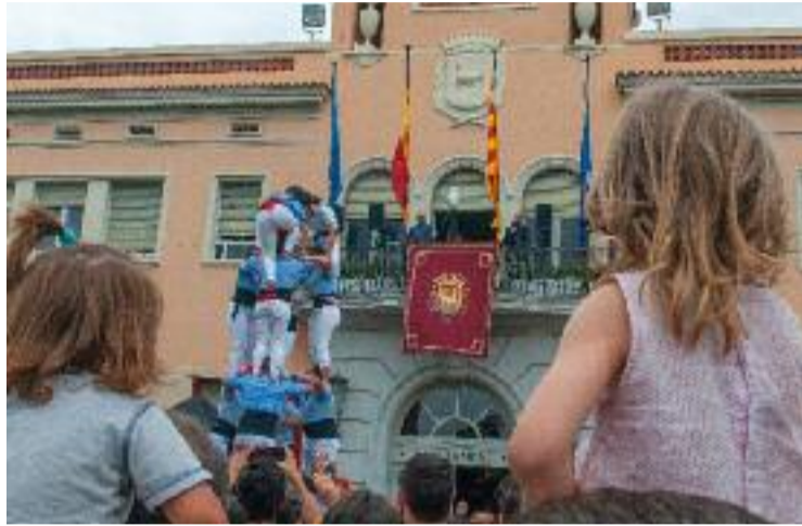
Castellers a la plaça de la Vila.

Des de la primera nit l'oferta de música va ser molt variada i repartida, com per exemple al Mas Fonollar, al Parc Europa o la plaça de la Vila. Van destacar els concerts de Vicco i Rita Bayés. El dia 2 va tenir lloc la tradicional trobada de gegants a la plaça de la Vila i durant tota la jornada, a la CIBA, es va celebrar la 3a edició del Violeta Festival, una propos-