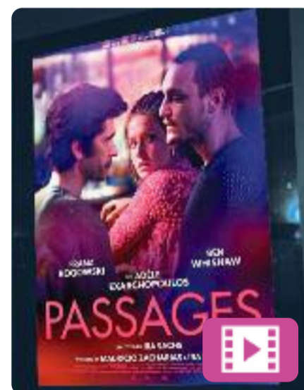
Passages Ira Sachs

Durant el seu últim dia de rodatge a París, el director de cinema Tomas se'n va al llit amb l'Agathe, una noia que coneix en una discoteca. Quan en Tomas l'hi explica, orgullós, al seu marit Martin, sorgeix una relació entre tots tres marcada per la passió, la gelosia i el narcisisme. Un triangle amorós format per Franz Rogowski, Ben Wishaw i Adèle Exarchopoulos.