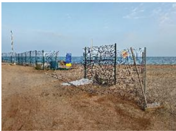
Alguns trams del tancat permeten un accés fàcil a la platja.