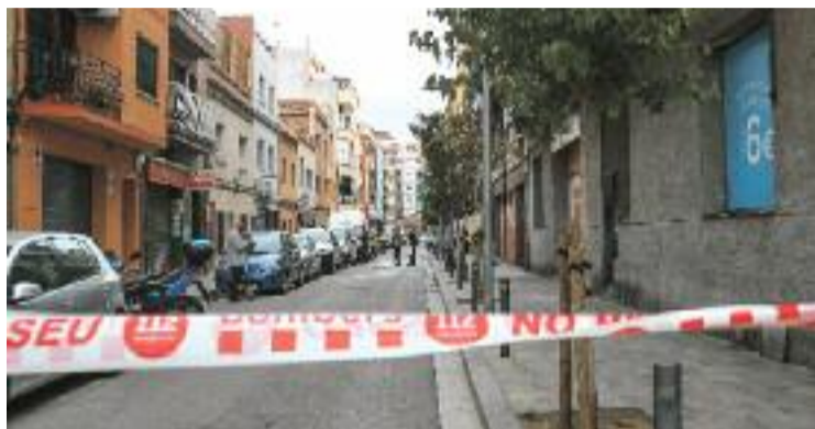
El carrer Sant Joaquim, on es va produir l'incendi.

Els Mossos d'Esquadra van detenir el passat mes de desembre un sospitós de quatre delic-