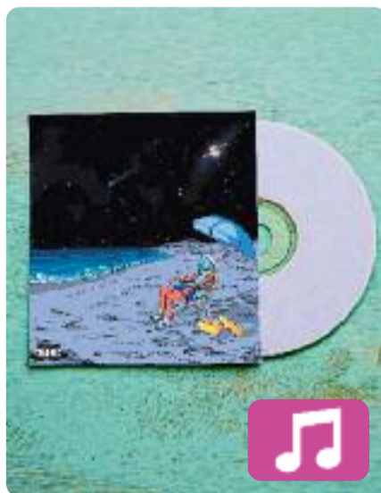
Playa Saturno Rauw Alejandro

Rauw Alejandro està disposat a ser un dels artistes més escoltats aquest estiu amb el seu nou àlbum, Playa Saturno . El single que va estrenar com a avançament del disc és Baby hello , amb l'exitós productor Bizarrap, però l'àlbum també inclou una sorprenent col·laboració amb Miguel Bosé, Si te pegas . No hi ha, en canvi, cap cançó amb la seva parella, Rosalía.