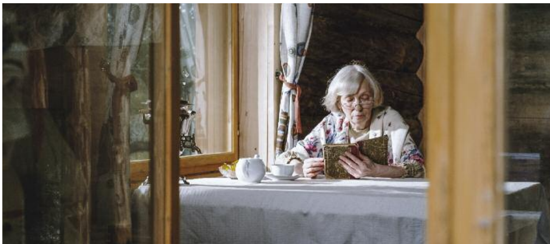
Algunes persones gran es mostren contràries a tenir algú a casa que els ajudi o acompanyi.