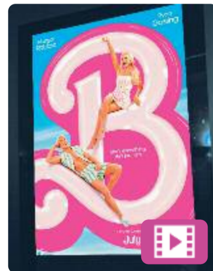
Barbie Greta Gerwig

Arriba la pel·lícula més esperada de l'estiu, després d'una promoció inigualable. En aquest film de Greta Gerwig, la famosa nina Barbie abandona Barbieland (on té una vida perfecta) per anar al món real. En Ken, com no podia ser d'una altra manera, decideix acompanyar-la. Però quan el CEO de Mattel descobreixi que s'han escapat, intentarà retornar-los a la caixa.