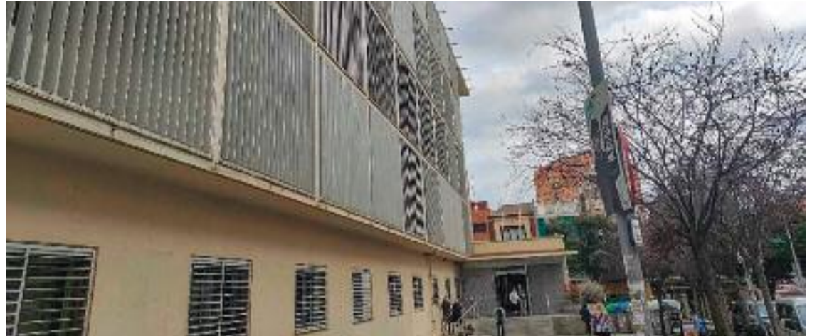
El CAP Doctor Robert és un nou punt de referència per a les persones trans.

Preguntada per si cada vegada més es comença la transició en persones de curta edat, Sánchez