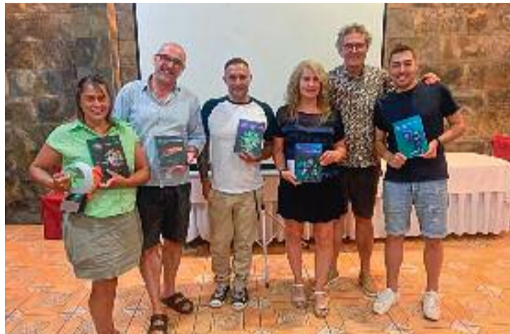
Imatge de l'entrega de premis.

Enguany s'ha mantingut una nova modalitat de concurs que es va iniciar fa tres anys, que és la de la fotografia creativa. Aquesta consta de, a partir de les fotografies capturades, presentar una proposta creativa. És a dir, fer una edició a la imatge sense limitacions. Aquestes imatges es van pujar amb un hashtag específic a Instagram i els seguidors de SASBA