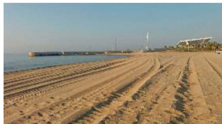
La platja del Fòrum és l'única oberta al municipi.