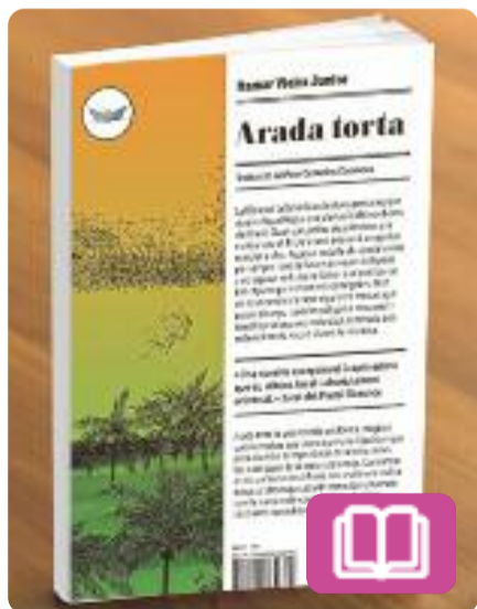
Arada torta Itamar Vieira Junior

La Bibiana i la Belonísia són dues germanes que viuen a Água Negra, una planació del nord-oest del Brasil. Quan són petites descobreixen una maleta sota el llit de la seva àvia amb un ganivet esmolat a dins. Aquesta troballa els canvia la vida per sempre i des de llavors es veuen obligades a no separar-se l'una de l'altra i a mimetitzar-se fins a fer-se indistingibles.