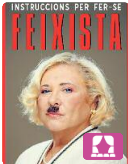
Instruccions per fer-se feixista Michela Murgia

L'assaig de Michela Murgia és tota una provocació. Un text ple d'ironia sobre la perillosa propagació dels populismes a les nostres societats. Mercè Arànega es posa a la pell d'aquesta escriptora i activista italiana per convertir-se en la protagonista d'un monòleg que denuncia l'actual onada de feixisme.