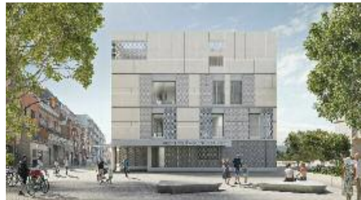
Simulació de la futura comissaria.

Segons El Periódico , en la primera reclamació, que data del 27 de juny, es recull que "no es pot acceptar" un sobreseïment en un format de formulari, d'una sola pàgina, en la qual ni tan sols apareixen els noms de les víctimes, a més d'acusar el jutjat de no haver practicat les diligències essencials "per fer una correcta instrucció".