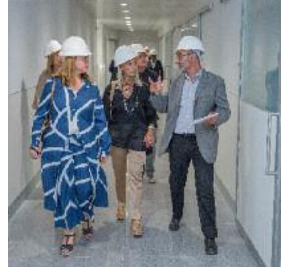
Ahir es va organitzar una jornada de presentació i visita al futur hospital.

pecialitats mèdiques i quirúrgiques, consultes externes, quirò-