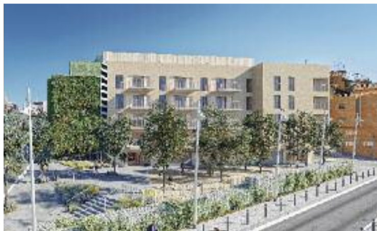
Simulació del projecte al barri del Fondo.

Un dels grans objectius del projecte és assolir la màxima eficiència energètica possible. Per