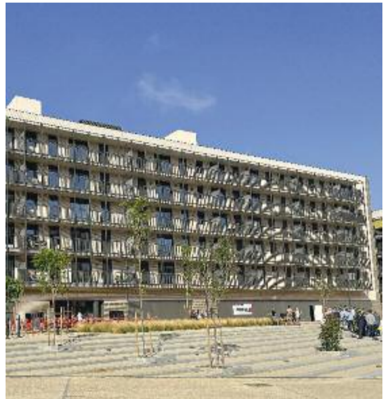
Els ponents de l'acte de Restarling Badalona i l'edifici Gregal, un bloc de pisos de lloguer social.

Sisternas, directora de l'Institut Català del Sòl.