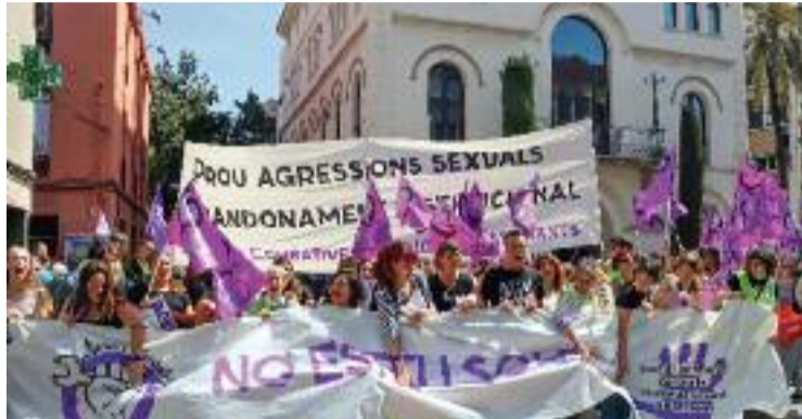
Manifestació contra les agressions sexuals a Badalona.

Aquesta visió la comparteix Carles Sagués, de la Plataforma