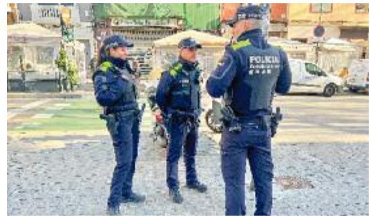
Agents de la Guàrdia Urbana de Badalona.