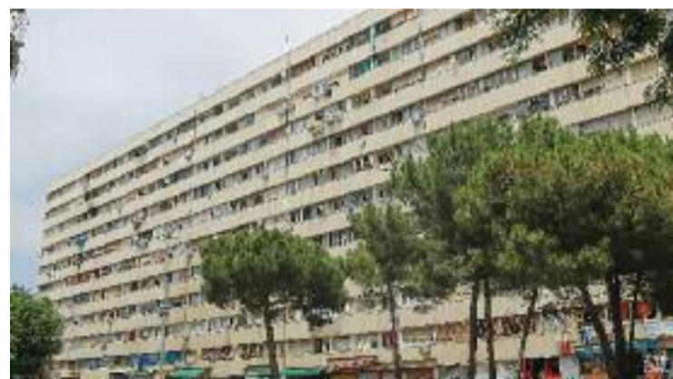
El bloc Venus, al barri de la Mina.

episodis forts de pluges", un fet que, diuen, ja es fa per protocol i, per tant, en cap moment es plantegen tancar. A més, recorden que les estadístiques de l'Agència Catalana de l'Aigua del 2022 indiquen que la qualitat de l'aigua a la platja del Fòrum va ser excel·lent en 8 analítiques, bona en 2, i només en un dels controls es va produir una alteració puntual de la qualitat, a causa de les intenses pluges provocades pels temporals.