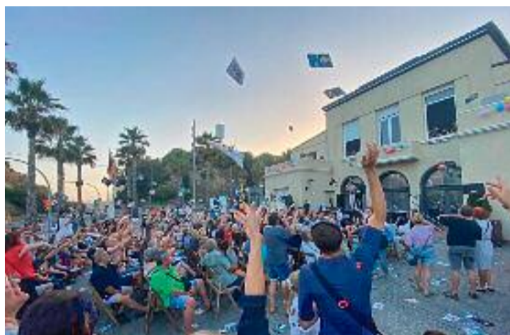
Pregó de les festes de Sant Joan de l'any passat.

La programació es reprendrà dijous 22 amb la música en viu de Dos Gardènies in the night al Mercat a partir de les set de la tarda. Però serà divendres 23, dia de la revetlla de Sant Joan, quan s'intensificaran les activitats. De sis a vuit de la tarda es podrà vi-