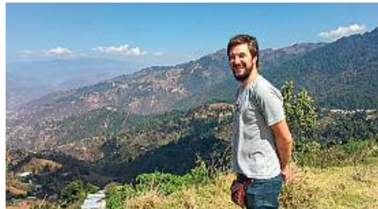
Tortolero tenia 36 anys.

Com a afegit, la generació d'energia renovables supera els requisits del codi d'edificació i la contractació pública d'aquestes obres ha inclòs requisits sostenibles i mediambientals.