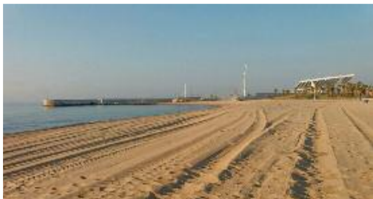
La platja del Fòrum serà l'única oberta al municipi.

Un estudi encarregat pel Consorci del Besòs el juliol de 2021, després del tancament de la platja del Litoral del municipi, va concloure que la capa superficial de la platja del Fòrum no suposava un risc per a la salut de les persones. En un comunicat, l'Ajuntament va comentar que els resultats de l'estudi apuntaven que la qualitat de la sorra era "apta" per l'ús públic fins a 80 centímetres de fondària i no requeria "cap actuació de neteja". Una situació, però que no té a veure amb l'informe actual, que se centra en la qualitat de l'aigua,