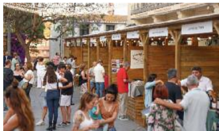
El Tast va oferir productes de 17 restauradors i 8 cellers.