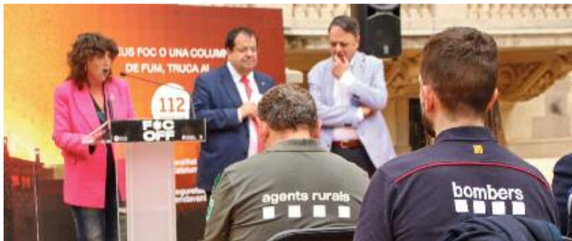
S'han reforçat els cossos que s'ocupen de l'extinció dels focs.