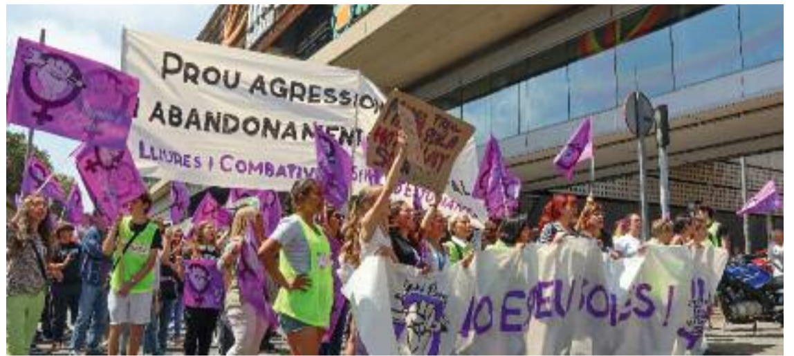
Manifestació contra les agressions sexuals celebrada a l'abril.