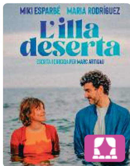
L'illa deserta Marc Artigau

L'illa deserta és la història d'Ella i Ell. De tot el que hauria pogut ser. Ella que treballa en un banc i que pintava grafitis per la ciutat. Ell que és repartidor a domicili i que somia a ser actor. Ella i Ell que ens expliquen com van ser, com són i com seran, ara que una trobada fortuïta, tancats en un ascensor, els pot canviar (o no) per sempre. A la sala Villarroel de Barcelona.