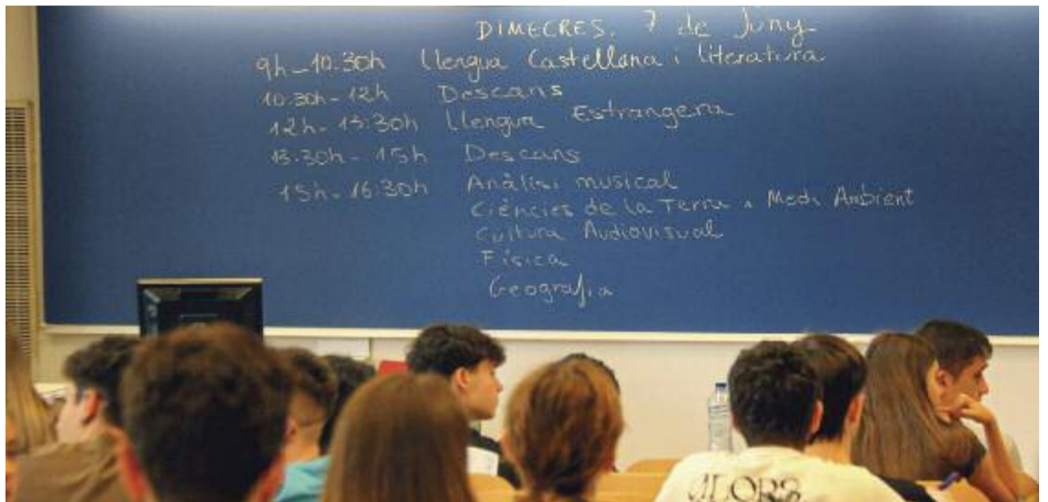
Un moment del primer dia de la selectivitat, que va tenir lloc ahir dimecres.

En els darrers anys, els centres privats que preparen alumnes per a la selectivitat fora de l'horari lectiu han anat a l'alça. Segons relata en Miquel, "hi havia una necessitat" que ningú estava ocupant. Ell va crear una empresa en línia per preparar estudiants per a la selectivitat i més tard la seva firma es va unir a una companyia d'educació telemàtica més gran.