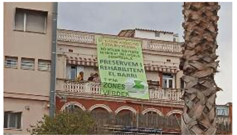
Pancarta de l'entitat Salvem el Barri Antic.

Aquesta sentència sobre la reparcel·lació, però, encara no és definitiva. L'Ajuntament de Santa Coloma va presentar un recurs a la decisió del TSJC i encara s'ha de decidir en seu judicial si s'accepta. El famós PERI va ser aprovat el 1999, però els enderrocs no van anunciar-se fins al 2018. La ciutadania, però, va aconseguir aturar aquests enderrocs i, el novembre passat, el TSJC deixava sense efecte la reparcel·lació de la zona.