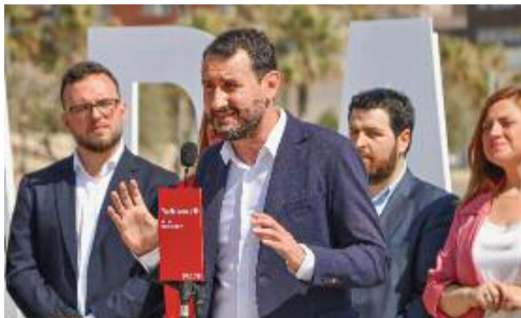
Guijarro és regidor de l'Ajuntament de Badalona des del 2015.

Amb les eleccions a tocar i amb la renúncia de Guijarro després de l'estiu, sembla que el nou lideratge del PSC encara es farà esperar.