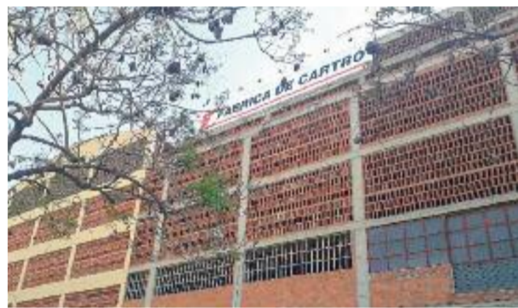
Façana de l'antiga fàbrica de cartró Llandrich.

A més, l'Ajuntament està en converses amb l'INCASÒL per preservar la memòria de la fàbrica Llandrich, que és un referent patrimonial i social per als adrianencs. Ambdues institucions han encarregat un procés participatiu a una empresa per conèixer l'opinió dels veïns. El projecte, que porta anys de retard, preveu conservar un part d'aquest conjunt industrial i fer una millora de tot l'entorn.