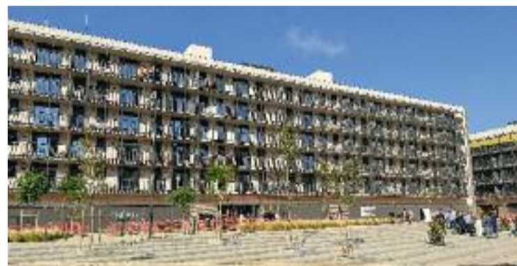
Exterior de l'edifici Gregal, a Sant Crist.

no anirien a resoldre aquesta situació perquè Salas, l'empresa gestora, té un deute amb ells. Els veïns expliquen que gràcies al fet que l'edifici del costat, que és una promoció de propietat i que la promotora sí que paga a l'empresa de manteniment, moltes vegades salta l'alarma al mateix temps, el tècnic apaga les dues. "El problema és que un dia l'alarma saltarà per una cosa greu i no ho sabrem perquè salta cada dos per tres", diuen els veïns. "Paguem gairebé 4.000 euros mensuals de comunitat i ens volen pujar 100 euros. On van els diners si ni paguen el manteniment?", afegixen.