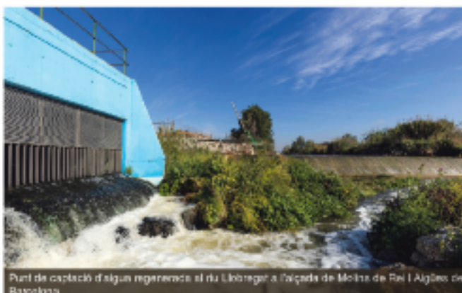
Punt de captació d'aigua regenerada al riu Llobregat a l'estació de Molins de Rei i Aigües de Barcelona

El canvi climàtic requereix respostes sostenibles. Calen solucions innovadores. És hora de dibuixar un futur on tenir aigua depengui més de nosaltres mateixos que del que cau del cel.