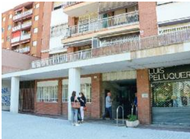
Entrada de l'edifici on va produir-se el crim.

La Divisió d'Investigació Criminal de la regió Metropolitana Nord ha obert una investigació per poder esclarir els fets. D'altra banda, l'alcaldessa Filo Cañete lamentava a través de les xarxes socials els fets succeïts i demanava respecte per a la investigació. Ca-