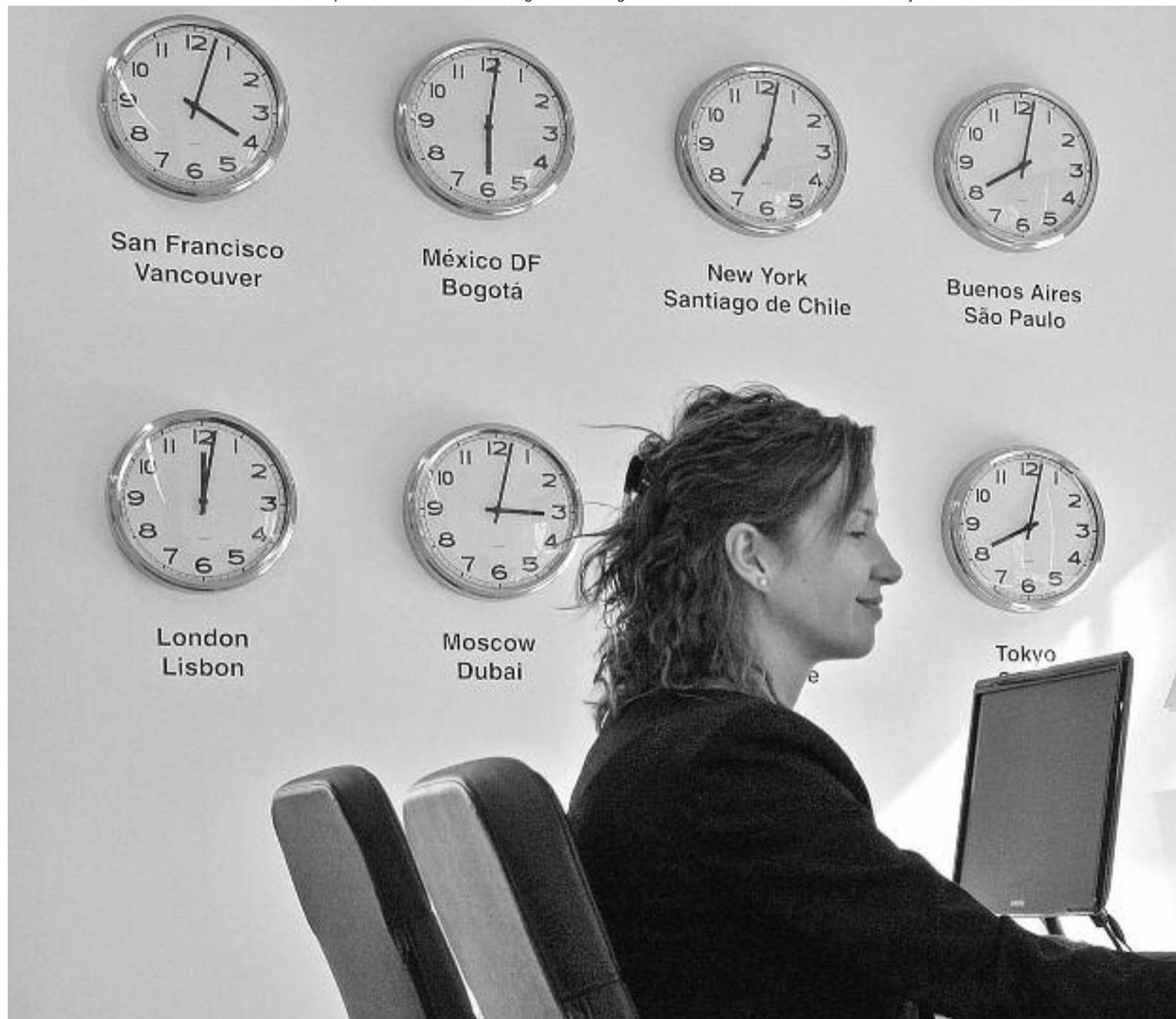
A Barcelona es calcula que hi ha uns 100.000 estrangers del nord global.