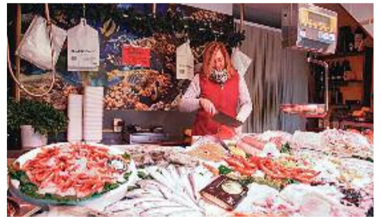
Imatge d'un dels comerços associats a ACIS Montgat.

L'oferta per utilitzar aquest vals és molt variada. Hi ha, per exemple, massatges, higiene bucodentals, tallers de cuina o productes d'alimentació.