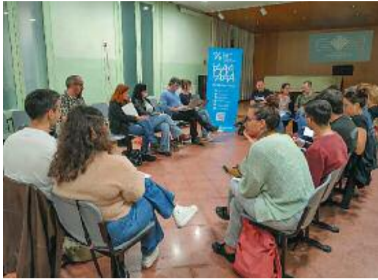
Una assemblea de l'Ateneu Cooperatiu.

La jornada tindrà música en directe, tallers i activitats que, segons l'organització, ajudaran a mostrar que el sistema cooperatiu és possible a Santa Coloma. "Es tracta d'enfortir els vincles perquè cooperatives i entitats locals es puguin trobar i treballar conjuntament en l'Ecosistema Cooperatiu de Gramenet i donar a conèixer a la ciutadania local l'existència d'empreses amb alt valor afegit i amb formes de fer més igualitàries i democràtiques", expliquen des de L'Ateneu Coope-