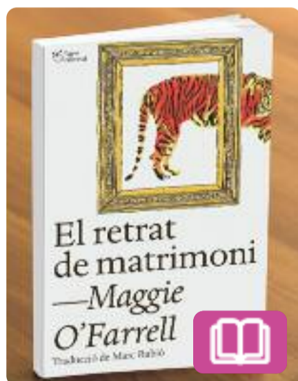
El retrat de matrimoni Maggie O'Farrell

A la Itàlia del segle XVI, la Lucrezia, tercera filla del duc de Mèdici, és una noia discreta i independent que creix feliç a l'ombra dels seus germans, lliure per observar els tresors de palau, explorar passadissos secrets i espiar converses clandestines. Però quan la seva germana gran mor, la Lucrezia es veurà arrossegada a una nova vida amb el seu marit, que és un misteri per a ella.