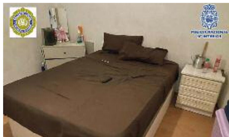
Les condicions dels prostíbuls eren insalubres.

Els immobles, expliquen els cossos policials, estaven controlats per una organització criminal. De fet, les trucades arribaven a una central per poder tenir un control exhaustiu de les dones que exercien la prostitució i dels clients. Els dos detinguts van quedar en llibertat després de declarar.