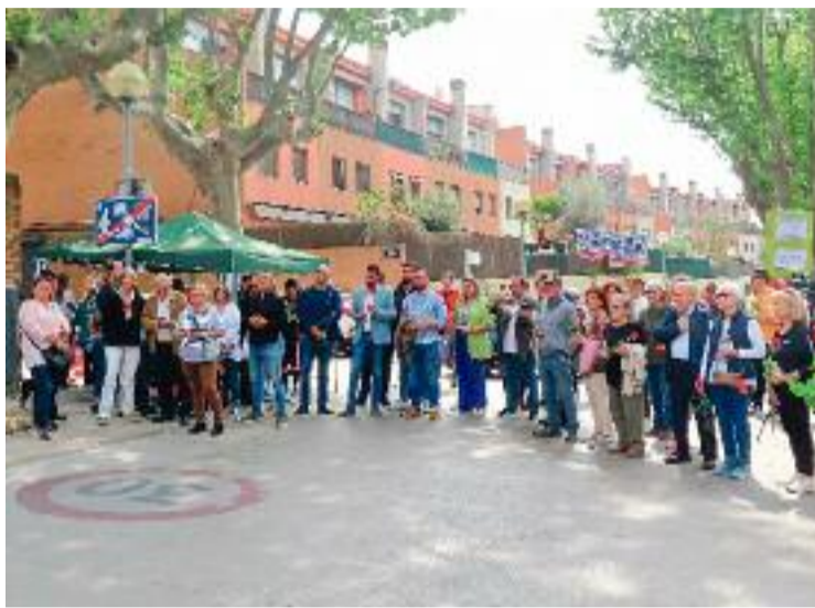
Imatge de la concentració al barri de Canyet.