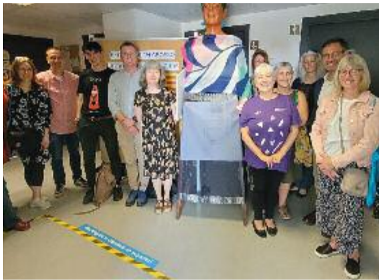
Visita de l'expedició gal·lesa a Santa Coloma.

“A Gal·les només parla l'idioma el 20% de la població i volien veure com funciona el programa que hem aplicat a Catalunya durant tants anys. Aquest pla consisteix en un voluntari i un aprenent que parlen 10 hores a la setmana”, explica Noemí Ubach, del CNL l'Heura.