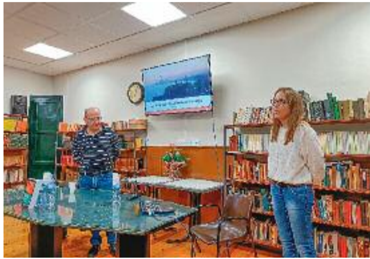
Imatge de la presentació del llibre a l'Ateneu Adrianenc.

Es tracta d'un llibre autoeditat per l'autora, de 600 pàgines, amb informes, testimonis i més de 900 fotos que expliquen com Sant Adrià “ha estat i és la zona de sacrifici” de l'àrea metropoli-