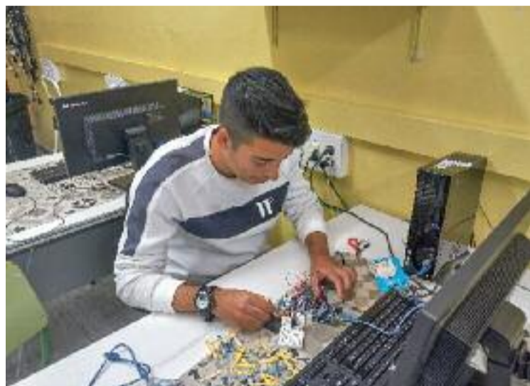
Al projecte hi han participat 19 alumnes de l'institut badaloní.