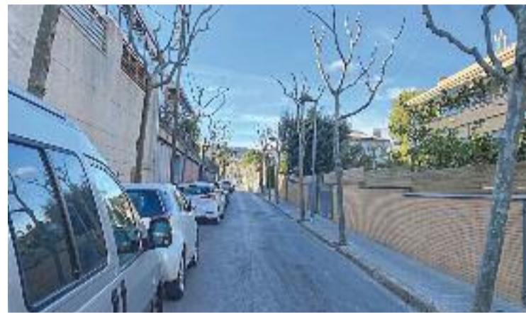
Alguns conductors no respecten la senyalització de 10 km/h.

A través del seu compte de Twitter, la veïna de Tiana Berta Blasi penjava un vídeo en el qual demostrava que, tot i les mesures adoptades com la senyalització de 10km per hora i la pintura de la calçada, encara hi ha cotxes que no redueixen la velocitat. Sobre aquest tema també ha valorat positivament que l'Ajuntament hagi comprovat que les decisions preses no són suficients i que hagin escoltat alternatives dels veïns.