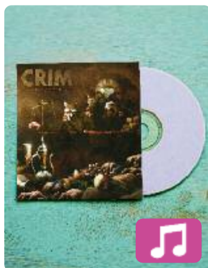
Cançons de mort Crim