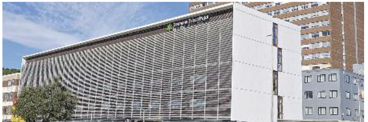
El Germans Trias i Pujol es va inaugurar l'abril del 1983 (esquerra i a dalt) i des de fa anys és un hospital referent (a sota).