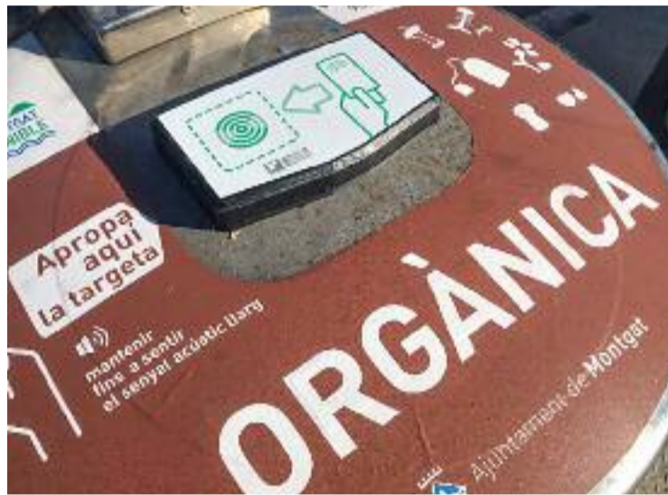
L'obertura dels contenidors funciona amb una targeta.

El que volen, per tant, és incrementar el percentatge de montgatins que en fan ús i per aconseguir-ho, dues educadores ambientals estaran a peu de carrer fins al 6 de maig per sensibilitzar i resoldre els dubtes que pugui tenir la població. També repartiran targetes lectores als veïns que encara no les tinguin, i explicaran la importància d'utilitzar el nou sistema d'obertura de contenidors als veïns que ja tenen la targeta lectora però encara no l'han utilitzada. Les