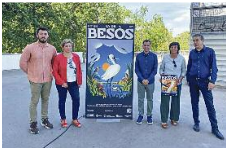
Regidors dels municipis i del Consorci del Besòs.

A banda, també hi haurà activitats a l'escenari de la Llosa del Bon Pastor, a Barcelona; i al Parc del Litoral, entre Sant Adrià i Barcelona. El gran nombre d'activitats s'explica per la col·laboració entre els quatre ajunta-