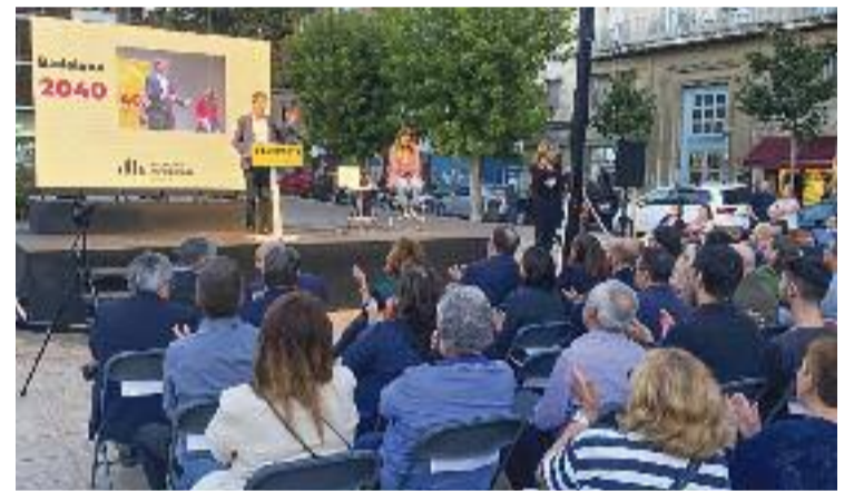
Acte de presentació de la candidatura.

En aquella ocasió, ERC es va presentar conjuntament amb Guanyem Badalona en Comú de l'exalcaldessa Dolors Sabater.