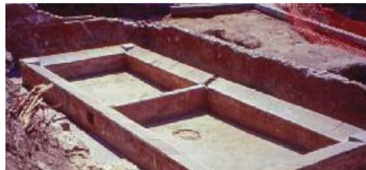
Imatge de les obres de reurbanització del safareig.

PATRIMONI ▶ En el marc de les Jornades Europees del Patrimoni, que se celebren del 7 al 9 d'octubre, el Museu Torre Balldovina organitza una visita a l'antic safareig públic de la plaça de Montserrat Roig, que es durà a terme a les 11 del matí de diumenge. Després de la visita, hi haurà un espectacle cultural i musical que buscarà reivindicar el safareig "com espai de memòria col·lectiva i la bugada com una feina primordial en la cura de la vida", assegura el museu en el seu comunicat.