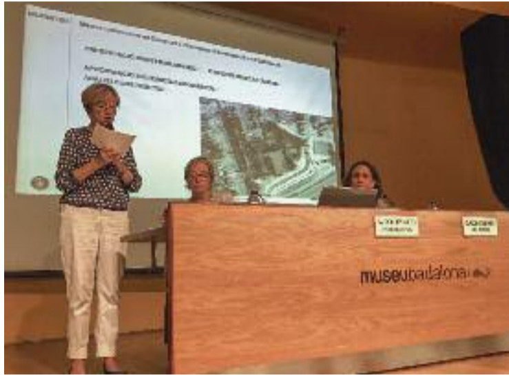
La presentació de l'estudi de Ca l'Andal.

L'arquitecta va informar que l'estat de l'estructura és en general correcte, excepte en algunes zones que s'han de reparar, per culpa de la falta de manteniment. Les darreres pluges torrencials han provocat l'esfondrament d'una part de la teulada, i també algunes de les bigues de fusta que la sostenen s'estan descomponent. Això provoca que s'hi filtri aigua cada cop que plou, fet que fa deteriorar tot el conjunt encara més ràpid: "Si no hi ha un ús i, per tant, uns usuaris i un manteniment, pot ser que un altre tram de la co-