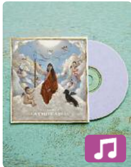
La emperatriz Rigoberta Bandini

Rigoberta Bandini (el nom artístic de Paula Ribó) ja és tot un fenomen. Després de publicar molts hits, d'actuar en grans festivals, de quedar-se a les portes d'Eurovisió i d'anunciar que es retirarà temporalment quan acabi la gira, només li faltava una cosa: estrenar el seu primer disc. La emperatriz inclou dotze cançons, de les quals quatre són inèdites.