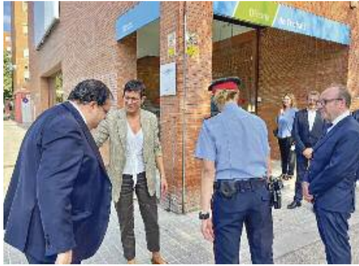
Imatge de la reunió de la Junta Local de Seguretat.