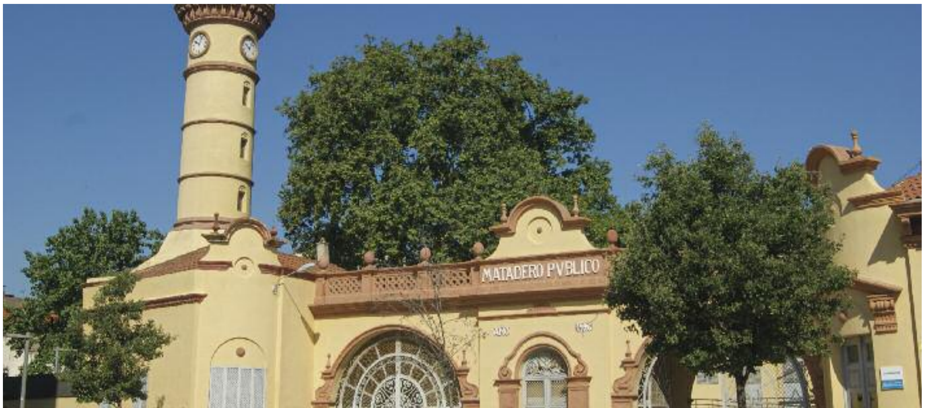
L'antic escorxador serà l'escenari (macabre) de les primeres jornades de novel·la negra.