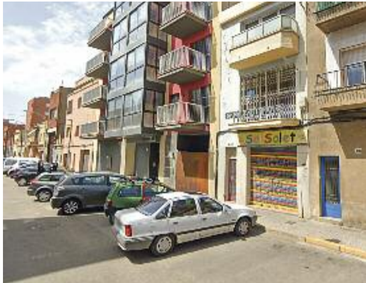
El local havia d'obrir en aquesta antiga escola bressol.

Aquesta entitat va demanar la llicència d'obres i de canvi d'activitat de l'immoble, ja que l'edifici on s'havia d'obrir el cen-