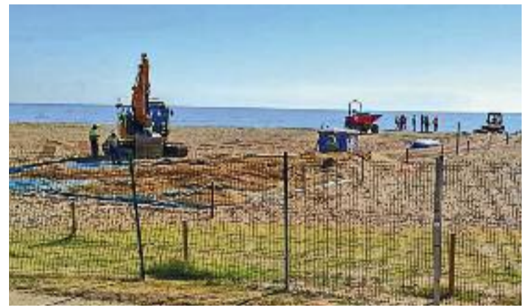
Obres per fer arribar el cable submarí. Foto: Twitter (@LaMareaVerdeSAB)

Veïns i entitats han criticat que s'hi dugui a terme la instal·lació del cablejat remonent la sorra, sense haver-la descontaminat abans: "Treballadors sense equips de protecció, tanques sense lones (...). Això a Barcelona no es consentiria", va criticar La Marea Verde a Twitter.