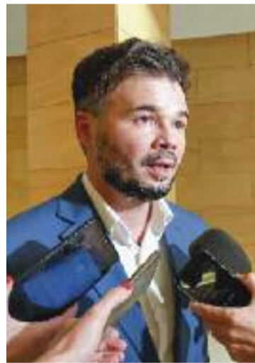
Rufián atenent els mitjans.