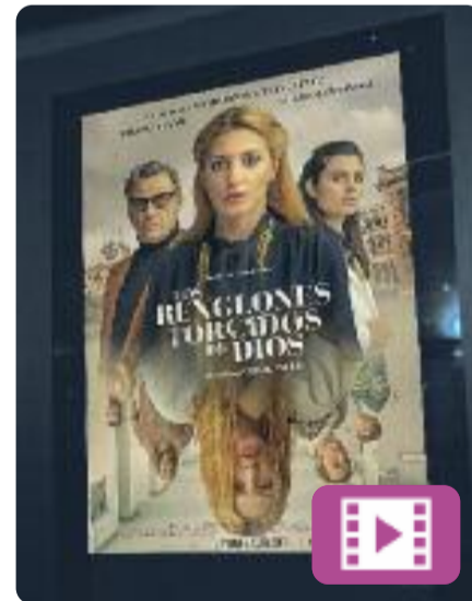
Los renglones torcidos de Dios Oriol Paulo

En aquesta adaptació de la novel·la homònima de Torcuato Luca de Tena, l'Alice, una investigadora privada, ingressa a un psiquiàtric simulant una paranoia. El seu objectiu és trobar proves del cas que l'ocupa: la mort d'un intern en circumstàncies poc clares. Però la realitat que descobrirà superarà les seves expectatives i posarà en dubte el seu seny.