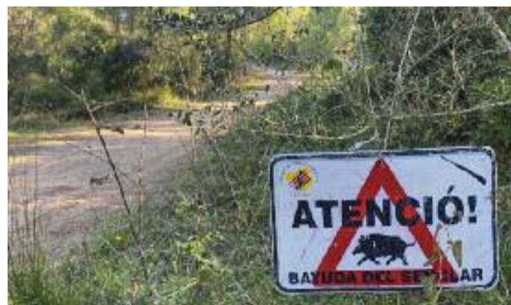
La població de senglars ha crescut molt.

controlar els senglars. L'Ajuntament va fer una campanya de sensibilització el mes de maig amb el nom 'Al senglar, posa-li difícil', en què destacaven algunes mesures que comporten canvis d'hàbits, com ara el fet que els veïns pengin el cubell de les escombraries a un metre i mig d'altura en cubells comunitaris, per posar-li més difícil al senglar. En aquesta línia, l'Ajuntament informa que en els pròxims dies s'instal·larà una tanca perimetral als horts municipals per evitar que aquests animals hi entrin.