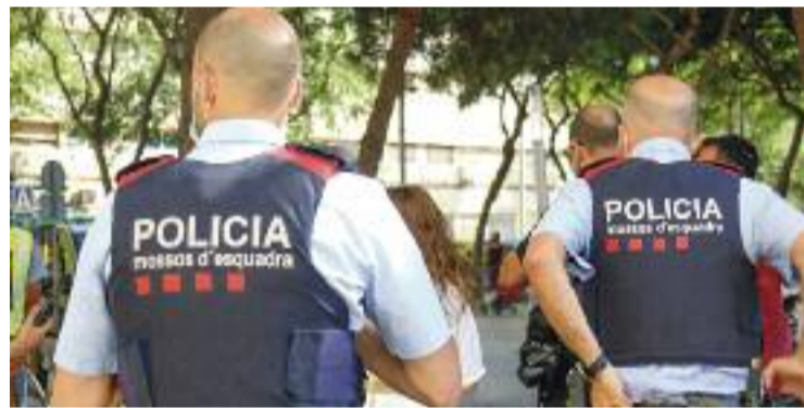
Els Mossos, a la Mina l'any 2021.