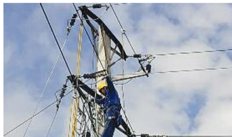
Un operari d'Endesa durant la reparació de la línia de tensió.

Un llamp caigut el 21 d'agost va ser l'origen dels talls de llum, que van afectar primer el Singuerlín i les Oliveres. L'avaria es va reparar, però les incidències continuades van fer que Endesa encetés la reparació el 12 de setembre, ja que "l'efecte del llamp havia estat major que l'imaginat", diu l'empresa.