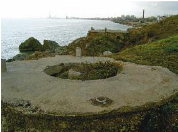
El niu de metralladores de la platja de Montgat.

Des dels nius es disparava artilleria lleugera contra vaixells i