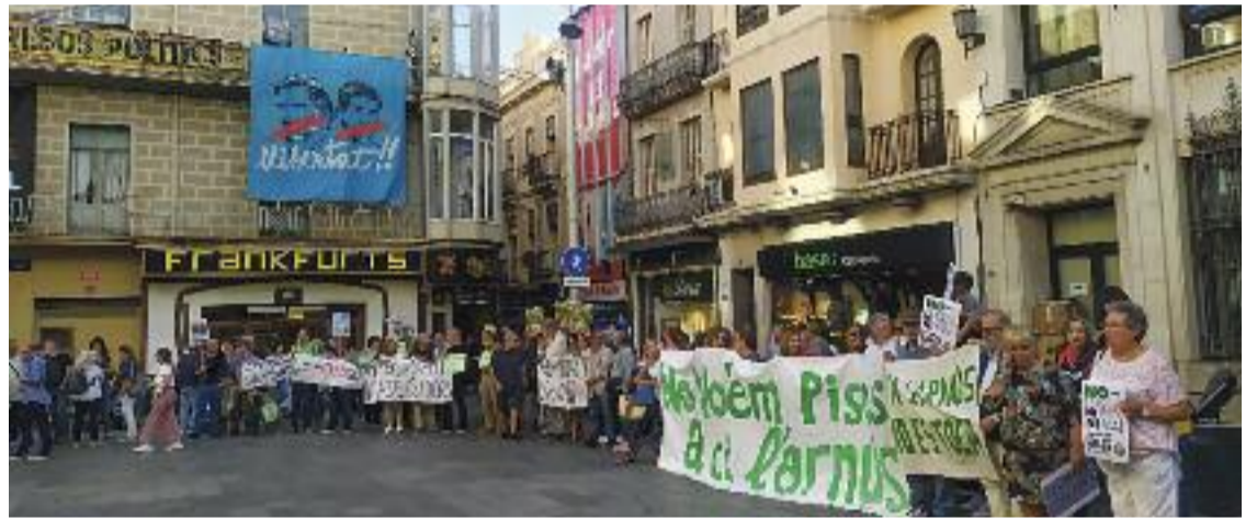
El Ple de dimarts, a dins i fora del consistori.