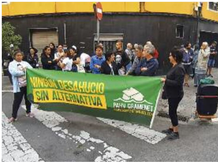
Un dels desnonaments de dimecres.