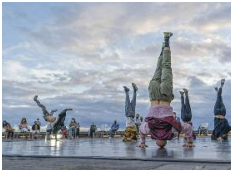
'Kintsugi', de la companyia Iron Skulls, es podrà gaudir el dia 1.

De fet, una de les activitats més destacades d'enguany ha portat la dansa als alumnes de l'Institut Escola la Mina. Va ser ahir dimecres, al Teatre Casal de Cultura. Es tractava d'una conferència visual sobre violència de