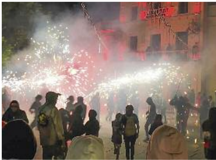
Imatge del correfoc de l'any 2020.

Pel que fa a les actuacions musicals, es duran a terme al Parc de l'Antic camp de futbol i a la plaça de la Vila. Es podrà gaudir dels concerts de Lildami , l' Orquestra Mitjanit , la Balkan Paradise Orchestra , Llamp o The Penguins .