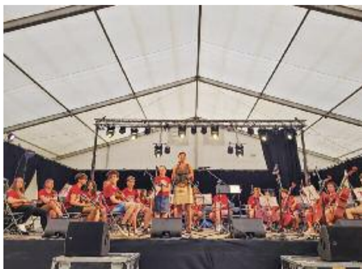
Cañete presenta l'actuació de la Benet Bailis.

El regidor destaca "la gran participació de la ciutadania, que ha protagonitzat els actes centrals de la Festa", i agraeix a les entitats la seva participació: "Des dels pregoners, la desfilarada de gegants, el correfoc així com els actes esportius i d'ex-