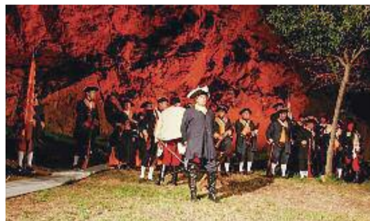
La representació del 1705 en una imatge d'arxiu.

ment històric, Montgat va celebrar el passat dia 10 la recreació històrica del desembarcament de 1705. Durant la vetllada es va poder gaudir de la teatralització d'aquell moment històric, a càrrec de la secció de teatre del Centre Recreatiu i Cultural de Montgat i actors amateurs de Montgat i de Tiana. No van faltar tampoc les actuacions dels Miquelets de Badalona, els Cuirassers de Moià, els Tabalers de Montgat i els Bufons del Toc. Per acabar, hi va haver un mapping amb la batalla sobre el turó de Montgat.