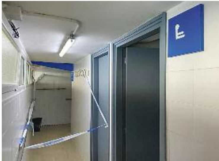
La piscina ha reobert, però les dutxes no.

Segons explica Pallarés, i tal com han publicat a les xarxes socials molts dels usuaris de les instal·lacions, les dutxes estan tancades, els sostres presenten forats perillosos, no hi ha ventilació, el nivell de clor és molt alt i costa de respirar (el dimarts es va haver de suspendre una classe perquè els nens no paraven de tossir) i només funciona un lavabo, que de fet és l'únic que té aigua potable: "Les dones grans que venen a nedar, com que no funcionen les dutxes i hi ha tant de clor a la piscina, han d'anar a les dutxes de la platja del costat", afirma Tere Pallarés.