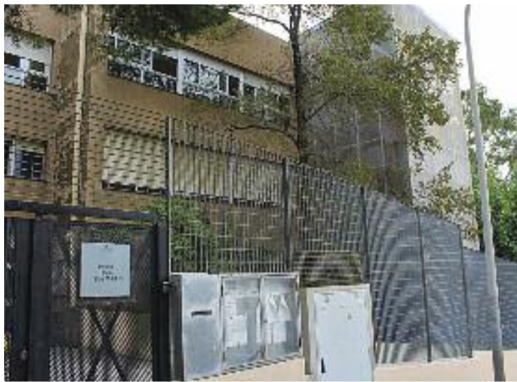
Façana de l'Institut Escola Lluís Millet.

El dia 7 de setembre la Generalitat va dur a terme una darrera prova de càrrega, consistent en fer suportar a la coberta un pes de 10 tones durant 24 hores. Aquesta prova sí que va donar un resultat positiu i conclouent, que es va comunicar al consistori el dia 9. Des d'aleshores, s'ha netejat i adequat el