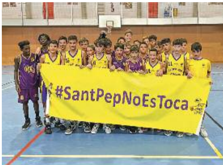
L'equip masculí de l'infantil A.