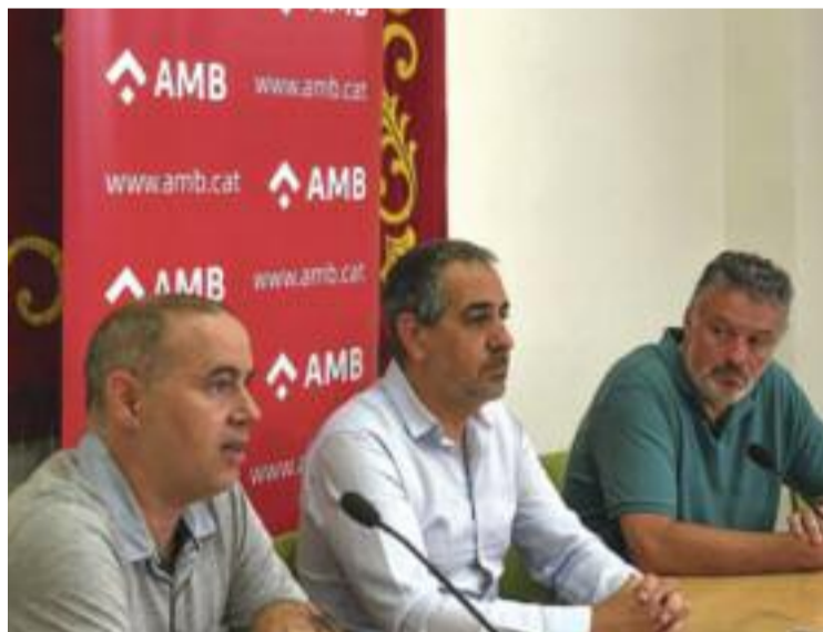
Imatge de la presentació de l'informe.