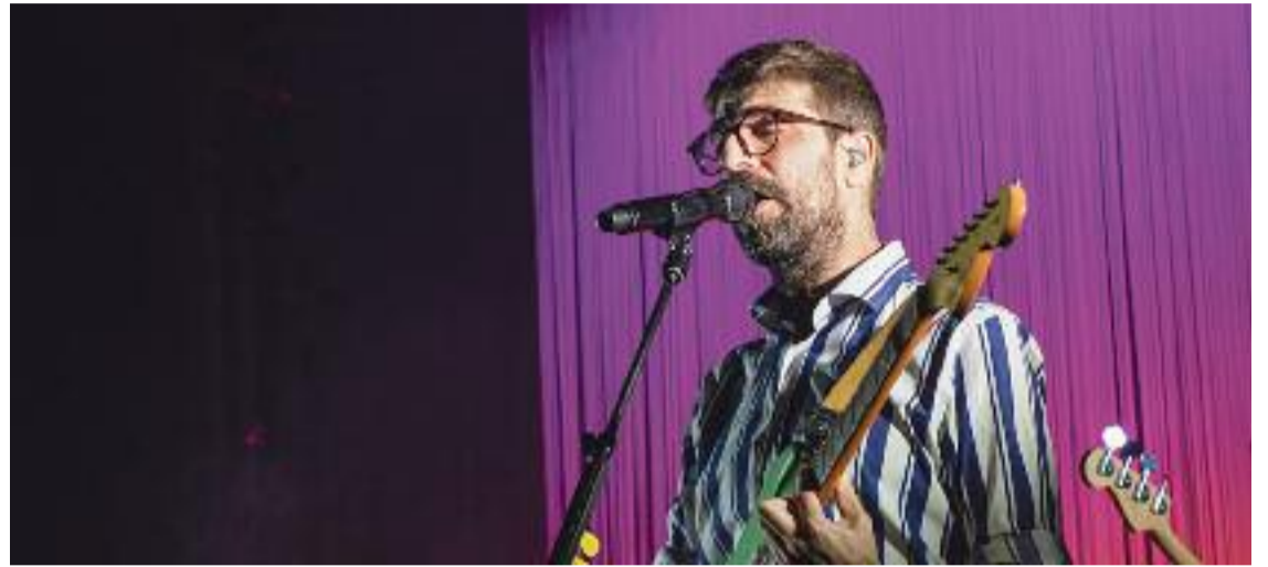
El grup Manel durant una actuació a Aitona el passat mes de març.

A Núñez el podem veure darrerament presentant programes d'èxit de la televisió com ara Got Talent España o Eufòria . El nou disc de Tanxugueiras aca-