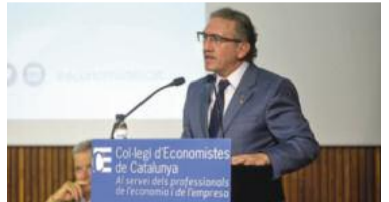
El conseller Giró presentant el pla d'ajudes.

Per això, els beneficiaris seran de tots els perfils. Principalment, persones desocupades, però també joves, adolescents, infants i famílies, i empreses, pimes i autònoms. En aquest darrer cas, per ajudar-los a adaptar-se "als nous reptes globals", diuen des de la Generalitat. Diferents col·lectius que ara ho tindran una mica més fàcil per cobrir les seves necessitats i que podran començar a demanar aquestes ajudes, sempre que compleixin els requisits, a partir de l'any que ve.