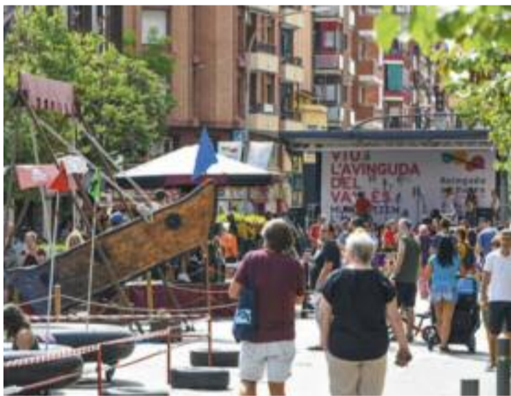
La ciutadania ocupa l'N-150 en defensa de la pacificació.