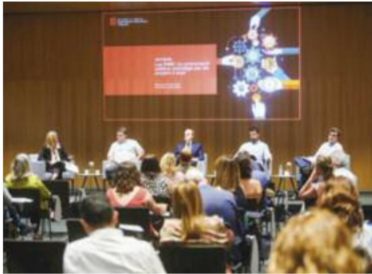
Jornada de les PIME i la contractació pública.

En aquest sentit, tot i que la covid-19 ha fet estralls en l'economia, no ha afectat especialment l'adjudicació de contractes a les PIME. I és que, tot i que se'n van adjudicar menys que el 2020, la mitjana de contractes adjudicats s'ha mantingut respecte els darrers cinc anys. Una xifra que cada vegada se situa més lluny de la dels contractes que s'adjudiquen a les grans empreses, que l'any passat només s'emportaven el 26% del total d'adjudicacions. Ara bé, per un import de més d'un bilió d'euros,