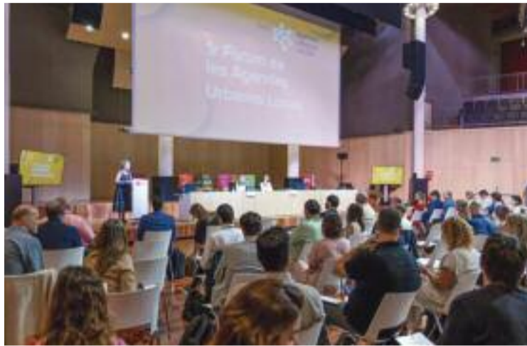
Imatge del Fòrum de les Agendes Urbanes.

Els participants van tenir l'oportunitat de conèixer les experiències d'altres territoris, i així descobrir una visió variada sobre la implementació d'es-