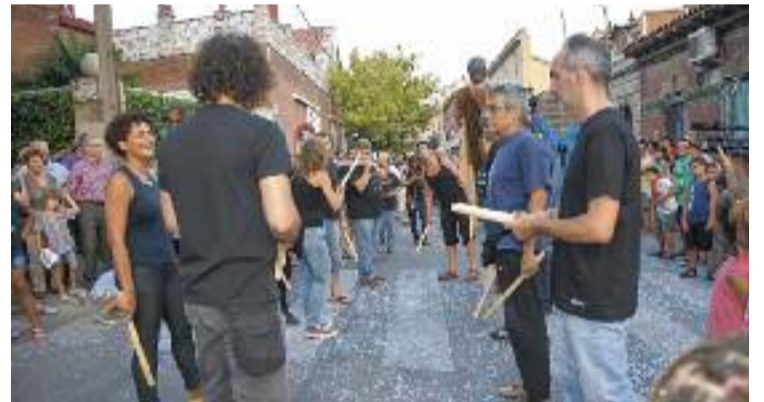
Les entitats de cultura popular fan una gran tasca.