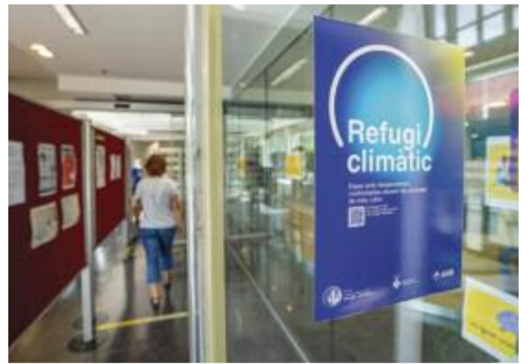
La Biblioteca Elisenda de Montcada i Reixac.

L'AMB duu a terme tallers per a persones de més de 65 anys per explicar l'impacte del canvi climàtic sobre la salut i s'informa com suportar la calor.