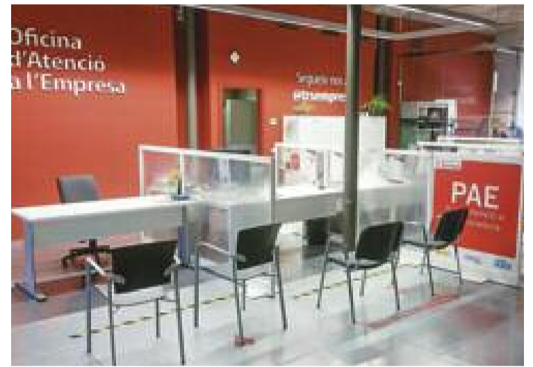
Imatge del PAE de Terrassa.

A banda, la valoració del servei per part dels usuaris és molt bona, les empreses que van utilitzar els PAE durant el segon trimestre de 2022 van valorar el servei amb un 9,71 de mitjana.