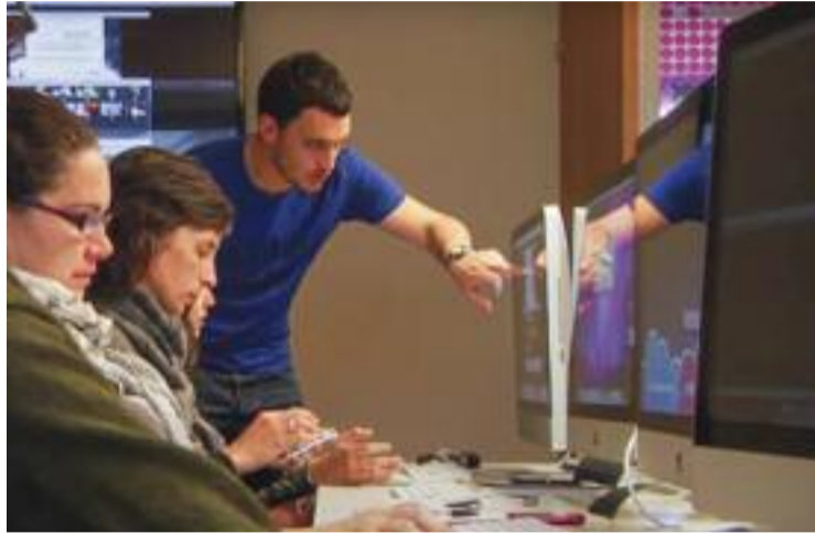
Un dels cursos formatius de la Diputació.

Els CLSE van atendre l'any 2021 a 57.780 persones emprenedores i van assessorar gairebé 47.200 empreses. D'entre els principals serveis oferts l'any passat destaquen les 2.366 formacions empresarials a 16.500 participants, que suposen més de 10.000 hores impartides. També es van fer 2.422 accions de foment de la cultura