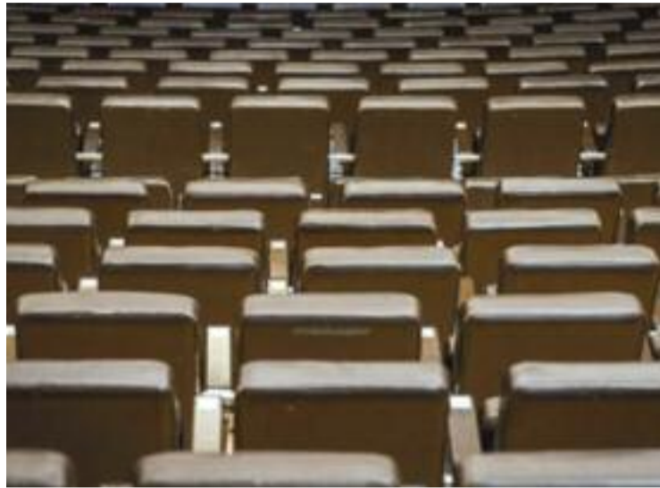
La Generalitat millorarà els equipaments culturals.

Entre les línies d'actuació principals, destaca la millora de l'accessibilitat dels equipaments i la fixació d'un percentatge mínim de representacions amb audiodescripció i subtítolació, i la transició cap a la sostenibilitat dels equipaments. Això pel que fa a la millora dels espais. Mentre que pel que fa a les accions que han d'impulsar la cultura en si mateixa, es donaran subvencions a aquelles actuacions que tinguin perspectiva de gènere, es donarà suport als projectes culturals dels joves, s'impulsaran les