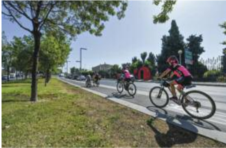
Imatge del nou tram de carril bici de l'eix Bicivia 3.

Aquesta és una de les principals connexions metropolitanas per facilitar la circulació en bicicleta de manera ràpida i segura entre el Barcelonès Nord, Barcelona i l'Hospitalet de Llobregat. Quan l'eix estigui acabat, connectarà Montgat amb el Prat de Llobregat, creuant la metrò-