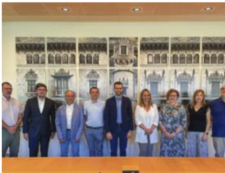
Imatge de la signatura de l'acord de col·laboració.