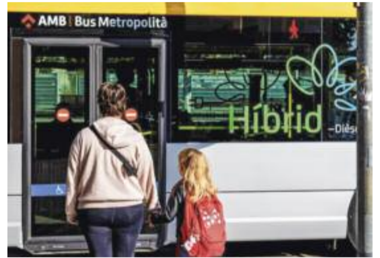
Imatge d'un dels busos híbrids en circulació.

Actualment, als serveis de Bus Metropolità de gestió indirecta de l'AMB hi ha més de 850 autobusos en circulació, dels quals un 28% són híbrids i un 4% són elèctrics. Després de la renovació, la flota de l'AMB passarà a tenir un 52% d'híbrids dièsel-elèctric, un 2% d'híbrids en-dollables i un 9% d'elèctrics.