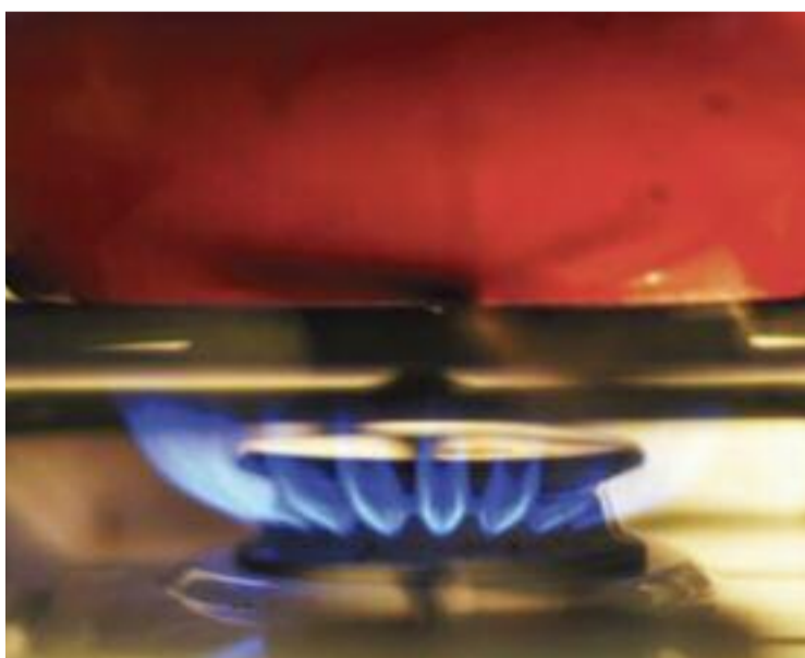
La pobresa energètica afecta una part de la població.

DESIGUALTATS ▶ El Govern va aprovar fa pocs dies el primer pas per tirar endavant un projecte de decret que té com a objectiu blindar jurídicament el reglament per combatre la pobresa energètica.