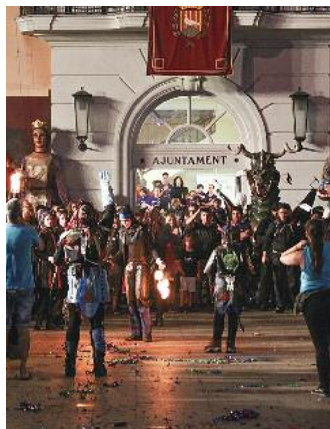
La cultura popular serà novament protagonista durant la Festa Major d'Estiu d'enguany.