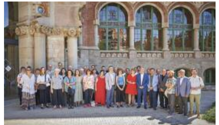
Una cinquantena de professionals han creat aquest pla.

L'objectiu final de tot això, però, és redactar un document que marqui quines han de ser les prioritats del sector públic i privat per fomentar la lectura, especialment en català. Un full de ruta que reculli les necessitats i les propostes de millora, a curt i a mitjà termini, per aconseguir capgirar la situació, fer de la lectura un hàbit atractiu per a tothom i posar el sector del llibre a l'alçada del de l'audiovisual. Tot plegat, per començar a veure els resultats de tot això entre l'any 2025 i el 2030.