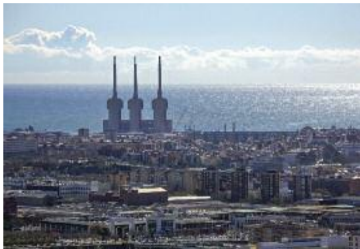
El hub audiovisual es projecta a les Tres Xemeneies.