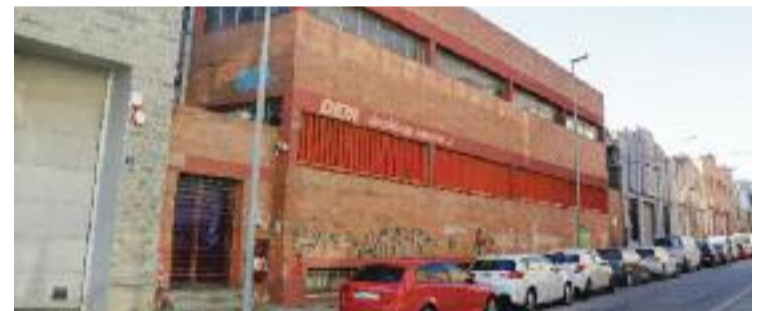
La nau del Canyonó on es fan festes il·legals.

CANYADÓ ▶ L'Ajuntament de Badalona ha reclamat el desallotjament d'una nau ocupada al barri del Canyonó on es fan festes il·legals. El punt d'inflexió es va produir fa dues setmanes, quan es van reunir mig centenar de persones a les instal·lacions, propietat del Banc Santander.