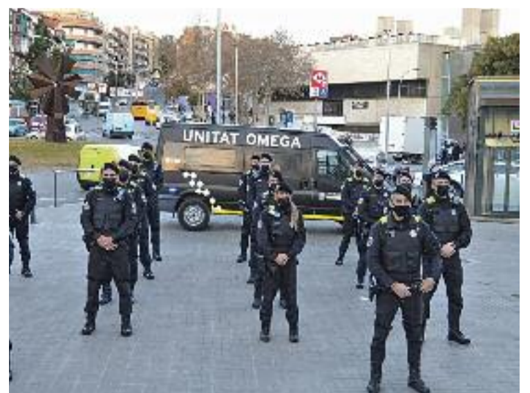
La polèmica Unitat Omega en una imatge d'arxiu.