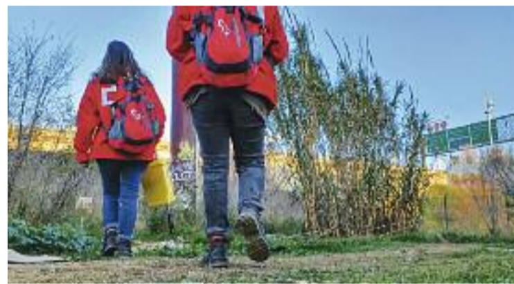
Dues educadores de la Creu Roja, a Sant Adrià.

Fonts veïnals consultades per Línia Nord no veuen amb mals ulls la iniciativa, però reclamen a les autoritats que centrin els esforços a abordar la problemàtica de l'ocupació per part dels consumidors de l'espai públic i de les zones comunitàries de blocs com el Venus, un dels principals motius de queixa a la Mina.