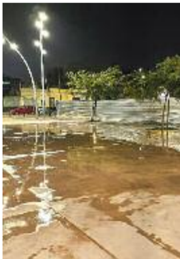
L'espai, ara sense carpes.

disminuint progressivament gràcies al treball de les entitats i dels serveis socials municipals, que han aconseguit real·lotjar en hostals o albergs a més de la meitat de les persones que vivien en condicions precàries a la nau. Segons apunten des del consistori, la resta dels inquilins de l'edifici ara tapiat han rebutjat per diverses raons l'ofertament municipal i han decidit optar per alternatives d'habitatge diferents.