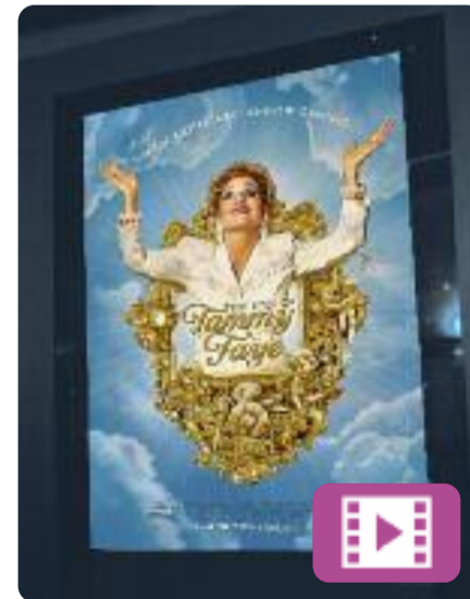
Los ojos de Tammy Faye Michael Showalter

Tammy Faye Bakker (Jessica Chastain) va ser una telepredicadora molt popular als Estats Units dels anys 70 i 80. Ella i el seu marit, Jim Bakker (Andrew Garfield), van crear un imperi del no-res, amb una xarxa de cadenes de televisió religioses i, fins i tot, un parc temàtic. Però les irregularitats financeres, les rivalitats i els escàndols els van fer caure fins a l'infern.