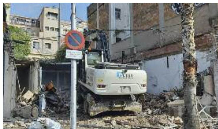
Les màquines enderroquen La Colmena a la plaça de la Vila.

documentació errònia, contradiccions i ambigüitats" que presenta el pla urbanístic vigent, que en els últims anys ha patit diverses modificacions. Respecte a l'última modificació puntual aprovada inicialment, que suposa la creació i concreció de dos nous equipaments, des de la plataforma apunten que el plantejament municipal implica una substancial reducció de sòl destinat a equipaments i a zones verdes sense que s'aporti una justificació de l'interès públic d'aquesta disminució.