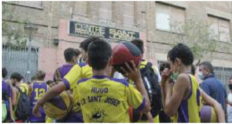
Una de les protestes del club per reclamar la reobertura del pavelló.