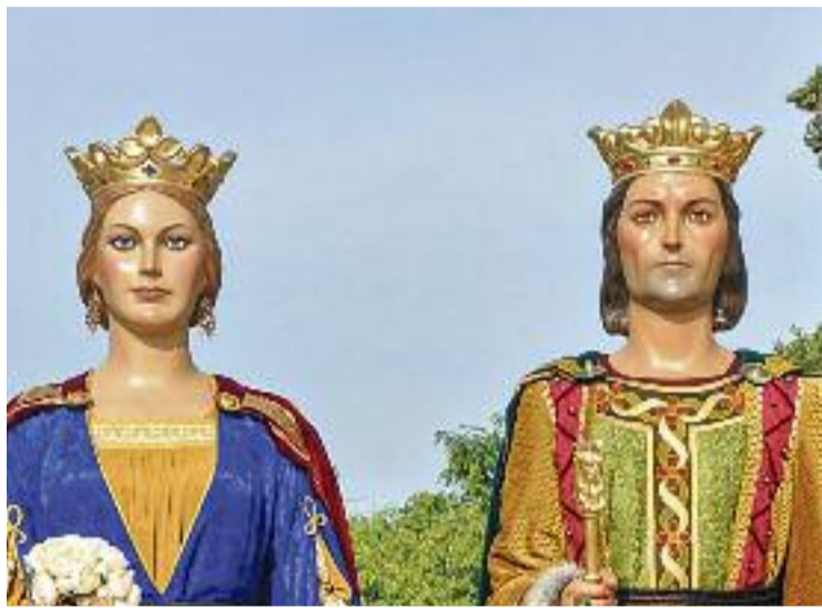
Els gegants van ser els grans protagonistes del Ple.

Un altre dels punts destacats de la sessió de dilluns va ser l'a-