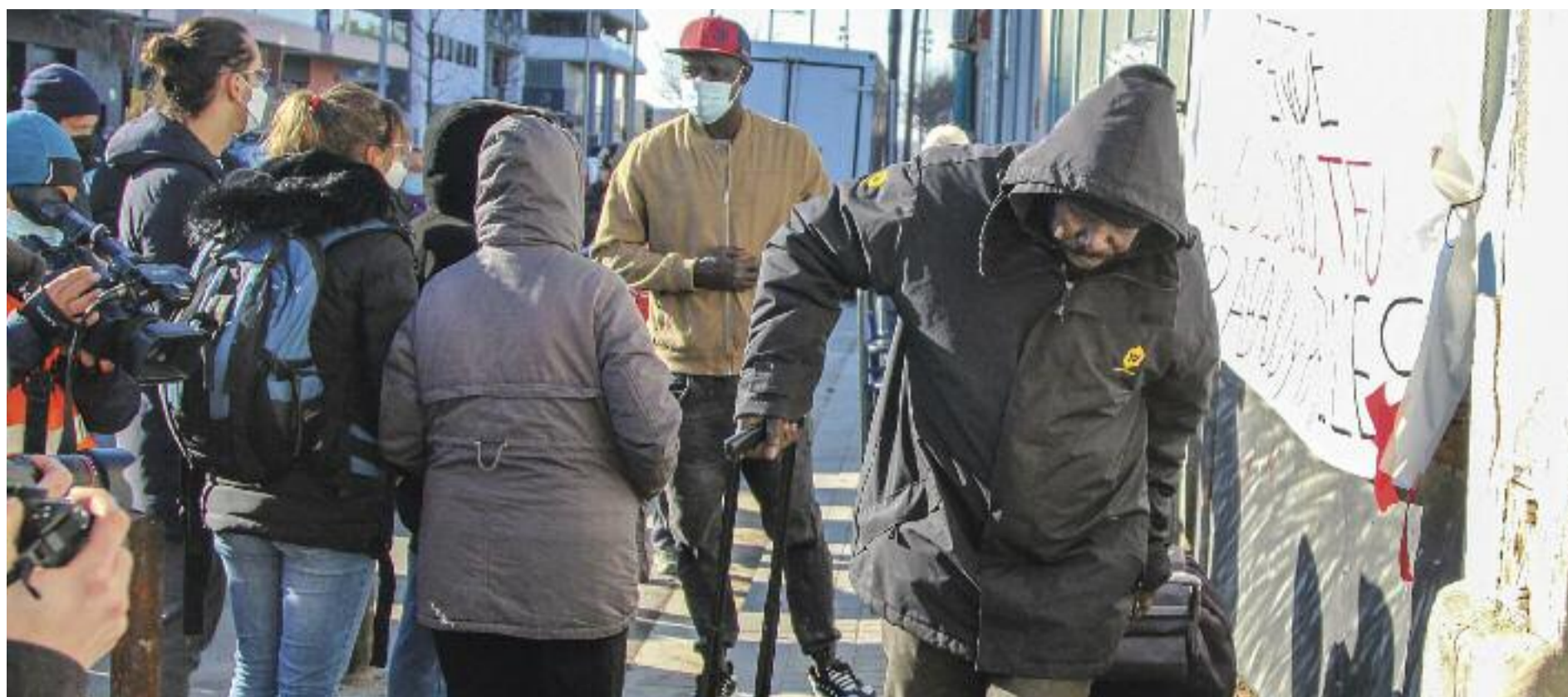
Un dels afectats abandona la nau, en primer terme, mentre que al fons un altre parla amb la premsa.