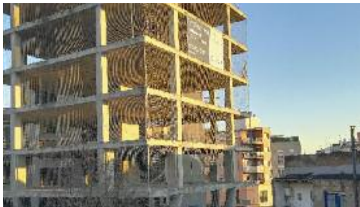
L'edifici 'torre' amb el cartell anunciant la venda de pisos.

Segons va avançar El Mirall.net i ha pogut confirmar Línia Nord , els promotors de les obres han trencat les negociacions amb l'Ajuntament i han decidit rebutjar la proposta municipal, que implicava reduir a sis plantes l'alçada de l'edifici a canvi de l'adquisició via permuta d'uns terrenys ubicats a la zona de la CIBA, pròxims al riu. La negativa a la permuta per compensar la pèrdua de sòl edificable que plantejava el consistori és patent en l'esquelet de l'edifici a mig construir, on des de fa uns dies penja un cartell de l'empresa Culmia anunciant la venda dels pisos. Precisament, aquesta companyia ja té en exposició els futurs