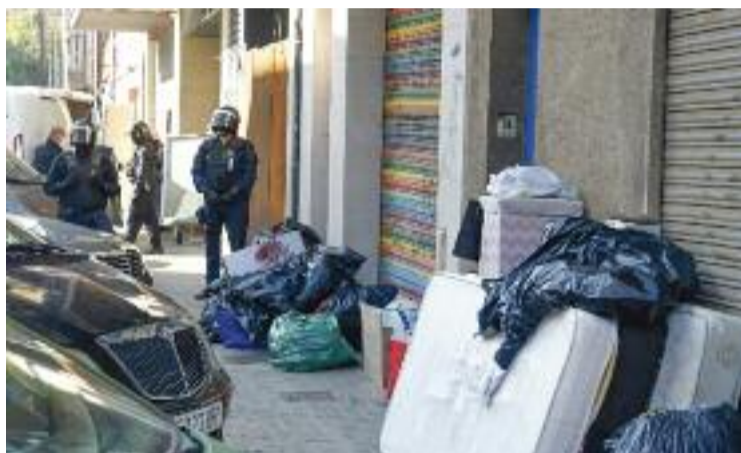
Pertinences apilades en un desnonament a Sant Roc.