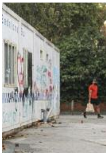
El mòdul de Sant Roc.

Aquesta aposta per la comissaria implica la renúncia del govern local a la rehabilitació del degradat mòdul policial de Sant Roc, que va iniciar l'exalcalde Xavier García Albiol el passat setembre i que actualment es trobaven en fase d'adjudicació. L'Ajuntament vol traslladar aquests mòduls a la comissaria del Turó del Caritg perquè formin part d'un nou circuit de seguretat viària destinat als infants.