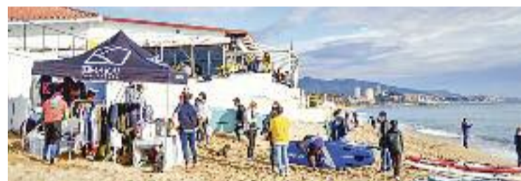
El Club Nàutic Bétulo de Badalona en una imatge d'arxiu.

EQUIPAMENTS ▶ La Generalitat i la Federació Catalana de Vela estan treballant en diferents alternatives per garantir la continuïtat dels clubs nàutics afectats per la Llei de Costes espanyola, com el Bétulo de Badalona. Una de les propostes sobre la taula que podria blindar les entitats sota amenaça d'enderroc seria la seva adscripció a una zona portuària.