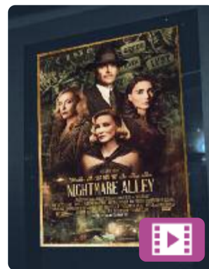
El callejón de las almas perdidas Guillermo del Toro

Guillermo del Toro presenta aquest re-make de la pel·lícula de 1947 El callejón de las almas perdidas , en què Bradley Cooper es posa a la pell d'un home ambició, amb talent per a la manipulació i l'engany. El protagonista coneix una pitonissa tan perillosa com ell, interpretada per Cate Blanchett, que es convertirà en la seva aliada per estafar milionaris.