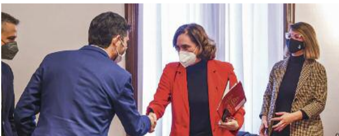
El vicepresident Jordi Puigneró i l'alcalde Ada Colau en la signatura de l'acord dimecres.

En la mateixa línia es va expressar Puigneró, que creu que la millor manera de lluitar contra aquestes desigualtats socials és crear ocupació de qualitat i va assegurar que això passa per transformar l'àrea de les Tres Xemeneies en un pol digital i audiovisual. En aquest sentit, el vicepresident va situar l'aprovació del Pla Director Urbanístic (PDU) d'aquest tram del litoral com un pas clau per establir els usos de la zona.