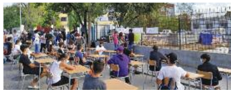
Una de les protestes dels alumnes de l'Institut Nou.

Les famílies de l'Institut Nou ja van protagonitzar el passat setembre una original protesta per denunciar el retard en la instal·lació dels mòduls per a les noves promocions.