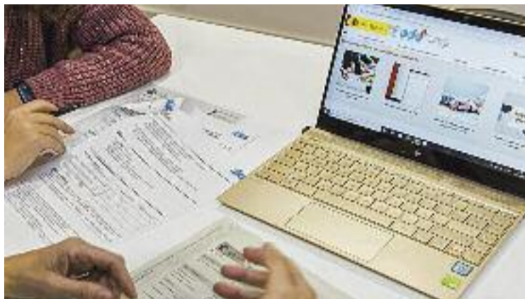
Més de 1.500 famílies han rebut atenció enguany.

El Punt d'Assessorament Energètic (PAE) impulsat pel govern local ha doblat en els primers deu mesos del 2021 les famílies ateses per pobresa energètica respecte a les xifres de l'any anterior, assessorant un total de més de 1.500 nuclis familiars. En aquest mateix període també s'ha multiplicat per dos l'elaboració d'informes de Risc d'Exclusió Residencial, uns documents essencials per evitar que les companyies procedeixin a deixar sense subministrament elèctric o d'aigua les llars més vulnerables. Des del consistori atribueixen aquest notable increment a la tornada a la presencialitat, ja que durant gran