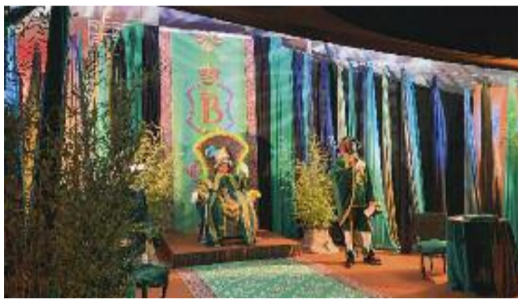
L'edició del Campament Reial del 2020 al parc de Montigalà.

Des del consistori acusen el PP de voler "boicotejar" l'esdeveniment provocant la suspensió fins a dos cops de la mesa de contractació, ja que a les reunions no es va presentar cap regidor de la formació. En aquest sentit, els populars només reconeixen un dels dos ajornaments i l'atribueixen a la indisposició d'un dels seus representants.