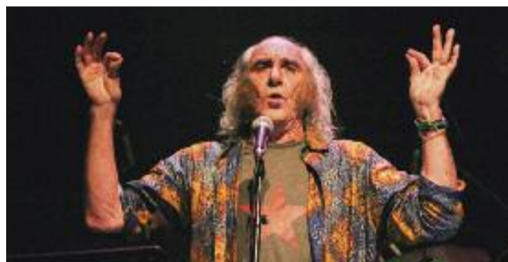
El cantautor Pau Riba, en una imatge d'arxiu.

de desembre a la Sala Albéniz de Tiana, on fa temps que té establerta la seva residència. "Ja m'aneu comentant que em veieu molt prim, per més que menjo tot seguint escrupoloses pautes dietètiques, però perdo un parell de quilos setmanals. Tot això està essent molt més portable i possible mercès als ajuts rebuts fins ara. A tots i a cadascun moltes gràcies per aconseguir que tot això deixi de ser fosc i extrem. Visca el foc!", conclou el cantautor en el seu missatge, on assegura que, malgrat tot, tant ell com el seu entorn més proper estan esperançats.