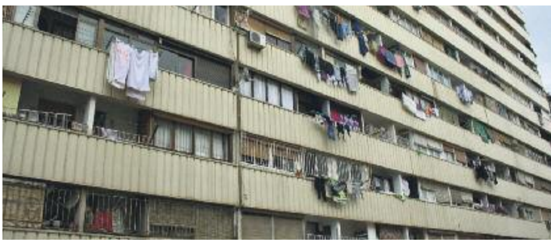
El bloc Venus va ser un dels edificis de la Mina afectats per aquest episodi de talls de llum.

Es dona la circumstància que les instal·lacions elèctriques dels tres edificis –que els veïns qualifiquen d'obsoletes perquè tenen prop de 50 anys–