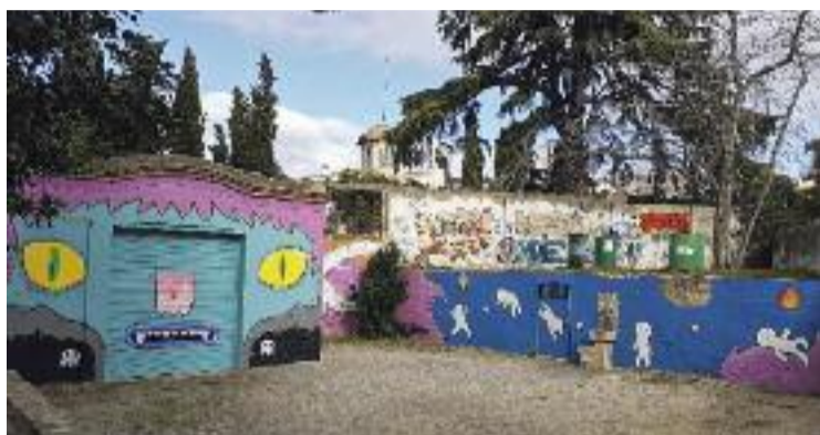
El parc del Dr. Mascaró acollirà una jornada reivindicativa.

"Durant la Festa Major es van tancar diversos espais on tenen lloc les activitats liderades per entitats. Això va indignar els tianencs. Necessitem més que mai que les entitats puguin desenvolupar la seva activitat amb el suport i la mà estesa de l'Ajuntament", assenyalen en l'escrit, on reivindiquen el paper de les agrupacions en la dinamització de la vida al municipi. Sota aquesta premissa, les entitats han organitzat aquest dissabte la jornada