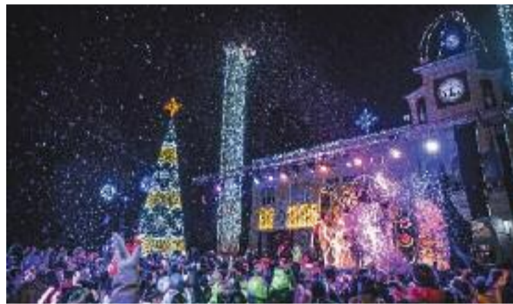
L'encesa de les llums d'aquest 2021 a Santa Coloma.

amb l'encesa de llums celebrada a la plaça de la Vila. La programació continuarà amb espectacles i activitats de tota mena com la versió nadalenca del festival de circ Passatge In-sòlit, el Mercat de Nadal a la plaça del Rellotge o la tradicional Diada de Santa Coloma el dia 31 de desembre. En paral·lel, el govern local manté de la mà de la Creu Roja la campanya solidària de recollida de joguines i també s'organitzaran una sèrie d'esdeveniments per promocionar el comerç local.