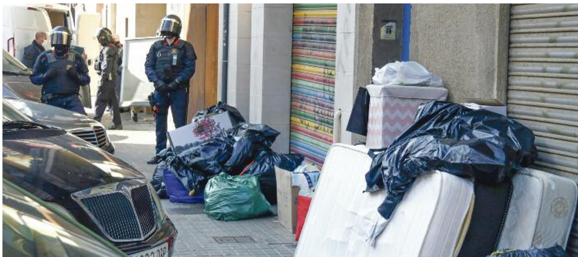
Les pertinences d'una família desnonada recentment al barri badaloní de Sant Roc amuntegades a la vorera.