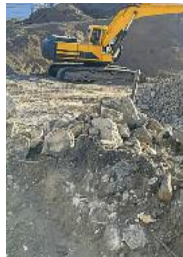
El solar afectat.

mençar a muntar cinc dies abans de l'adjudicació del contracte, que no es va signar fins a finals de gener. Des del PP, però, neguen que es vulnerés en cap cas la llei de contractació, ja que es va modificar el contracte de la Cavalcada de Reis per permetre que el muntatge del campament arrenqués abans de la formalització de l'adjudicació.