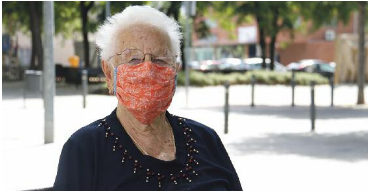
La gent gran acaba patint diferents discriminacions a causa del pes que té la tecnologia en qüestions com el passaport covid.

Davant d'aquesta situació, la manera més senzilla d'aconseguir el document implica o bé demanar que algú proper faci el tràmit o bé anar al Centre d'Atenció Primària (CAP), però aquesta última solució té inconvenients. "Moltes persones grans tenen por de sortir de casa, sobretot pel que veuen a la