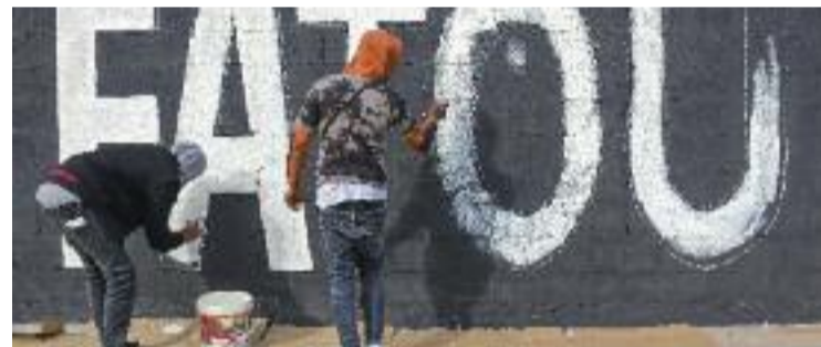
Supervivents de la nau del Gorg pinten el mural de record.