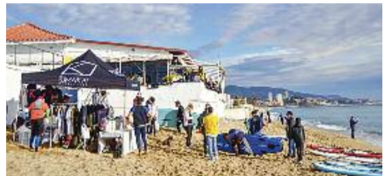
Façana exterior del Club Nàutic Bétulo en una imatge d'arxiu.

EQUIPAMENTS ▶ El Club Nàutic Bétulo de Badalona haurà d'enderrocar les seves instal·lacions. Així li ha notificat aquesta setmana la Generalitat en compliment de la Llei de Costes espanyola, que ataca directament a la continuïtat de construccions com la que l'entitat utilitza a la platja dels Pescadors des de la seva fundació el 1972. El nou govern local ja s'ha reunit amb els responsables del club per treballar una estratègia jurídica conjunta contra aquesta resolució del govern català, que emplaça l'en-