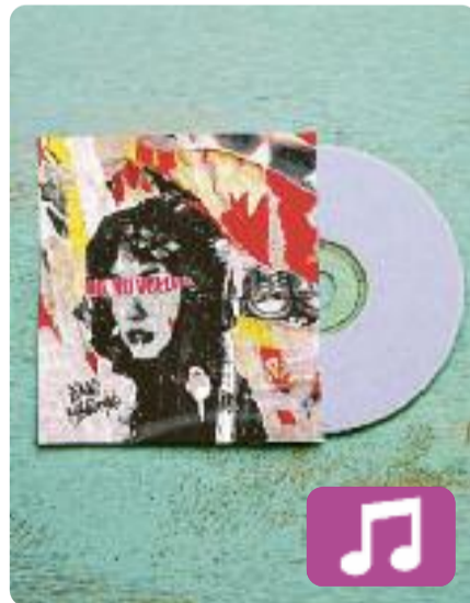
No, no vuelve Dani Martín

Va jugar amb nosaltres fent-nos creure que l'esperat retorn d'El Canto del Loco es faria realitat aviat, però finalment va anunciar la publicació del seu nou disc (en solitari, és clar): No, no vuelve . Aquest treball, que acaba de veure la llum, recupera una desena de cançons de la mítica banda que Martín va liderar amb èxit fins a la seva desaparició, l'any 2010.