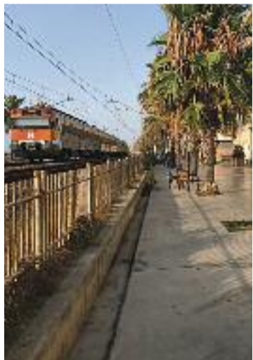
La via del tren.

compatibilitzi les demandes dels municipis”, va apuntar Sánchez. La paralització de la iniciativa es produeix després que diversos consistoris unissin forces per fer front comú contra la instal·lació d'aquests plafons de quatre metres d'alçada. “Hem aturat la instal·lació d'un mur més a la ciutat treballant plegats”, celebra al respecte la FAVB, que va impulsar una multitudinària protesta passat setembre.