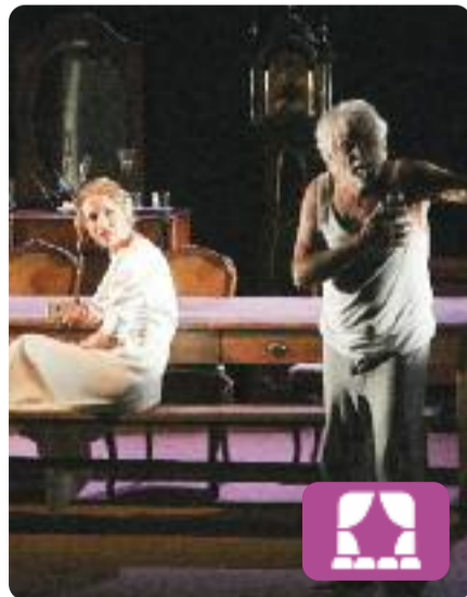
L'oncle Vània Anton Txékhov

A L'oncle Vània , estrenada el 1899 a Moscou, Anton Txékhov va reflectir en cada personatge un final apocalíptic. El tedi, la vida malgastada, l'amor no correspost o la feina inacabable marquen la seva existència. Ara, el director lituà Oskaras Koršunovas dirigeix aquesta obra en el marc del Temporada Alta.