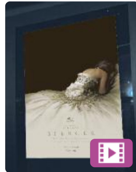
Spencer Pablo Larraín

Kristen Stewart es posa a la pell de Lady Di en aquest biopic que explica un cap de setmana crucial a la vida de la princesa de Gal·les. En aquell moment, a principis dels 90, Diana Spencer va decidir que el seu matrimoni amb el príncep Carles no tenia futur. Van ser tres dies a la finca de Sandringham, en una de les seves últimes vacances de Nadal a la reialesa.