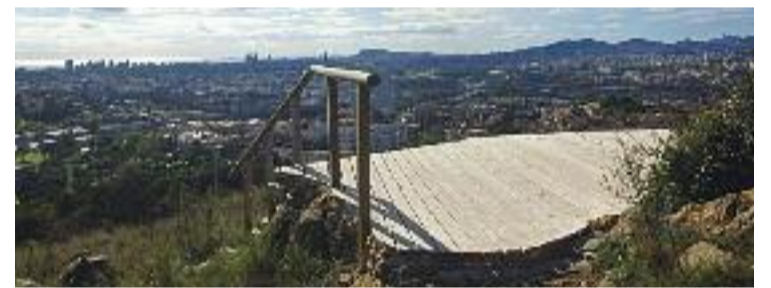
El mirador ofereix bones vistes i és un lloc apartat.

La iniciativa –que ha comptat amb el suport del servei municipal de drogodependències– sembla haver fet efecte i els voluntaris han detectat un descens considerable en els residus acumulats i tampoc s'ha tornat a fer foc a la zona. Tanmateix, els veïns reclamen més cartells indicant la normativa d'ús per protegir un espai fràgil on des del 1989 s'hi han produït fins a set incendis.