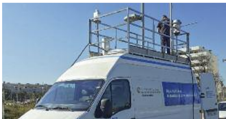
La unitat mòbil instal·lada a la Catalana.

El primer punt polèmic fa referència a una nova proposta que va traslladar el govern local a la resta d'assistents i que consisteix en la instal·lació d'una sèrie de passarel·les i d'un mirador a la desembocadura del riu. Aquesta iniciativa –que va en la línia del projecte del refugi de biodiversitat i dels camins didàctics impulsats a la zona fluvial de Santa Coloma– va ser rebuda amb força crítiques per part de les entitats i de grups com Sant Adrià En Comú, que consideren