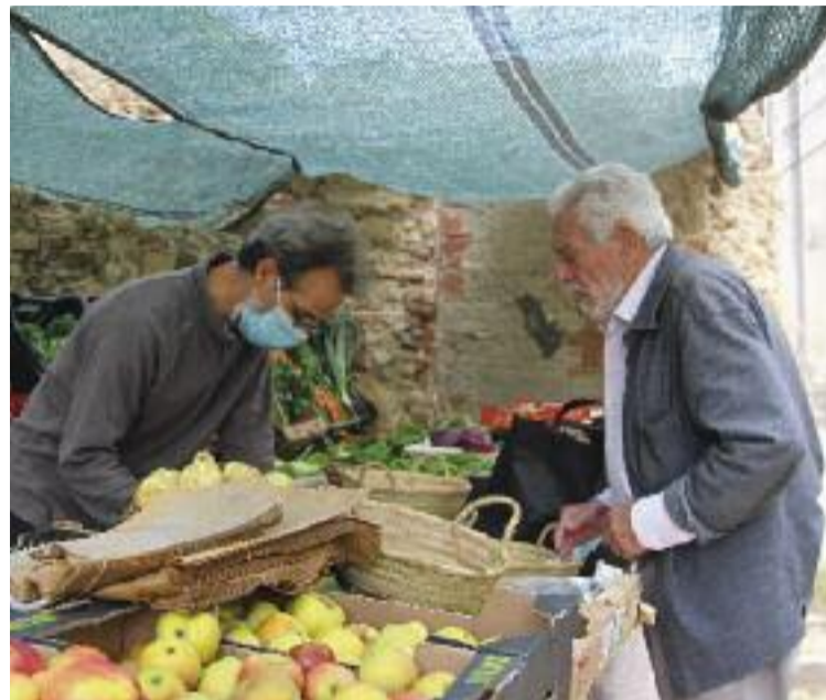
L'agricultura de proximitat està guanyant força a Badalona en els últims anys.