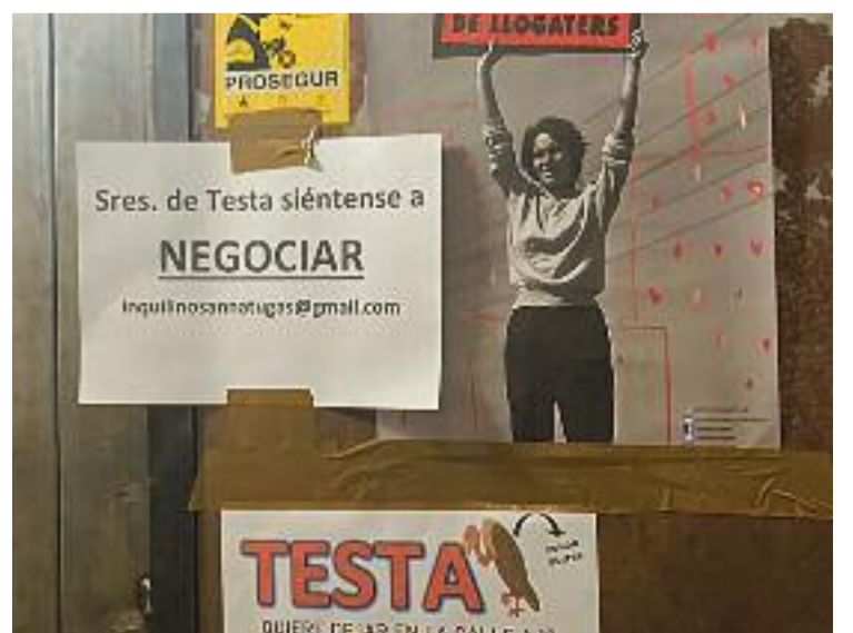
Un dels pisos tapiats a l'edifici afectat del carrer Anna Tugas.

Cal recordar que l'Ajuntament de Badalona va aprovar en el Ple celebrat el 30 d'abril de 2019 la declaració del club i les seves instal·lacions com a Bé Cultural d'Interès Local (BCIL) per l'interès en les activitats de promoció i pràctica d'esport nàutic.