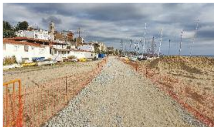
Les noves obres d'ampliació del passeig marítim de Montgat.

La previsió és que les obres s'allarguin prop de nou mesos i que puguin estar enllestides per a l'inici de la temporada d'estiu, tenint en compte que afecten un tram important del passeig marítim de la població. El pressupost total de l'actuació és de més d'un milió d'euros i va a càrrec de l'AMB.