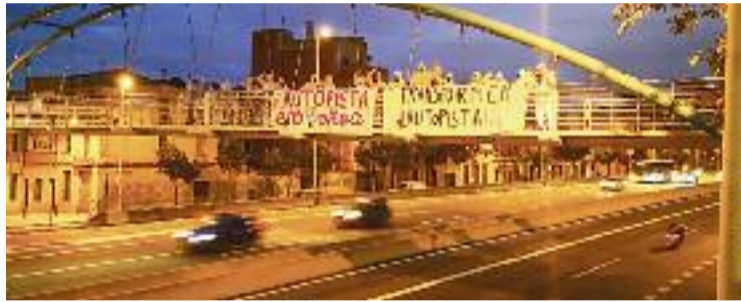
La protesta de Transformem l'autopista sobre la C-31.

“Ho repetirem les vegades que faci falta: la nostra única previsió és eliminar la barrera física i social que suposa la C-31. Estarem absolutament en contra de tot el que sigui consolidar l'autopista amb noves infraes-