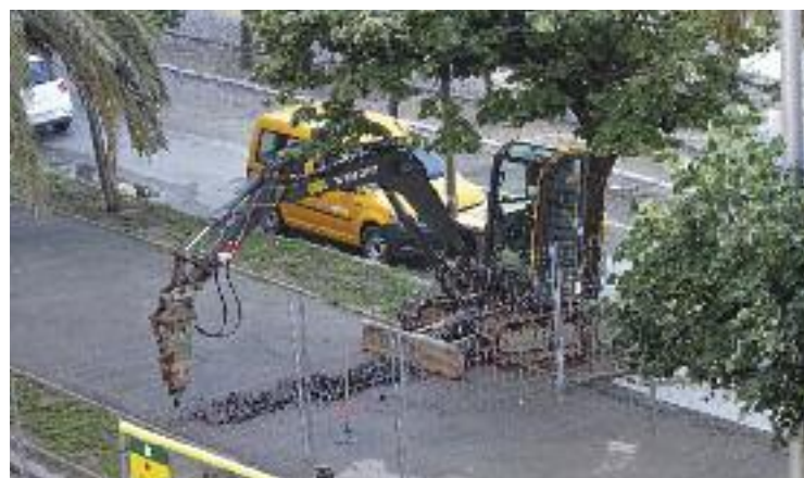
Les obres a la Rambleta van aturar-se el 2019.

Cal recordar que les obres en aquest passeig es van aturar el novembre del 2019 en detectar la presència de sòls contaminats. La Rambleta està clausurada des d'aleshores a l'espera d'uns treballs de descontaminació encara en procés d'adjudicació i que s'allargaran prop de tres mesos.