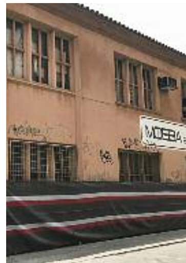
La Mobba.

tència que els obliga a abandonar el pavelló perquè no tenen cap “títol” que en legítimi la seva possessió. Orrantia apunta que tenen documentació que acredita que no ocupen “en precari” les instal·lacions, sinó que va ser l'entitat qui va finançar la construcció de la pista, i confia en un canvi de rumb judicial.