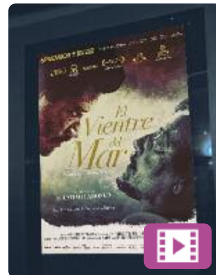
El ventre del mar Agustí Villaronga

Juny de 1816. La fragata l'Alliance, de la Marina francesa, embarranca en un banc de sorra davant de les costes del Senegal. Han d'abandonar la nau. Com que els botes disponibles no són suficients, es construeix un petit rai, una embarcació precària on obliguen a pujar 147 homes. El corrent l'arrossega i desapareix a l'horitzó. Un horror que va durar dies i dies.