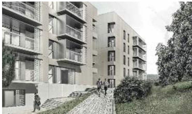
Imatge virtual dels pisos socials que es construiran a Montgat.

En el cas de Montgat es construiran 130 habitatges en dos solars situats al Turó del Sastre. Pel que fa a Sant Adrià, els 57 pisos projectats estaran ubicats a la zona de la Catalana.