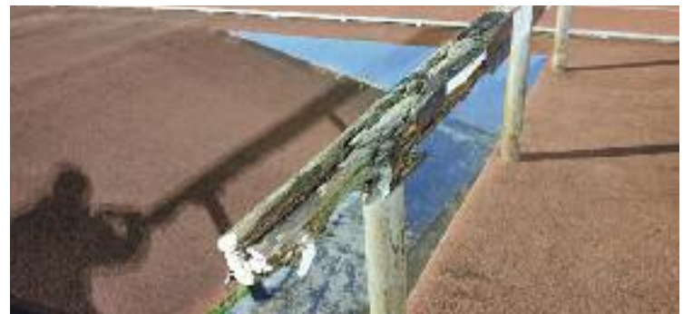
Alguns dels desperfectes de les pistes d'atletisme Paco Àguila.

EQUIPAMENTS ▶ El club d'atletisme UGE Badalona ha aprofitat el canvi de govern a la ciutat per tornar a alçar la veu i reclamar la reforma promesa de les pistes Paco Àguila. A través de les xarxes socials, l'entitat s'ha dirigit als membres del nou executiu per recordar que la millora de les instal·lacions –un dels projectes que figurava en el pressupost d'inversions aprovat per PP i PSC el passat març– estava prevista per a principis del 2022.