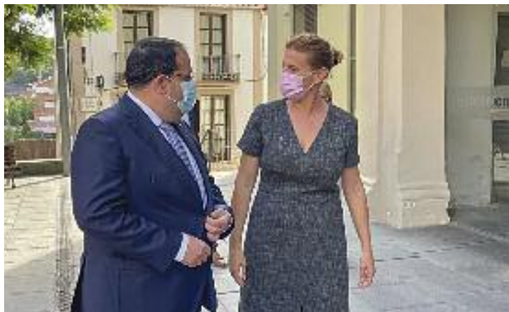
Martorell, en una visita recent del conseller d'Interior.

En la seva interlocutòria, la jutgessa resol que la jove acu-