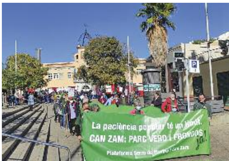
La protesta per un parc de Can Zam 'verd' del passat diumenge.

Des de l'entitat apunten que es tracta d'una trobada principalment "tècnica" on es tornaran a posar sobre la taula els arguments recollits en les al·legacions que es van presentar conjuntament amb altres agrupacions locals el passat juliol i que finalment van ser desestimades íntegrament per part de govern municipal. En paral·lel, el recurs de reposició presentat per la plataforma precisament contra aquesta desestimació segueix el seu curs adminis-