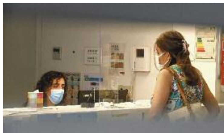
Una dona atesa per serveis socials en una imatge d'arxiu.

Barcelona (AMB) i de l'Ajuntament de Barcelona- neix gràcies a la col·laboració de diversos ajuntaments com el de Badalona o Sant Adrià de Besòs amb entitats especialitzades com Càritas, la Fundació Formació i Treball o Sant Joan de Déu-Serveis Socials. L'objectiu principal de la iniciativa és poder garantir una alternativa d'habitatge segura tant des d'una perspectiva temporal, com jurídica i emocional, que permeti a les persones ateses reconduir la seva vida i la dels seus fills.