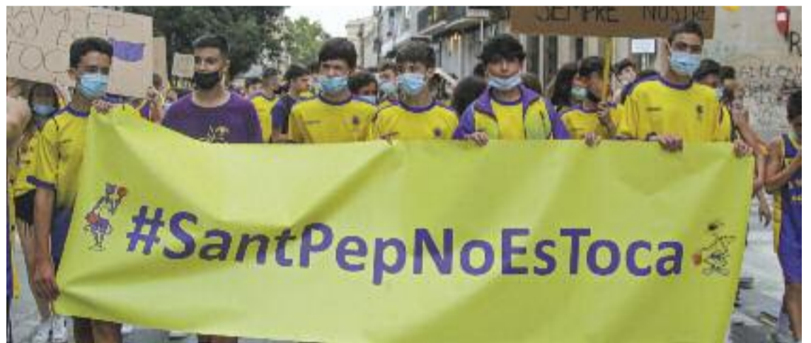
El Sant Josep ha protagonitzat recentment diverses protestes per reclamar la reobertura del pavelló.