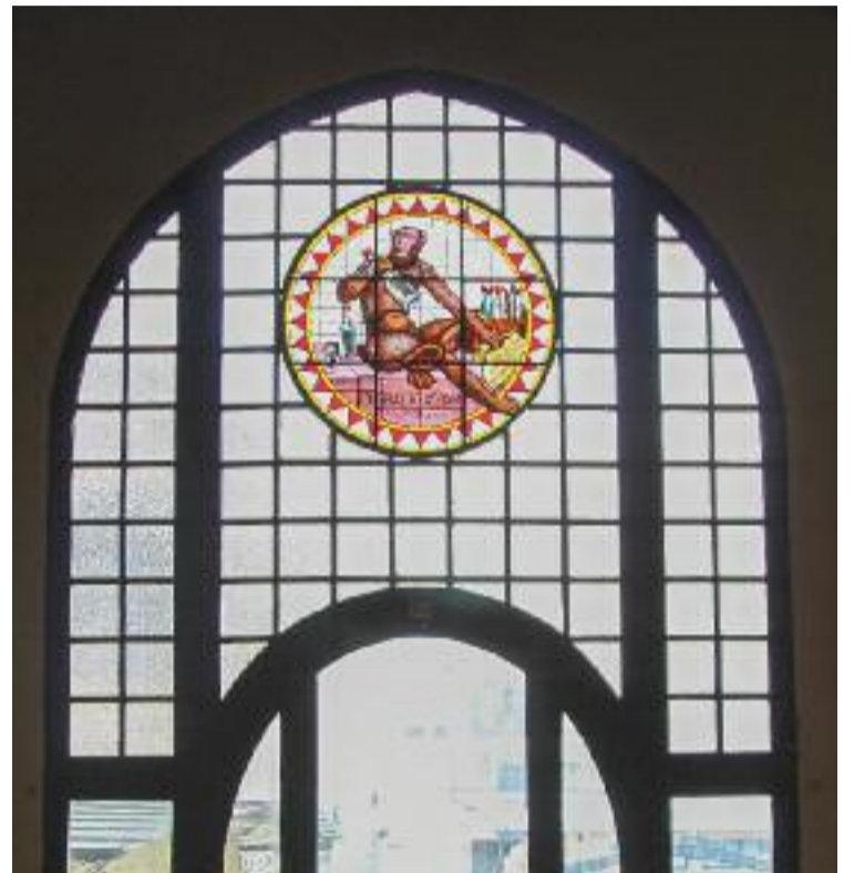
Anís del Mono ha elaborat una edició de luxe per celebrar els 150 anys d'història de la companyia.

evita donar més detalls sobre aquestes iniciatives, més enllà de la voluntat que reverteixen “positivament” en el municipi i del possible paper important que hi pot jugar la gastronomia.