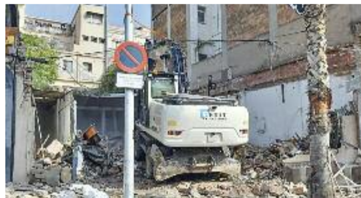
Les màquines enderrocquen La Colmena a la plaça de la Vila.

La jornada reivindicativa tornarà a posar sobre la taula la problemàtica que fa temps que denuncia la Plataforma Salvem el Barri Antic, que lluita per aturar els enderroc i conservar l'essència del barri. Cal recordar que el Jutjat d'Instrucció número 5 del municipi va admetre a tràmit el passat 27 de gener la querrela presentada per un veí contra dos càrrecs públics i un directiu del consistori per presumpta revelació d'informació privilegiada, coaccions i prevariació urbanística en la segona fase de la reforma del nucli antic.