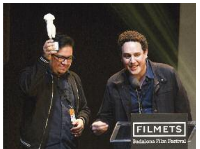
'Una cançó para María', premi a la millor pel·lícula del 2021.

La 47a edició del Filmets es va dur a terme del 22 al 31 d'octubre en un format híbrid on van guanyar pes les sessions presencials, que van tenir com a escenaris el Teatre Zorrilla de Badalona, l'Institut francès de Barcelona, els cinemes Can Castellet de Sant Boi de Llobregat o l'hospital de Can Ruti.