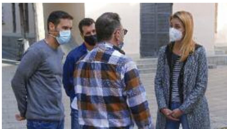
Albiach durant la seva visita a Santa Coloma.

En concret, la proposta dels comuns aposta per la creació d'un Fons de Recuperació social, urbana, i ambiental de barris que tindrà una dotació de 300 milions d'euros cada any i que serà finançat a partir d'aportacions de la Generalitat, l'estat espanyol i els fons de recuperació europeus. Una de les principals característiques de la iniciativa és l'aplicació de polítiques verdes per afrontar problemàtiques com la pobresa energètica, que a Santa Coloma afecta