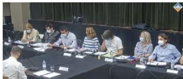
El Ple del mes d'octubre de l'Ajuntament de Montgat.

En la sessió ordinària del Ple no es van portar a votació finalment els pressupostos municipals, que van ser retirats de l'ordre del dia, però sí que es van aprovar dues mocions per frenar l'escalada del preu de la llum i per una nova llei de finançament local en relació amb l'impost de la plusvàlua.