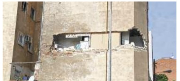
L'esquerda a l'edifici del número 16 del Passatge de la Torre.

HABITATGE ▶ L'Ajuntament de Badalona ha reclamat les costes d'enderroc als propietaris del bloc afectat per aluminosi del barri de la Salut. Segons han denunciat els afectats i informa Badalona Comunicació , el consistori els ha enviat recentment una carta on emplaça cadascuna de les famílies a pagar més de 40.000 euros per la demolició fa prop de dos anys de l'edifici situat al número 16 del Passatge de la Torre.