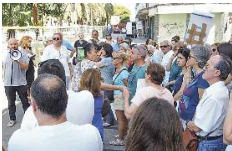
Protesta a la Rambleta per demanar el trasllat d'arbres el 2019.

El motiu d'aquest retard és que encara no han començat les tasques prèvies de descontaminació del terreny, que havien de començar al maig i que tenen un cost total de prop de dos milions d'euros. L'encarregada de dur a terme aquesta actuació és l'Àrea Metropolitana de Barcelona (AMB), que actualment està estudiant les sis empreses que es van presentar a la licitació dels treballs. En aquest sentit, des de l'ens confirmen que s'està analitzant l'oferta d'una companyia que està molt per sota d'aquesta estimació de gairebé dos milions d'euros. Si l'empresa no compleix finalment amb els requisits mínims, l'adjudicació de la descontaminació seria per a una altra de