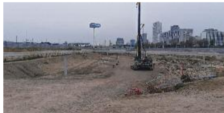
Els terrenys on s'està construint el nou hotel de luxe.

Pel que fa a Hard Rock, la companyia estaria buscant nous emplaçaments a la zona de Barcelona per reubicar l'hotel, tal com informa La Vanguardia .