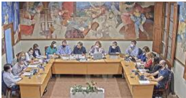
El Ple de dimarts va suposar la tornada a la presencialitat