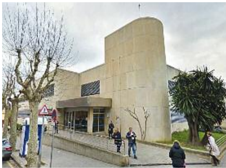
El CAP va perdre especialitats amb la pandèmia.

La iniciativa és fruit de la col·laboració entre l'Associació de Veïns del Barri de Santa Maria-Santa Anna-Tió, juntament amb el sindicat premianenc CNT i la Marea Pensionista local. Tots plegats van fer públic un co-