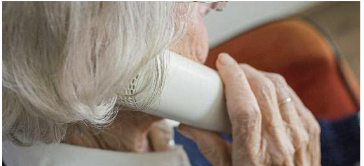
A l'àrea metropolitana, només una de cada 10 places de residència és pública.

el de la Mercè en els quals les persones no volen deixar la seva casa per raons que van més enllà de les econòmiques. “Encara que ja no em pugui valdre per mi mateixa, a casa hi estic bé, és la meva casa”, diu la Mercè. “Encara més quan amb la pandèmia es va veure com es tracta la gent gran a les residències”, afegeix.