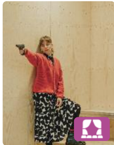
Hedda Gabler Hedda Gabler