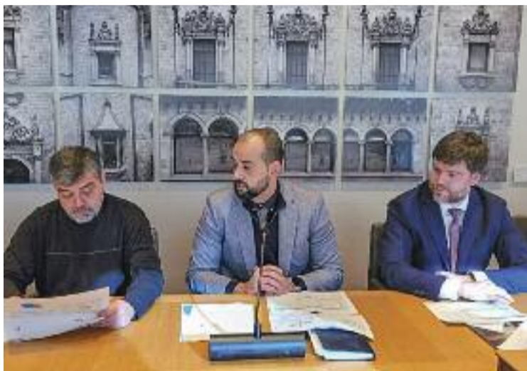
Un moment de firma per a l'aprovació de les ajudes.

A la comarca, les ajudes ascendiran a gairebé 7,4 milions d'euros i serviran per reduir en més de 2,1 milions d'euros la factura energètica anual dels municipis. A banda, la Diputació informa que s'aconseguirà un es-