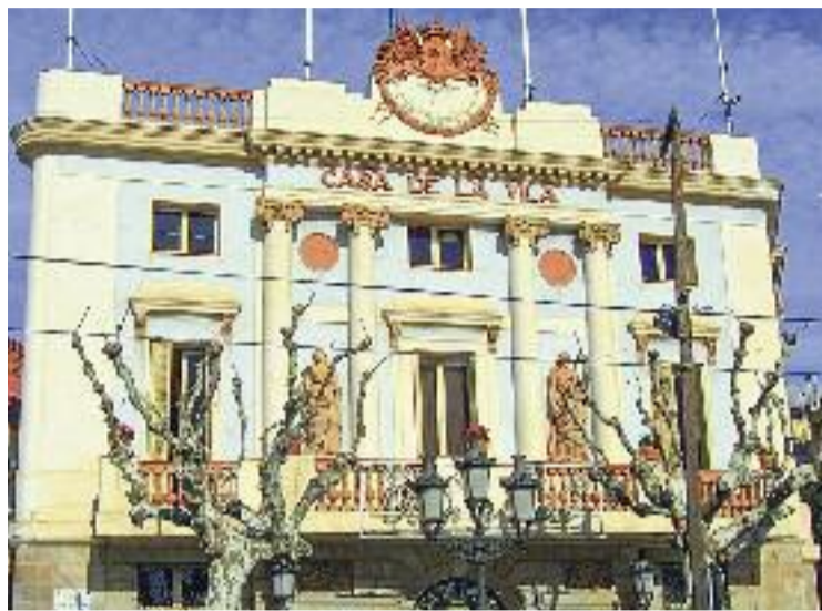
L'Ajuntament ha rebut una subvenció de 225.000 euros.