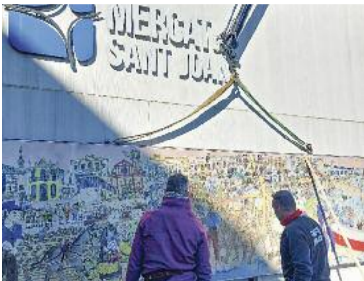
Dos operaris treballen en la instal·lació del mural, el dia 19.

També hi tenen protagonisme els edificis i llocs emblemàtics com ara la Torre d'en Nadal, les típiques cases de cos, l'església, el mateix mercat municipal,