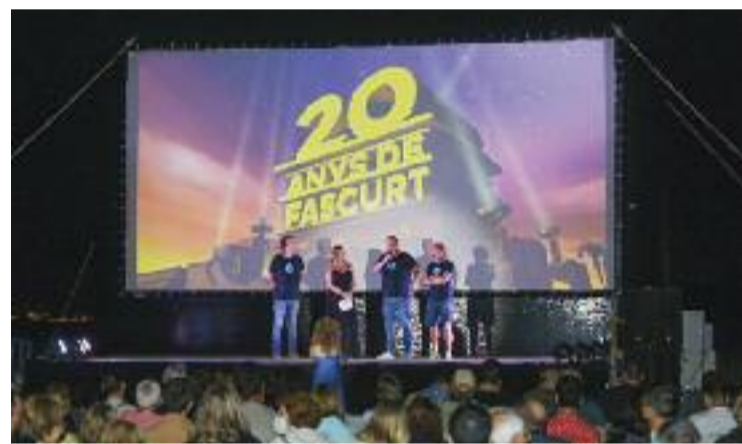
Imatge de la celebració del 20è aniversari del festival.

També va marcar el calendari del juny el festival Ple de Riure, que va celebrar la seva vint-i-quatre edició del 12 al 16 de juliol amb les actuacions de Rhum&cia , o les companyies Jordi Sabanni i Marcel Gros .