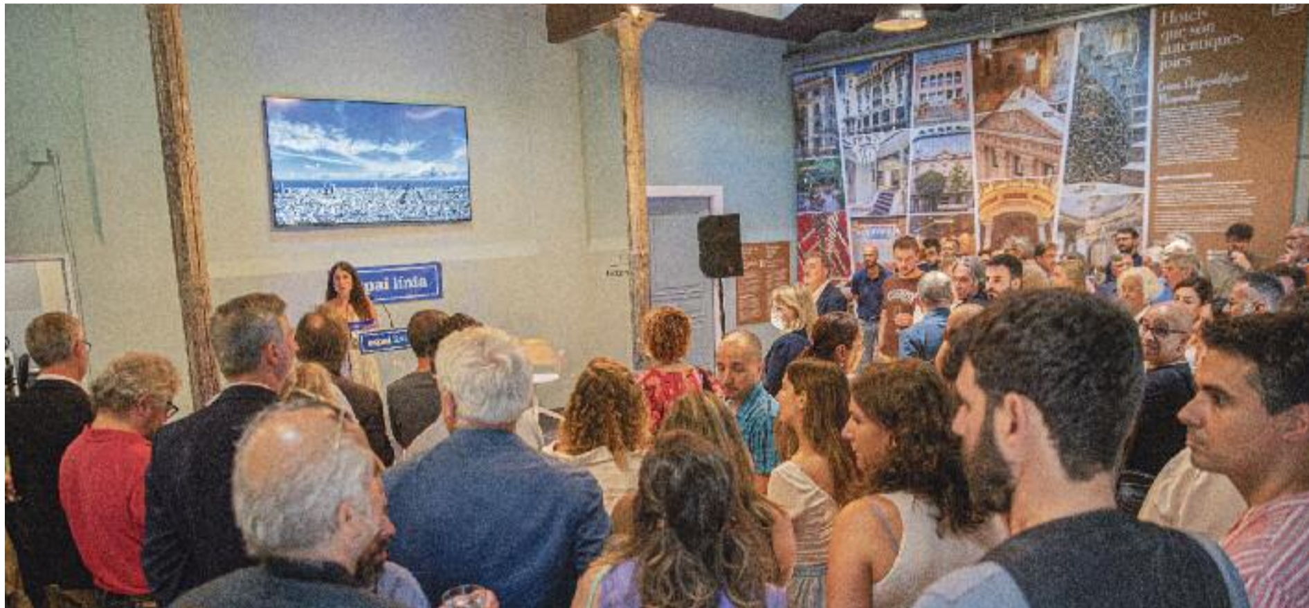
Prop de 150 persones van assistir a l'acte inaugural.

E strena lluïda. Divendres 15 de juliol, en plena onada de calor, Espai Línia es va omplir de gom a gom en el dia de la inauguració d'aquest primer Centre de Comunicació de Proximitat impulsat pels diaris Línia i Comunicació 21 al carrer Girona, 52 de Barcelona.