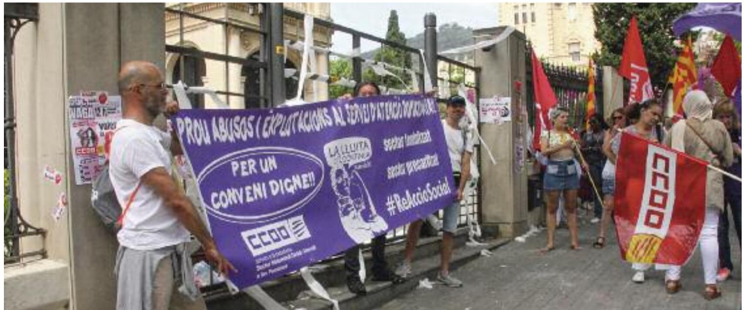
Una imatge d'una protesta de treballadores de l'atenció domiciliària.

L'Àurea, del sindicat de treballadores de la llar i les cures Sindillar, té clara la resposta: "Les fei-