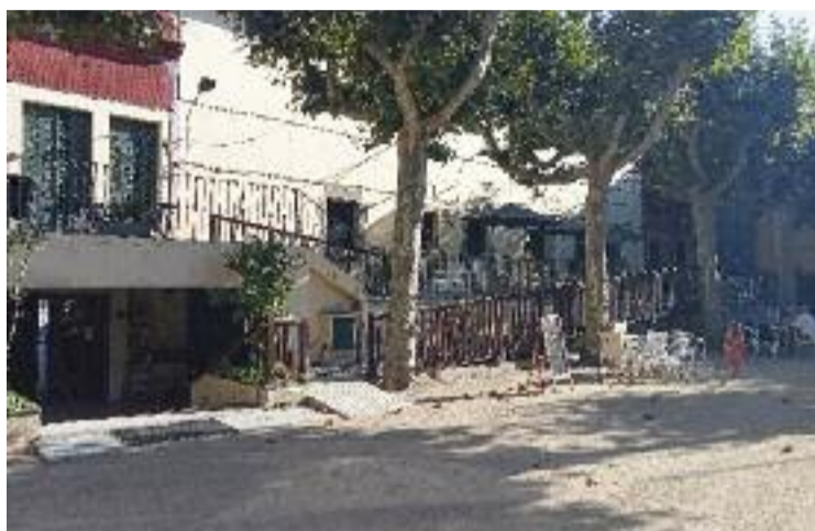
El Casino és una entitat privada de caire cultural i recreatiu.

A banda, el Casino va presentar, setmanes abans, un recurs al Tribunal Superior de