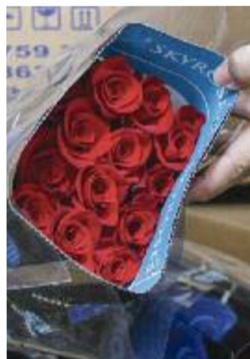
El cultiu de flors, una causa.

MASNOU/TEIÀ ▶ Agents de Mossos d'Esquadra i de les policies locals del Masnou i de Teià van detenir el 25 de juny 11 persones quan es disposaven a robar en una zona d'hivernacles situada al camí del Mig, al paratge de la Riera del Bou. Els fets van tenir lloc a la matinada, mentre els agents de Mossos feien una comprovació rutinària. Els detinguts van passar a disposició judicial.