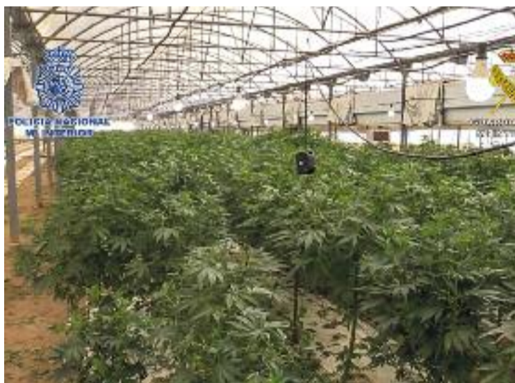
Pla general de la plantació de marihuana intervinguda.

La investigació va començar el març del 2021, quan es va tenir coneixement d'una parcel·la de 32 hectàrees, aparentment dedicada al cultiu industrial legal. En aquesta plantació havien col·locat cartells i logotips de di-