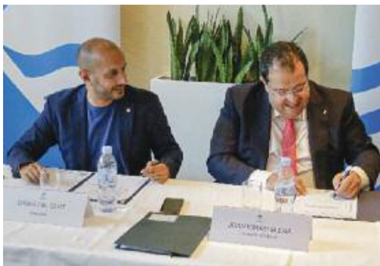
El president del Consell Comarcal i el conseller fan la signatura.

La previsió és que el procés estigui enllestit a la tardor i que els agents que guanyin la plaça facin la formació a l'Institut de