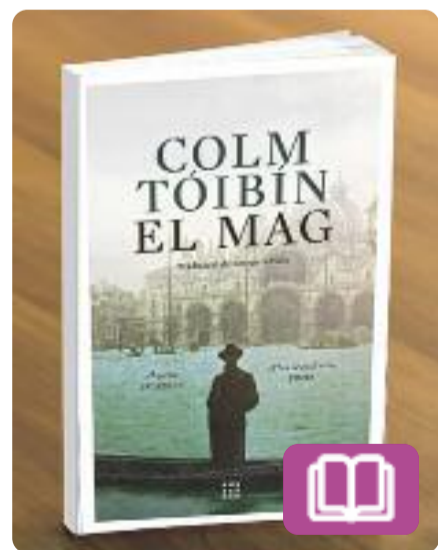
El Mag Colm Tóibín

1933. Thomas Mann i la seva dona abandonen Alemanya anticipant l'horror del nazisme. Ell és l'escriptor més famós del seu temps, però quins secrets oculta? El Mag explica la història d'un home imperfecte i ambivalent. L'home que amb l'esclat de la Primera Guerra Mundial va situar-se al costat fosc de la història. El pare de sis fills que va amagar la seva homosexualitat.