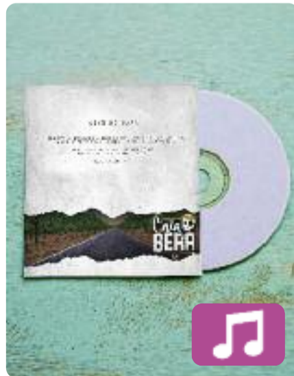
Això no para Cala Bera

El grup de "rap combatiu" (així es defineixen) Cala Bera ha publicat aquest mes de juliol el seu segon àlbum de llarga durada. Dos anys després de Volum 1 (Flufi Records, 2020), els del Penedès tornen amb Això no para (Flufi Records, 2022), un disc que recull set cançons en català. Entre aquests nous temes destaca una col·laboració amb el DJ Plan B: Lliçons .