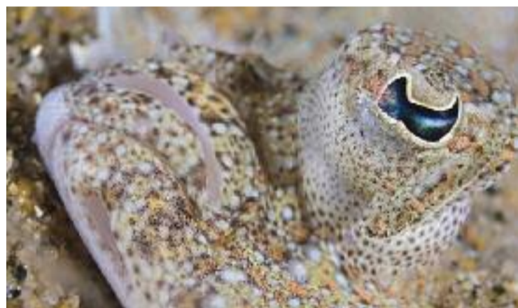
Imatge de la sèrie guanyadora del vilassarenc: Foto: Marc Casanovas

ca obligatòria del certamen: una rajada, fos en part o sencera, havia de ser la protagonista de la primera de la sèrie de sis fotografies que els concursants havien de presentar al jurat. "Aquella nit hi havia més mar de fons del normal, i la rajada viu a poca fondària, que és a on més afecta la mar de fons", diu Casanovas. En tot cas, el fotògraf avisa que les dificultats no responen només a trobar rajades: "Es nota que any rere any les espècies van de baixa, de cavallets fa temps que no en veiem".