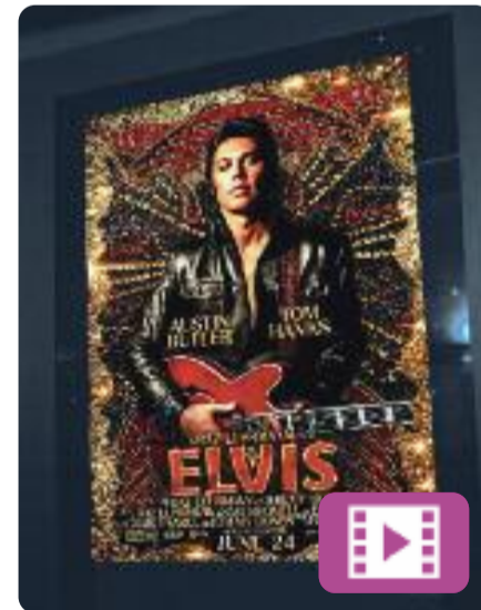
Elvis Baz Luhrmann

Un repàs per la vida i l'obra d'Elvis Presley (Austin Butler) a partir de la seva relació amb el coronel Tom Parker (Tom Hanks), el seu enigmàtic mànager. La pel·lícula explica des de l'ascens del mític cantant fins al seu èxit sense precedents, en un context de canvis als Estats Units. I, enmig de tot plegat, hi ha Priscilla Presley (Olivia De Jonge).