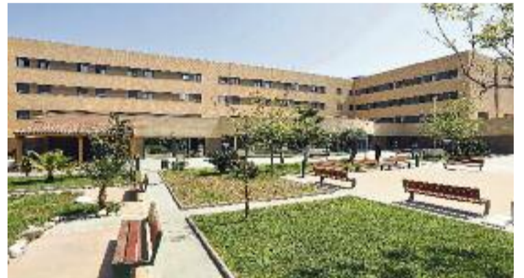
La residència Ca n'Amell de Premià en una imatge d'arxiu.

Cal recordar que actualment hi ha una investigació oberta per homicidi imprudent contra els responsables del geriàtric i que almenys una dotzena de famílies dels residents han decidit personar-se com a acusació particular.