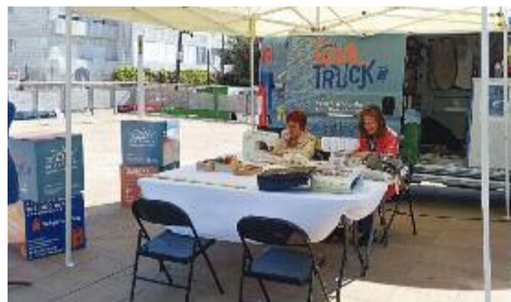
El servei Didaltruck s'ubicarà a la Biblioteca Ernest Lluch.

La iniciativa impulsada pel consistori compta amb el suport de l'Agència de Residus de Catalunya i està realitzada per l'entitat solidària Solidança.