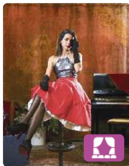
Jo vull ser miss Mousse Cuplets

Una jove tortosina disposada a viure el seu particular somni barceloní aterra a la capital catalana carregada d'il·lusions. Aviat, però, haurà de fer front a una cursa d'obstacles amb la qual no comptava: la precarietat laboral, la inflació i altres sorpreses l'esperen a la gran ciutat. El 19 de maig, gaudiu de cuplet, sàtira i un toc d'erotisme. Al Tinta Roja de Barcelona.