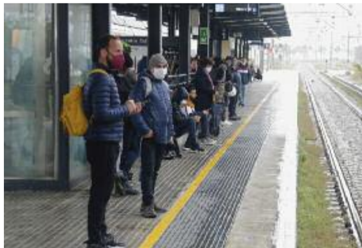
Usuaris de línies de Rodalies del Maresme en una imatge d'arxiu.

URBANISME ▶ L'Ajuntament d'Alella està treballant per actualitzar la delimitació del seu terme municipal amb la població veïna de Teià. Aquest procés –que ja s'ha dut a terme a altres municipis com Montgat i Tiana– pretén consolidar les línies que separen els municipis per resoldre distorsions, com és el cas d'aquelles propietats que actualment estan situades a mig camí.