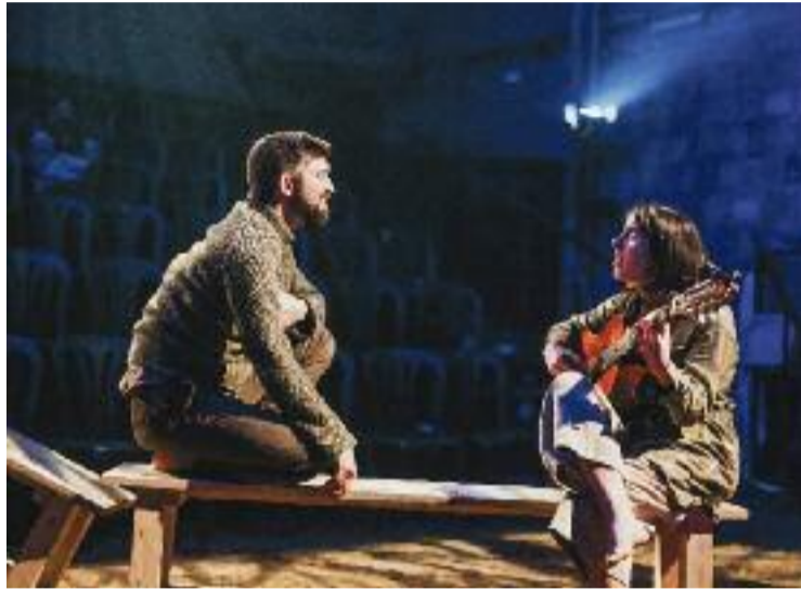
L'obra 'Canto jo i la muntanya balla', guanyadora dels Butaca 2021.