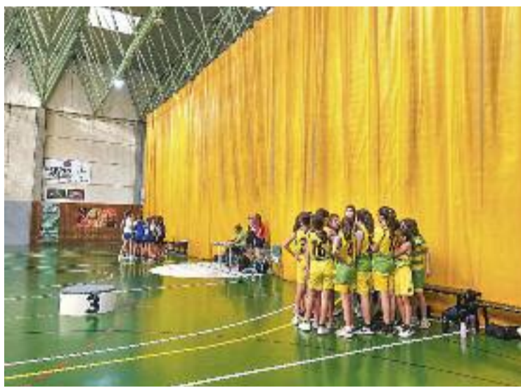
Els nous ajuts extraescolars ja es poden sol·licitar.

Segons informa el consistori encapçalat per Damià del Clot en un comunicat, aquestes ajudes van destinades a famílies amb infants empadronats al municipi i matriculats als centres acadèmics públics locals. Es podran beneficiar d'aquesta subvenció tant els alumnes d'Infantil com els dels cursos de Primària i de Secundària, de manera que la convocatòria està oberta per a vilassarencs d'entre els 3 i els 16 anys.