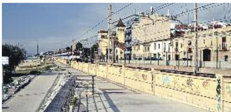
La masia de Can Targa i les Cases de Mar en una imatge d'arxiu.

La proximitat geogràfica de les dues zones les converteix en dos punts clau a l'hora de definir el front marítim masnoví. El primer dels projectes ja es troba en mans de la Comissió Territorial d'Urbanisme de la Generalitat després que en el Ple del passat mes de gener s'aprovés la modificació provisional de la iniciativa que proposava el govern local. El punt va comptar amb la negativa de tots els grups de l'oposició, que van coincidir en qualificar els canvis introduïts de "pelotazo" urbanístic.