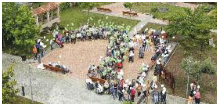
Usuaris de la residència Ca n'Amell en una imatge d'arxiu.

En aquest sentit, les famílies volen anar més enllà i consideren que la querrela de la fiscal en cap de Mataró que va iniciar tot el procés judicial hauria d'incloure també a les administracions competents, ja que, a parer dels afectats, s'haurien de depurar responsabilitats per "deixadesa de funcions" en el control de les mesures que els responsables