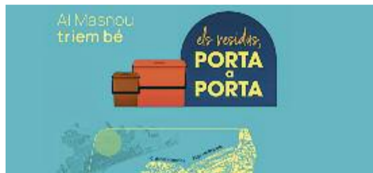
Cartell que anuncia la prova pilot de recollida de residus.

En un comunicat, el govern local demana als veïns "implicació" en el projecte, que requereix un "canvi d'hàbits cap a la reducció dels residus generats, la correcta separació i el compliment del calendari i l'horari". Cal recordar que la iniciativa porta a porta ha estat objecte de polèmica en diversos municipis com ara Barcelona.