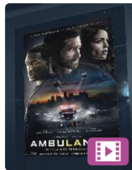
Ambulance Michael Bay

En un acte desesperat per aconseguir diners per pagar els deutes mèdics de la seva dona, el veterà Will Sharp recorre a l'única persona a la qual sap que no hauria de recórrer: el seu germà adoptiu Danny. Ell li oferirà participar en el robatori més gran de la història de la ciutat. Quan la fugida s'esguerra, tots dos segrestaran una ambulància que porta un policia ferit.