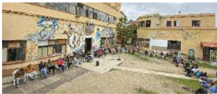
Els col·lectius s'enfronten a un altre desnonament amb data oberta.

En paral·lel, les entitats segueixen en negociacions amb l'executiu encapçalat per Rafa Navarro per desencallar l'expropiació de les instal·lacions. Els col·lectius proposen que un cop materialitzat aquest procés, se'ls cedeixi l'antiga fàbrica en un règim de "gestió comunitària" per poder seguir "donant vida i dinamitzant l'espai".