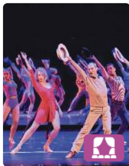
A Chorus Line Antonio Banderas

Un dels musicals més importants de tots els temps, inspirador, apassionant i amb un cos de ball espectacular. En un teatre buit, en un escenari nu, s'hi fa el càsting per a un nou musical de Broadway. Per a un grup de ballarins, és el moment de la seva vida, l'oportunitat per fer el que sempre havien somiat en gran: ballar. Al teatre Tívoli de Barcelona.