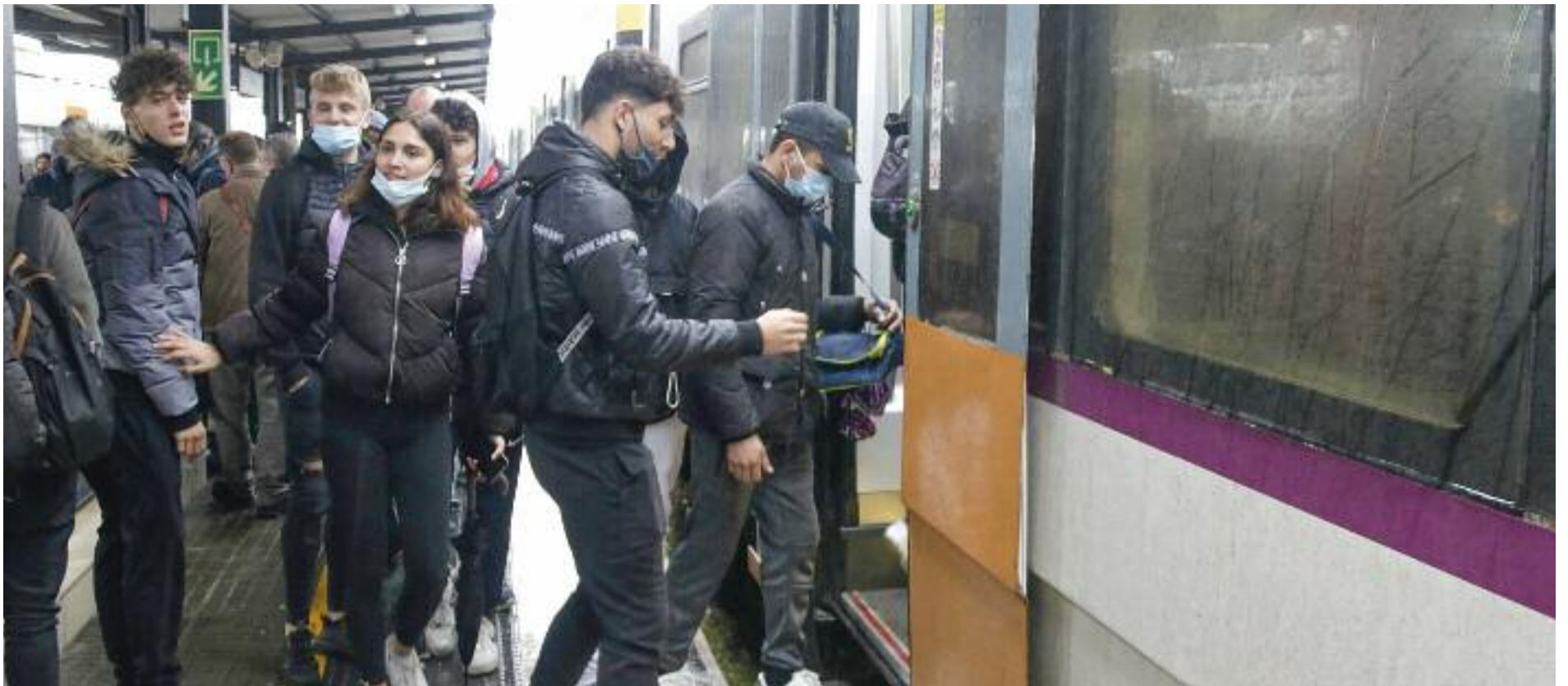
Aquest últim incident va obligar a aturar durant més de tres hores la circulació a la zona del Baix Maresme i el Barcelonès Nord.