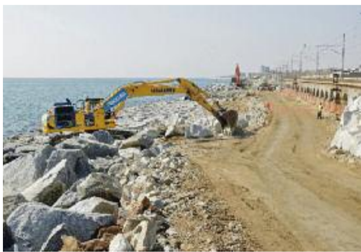
L'Estat ja va fer obres per consolidar el litoral el 2020.

A l'horitzó, però, sembla clar que tard o d'hora s'haurà d'abordar la viabilitat del trasllat de la línia de Rodalies a l'interior, on no estaria tan exposada als temporals i tindria una menor afectació en el dia a dia dels veïns de la zona. Aquest projecte faraònic compta amb el suport dels consistoris de la majoria dels municipis del litoral metropolità i