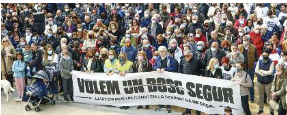
Una protesta impulsada per la família va recórrer els carrers de Mataró el passat 29 de març.

La mobilització ja ha donat els seus primers fruits: l'anunci públic de les batudes de caça deixarà de ser només una recomanació –tal com marca la normativa actual– i passarà a ser obligatori. Tanmateix, Morgado