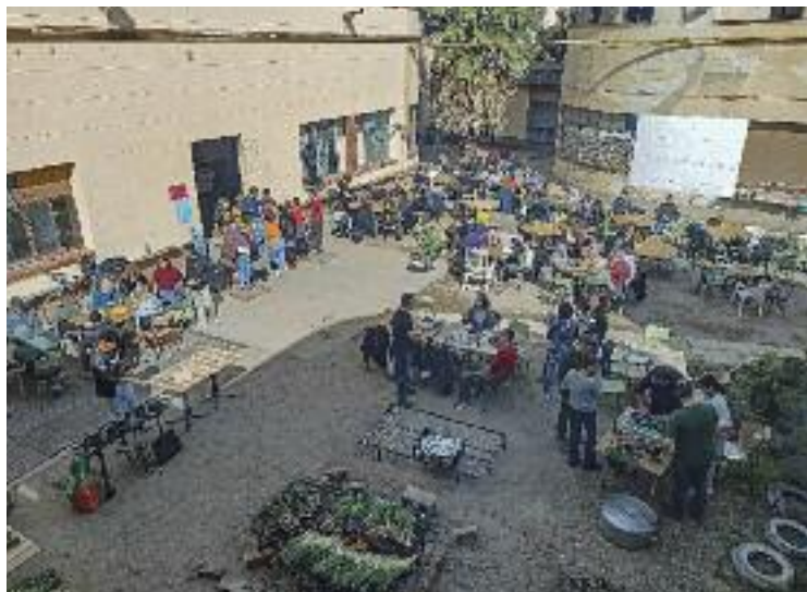
El pati interior de l'antiga fàbrica de Can Sanpere.

En paral·lel, les entitats que des de fa prop de vuit anys ocupen Can Sanpere segueixen en negociacions amb l'executiu encapçalat per Rafa Navarro per