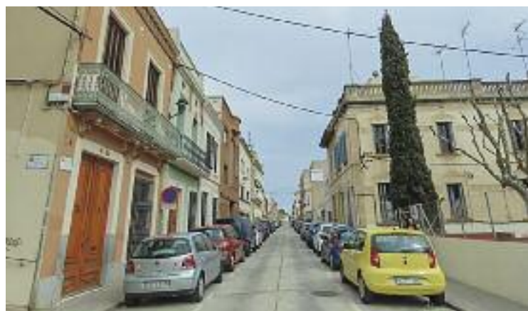
Una de les zones d'Ocata on s'implantarà la zona verda.

Per la seva banda, l'entitat Ocata Activa continua amb la campanya de recollida de firmes en contra del projecte de reordenació de la zona verda i reclamen a l'administració que explori alternatives per a la gestió de l'espai públic i els serveis que no impliquin "extorsionar les butxaques dels veïns", com seria un servei de transport públic gratuït.