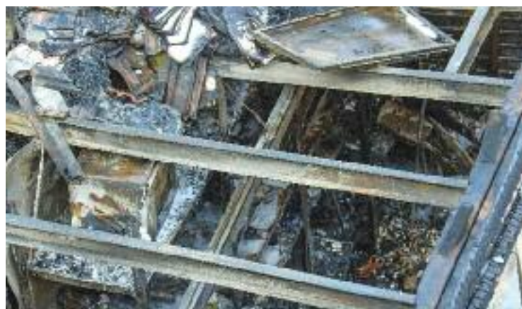
La nau va quedar completament calcinada per l'incendi.

A l'espera de poder accedir a la nau, una dotzena dels afectats continuen temporalment allotjats en habitatges socials municipals i en un hostel de la zona.