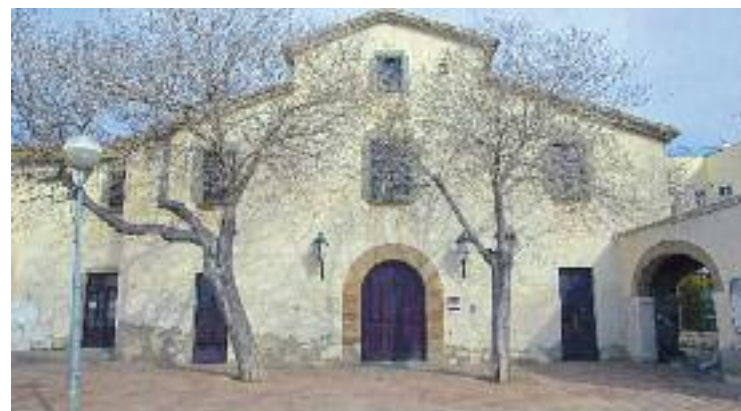
La masia de Can Manent, en una imatge d'arxiu.

En la sessió del Ple, els grups també van aprovar per unanimitat una moció per garantir l'accessibilitat bancària a la gent gran i també va tirar endavant, malgrat l'abstenció del govern local, la proposta presentada per ERC on s'emplaçava l'administració a negociar amb la Sareb la cessió de pisos per ampliar el parc d'habitatge públic protegit.