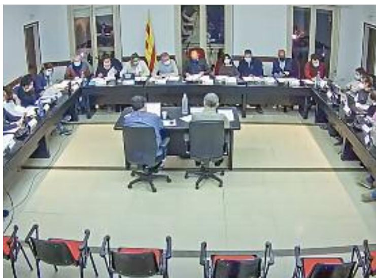
El Ple de març a l'Ajuntament de Vilassar de Mar.

Malgrat el suport unànimе i coincidir en el fet que es tracta d'una iniciativa "imprescindible", diversos grups com el PSC o Cs van aprofitar l'ocasió per reclamar al consistori encapçalat per Damià del Clot celeritat l'aplicació de les mesures consensuades, ja que de l'anterior Pla d'Igualtat només es van poder executar la meitat de les accions proposades. Encara més crítics al respecte es van mostrar els representants de Babor, que consideren que el procés de diagnòsi previ hauria d'haver estat més ampli, incloent-hi un percentatge més elevat de la ciutadania. També es va pronunciar amb contundència el