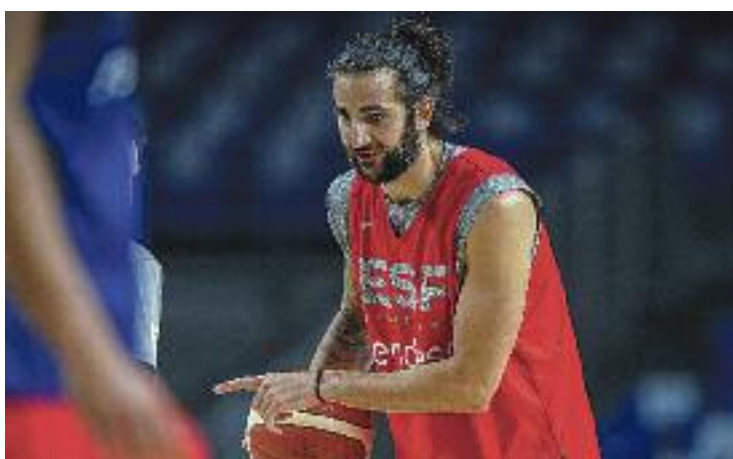
Ricky Rubio, en un entrenament amb la selecció espanyola.

"He gaudit moltíssim del bàsquet progressivament i últimament m'estan sortint molt bé les coses. Ara toca un petit parèntesi perquè després pugui fruitar encara més", assegura, som-