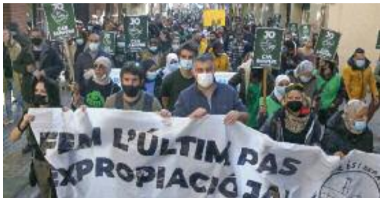
Els col·lectius de la fàbrica, en una protesta al gener.

El moviment en defensa de la fàbrica va reunir-se amb diputats de la CUP, els comuns i ERC, així com representats comarcals del PSC i JxCat. En la trobada, la plataforma va demanar a les formacions que, si el jutge executa el desnonament, es garanteixi que els Mossos d'Esquadra no hi participaran per "evitar un conflicte d'ordre públic". Els col·lectius també van reclamar el suport dels grups per instar l'Ajuntament a expropiar l'espai de forma immediata. Pel que fa als compromisos obtinguts, els re-