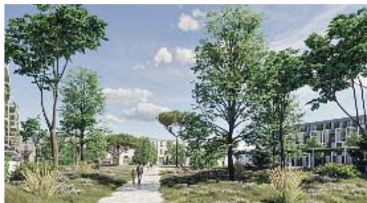
Recreació virtual d'un dels espais reurbanitzats.

Des d'ERC consideren que la proposta municipal hauria d'incloure més infraestructures en matèria d'activitat econòmica per aconseguir que el projecte pugui tenir un retorn per als veïns del municipi. Per la seva banda, el grup de Crida Premianenca s'ha mostrat molt més crític amb el plantejament i en declaracions a Ràdio Premià de Mar asseguraven que la proposta els "espanta" i que cal un debat públic previ al respecte i un pla d'equipaments per absorbir el més que previsible augment de la població al municipi.