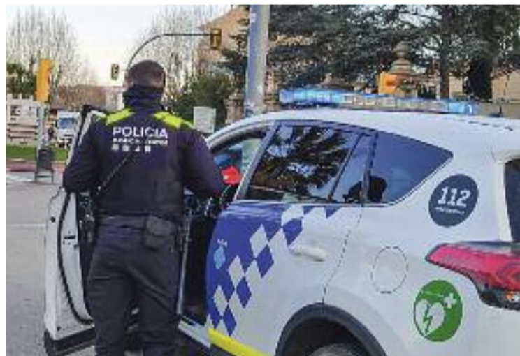
La primera convocatòria de la borsa serà a l'abril.

PREMIÀ DE DALT ▶ L'Ajuntament de Premià de Dalt ha obert el procediment per adjudicar en règim de lloguer dos habitatges de promoció municipal. Els pisos estan ubicats a la zona de La Fàbrica i al torrent Castells, concretament al passatge dels Roures. Per optar als habitatges, els interessats han d'estar apuntats al Registre de Sol·licitants d'Habitatges amb Protecció Oficial.