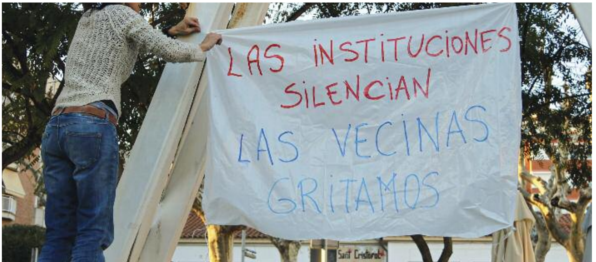
Una veïna penja una pancarta durant la concentració en condemna pels abusos denunciats a Premià de Mar.