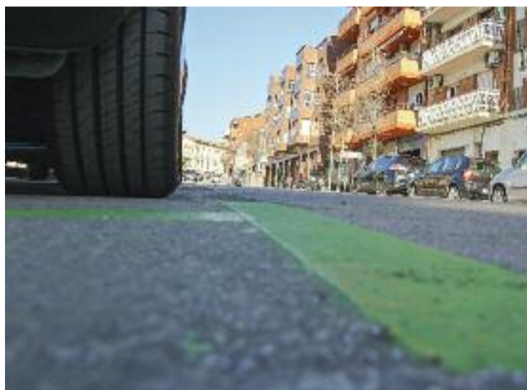
Els canvis a la zona verda han desfermat la polèmica al Masnou.

Segons apunta el govern local, la data per implementar les conclusions de l'estudi sobre estacionament regulat, encarregat per l'administració el 2020, va ser finalment posposada perquè diversos retards en el procés no van permetre fer les trobades amb la resta de grups municipals ni amb els veïns de les zones afectades. "Considerem necessària una implementació gradual d'aquesta reordenació, amb diferents ajustaments i estem treballant en el tipus de regulació (nombre de places, tarifes, horaris...) Per tant, no és cert que es faran pagar 73 euros de quo-