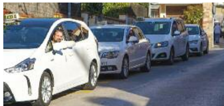
El servei de taxi a demanda va ser impulsat al gener.

Des de l'Associació de Discapacitats Físics del Masnou, que compta amb més de 300 afiliats, asseguren que ja han presentat al·legacions per millorar la iniciativa i reclamen al govern municipal més "sensibilitat" a l'hora d'escoltar les reivindicacions de les entitats locals.