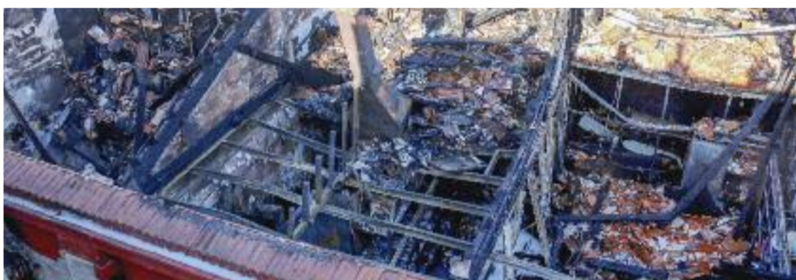
La nau de la Via Octaviana va quedar completament calcinada a causa de l'incendi.

A l'espera de conèixer els resultats de la investigació policial, el govern local ja s'ha posat en marxa i està estudiant la possibilitat d'emprendre accions legals contra el propietari de l'immoble, que segons les primeres indagacions hauria llogat diferents espais de la nau sota un contracte d'oficina sabent que es destinarien a ús residencial. “Ens cal saber quantes persones realment hi vivien i en quines condicions. Si se'n desprèn que el propietari va abusar de persones en situació de vulnerabilitat, l'Ajuntament es personarà com acusació popular”, assenyalava el batlle vilassarenc, que considera que calen mesures contundents per evitar que aquesta pràctica pugui arrelar a la localitat.