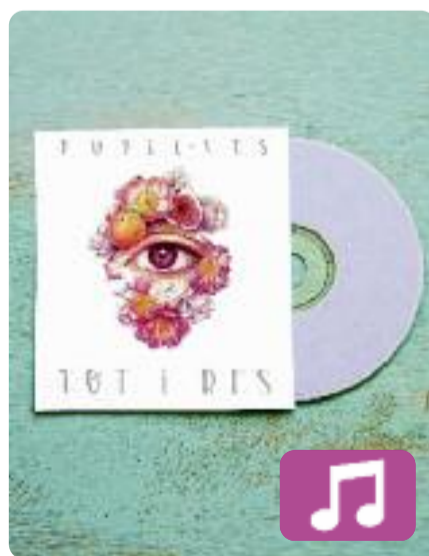
Tot i res Pupil·les

Amor, optimisme i alegria són tres ingredients molt presents al nou àlbum de Pupil·les, Tot i res (Halley Records). El segon disc d'aquestes dues valencianes homenatja el poeta Joan Vinyoli amb el títol i aplega una desena de cançons que s'allunyen una mica del rap més dur que feien abans, i s'inclinen per melodies i ritmes més festius.