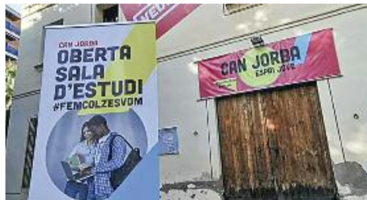
Can Jorba serà un dels espais que es reforçaran amb el pla.

Amb vigència fins al 2026, l'objectiu principal del plantejament és "facilitar als vilassarencs les oportunitats, els recursos i els serveis suficients per viure plenament la seva condició juvenil, promoure el seu desenvolupament integral com a persones i facilitar els seus processos d'emancipació i la seva plena ciutadania, sent aquesta participativa, crítica, constructiva i transformadora", tal com apunta el consistori encapçalat per Damià del Clot en un comunicat. El Pla està estructurat al voltant de quatre eixos principals: transversalitat, emancipació, benestar i salut i participació social, i incorpora bona part de les aportacions fetes per les gairebé 350 persones que van participar en el procés participatiu previ a la culminació de la redacció del document.