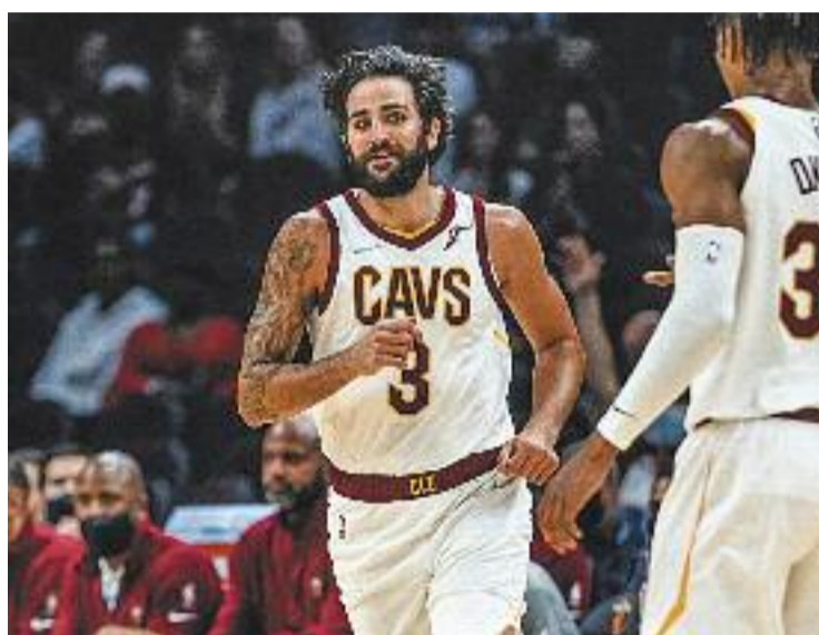
Ricky Rubio, durant un partit amb els Cavaliers.

El masnoví parla des de l'empatia, la mirada àmplia i, sobretot, els fets. Aparca els judicis i prejudicis i es concentra en l'observació i el respecte. En un temps en què les opinions extremes i sobre qualsevol persona o aspecte són la tendència, Rubio té clares les seves limitacions. O, per ser més precisos, els seus coneixements a partir del que sap i ha viscut. "Confio en els metges. Si pregunten de bàsquet, contestaré jo. Si pregunten de vacunes, els preguntaré a ells. Confiança en els professionals i en la humanitat, hi