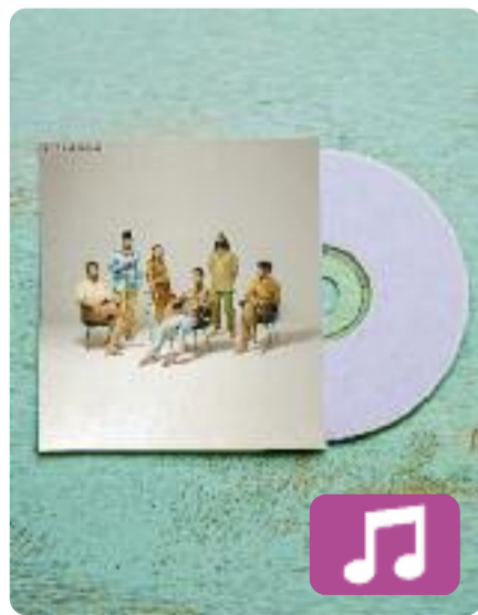
Present El Diluvi

Viure i gaudir aquí i ara: aquesta és la filosofia del quart àlbum del grup El Diluvi. Sota el títol Present (Halley Supernova), la banda de la comarca valenciana de l'Alcoià presenta una quinzena de cançons que demostren les seves ganes d'aprofitar, justament, el present. El disc inclou col·laboracions amb artistes com Guillem Solé, el cantant de Buhos.