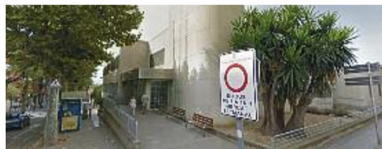
El CAP de Premià de Mar en una imatge d'arxiu.

Per la seva banda, el govern local treballa per posar en funcionament la nova Junta Local de Salut, un òrgan que servirà per abordar les diferents problemàtiques en l'àmbit i que comptarà amb la participació de l'oposició, entitats i personal sanitari.