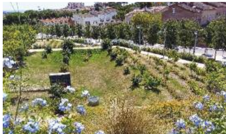
El parc de Vallmora, en una imatge d'arxiu.

En paral·lel a aquesta actuació, l'executiu encapçalat per Jaume Oliveras ha donat el tret de sortida a una de les darreres fases del projecte de reordenació del parc de Vallmora. Aquesta iniciativa preveu la construcció de dues noves pistes poliesportives descobertes amb grades. La previsió és que les obres –que tindran un cost d'uns 370.000 euros i que seran finançades amb una subvenció de la Diputació– s'allarguin prop de tres mesos.