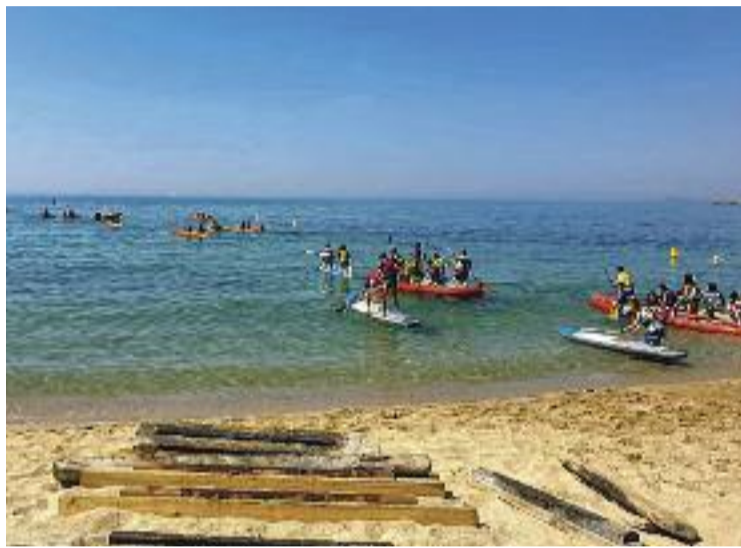
Una de les activitats del club nàutic vilassarenc.