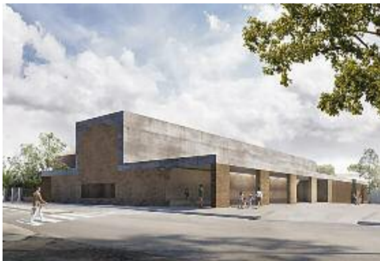
Recreació virtual del nou CAP de Premià de Dalt.

RECICLATGE ▶ La Fundació Humana va aconseguir recollir a Cabrils més de sis tones de material tèxtil usat durant el 2021, principalment roba, complements tèxtils de la llar i calçat. La quantitat recuperada equival a 26.600 peces de roba, de les quals el 50% es podrà reutilitzar i un 35% es reciclarà. Cal recordar que el servei de recollida és gratuït a través dels punts habilitats.