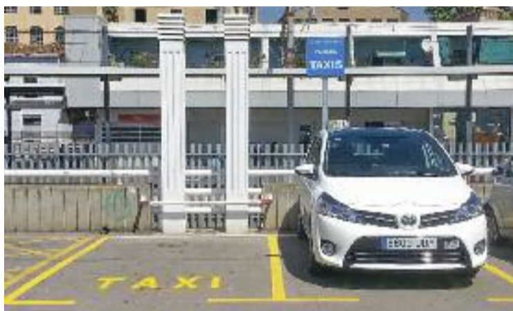
Un taxi a l'estació del Masnou en una imatge d'arxiu.

Segons informa el consistori encapçalat per Jaume Oliveras en un comunicat, l'objectiu principal d'aquest servei públic és poder garantir el "dret a la mobilitat" d'aquests col·lectius, complementant d'aquesta manera la xarxa de transport públic ja existent i facilitant l'accés a determinats serveis i equipaments locals. El preu de cada trajecte és de dos euros i el nombre màxim de desplaçaments per trimestre i any dels usuaris s'establirà en funció de la situació personal del client, que haurà de reservar el vehicle amb antelació el dia anterior a través d'una trucada telefònica.