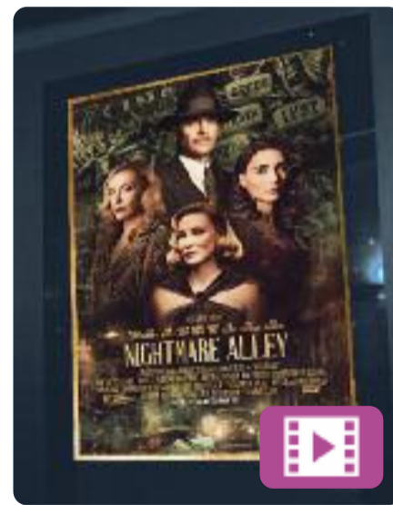
El callejón de las almas perdidas Guillermo del Toro

Guillermo del Toro presenta aquest re-make de la pel·lícula de 1947 El callejón de las almas perdidas , en què Bradley Cooper es posa a la pell d'un home ambició, amb talent per a la manipulació i l'engany. El protagonista coneix una pitonissa tan perillosa com ell, interpretada per Cate Blanchett, que es convertirà en la seva aliada per estafar milionaris.