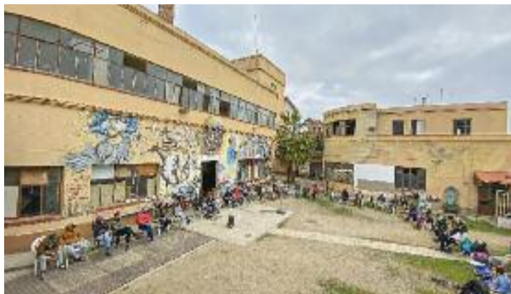
El pati interior de l'antiga fàbrica de Can Sanpere.

Aquest quart intent de desallotjar el recinte -els tres anteriors es van poder aturar- arriba després que els grups municipals aprovessin en el Ple de desembre la inclusió d'una partida de més de dos milions d'euros per fer efectiva la llargament reclamada expropiació. En aquest sentit, malgrat que tant els col·lectius com el govern local aposten per adquirir l'espai per destinar-lo a usos públics, les dues parts dife-