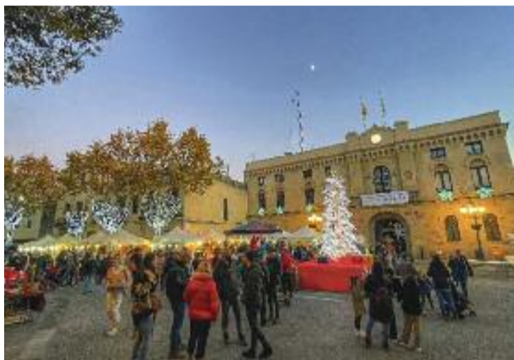
Vilassar de Dalt, un dels municipis amb més PIB per càpita.

Malgrat aquesta diferència considerable, el PIB per càpita va augmentar respecte a les últimes