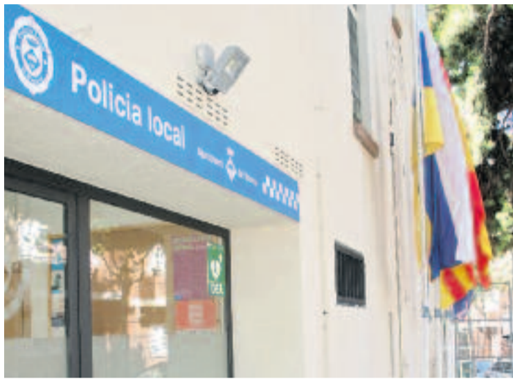
Policia local d'el Masnou.

D'altra banda, la sinistralitat viària ha augmentat un 6,5%,