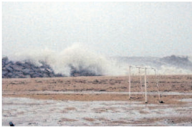
Impacte del temporal a la costa maresmenca el passat gener.

La pèrdua de 30.100 metres quadrats de sorra a les platges del Barcelonès Nord i el Baix Maresme suposa el 13% del seu total en quatre anys. L'última campanya batimètrica del litoral