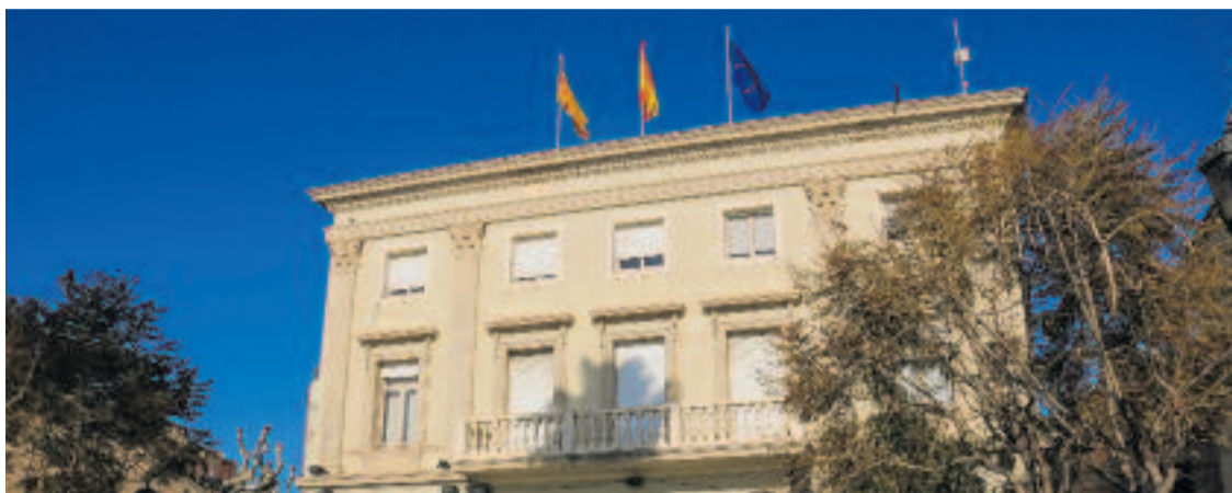
L'Ajuntament de Vilassar de Mar viu moments convulsos.

Per la seva part, Junts -que des del gener governa amb nou regidors- ha expressat la seva "profunda disconformitat i profund rebuig" a la moció de censura. Asseguren que d'ençà de les eleccions municipals Vilassar "ha avançat com feia anys que no avançava" i acusa les esquerres de fer un "pacte de perdedors". Els juntaires auguren que l'acord per fer fora Martínez