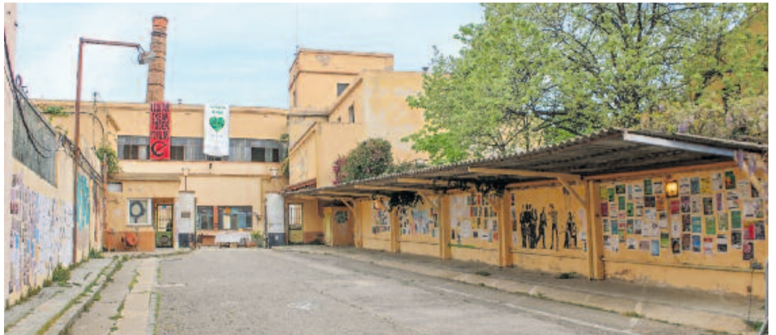
Entrada de l'antiga fàbrica, ara guanyada pel veïnat.

L'incompliment dels terminis és, precisament, una de les principals preocupacions de Can Sanpere. Fins ara, avisen, les primeres previsions van amb retard. "L'any passat ens van dir que potser podríem accedir a espais externs cap al juny o juliol, però no va ser