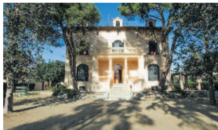
Imatge de l'Alberg de Xanascats al Masnou.

El turisme juvenil també ha tingut un pes important, amb grups organitzats per entitats socials i culturals. A més, el 9% de les pernотacions han estat de turistes individuals. Aquest 2025 la Xanascats rebrà 6,6 milions d'euros dels fons Next Generation per millorar en sostenibilitat.