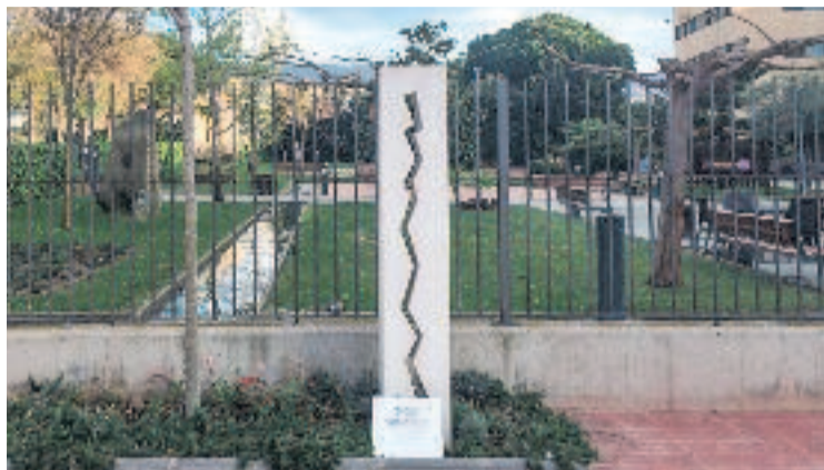
Memorial davant de la residència en record de les víctimes.

Aquesta notícia arriba precisament en el cinquè aniversari del decret d'estat d'alarma