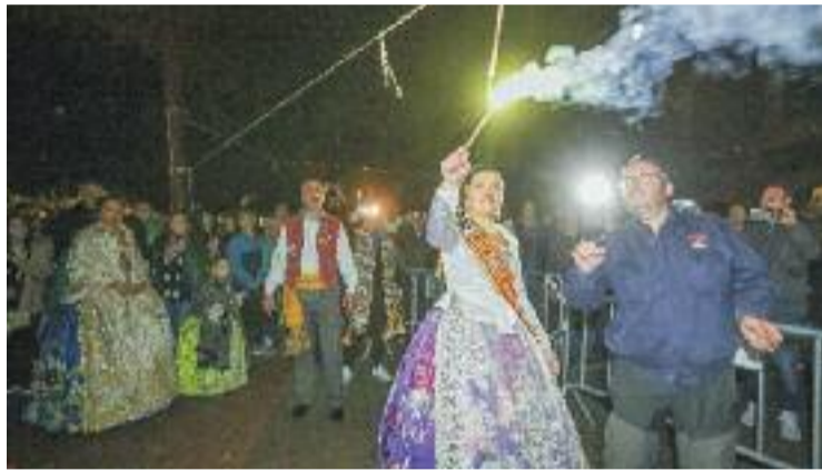
Les Falles volen recuperar el pols d'edicions anteriors.

L'edició d'aquest any és molt especial. I no només perquè suposa la tornada a la normalitat després de dos anys de pandèmia, sinó també perquè se servirà per celebrar el 25è aniversari de la desfilada de Moros i Cristians. Aquesta activitat tindrà lloc dissabte 2 d'abril a partir de les set de la tarda, i recorrerà els carrers de la ciutat, des de la Ram-