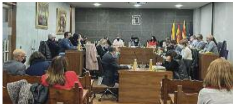
El govern diu que aviat presentarà els comptes al Ple.