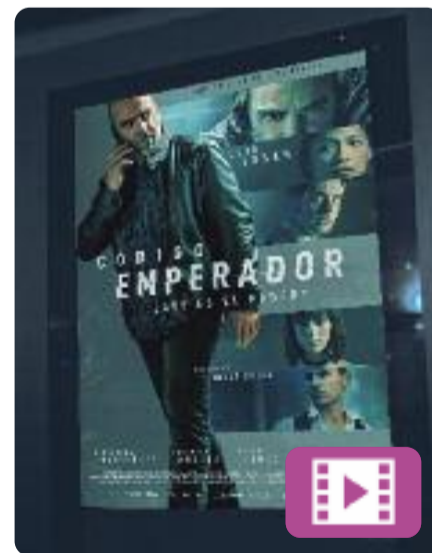
Código Emperador Jorge Coira

El Juan treballa per als serveis secrets. Per tal de tenir accés al xalet d'una parella implicada en el tràfic d'armes, s'acosta a la Wendy, l'assistenta filipina que viu a la casa, i estableix amb ella una relació complexa. En paral·lel, fa altres feines "no oficials" per protegir els interessos de les elits del país, que ara volen que busqui o, si cal, que s'inventi els draps bruts d'un polític.