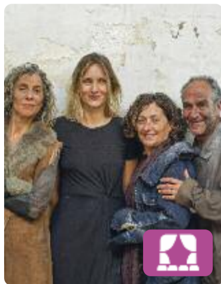
Els nostres fills Lucy Kirkwood

Una parella de físics nuclears ja jubilats, després de la catàstrofe ocasionada per un terratrèmol a la central nuclear on treballaven, abandonen la seva casa per refugiar-se en una petita cabana situada a 15 o 20 km de la zona prohibida. El seu nou dia a dia es veurà alterat per l'arribada d'una antiga companya de feina. Al teatre Akadèmia de Barcelona.