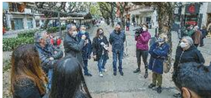
Presentació del projecte 'in situ'.

URBANISME ▶ Les obres de reforma de la Rambla Modolell arrencaran a la tardor. Els canvis que s'hi introduiran tenen a veure amb la pacificació de la zona, la restricció del trànsit de vehicles només a veïns, mercaderies i guals i la creació de plataforma única "per donar tot el protagonisme als vianants".