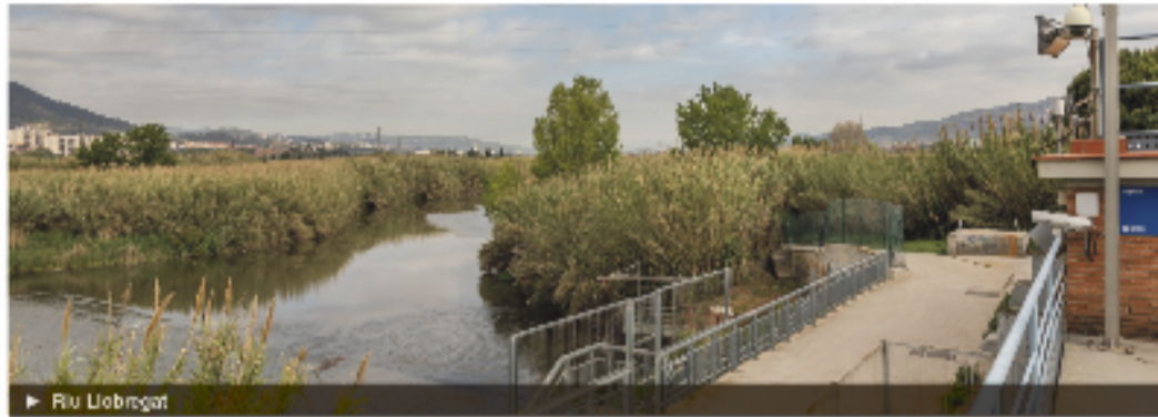
► Riu Llobregat

L'escalfament global, la capacitat limitada dels rius i els aqüífers, junt amb l'increment de la demanda d'aigua per l'augment de la població, dibuixen un escenari de gran estrès hídric que requereix respostes urgents a l'alçada de la planta potabilitzadora de Sant Joan Despí. L'Agència Catalana de l'Aigua (ACA) ha activat la prealerta per sequera a la regió de Barcelona i es podrien començar a decretar