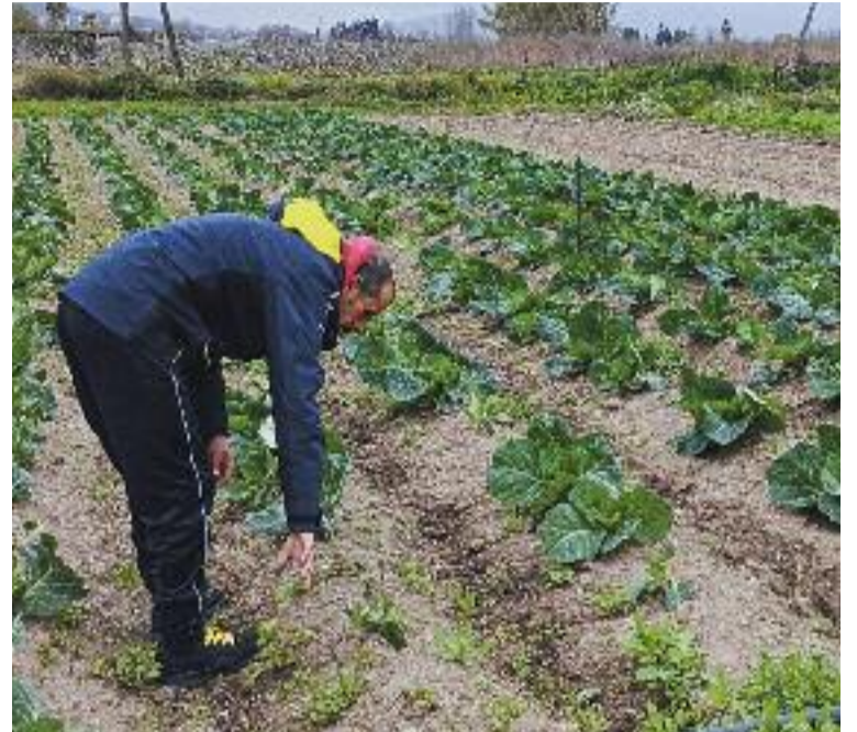
El manca de relleu i la pressió urbanística ofeguen el sector agrari al Baix Llobregat.

prenen per què cada cop menys gent jove vol treballar la terra.