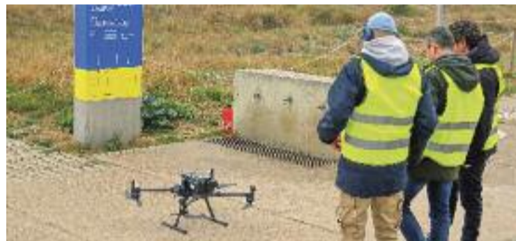
Castelldefels ha acollit una prova pionera.

TECNOLOGIA ▶ La platja de Castelldefels va acollir a principis de mes una demostració a gran escala de vols de drons per simular operacions logístiques de transport de paqueteria, la primera d'aquestes característiques que s'ha celebrat a Catalunya.