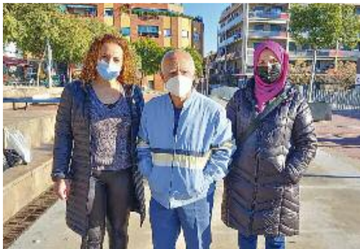
Integrants del programa A-Porta a Viladecans.

El perfil majoritari de les persones ateses pels picaportes és el d'una dona de 56 anys de mitja-