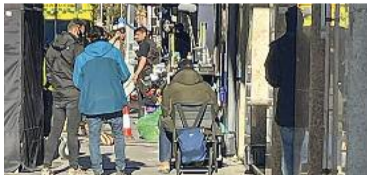
Una imatge del set de gravació a la Rambla.

CINEMA ▶ Gavà es va convertir fa pocs dies en l'escenari del rodatge d'una pel·lícula de ciència-ficció protagonitzada per l'actor Mario Casas, al qual se'l va poder veure interpretant el seu paper a la Rambla el passat 7 de febrer.