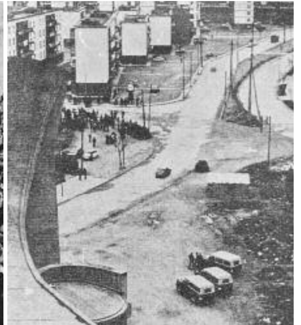
La vaga de la fàbrica Roca va començar el novembre del 1976 i no va finalitzar fins al febrer del 1977.

damos, que repassa el cas de l'assassinat de Pedro Álvarez presumptament a mans d'un policia a l'Hospitalet.