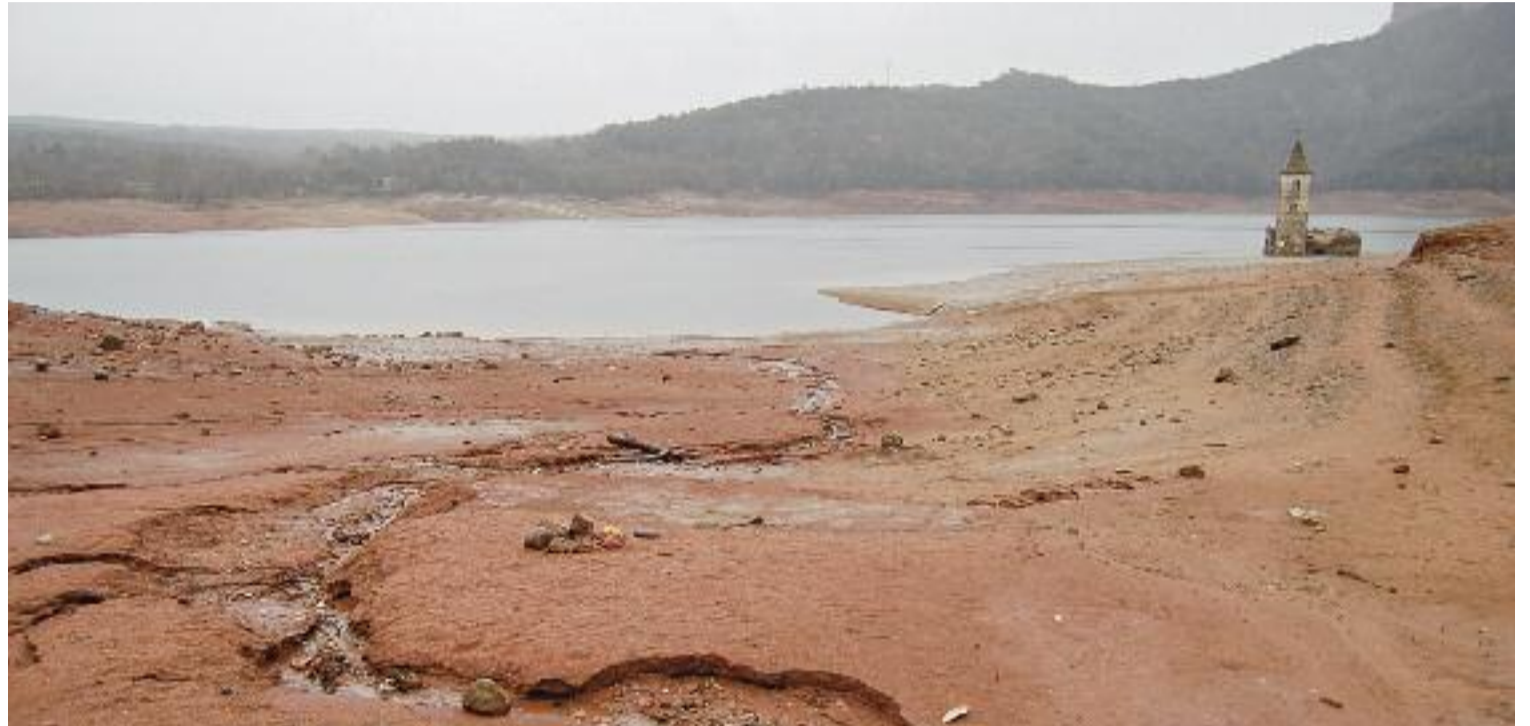
Els episodis de sequera que viu Catalunya des de fa 10 anys deixen imatges esfereïdores, com aquesta de l'embassament de Sau.

Sigui com sigui, la mateixa ACA reconeix que, en el context de crisi climàtica, els episodis de sequera són més recurrents. En una dècada se n'han viscut pràcticament cada any, i des de Brus-