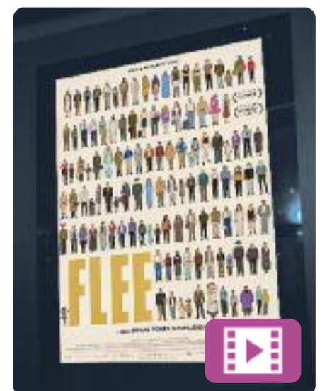
Flee Jonas Poher Rasmussen

Flee ha fet història als Oscars ja abans de la gala, que se celebrarà el 27 de març: l'han nominat alhora a les categories de pel·lícula documental, pel·lícula d'animació i pel·lícula internacional. Aquest film danès, estrenat amb èxit al Festival de Cinema de Sundance, explica la història d'un refugiad afganès homosexual que va haver de fugir del seu país.