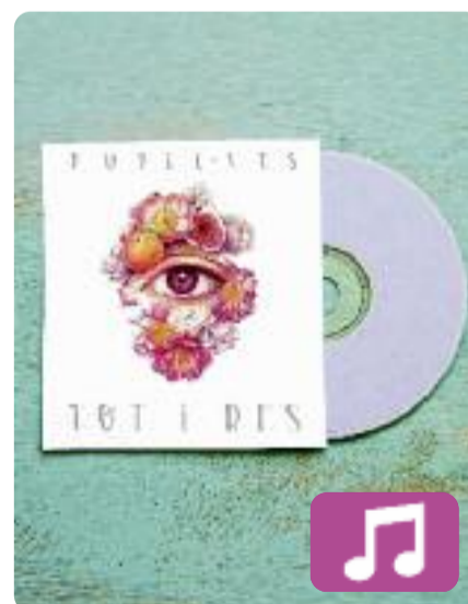
Tot i res Pupil·les

Amor, optimisme i alegria són tres ingredients molt presents al nou àlbum de Pupil·les, Tot i res (Halley Records). El segon disc d'aquestes dues valencianes homenatja el poeta Joan Vinyoli amb el títol i aplega una desena de cançons que s'allunyen una mica del rap més dur que feien abans, i s'inclinen per melodies i ritmes més festius.