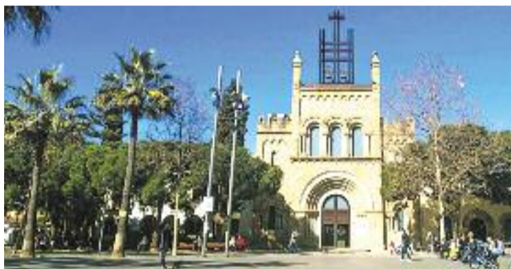
La parròquia de Santa Maria de Castelldefels.

L'home respon a les sigles J. M. A. M., és prevere extradiocesà i, segons va publicar El Periódico, ja havia estat investigat per pederastia al Berguedà. Després de la seva detenció a la ciutat, els Mossos van escorcollar el seu domicili en el marc de les diligències prèvies en curs per un presumpte delictes relacionat amb conductes impròpies amb menors. En conèixer aquests fets, el bisbat va posar en marxa els protocols propis per abordar