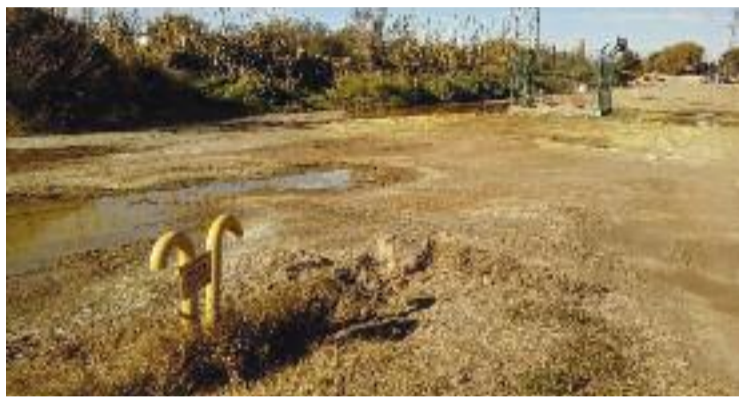
Una de les zones contaminades amb cromites.