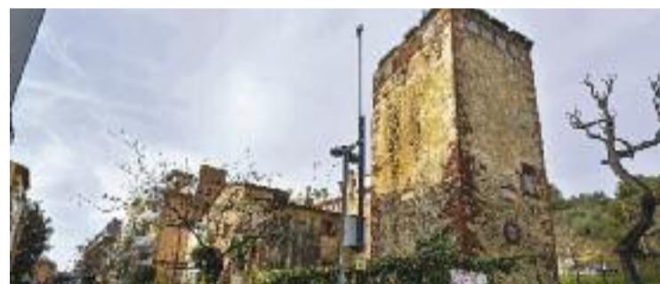
Torre de Cal Garrofer.