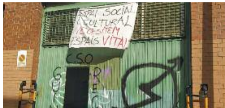
Una imatge de l'entrada a la nau okupada.

MOVIMENTS SOCIALS ▶ Aquest mes s'ha fet pública una nova okupació en una nau del carrer Vallès, número 61. L'espai ha estat batejat pels impulsors com a Centre Social Ocupat (CSO) Guinarecords, atès que bona part són músics, segons informa el portal A l'aguait. De fet, la nau estaria sent condicionada des de fa un parell de mesos.