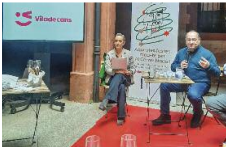
Presentació del nou festival d'hivern

D'aquesta manera, el festival presentarà propostes de teatre, màgia, acrobàcies, malabars, pallassos, música i cercaviles. De fet, durant els quatre dies d'espectacle se celebraran fins a una trentena d'actuacions de 20 companyies diferents. Pel que fa als escenaris, el festival oferirà les