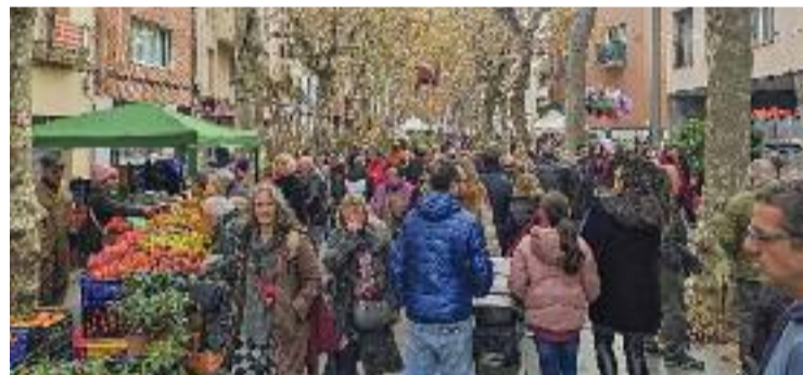
Milers de persones van omplir els carrers.

MOSTRA ▶ Tres anys després de l'última edició sense covid, la Fira de la Puríssima de Sant Boi va tornar a mostrar tot el seu potencial i a recuperar la total presencialitat que les mesures sanitàries havien eliminat. D'aquesta manera, milers de santboians van sortir del 6 al 8 de desembre per gaudir d'una de les mostres més importants del calendari local i comarcal, atès que sempre rep la visita de veïns de les poblacions de la vora.