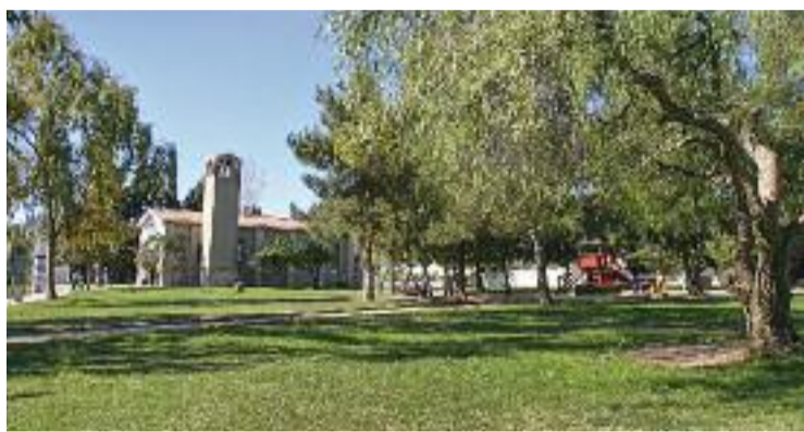
Els jardins de Santa Eulàlia seran a dins de l'eix Bellamar.

En aquesta línia es mouen diversos col·lectius veïnals i ecologistes, que consideren que el projecte no és precisament respectuós amb el medi ambient. Sense anar més lluny, la plataforma 6 Eixos de Ciment demana la paralització d'aquest planejament. De fet, denuncien que aquest pla