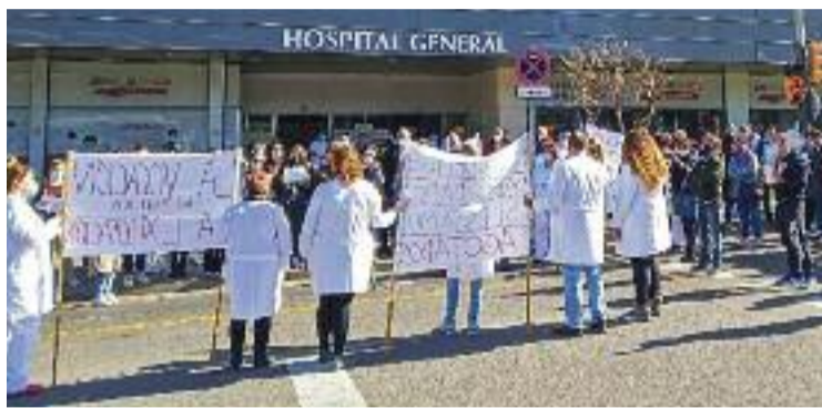
Els treballadors sanitaris protesten a l'exterior de l'hospital.

En aquesta línia, el sindicat d'infermeria SATSE ha alertat de manca de professionals a les urgències de l'Hospital de Sant Boi. En un altre comunicat, el sindicat mèdic coincideix amb la diagnòsi i demana més infer-