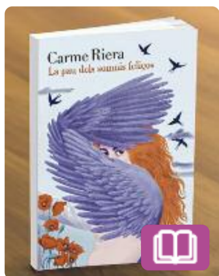
La pau dels somnis felços Carme Riera