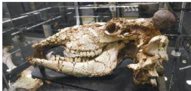
El crani pertany a un ur, un bòvid ja extingit.

HISTÒRIA ▶ Té 150.000 anys d'antiguitat i pertany al cap d'un ur, un bòvid actualment desaparegut que va viure a la zona de Ca n'Aimeric fa 1.500 segles i que és una de les principals troballes del jaciment arqueològic que es pot visitar a l' Espai Prehistòria. Fauna, canvi climàtic i arqueologia al Garraf , que està ubicat a la sala Margarida Xirgu de la biblioteca Ramon Fernández Jurado.