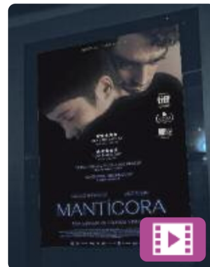
Mantícora Carlos Vermut

En Julián és un noi d'uns 20 anys molt exitós com a dissenyador de videojocs. Malgrat això, viu turmentat per un secret fosc. Però quan la Diana apareix a la seva vida, en Julián veurà per fi a prop la possibilitat de ser feliç. La nova pel·lícula de Carlos Vermut, de coproducció catalana, ha arribat als cinemes després de passar pel Festival de Sevilla.