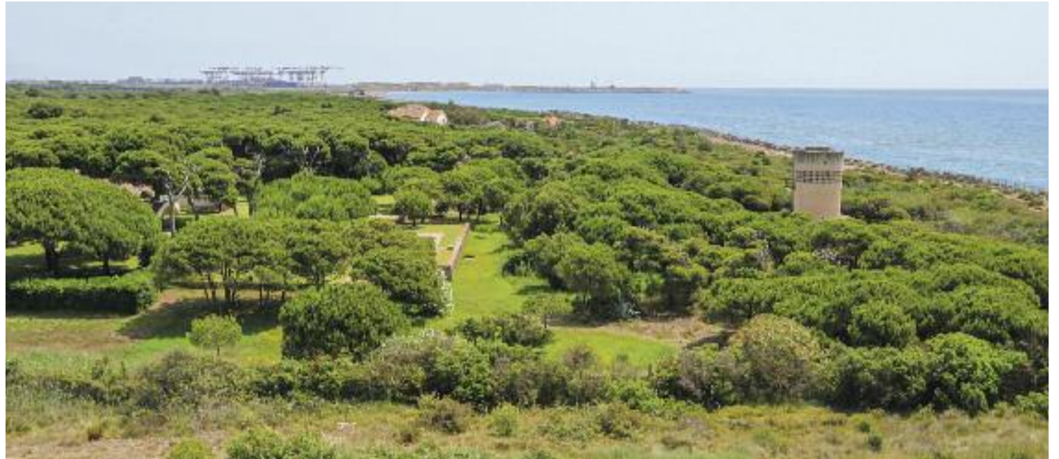
Finca de la Ricarda del Prat, un dels espais naturals més preuats del territori.

Fonts de l'AMB consultades per aquesta publicació han confirmat que es començarà a efec-