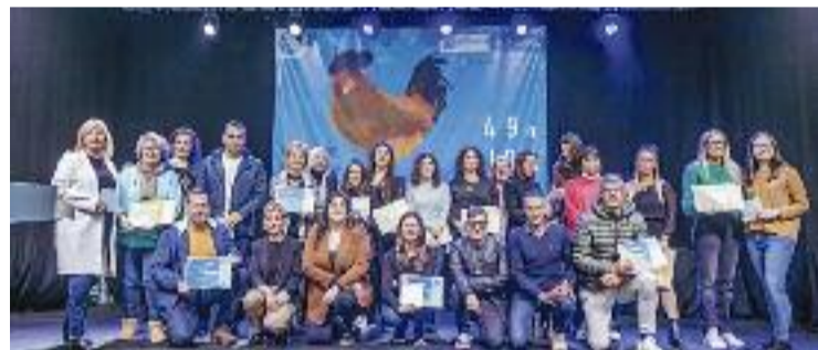
Acte d'homenatge als comerços històrics de la ciutat.

MOSTRA ▶ La Fira Avícola del Prat, que es va celebrar del 2 al 4 de desembre, va recuperar xifres anteriors a la pandèmia. I és que l'edició d'enguany va tancar amb una assistència de prop de 70.000 persones, 10.000 més que l'any passat. A més, la fira no va perdre pistonada entre els assistents, ja que un de cada quatre provenien d'uns altres municipis. D'aquesta manera, es va esvaïr la principal por d'aquesta edició, que era l'avançament de la mostra per celebrar-la abans del pont de la Puríssima, a petició dels hostalers.