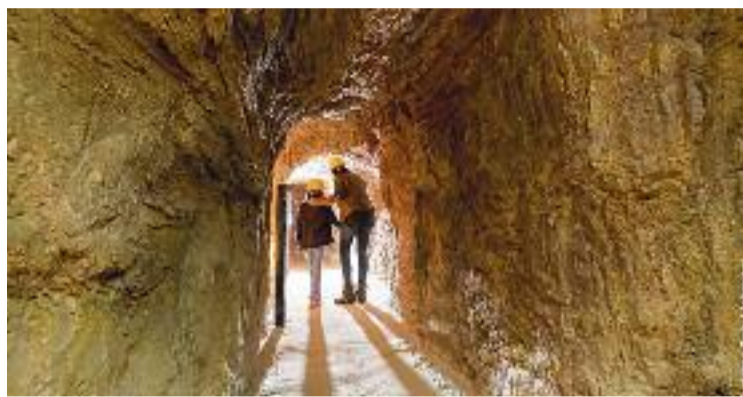
Les mines tenen un gran atractiu patrimonial.

Ara, el parc vol promocionar-se per recuperar el ritme de visitants d'abans de la pandèmia i donar-se a conèixer entre el gran públic, tant el de dins de l'Estat com el de l'estranger. I és que les Mines de Gavà són les més antigues d'Europa i les úniques dedicades a l'extracció de variscita, mineral amb el qual s'elaboraven ornaments. "Pel valor arqueològic que tenen es mereixen un major reconeixement internacional", lamenta en declaracions