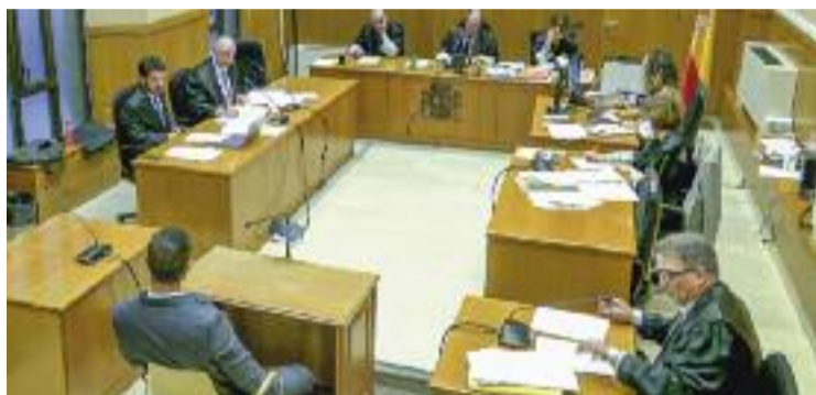
L'acusat durant la seva declaració davant del tribunal.

Els fets es remunten a l'agost del 2020, quan la víctima era