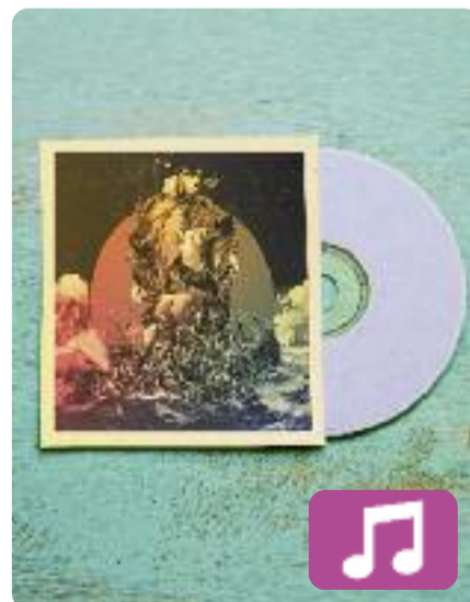
La Balsa de la Medusa Los Aurora

El grup Los Aurora ha tornat aquest desembre amb la publicació del seu segon disc: La Balsa de la Medusa (autoeditat). El nou àlbum inclou poemes de diversos autors que han musicat els mateixos Aurora, tal com han explicat a l'ACN. Això suposa un canvi respecte al primer disc, Aurora (Taller de Músics/Discmedi, 2017), en què versionaven cançons ja creades.