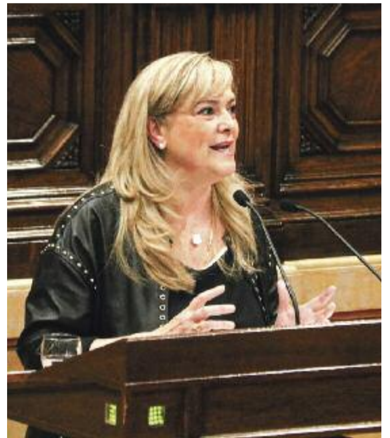
La consellera de Drets Socials, Violant Cervera.

"En pandèmia hi ha hagut una moratòria de desnonaments, però si aquesta moratòria acaba al setembre, pot afectar 4.500 famílies. La nostra prioritat és poder aconseguir habitatges, a curt, mitjà i llarg termini", afegeix Cervera.