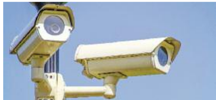
La ubicació de les càmeres està encara per decidir.

SEGURETAT ▶ L'Ajuntament instal·larà càmeres de seguretat a diversos punts de la ciutat. Així ho va anunciar l'alcalde, Lluís Mijoler, durant una trobada amb veïns de Sant Cosme a mitjans de mes. De fet, el batlle va aprofitar la petició d'una veïna, que es preguntava si no podrien instal·lar càmeres de videovigilància, per anunciar que el govern municipal està estudiant els llocs concrets on col·locar-les.