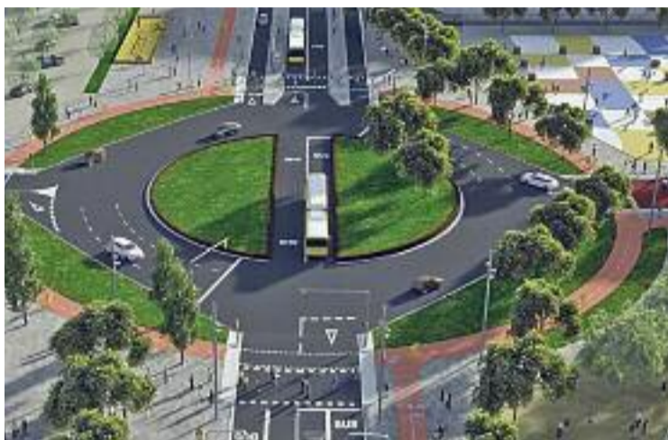
Una imatge virtual de com quedarà la C-245.

De moment hi ha trams finalitzats, com ara el que va des del carrer Doctor Ferran fins a la plaça Pau Casals. Tanmateix,