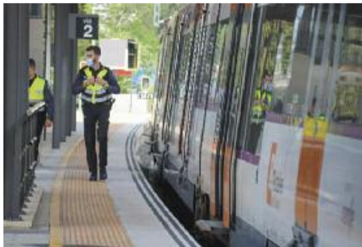
El Metro del Delta ajudaria a reduir el trànsit cap a Barcelona.