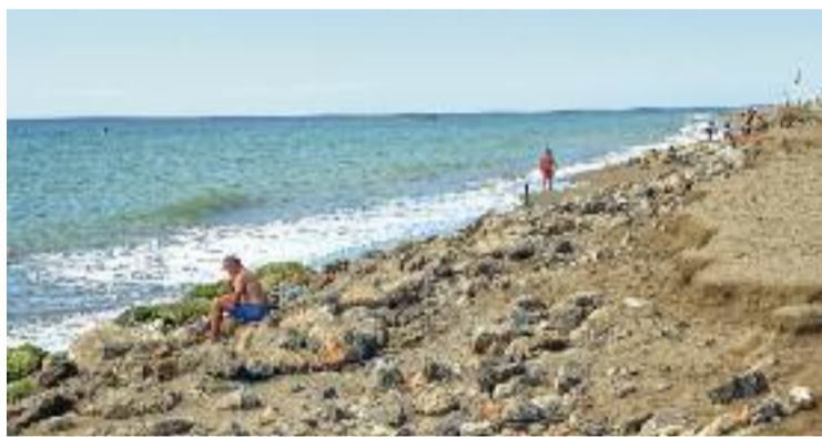
La manca de sorra fa perillar la temporada de bany al Prat.