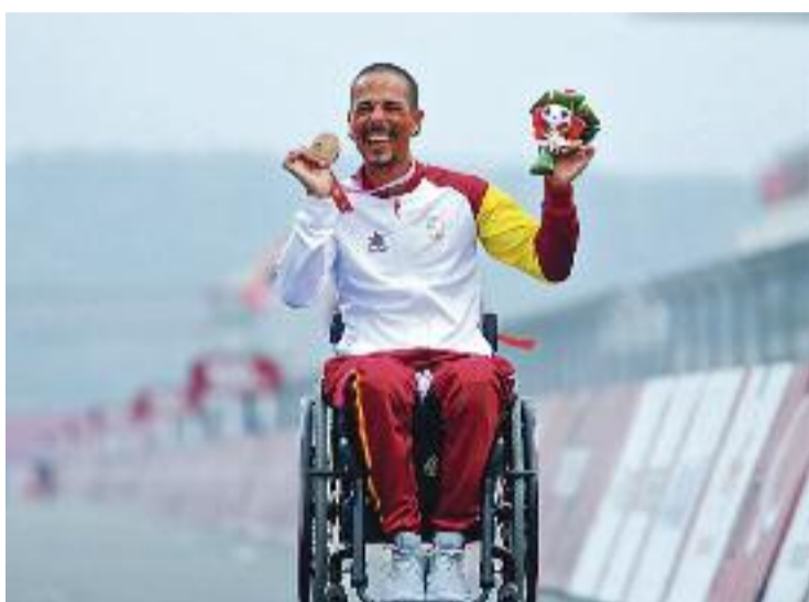
Sergio Garrote amb el bronze als Jocs de Tòquio.

Des de fora sovint es contempla els i les esportistes com a persones. Garrote vol reflexionar sobre aquesta perspectiva: "L'esportista no només es nodreix del treball que faci, en el meu cas a la bicicleta, sinó també fora d'ella. L'esport és un cicle de la meua vida. Potser guanyaré medalles fins que la competició m'ho permeti. Després continuaré tenint la família, que és el més important".