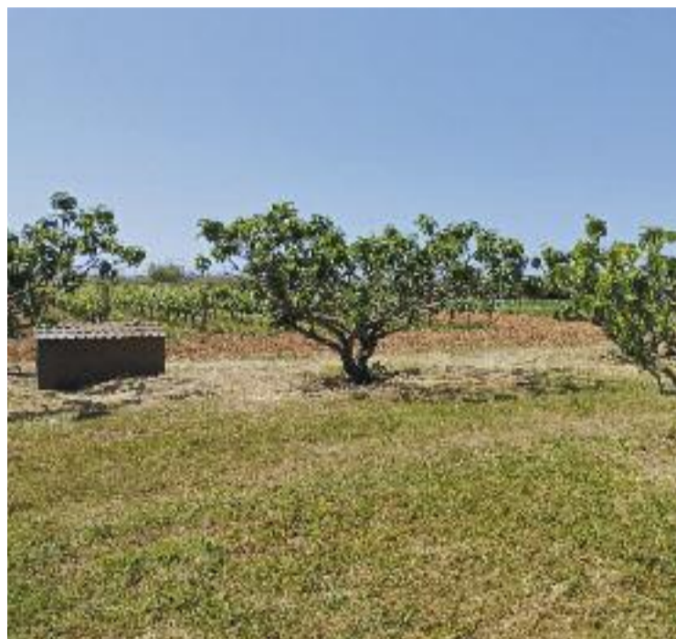
Presentació del projecte de 'hub' agrari a l'Agròpolis (esquerra) i camps de conreu del Parc Agrari (dreta).

situació actual del Parc Agrari i de la pagesia. "El model agrícola està esgotat", va assegurar Tovar. Badia, per la seva banda, va recordar que hi ha un greu problema de relleu generacional a la professió –tal com va explicar Línia Mar en un reportatge del març– i que la pagesia de la comarca pateix una "manca d'inversions necessàries" per convertir el Parc Agrari en un pol competitiu.