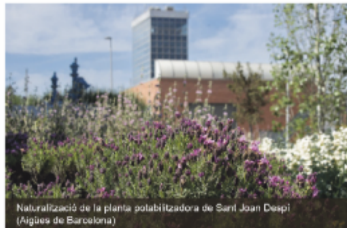
Naturalització de la planta potabilitzadora de Sant Joan Despí (Aigües de Barcelona)

La companyia té definit un full de ruta per assolir la neutralitat climàtica (emissions de gasos d'efecte hivernacle netes iguals o inferiors a zero) abans del 2050. Per a això, promou l'eficiència energètica i la implantació de plaques solars i pèrgoles fotovoltaïques a les seves instal·lacions. També aposta per la producció de biogàs a les seves depuradores mitjançant la valorització dels fangs (un residu ric en matèria orgànica). El 2021 va aconseguir produir així 11.673.328 kWh d'energia tèrmica en tres de les seves depuradores, que a més van utilitzar tots els seus processos per generar 21.026.593 kWh d'energia