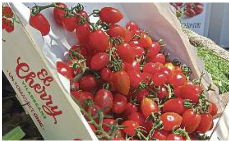
Els tomàquets es vendran sota una marca local.

La voluntat és que es comercialitzi sota la marca de Vi-