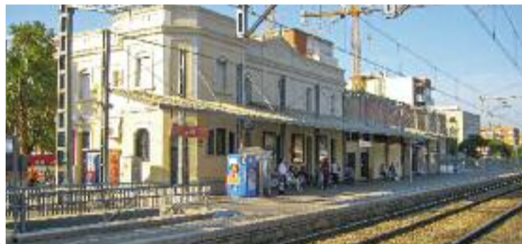
L'estació de Castelldefels reformarà aviat.