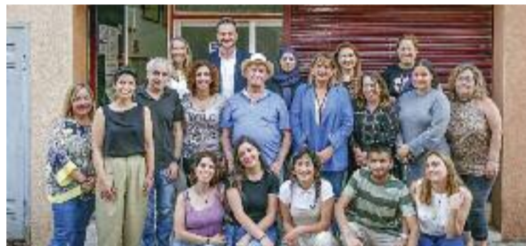
L'equip de picaportes i col·laboradors del programa.

CONVIVÈNCIA ▶ El programa de suport mutu veïnal de la Confederació d'Associacions Veïnals de Catalunya (CONFAVC), l'A-Porta, ha fet balanç de la seva actuació als barris d'Ausiàs March i Ca n'Espinós. En total, els picaportes –els veïns que han ofert suport als seus conciutadans porta a porta–, han arribat a 500 llars d'aquests dos barris, a més de fer 328 entrevistes que han permès fer una radiografia de les principals preocupacions i necessitats d'aquests dues.