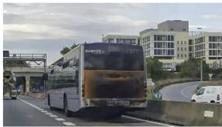
Un autobús de les línies del Baix avariament a Bellvitge.

Per tot plegat, reclamen a l'Àrea Metropolitana de Barcelona (AMB) que retiri els busos més antics. Sobre aquesta qüestió, fonts de l'AMB recorden que els busos nous s'estan fabricant i que donaran una solució definitiva a les incidències, que segons l'ens no són extraordinàries.