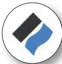
Port de Barcelona

El Port de Barcelona farà la seva aportació anual de sorra a les platges del Delta al juliol. Una acció per evitar la regressió del litoral que arribarà molt tard i que posa en perill la temporada de platja. El Port ho atribueix a un problema burocràtic.