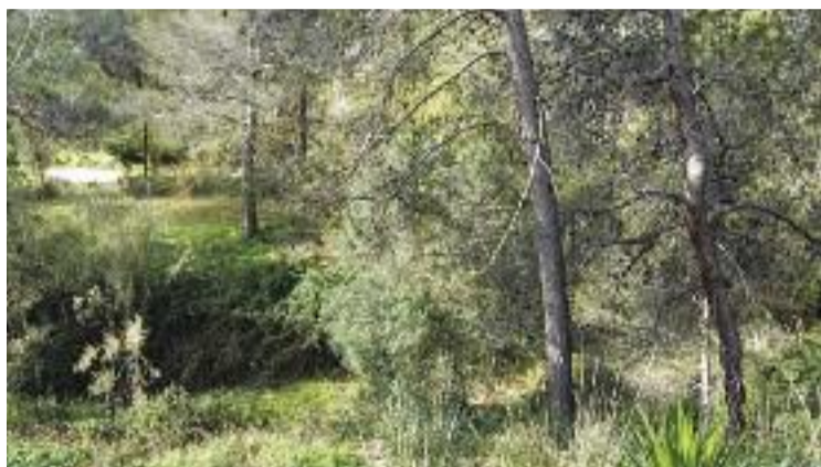
Un dels terrenys afectats per la permuta, a prop de la Riera.

Per la seva banda, l'alcaldeessa, Gemma Badia, defensa l'operació i al·lega que es vol preservar un espai natural. De fet, el projecte –que és de domini públic i està penjat al web municipal– proposa l'intercanvi de terrenys per poder variar-ne els usos i evitar construir a zones d'especial rellevància natural. "L'oposició no està tenint en compte l'interès natural", afirma