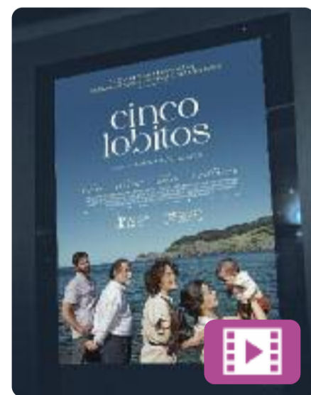
Cinco lobitos Alauda Ruiz de Azúa

L'Amaia (Laia Costa) acaba de ser mare i s'adona que no sap del tot com ser-ho. Quan la seva parella marxa unes setmanes per feina, decideix tornar a casa dels seus pares, a un poble de la costa basca, i així compartir la responsabilitat de tenir cura del nadó. El que no sap l'Amaia és que, encara que ara sigui mare, no deixarà de ser filla.