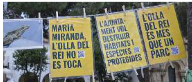
Alguns dels cartells de la marxa.

MEDI AMBIENT ▶ Malgrat el mal temps, desenes de veïns de la ciutat i de la resta de la comarca van participar en la bicicletada del passat 3 d'abril en defensa de l'espai natural de l'Olla del Rei que organitzava la plataforma ecologista del mateix nom.