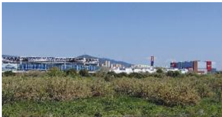
Els terrenys en disputa.

Sigui com sigui, el 2007 els dos ajuntaments i la Generalitat van acordar crear la Comunitat de Municipis de la Plana del Galet, a fi de gestionar-ne els serveis