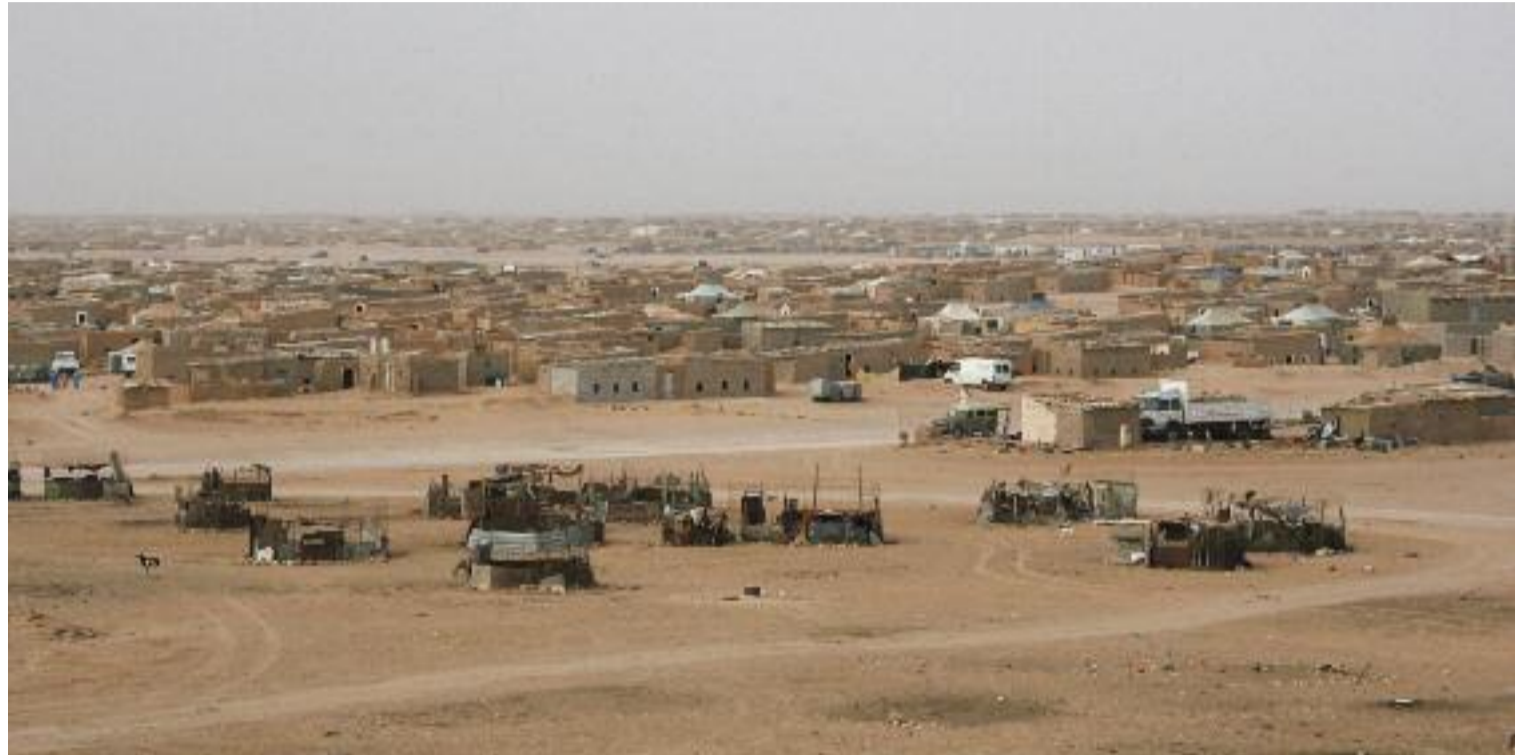
Els campaments de refugiats de Tinduf, un autèntic infern del qual els infants del Vacances en pau fugen dos mesos a l'estiu.

Aquest projecte està organitzat per la delegació del Front Polisari i compta amb la col·laboració de diverses entitats solidàries amb el poble sahrauí. Entre elles l'associació Castelldefels Sàhara i l'Associació Catalana d'Amics del Poble Sahrauí (ACAPS) de Gavà i Viladecans,