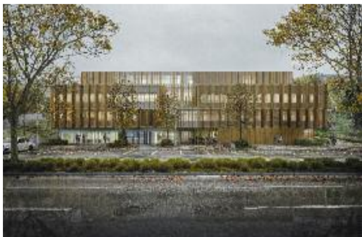
Recreació virtual de com serà el centre mèdic.

Sigui com sigui, l'edifici estarà ubicat a la confluència de l'avinguda Lluís Companys i el carrer Doctor Trueta, molt a prop del poliesportiu de Can Roca. Es tracta d'uns terrenys que el consistori ha cedit a la