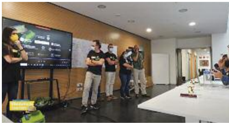
L'equip Happy Green durant la presentació de la seva app.