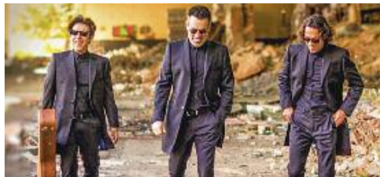
El trio de germans presenten 'Manhattan Tour' a la ciutat.

MÚSICA ▶ Els germans de Café Quijano van triomfar els primers anys del segle i des d'aleshores el seu característic estil i sonoritat tornen a escena amb Manhattan , el seu últim àlbum que presentaran el 30 d'abril a la nit a Àtrium.