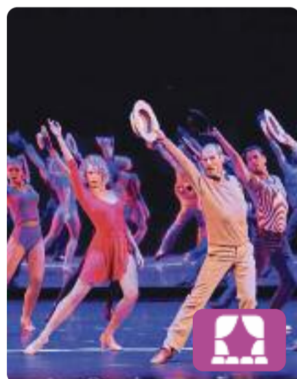
A Chorus Line Antonio Banderas

Un dels musicals més importants de tots els temps, inspirador, apassionant i amb un cos de ball espectacular. En un teatre buit, en un escenari nu, s'hi fa el càsting per a un nou musical de Broadway. Per a un grup de ballarins, és el moment de la seva vida, l'oportunitat per fer el que sempre havien somiat en gran: ballar. Al teatre Tívoli de Barcelona.