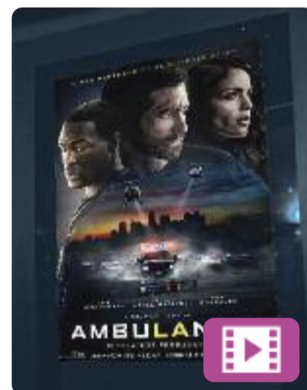
Ambulance Michael Bay

En un acte desesperat per aconseguir diners per pagar els deutes mèdics de la seva dona, el veterà Will Sharp recorre a l'única persona a la qual sap que no hauria de recórrer: el seu germà adoptiu Danny. Ell li oferirà participar en el robatori més gran de la història de la ciutat. Quan la fugida s'esguerra, tots dos segrestaran una ambulància que porta un policia ferit.