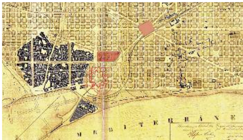
Dibuix de l'autor sobre el plànol de l'Eixample de Barcelona de 1859, d'Ildefons Cerdà. La Ciutadella militar i el parc actual, en línia vermella. La plaça de les Glòries inicial i l'actual, tramades.

El lloc que va escollir Balaguer, diferent del que tot hom coneix avui, no podia ser més oportú: el final del passeig de Sant Joan, davant de la Ciutadella militar, envoltada de bastions i separada de les muralles de la ciutat antiga. Es va projectar una plaça a tall de conquesta, en homenatge a totes les Glòries Cíviques i Militars de Catalunya, que, tanmateix, mai no es va construir. Després de la revolució de 1868, la Ciutadella va